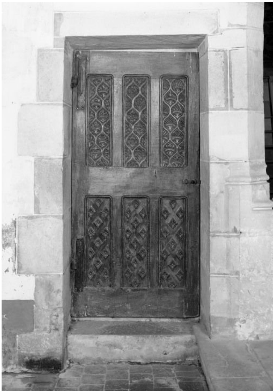
Vue côté chœur