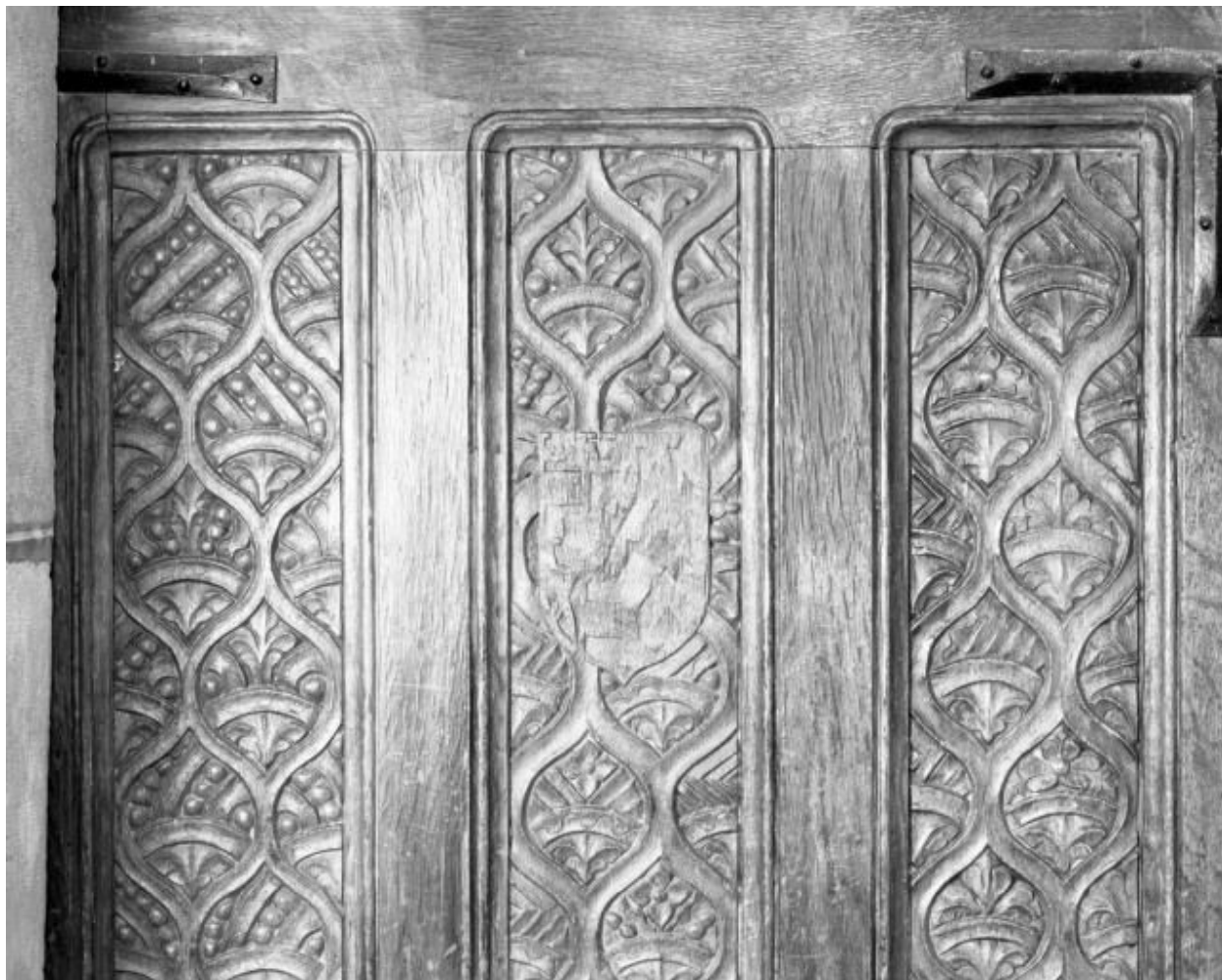
Détail côté chapelle