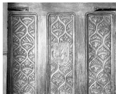
Détail côté chapelle IVR26_19852100514X