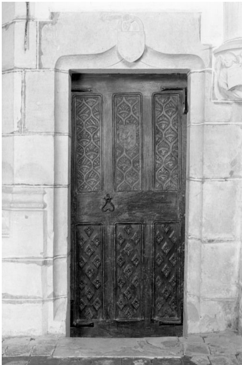
Vue côté chapelle