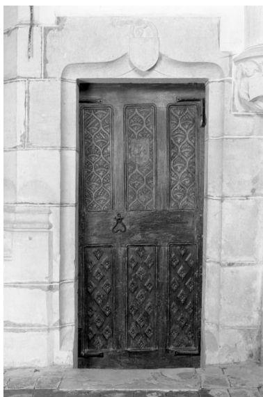
Vue côté chapelle IVR26_19852100513V