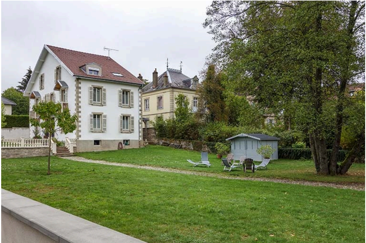
Vue depuis la rue.