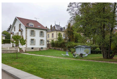
Vue depuis la rue. IVR43_20217000199NUC4A