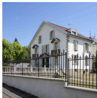
Vue depuis la rue. IVR43_20217000200NUC4A