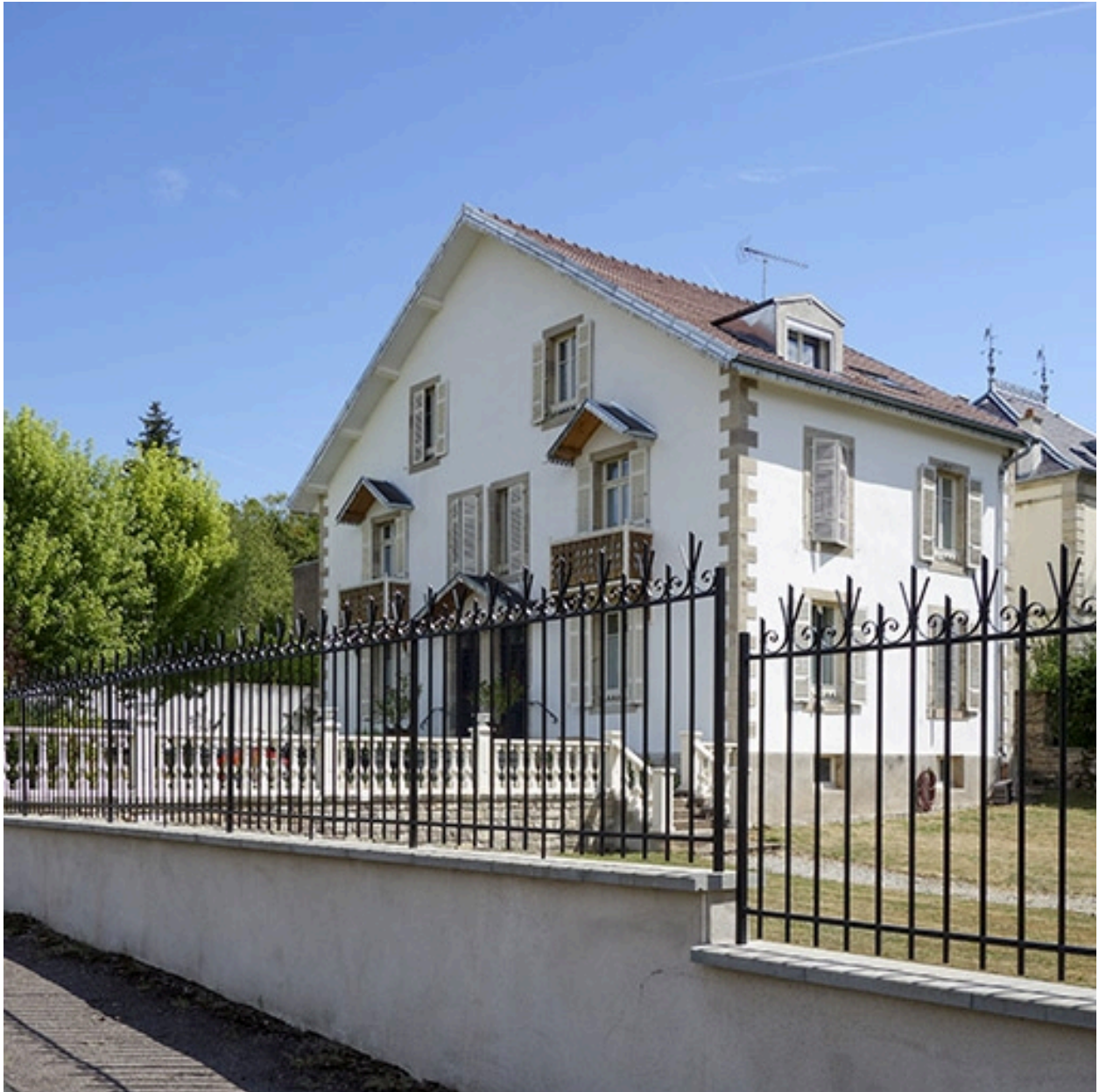
Vue depuis la rue.