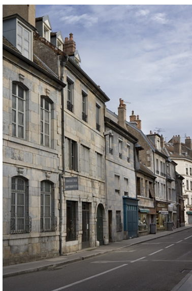
Vue d'ensemble de trois quarts gauche.