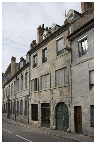
Vue d'ensemble de trois quarts droit.