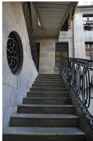
Détail de la première volée de l'escalier à cage ouverte. IVR43_20072500162NUCA