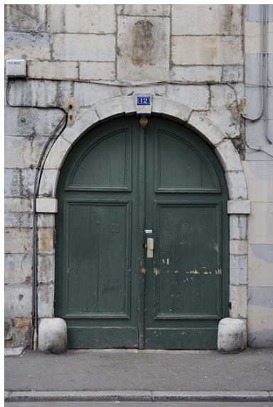
Détail du portail d'entrée. IVR43_20072500166NUCA