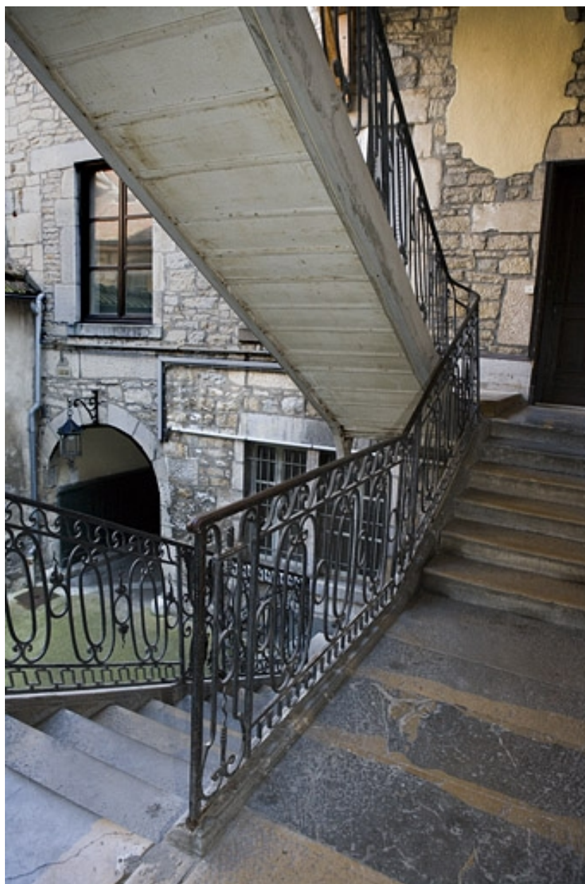
Vue d'ensemble de l'escalier à cage ouverte depuis le premier palier.