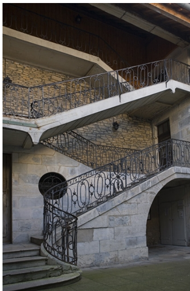
Vue d'ensemble de l'escalier à cage ouverte sur cour. IVR43_20072500159NUCA