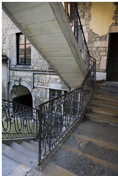
Vue d'ensemble de l'escalier à cage ouverte depuis le premier palier. IVR43_20072500161NUCA