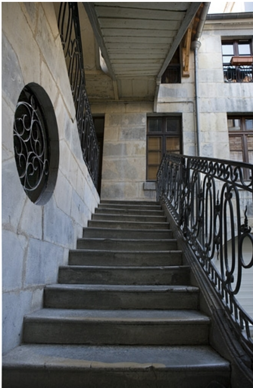
Détail de la première volée de l'escalier à cage ouverte.