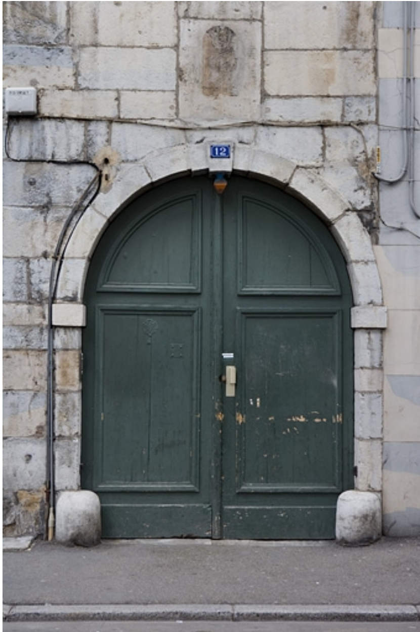
Détail du portail d'entrée.