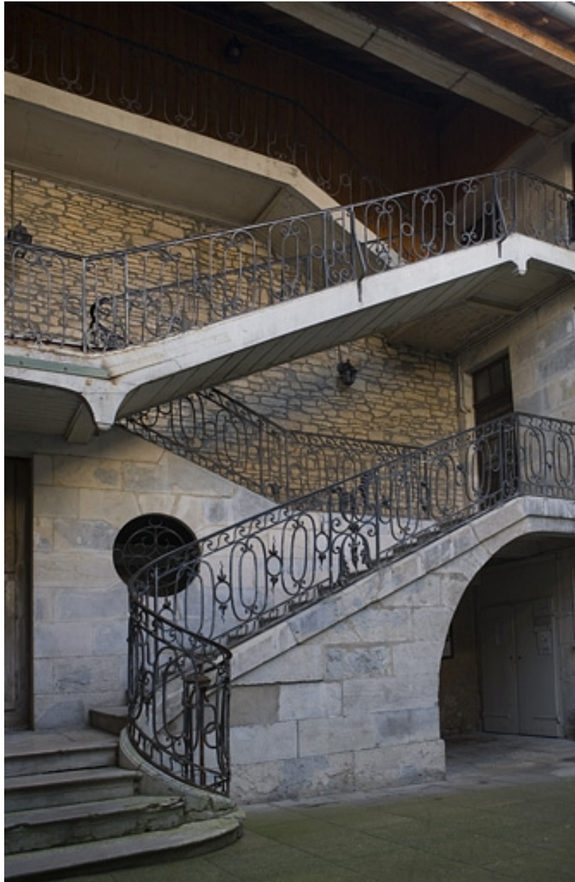
Vue d'ensemble de l'escalier à cage ouverte sur cour.