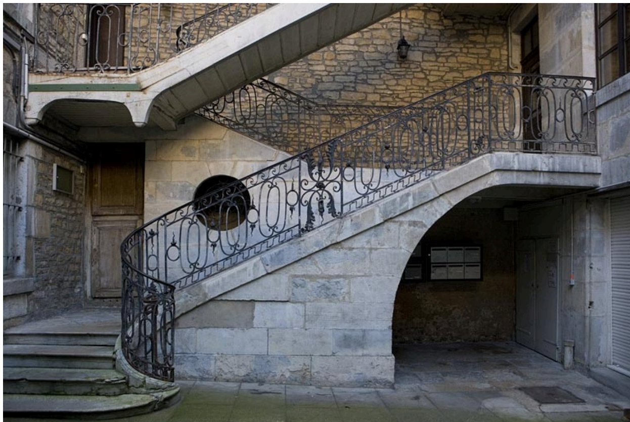
Détail de la première volée de l'escalier à cage ouverte depuis la cour.