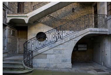
Détail de la première volée de l'escalier à cage ouverte depuis la cour.