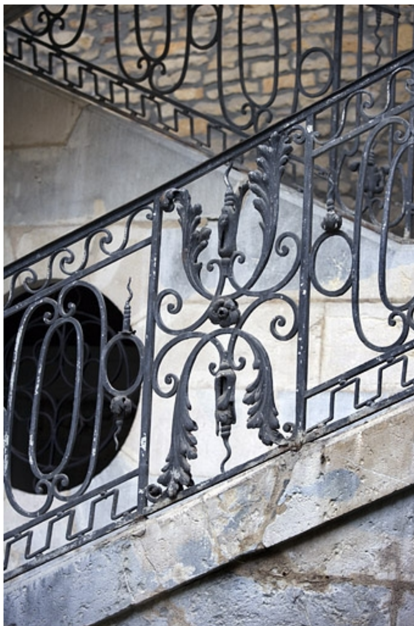
Détail d'une partie du décor de la rampe de l'escalier.