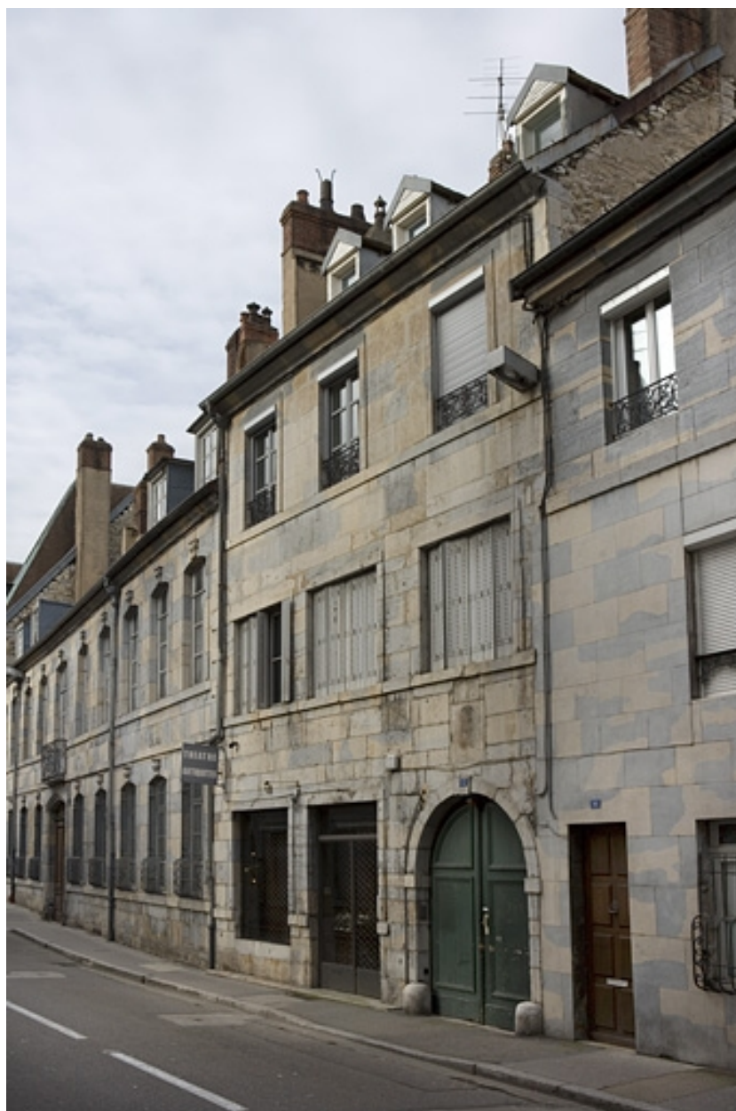
Vue d'ensemble de trois quarts droit.