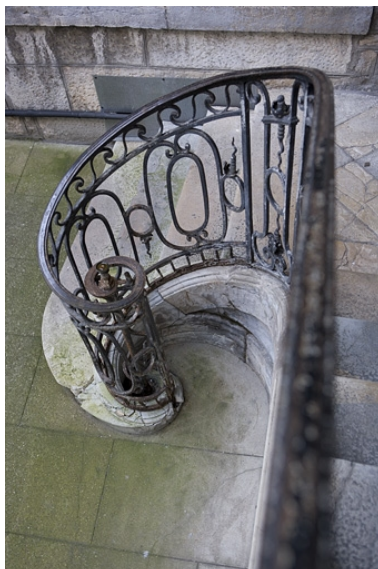
Détail du départ de la rampe en fer forgé de l'escalier à cage ouverte.