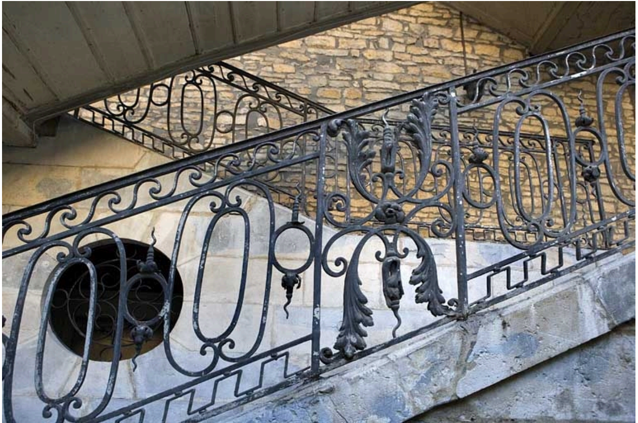
Détail de la rampe en fer forgé de l'escalier à cage ouverte.