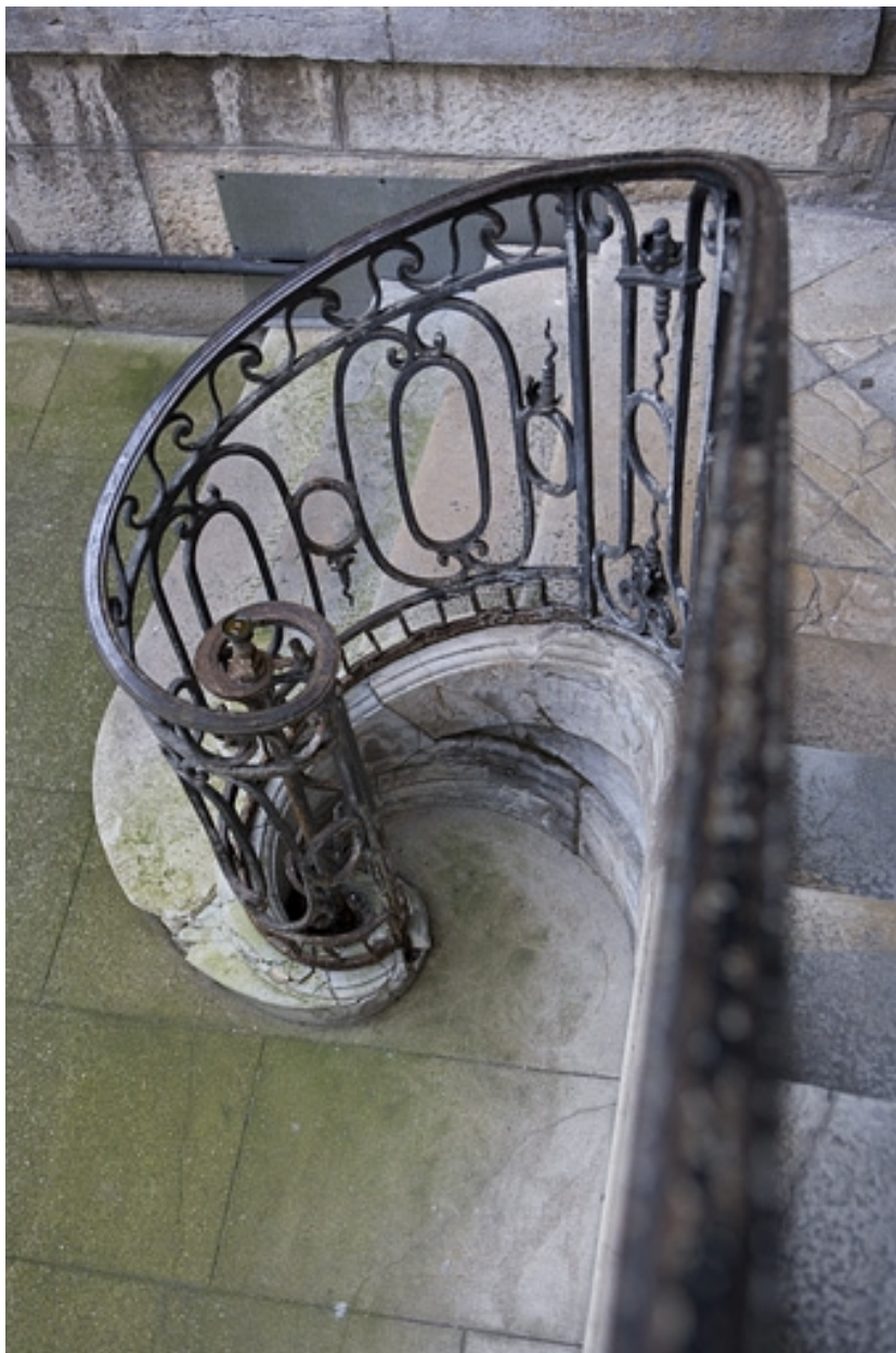
Détail du départ de la rampe en fer forgé de l'escalier à cage ouverte.