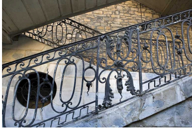
Détail de la rampe en fer forgé de l'escalier à cage ouverte. IVR43_20072500163NUCA