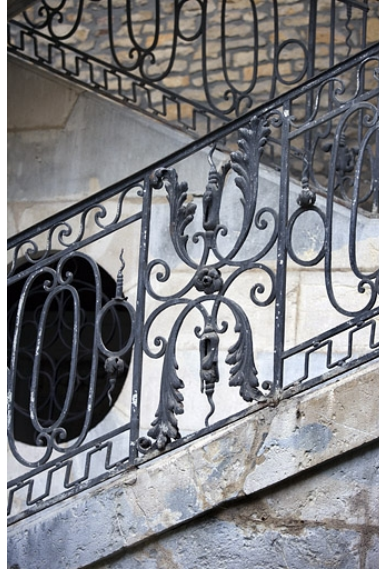
Détail d'une partie du décor de la rampe de l'escalier.