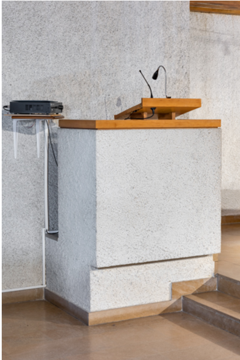
Vue de trois quarts.