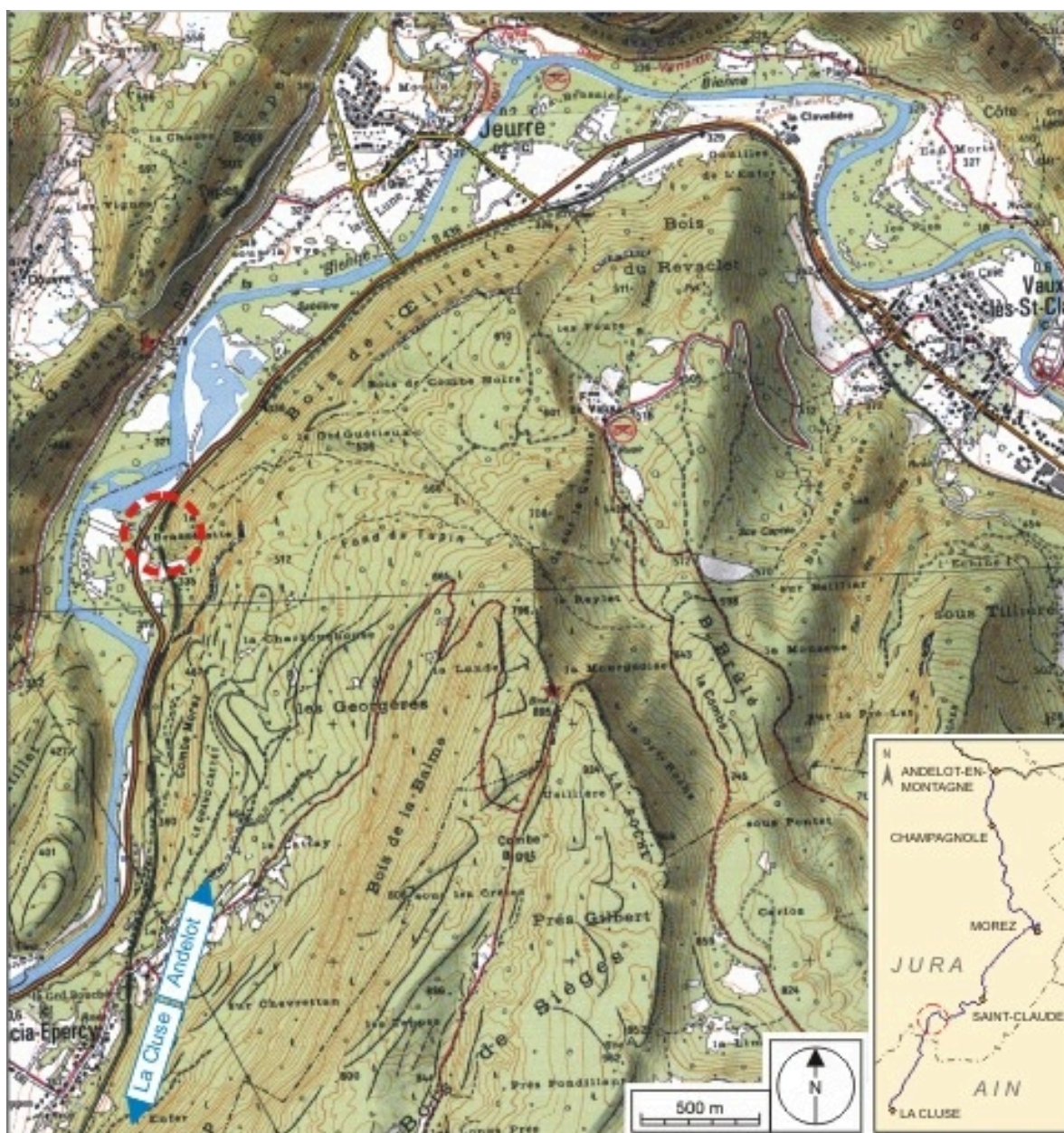
Carte et schéma de localisation. Carte topographique, IGN, 2000, dalles F085_052 et F086_052, échelle 1:25 000. Scan 25, licence n° 2008/CISE/2968.