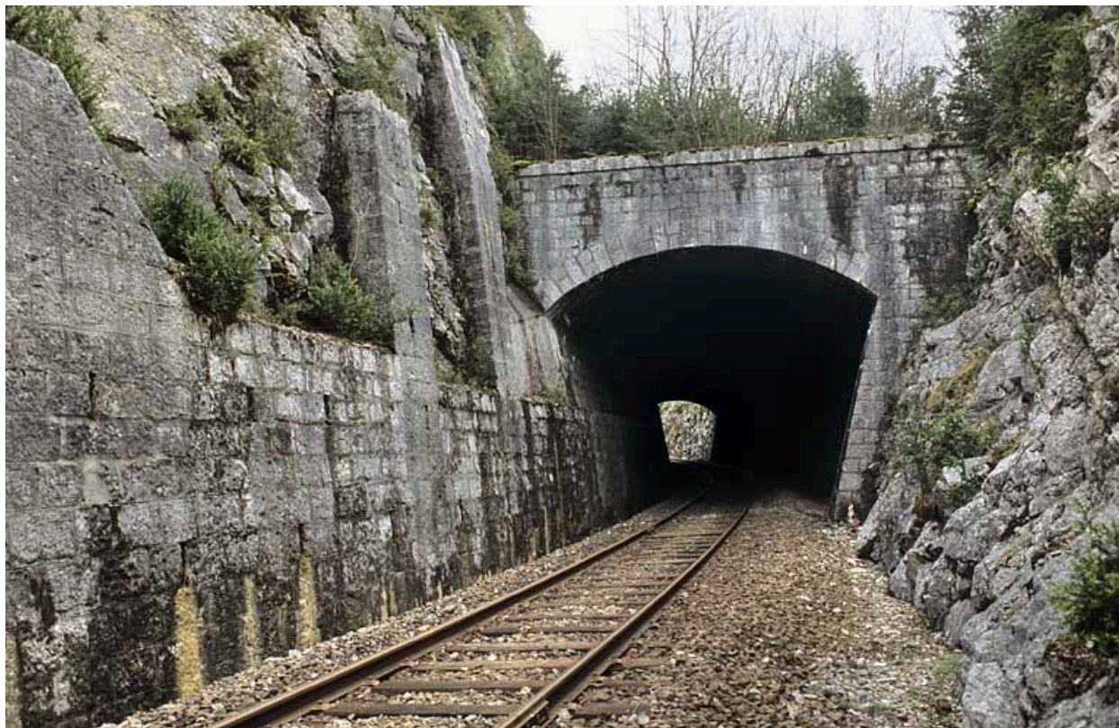
Tête côté Andelot-en-Montagne (nord).