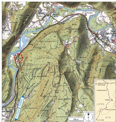
Carte et schéma de localisation. Carte topographique, IGN, 2000, dalles F085_052 et F086_052, échelle 1:25 000. Scan 25, licence n° 2008/CISE/2968. IVR43_20073900504NUDA