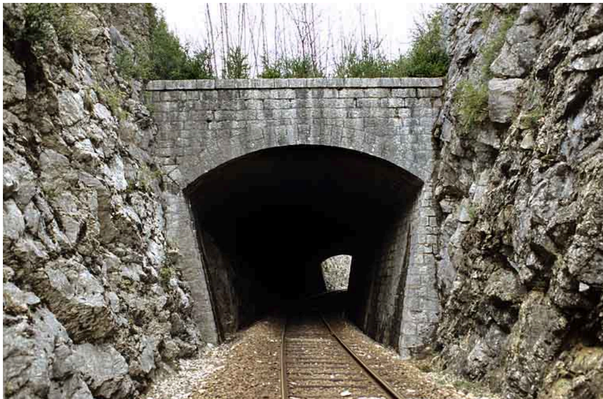
Tête côté La Cluse (sud).