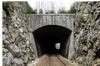
Tête côté La Cluse (sud). IVR43_20053900883ZA