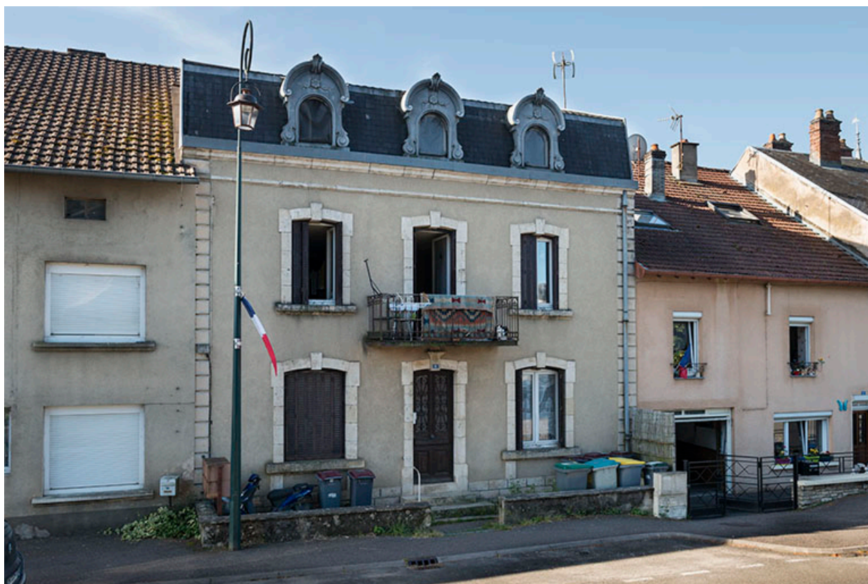
Maison n°6, vue de trois-quarts droit.