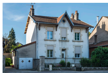
Maison n°10, vue de trois-quarts droit. IVR43_20187000358NUC4A