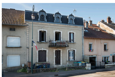
Maison n°6, vue de trois-quarts droit.