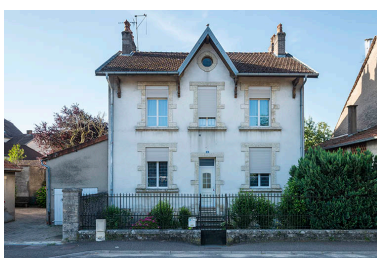
Maison n°10, vue de face. IVR43_20187000359NUC4A