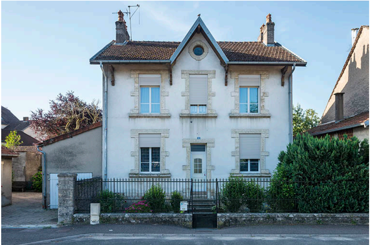
Maison n°10, vue de face.