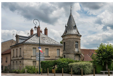
Maison n°2.