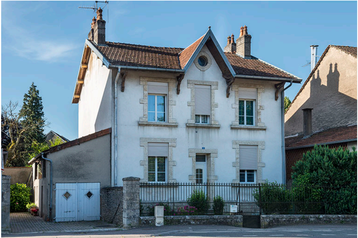
Maison n°10, vue de trois-quarts droit.