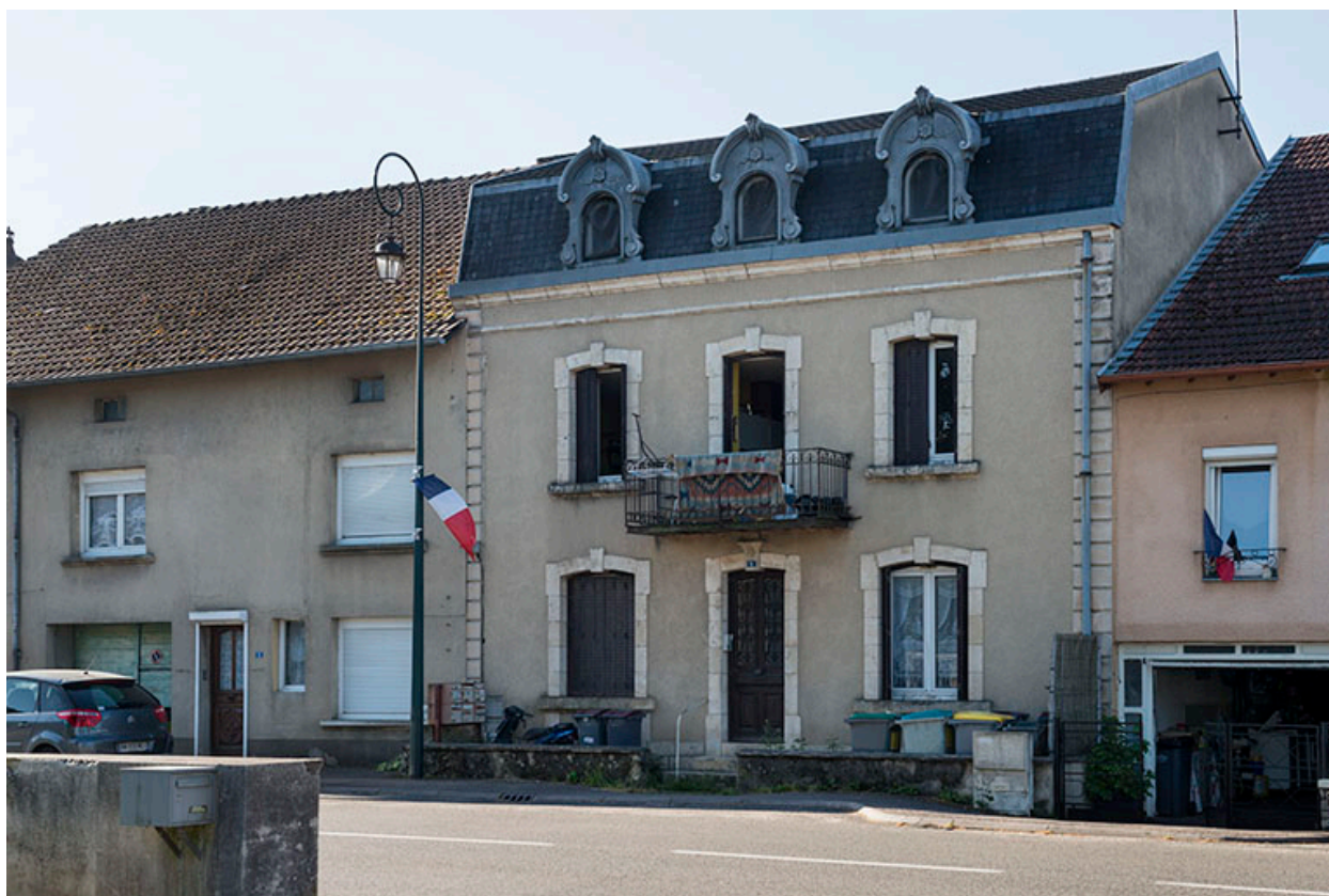
Maison n°6, vue de trois-quarts gauche.