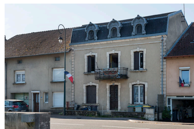
Maison n°6, vue de trois-quarts gauche. IVR43_20187000356NUC4A