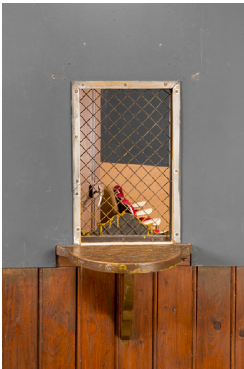
Vestibule : guichet.