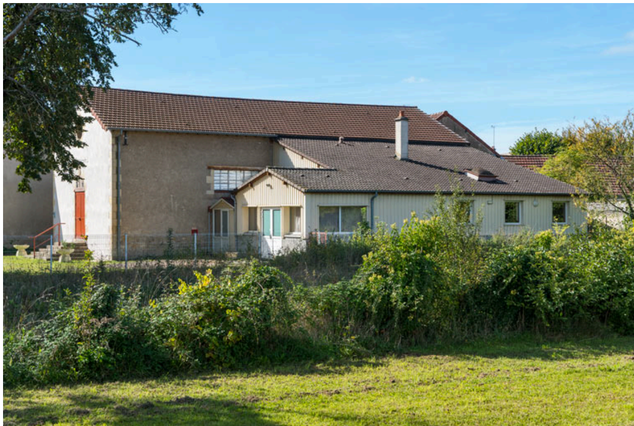
Façade latérale droite, de trois quarts gauche.