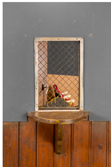
Vestibule : guichet. IVR26_20255800026NUC4A