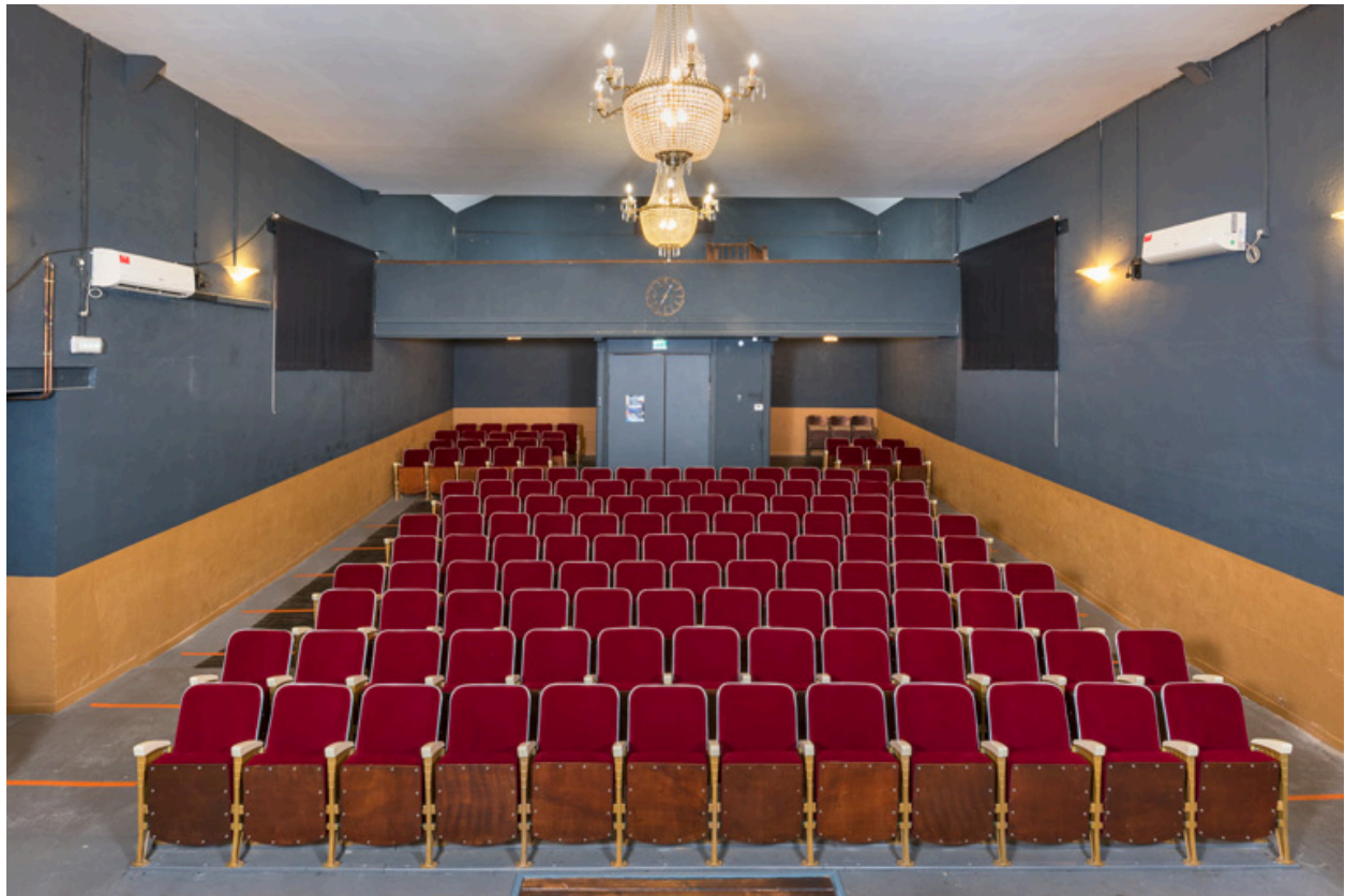
La salle, depuis la scène.