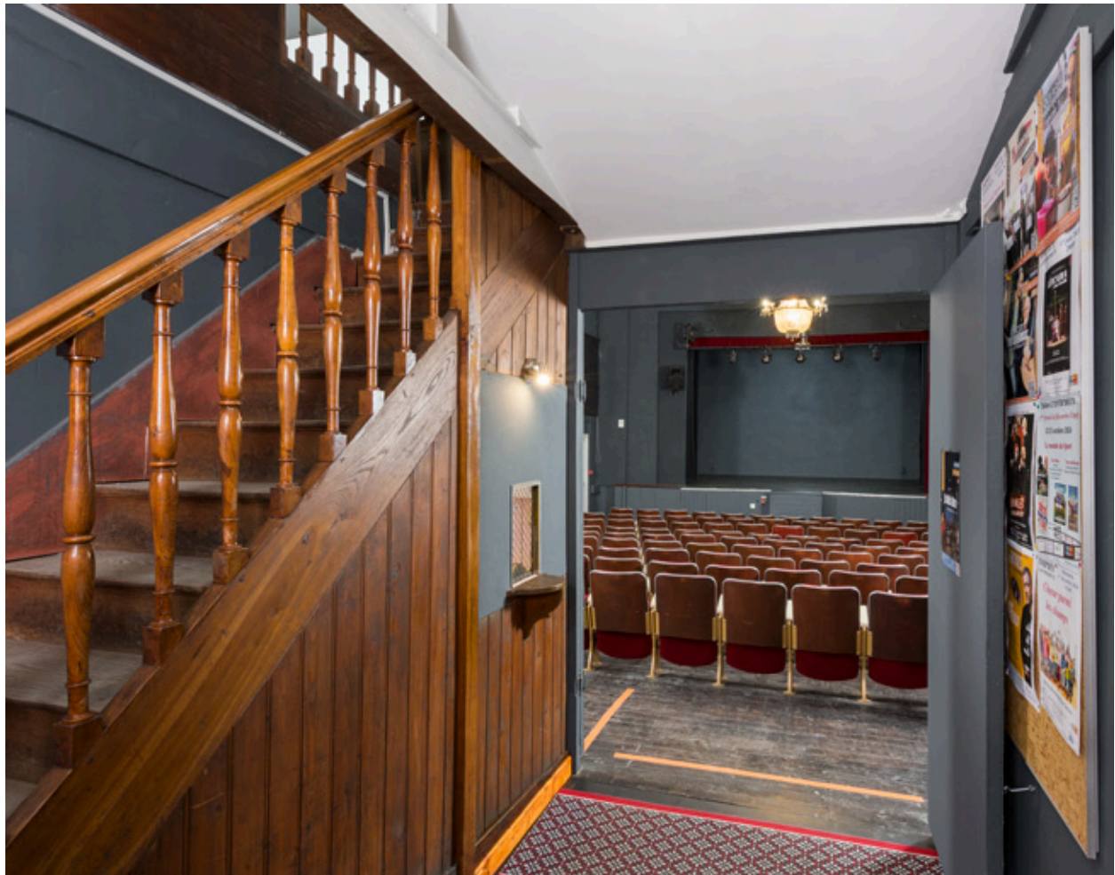
Vestibule. A gauche, l'escalier conduisant au balcon.