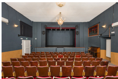
La scène, depuis le fond de la salle. IVR26_20255800028NUC4A