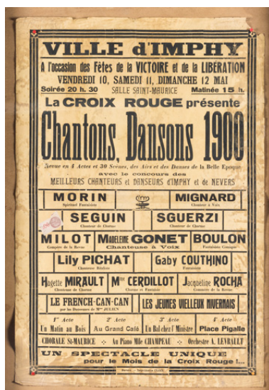
Affiche pour un spectacle dans la salle Saint-Maurice du 10 au 12 mai 1946.