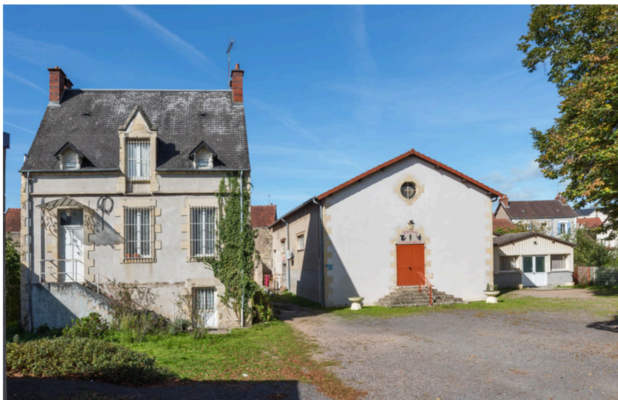
Vue d'ensemble, depuis le sud. A gauche, l'ancien presbytère.