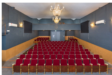
La salle, depuis la scène. IVR26_20255800023NUC4A