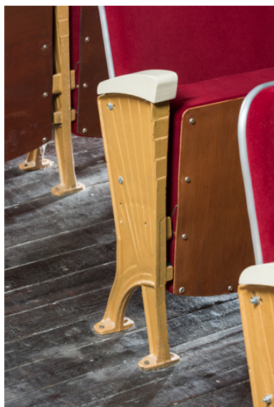
Montant d'un fauteuil. IVR26_20255800029NUC4A