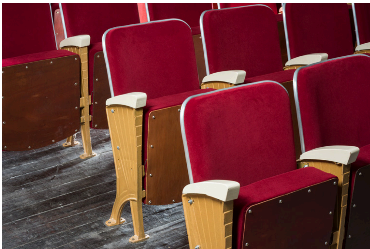
Rangées de fauteuils.