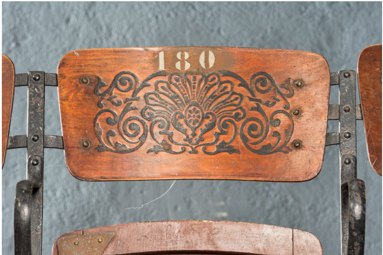
Dossier d'un ancien fauteuil en bois.