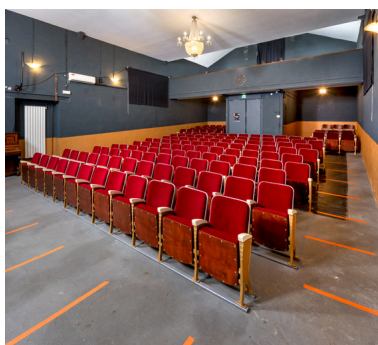
La salle depuis la scène, de trois quarts.