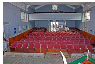
[Salle et balcon, depuis la scène, avant restauration]. S.d. [entre 2006 et 2014]. IVR26_20255800043NUC1A