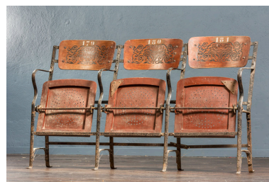
Anciens fauteuils en bois, de trois quarts. IVR26_20255800031NUC4A