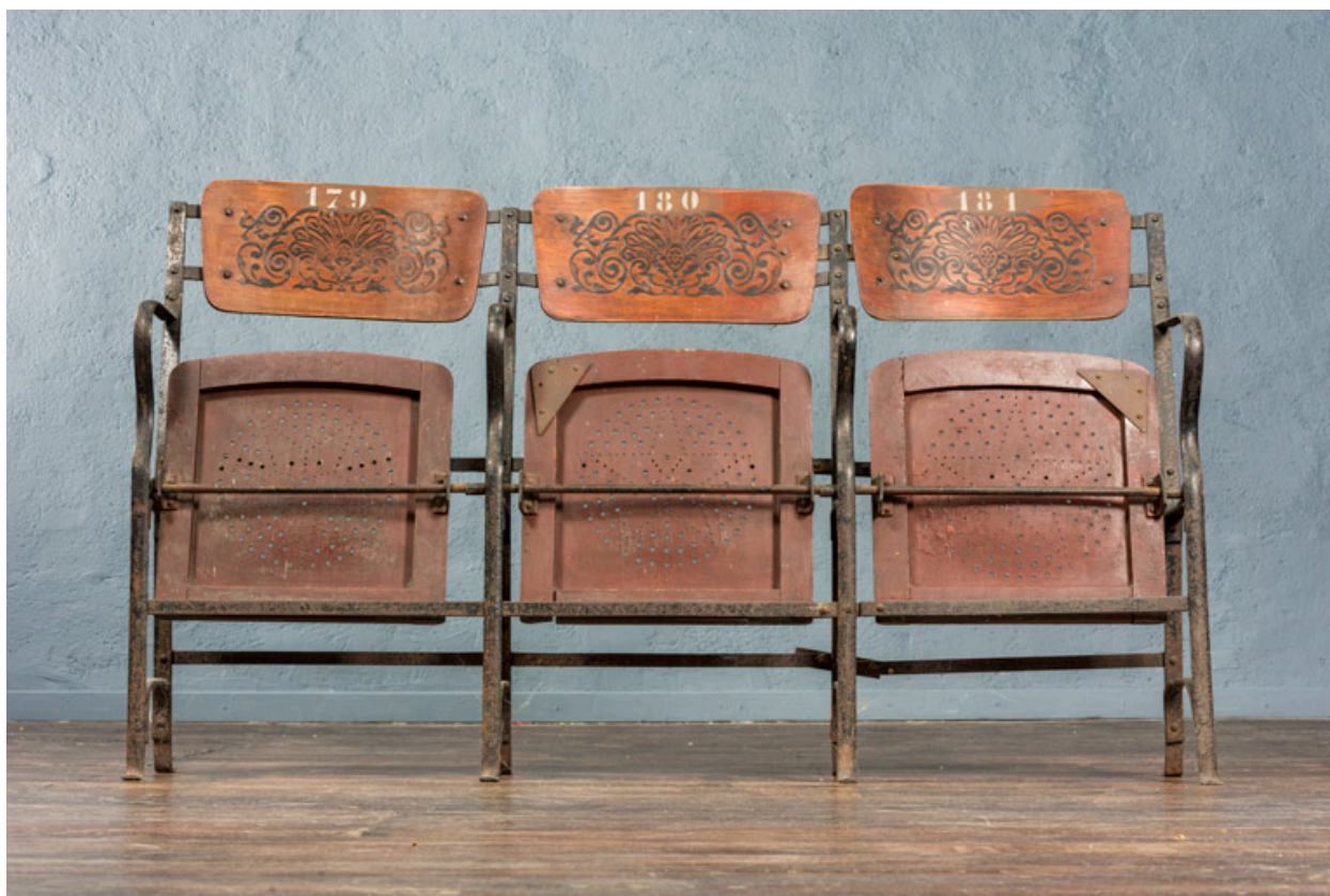
Anciens fauteuils en bois.