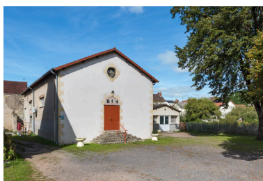
Façade antérieure, de trois quarts gauche. IVR26_20255800035NUC4A