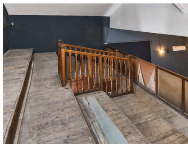
Balcon. IVR26_20255800025NUC4A