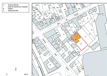
Plan-masse et de situation. Source : Direction générale des Finances Publiques - Cadastre ; mise à jour 2025, section AC, 1/1 000. IVR26_20265800012NUDA