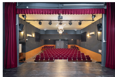
La salle, depuis le fond de la scène.