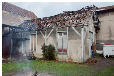
[Destruction de l'annexe (ancienne salle de catéchisme et chapelle privée)]. S.d. [entre 2006 et 2014]. IVR26_20255800040NUC1A