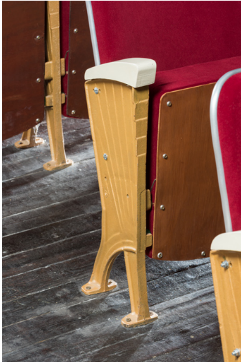
Montant d'un fauteuil.