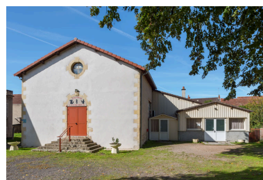
Façade antérieure, de trois quarts droite. IVR26_20255800036NUC4A