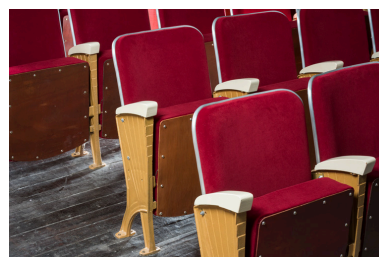
Rangées de fauteuils. IVR26_20255800030NUC4A