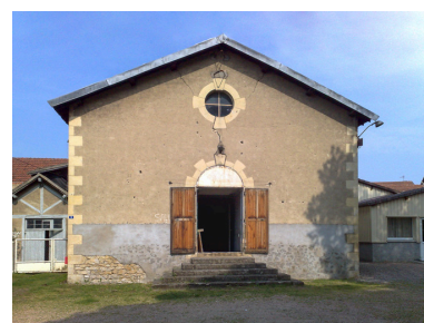
[Façade antérieure avant restauration]. S.d. [entre 2006 et 2014]. IVR26_20255800041NUC1A