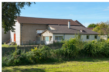
Façade latérale droite, de trois quarts gauche. IVR26_20255800038NUC4A