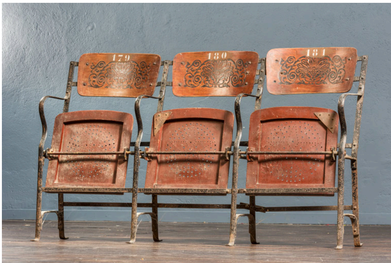
Anciens fauteuils en bois, de trois quarts.