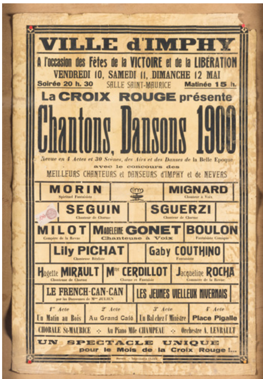
Affiche pour un spectacle dans la salle Saint-Maurice du 10 au 12 mai 1946.