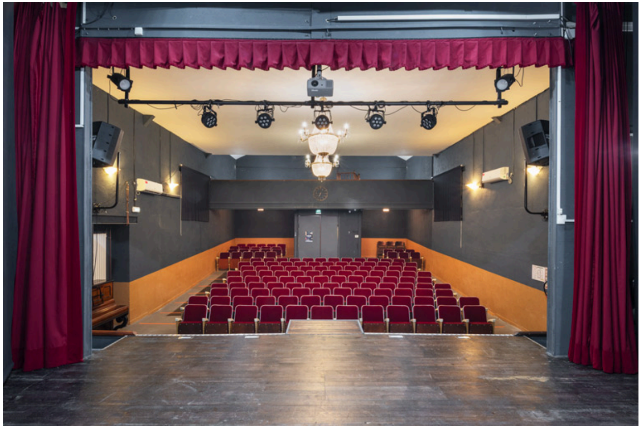
La salle, depuis le fond de la scène.