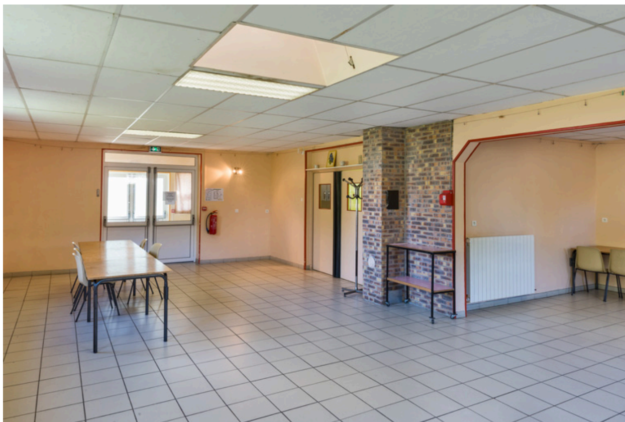
Ancienne salle paroissiale (actuelle salle Parent).