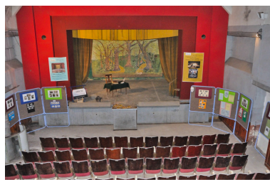
[Vue plongeante sur la scène depuis le balcon, avant restauration]. S.d. [entre 2006 et 2014]. Le décor de fond est en place. IVR26_20255800042NUC2A