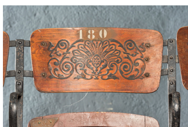
Dossier d'un ancien fauteuil en bois. IVR26_20255800032NUC4A