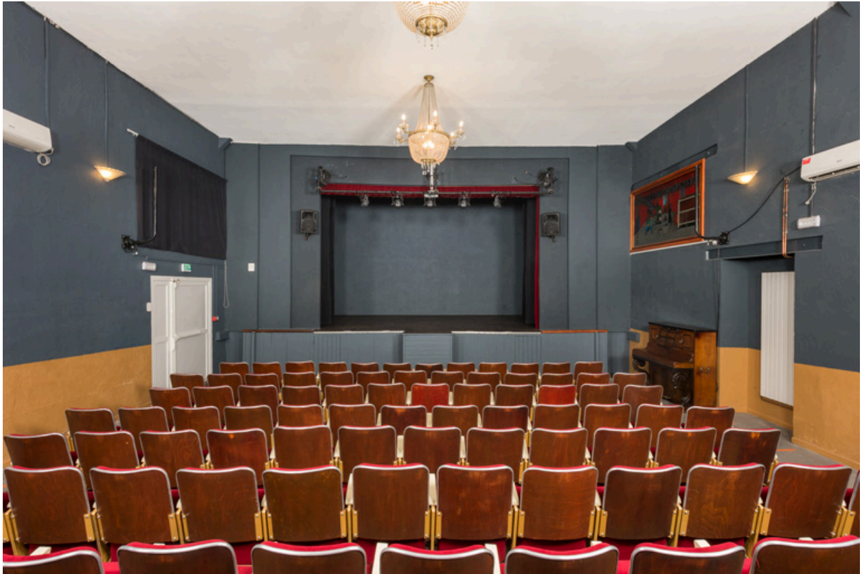
La scène, depuis le fond de la salle.