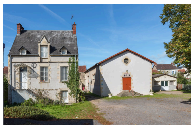
Vue d'ensemble, depuis le sud. A gauche, l'ancien presbytère. IVR26_20255800037NUC4A