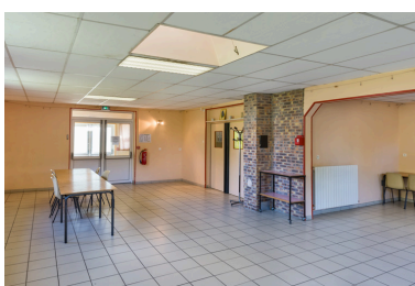
Ancienne salle paroissiale (actuelle salle Parent). IVR26_20255800039NUC4A