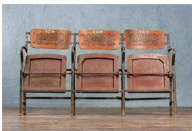
Anciens fauteuils en bois. IVR26_20255800034NUC4A