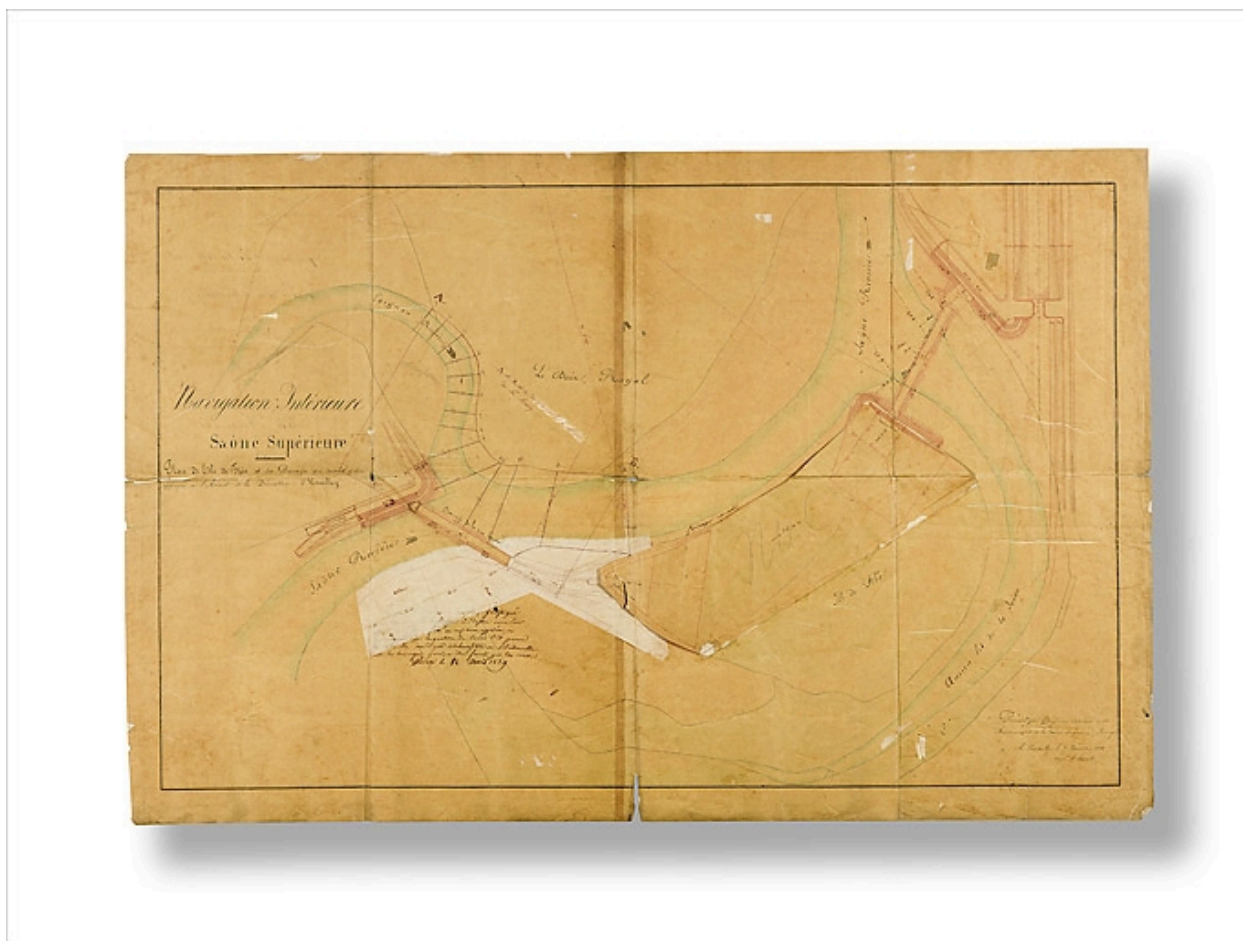
"Navigation Intérieure - Saône supérieure. Plan de l'Isle de Flée et des Barrages qui doivent y être appuyés à l'Amont de la Dérivation d'Heuilley". Ingénieur ordinaire G Bonnet ; 7 novembre 1838.