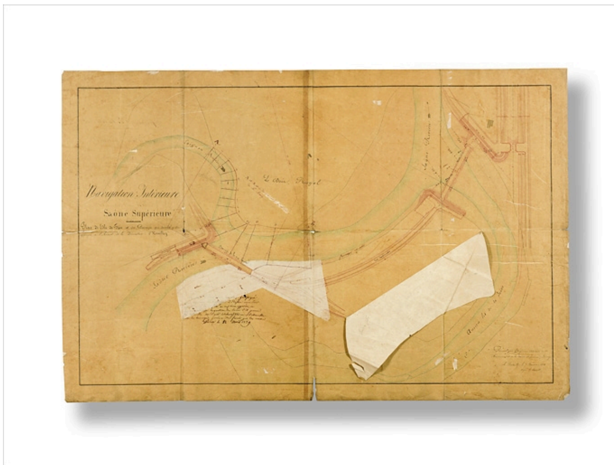
"Navigation Intérieure - Saône supérieure. Plan de l'Isle de Flée et des Barrages qui doivent y être appuyés à l'Amont de la Dérivation d'Heuilley". Ingénieur ordinaire G Bonnet ; 7 novembre 1838.