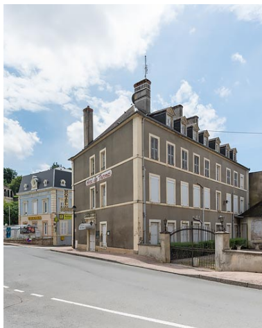
Façade est et façade nord. IVR26_20217100242NUC4A

Situation de l'hôtel des Thermes (à droite), près de l'établissement thermal (à gauche). IVR26_20217100320NUC1A