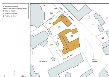
Plan-masse et de situation, extrait du plan cadastral (2023).