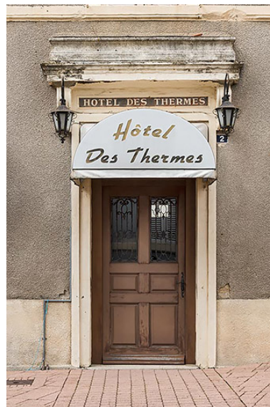
Porte d'entrée. IVR26_20227100033NUC4A