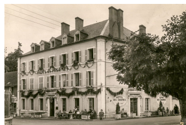
Vue ancienne (milieu du 20e siècle). Autr. auteur inconnu