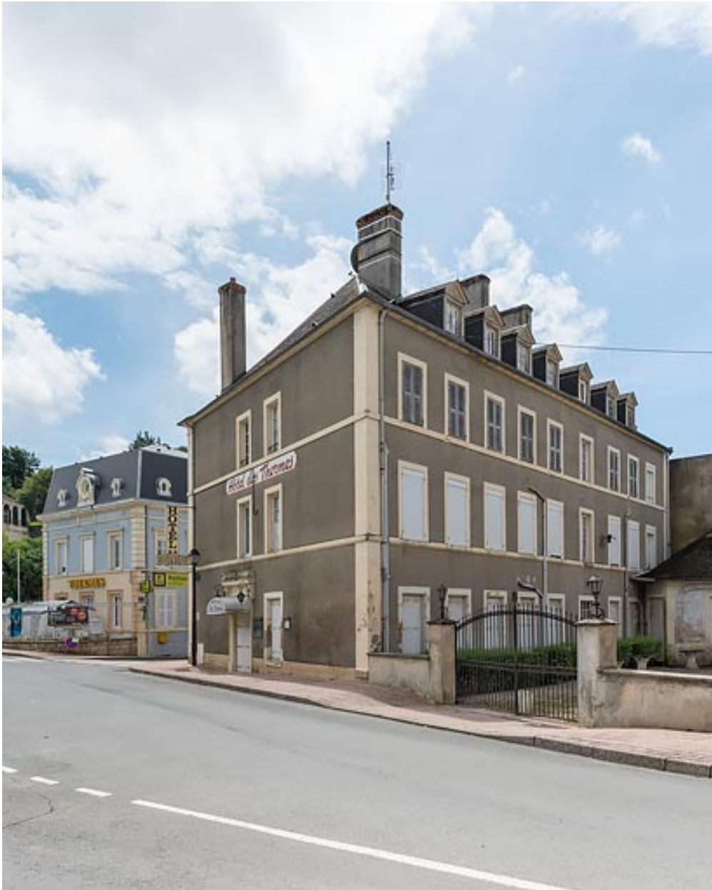
Façade est et façade nord.