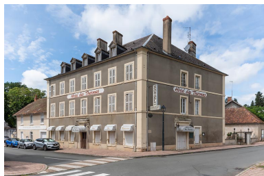
Façade sud et façade est. IVR26_20217100241NUC4A

IVR26_20237100012NUDA