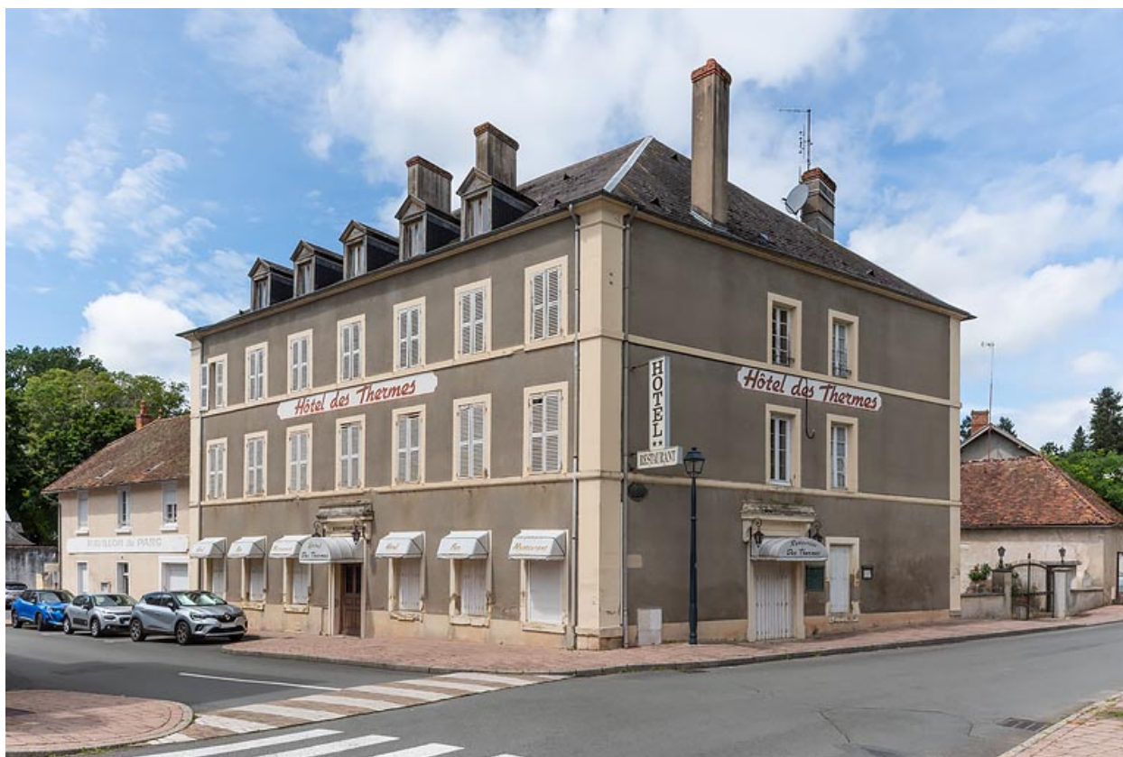
Façade sud et façade est.