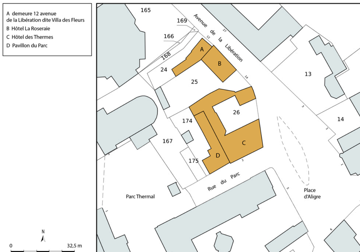
Plan-masse et de situation, extrait du plan cadastral (2023).