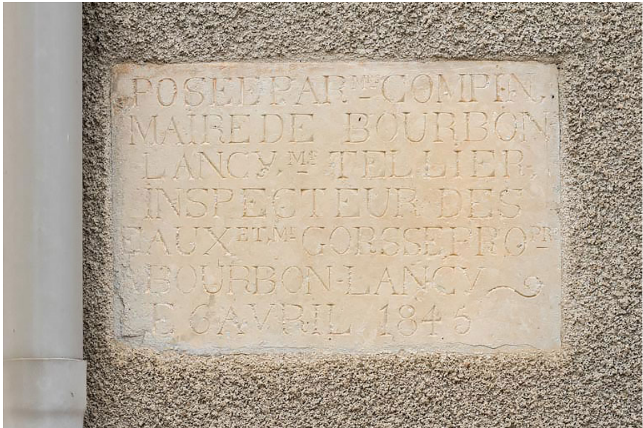
Inscription relative à la construction de l'édifice, 6 avril 1845.