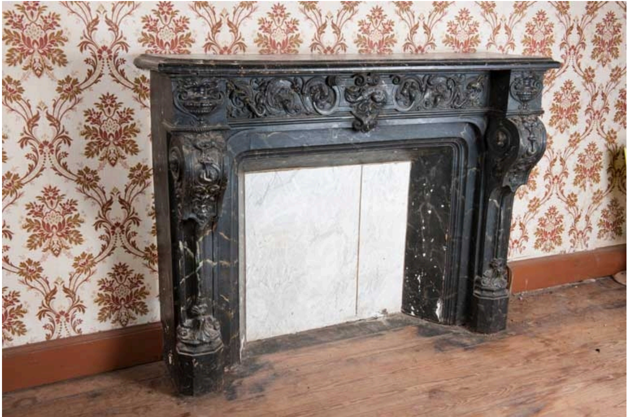
Intérieur du logis (côté rue) : fausse cheminée de l'ancienne salle à manger.