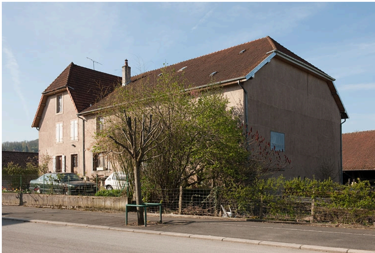
Façade antérieure, vue de trois quarts droit.