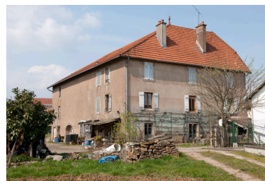
Façade postérieure vue de trois quarts gauche.

Phot. Jérôme Mongreville IVR43_20102500630NUC4A