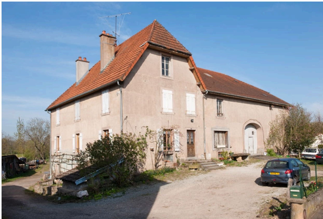
Façade antérieure, vue de trois quarts gauche.