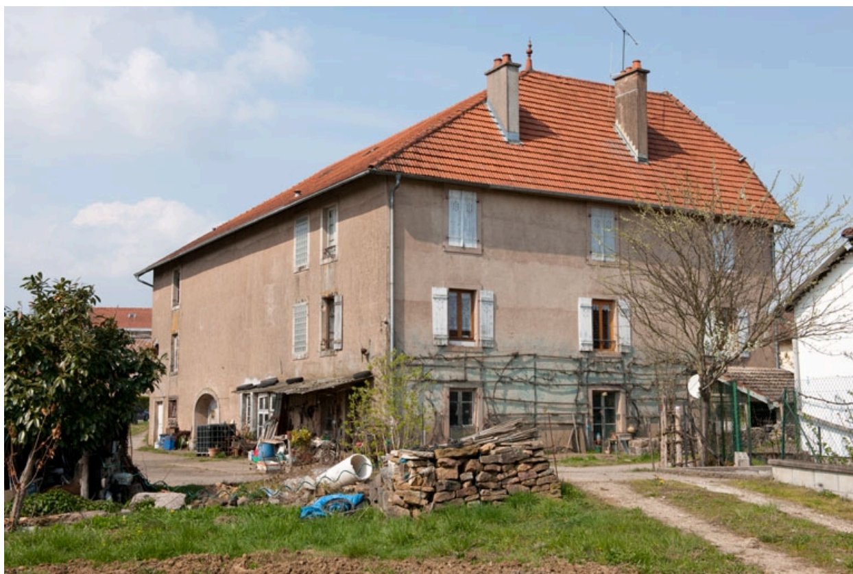
Façade postérieure vue de trois quarts gauche.