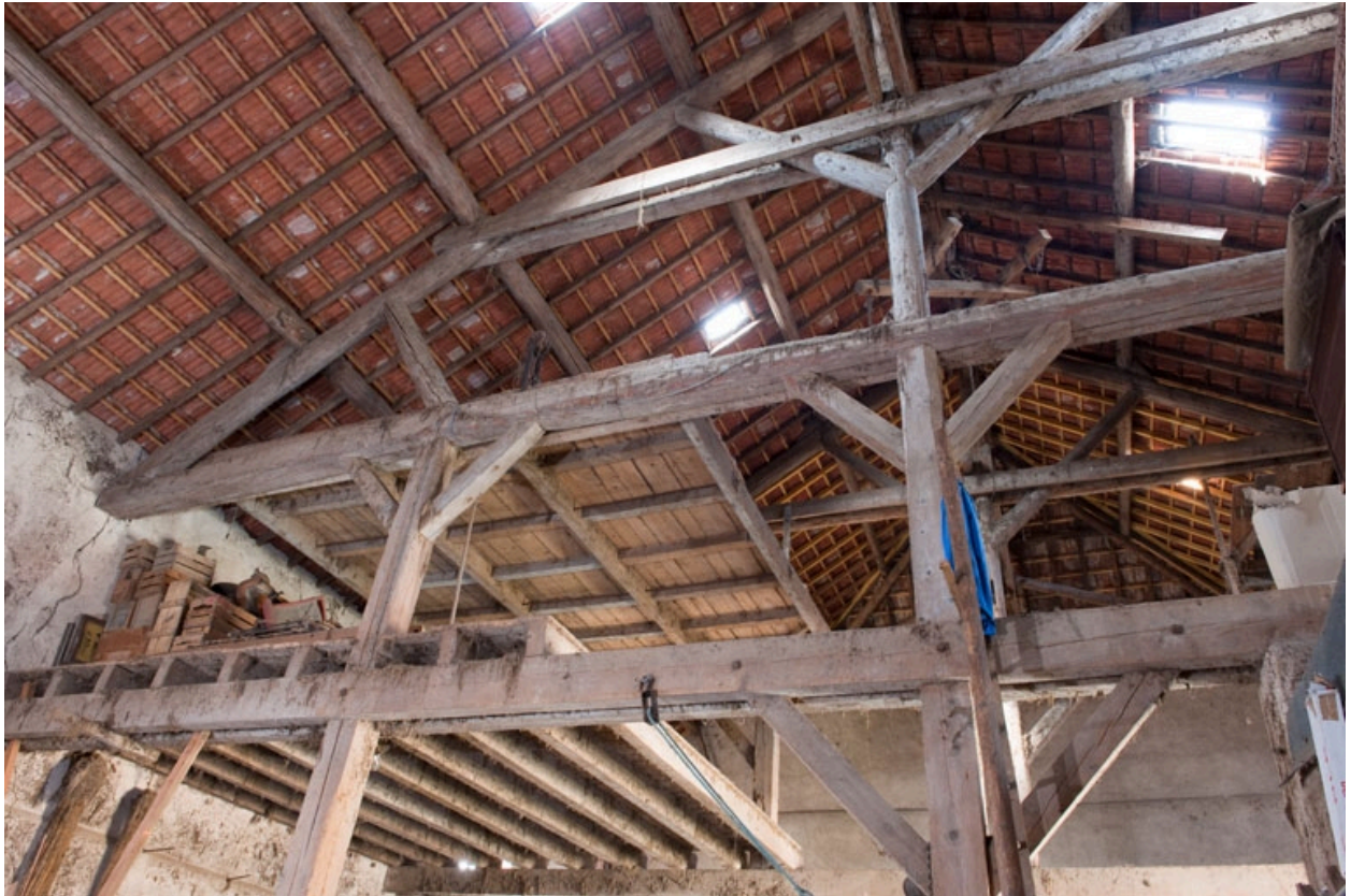
Grange : vue de la charpente et du pont roulant.