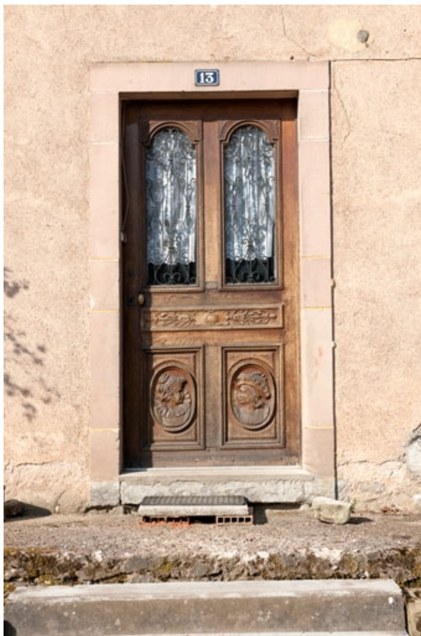
Logis (côté rue) : porte d'entrée.