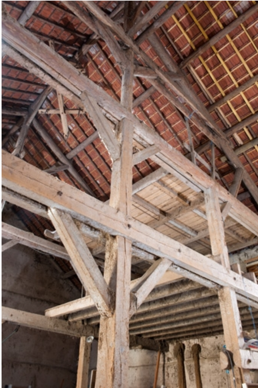
Grange : vue de la charpente.