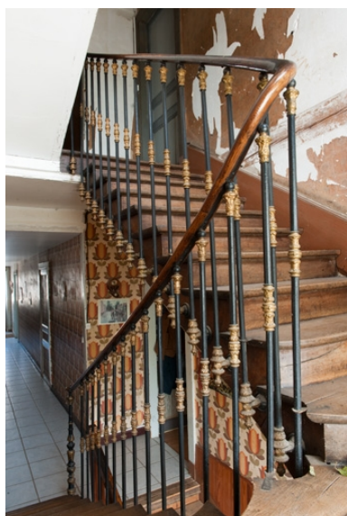
Intérieur du logis (côté rue) : escalier menant à l'étage des chambres. IVR43_20102500624NUC4A