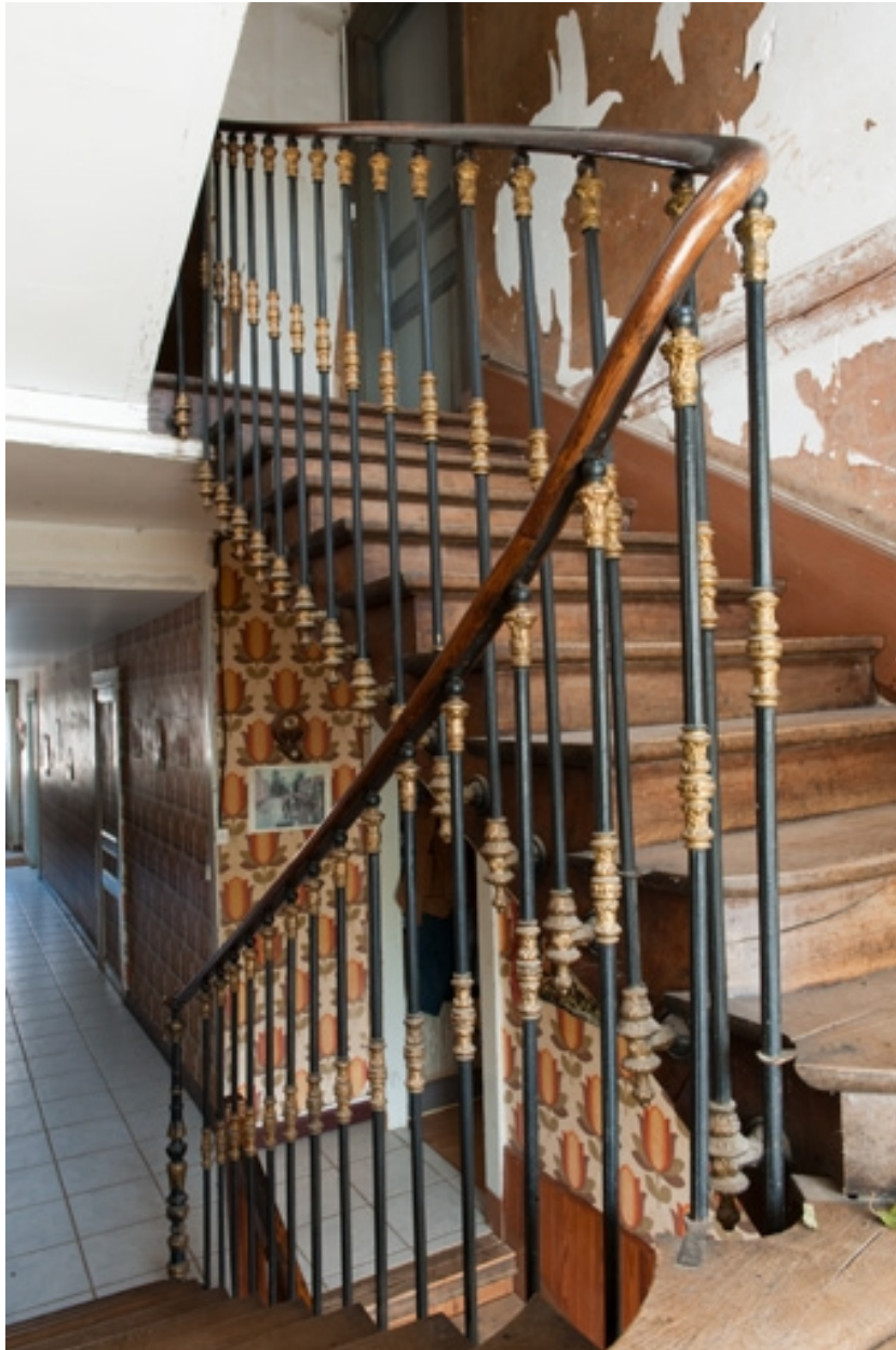
Intérieur du logis (côté rue) : escalier menant à l'étage des chambres.