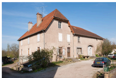
Façade antérieure, vue de trois quarts gauche.

Phot. Jérôme Mongreville IVR43_20102500627NUC4A