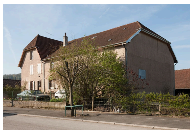
Façade antérieure, vue de trois quarts droit.

Phot. Jérôme Mongreville IVR43_20102500627NUC4A