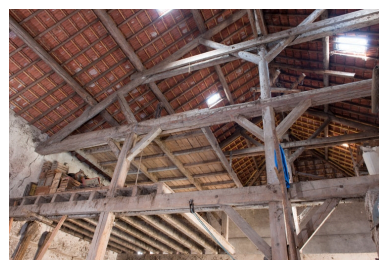
Grange : vue de la charpente et du pont roulant. IVR43_20102500625NUC4A