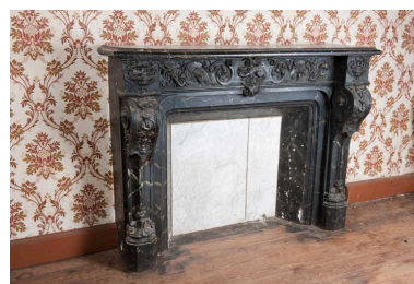
Intérieur du logis (côté rue) : fausse cheminée de l'ancienne salle à manger.

Phot. Jérôme Mongreville IVR43_20102500629NUC4A