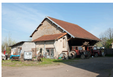
Hangar agricole. IVR43_20102500631NUC4A