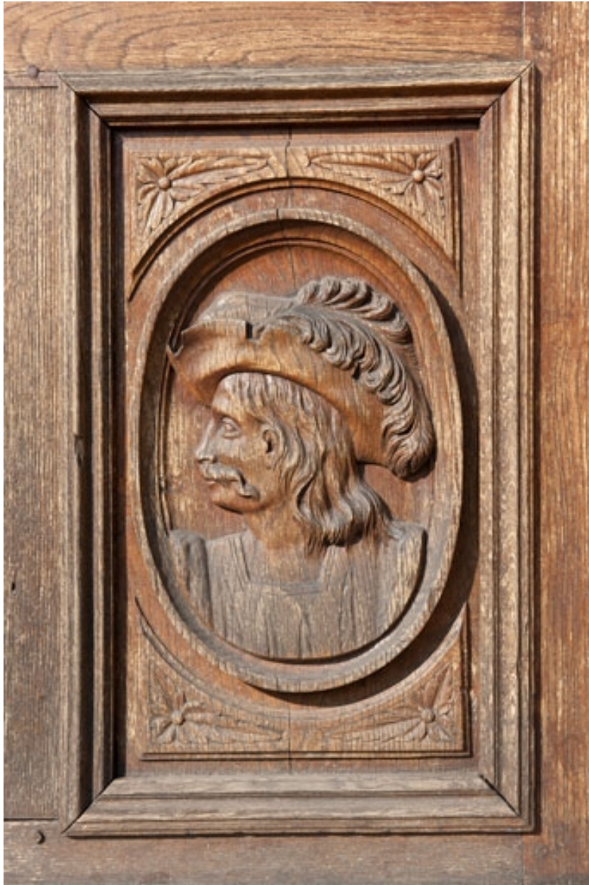
Logis (côté rue) : un des panneaux sculptés de la porte d'entrée.