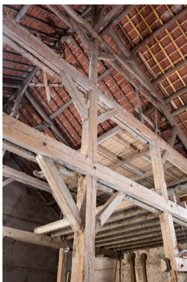
Grange : vue de la charpente. IVR43_20102500626NUC4A