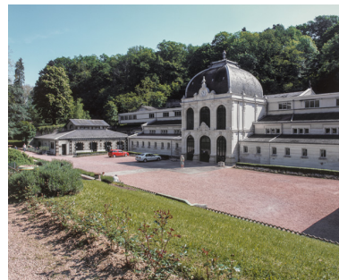
Vue extérieure (début des années 2000) après la transformation des baies.