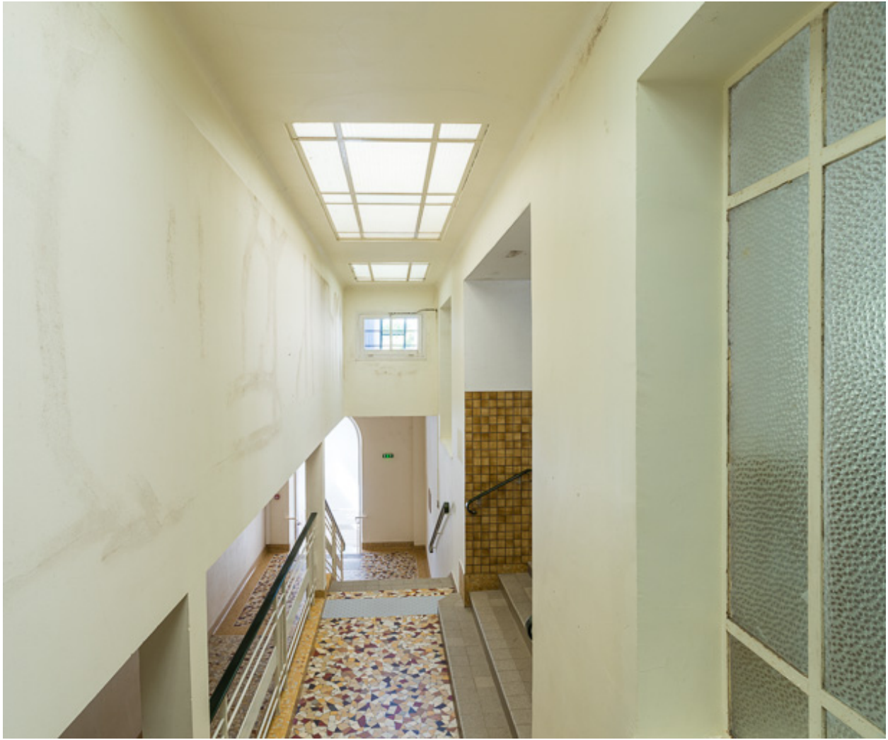
Passage du couloir (à gauche) dans l'établissement thermal.