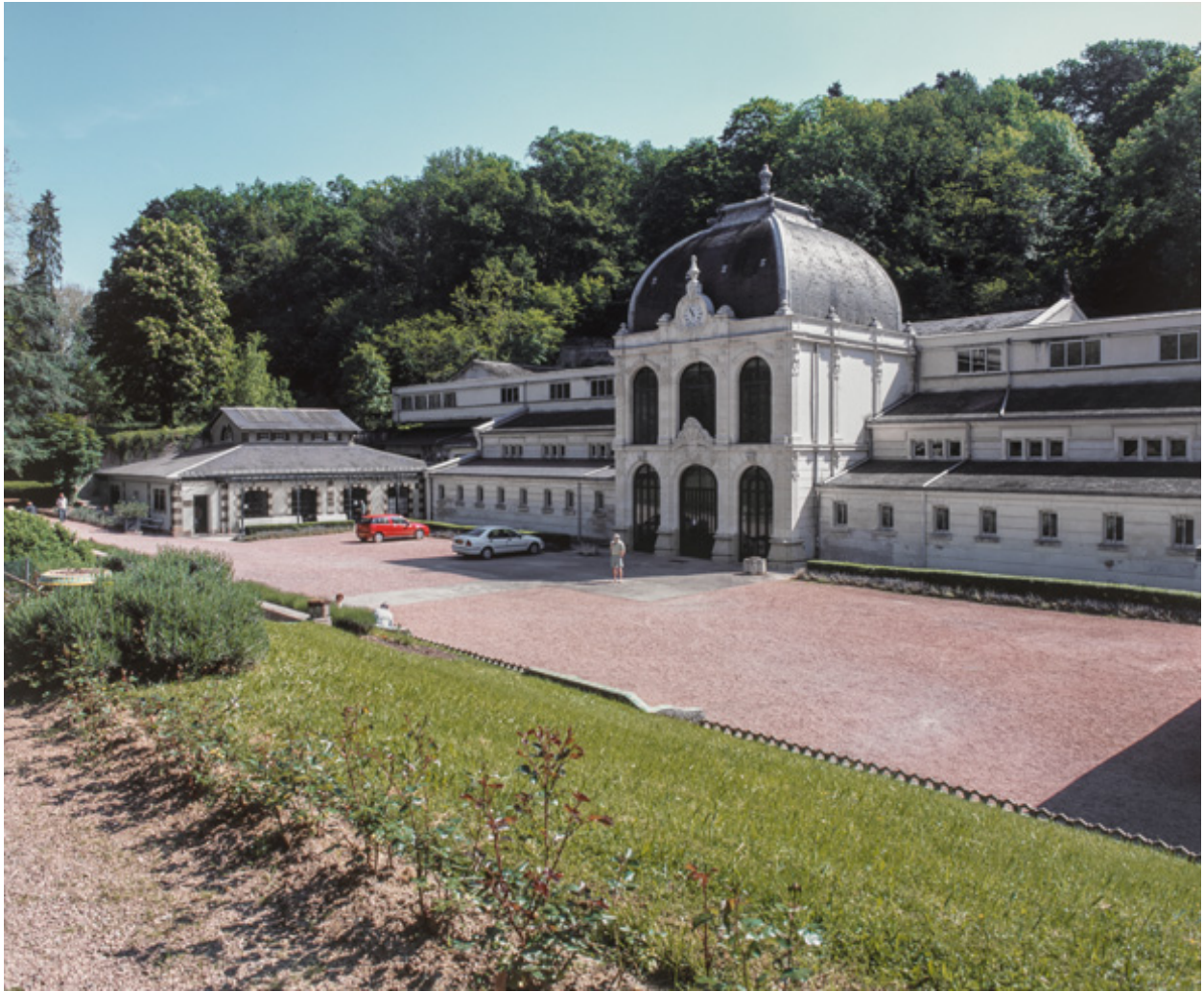
Vue extérieure (début des années 2000) après la transformation des baies.