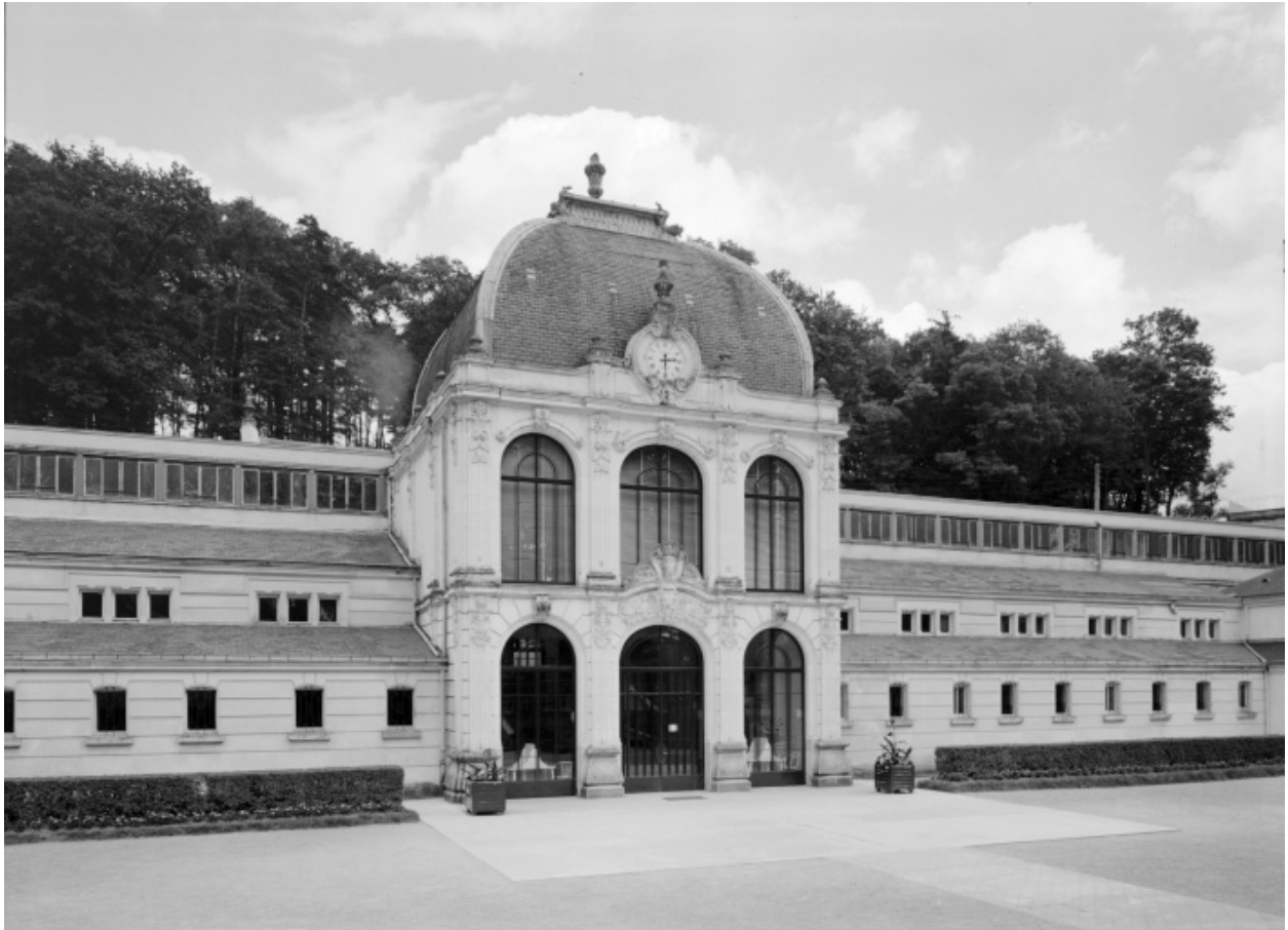
Vue extérieure (fin des années 1970) avant la transformation des baies.