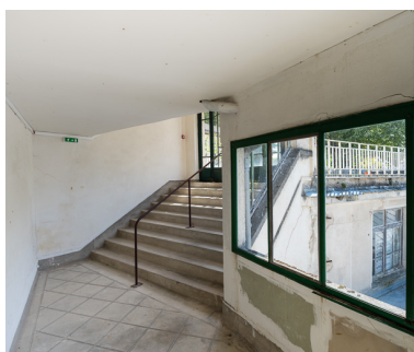
Vue intérieure en direction de la terrasse de l'hôtel. IVR26_20195800198NUC4AQ