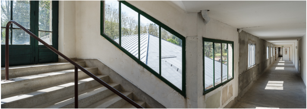
Vue intérieure en direction de la terrasse du casino.