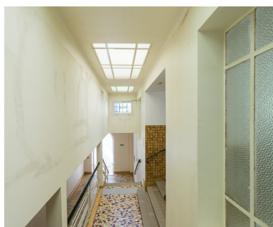
Passage du couloir (à gauche) dans l'établissement thermal.