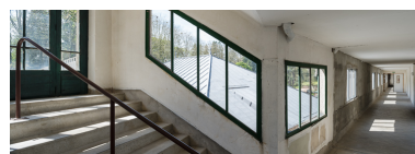
Vue intérieure en direction de la terrasse du casino. IVR26_20195800197NUC4AQ