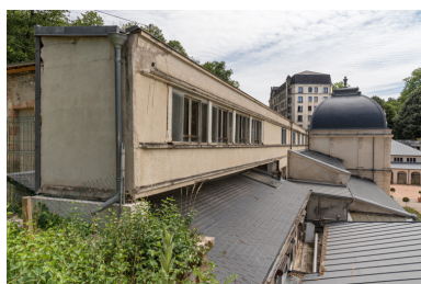
Vue extérieure depuis la terrasse du casino (détruit) en 2019. IVR26_20195800396NUC4A