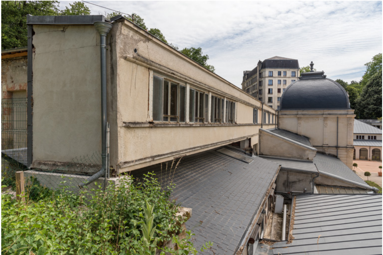
Vue extérieure depuis la terrasse du casino (détruit) en 2019.