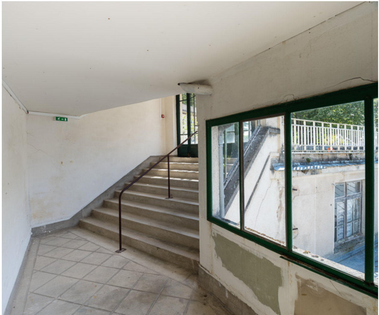
Vue intérieure en direction de la terrasse de l'hôtel.