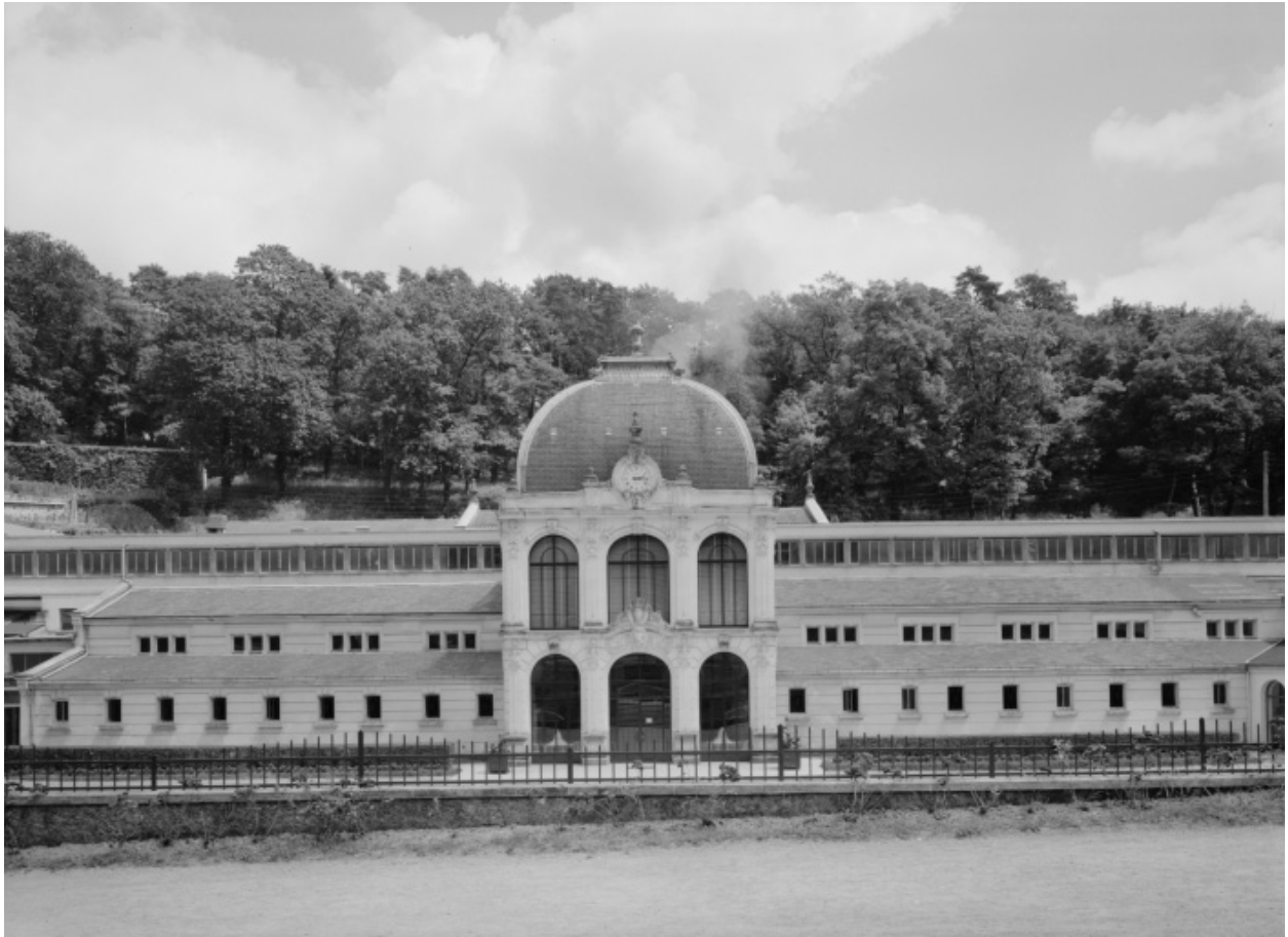
Vue extérieure (fin des années 1970) avant la transformation des baies.