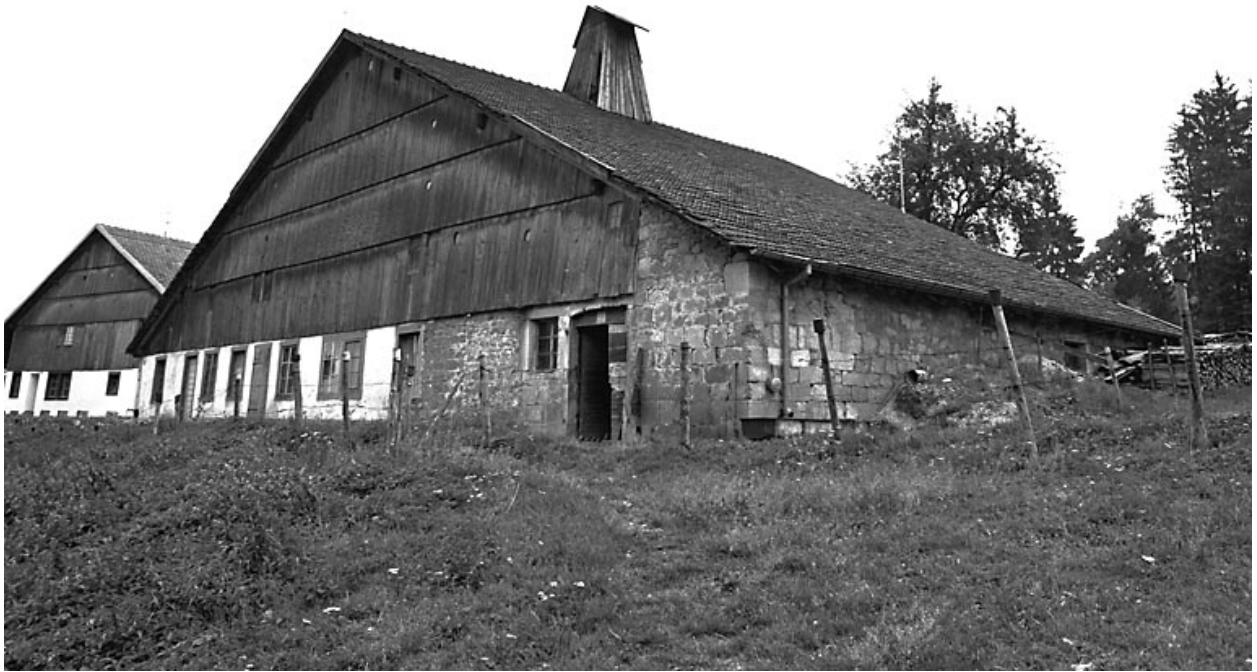
Vue d'ensemble de trois quarts droit.