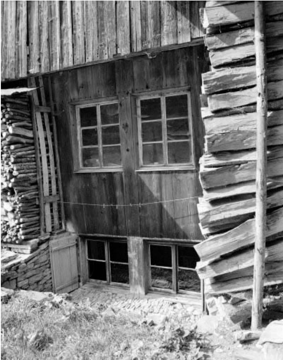
Façade postérieure : fenêtre de la cuisine.