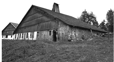
Vue d'ensemble de trois quarts droit.

IVR43_19762500628X