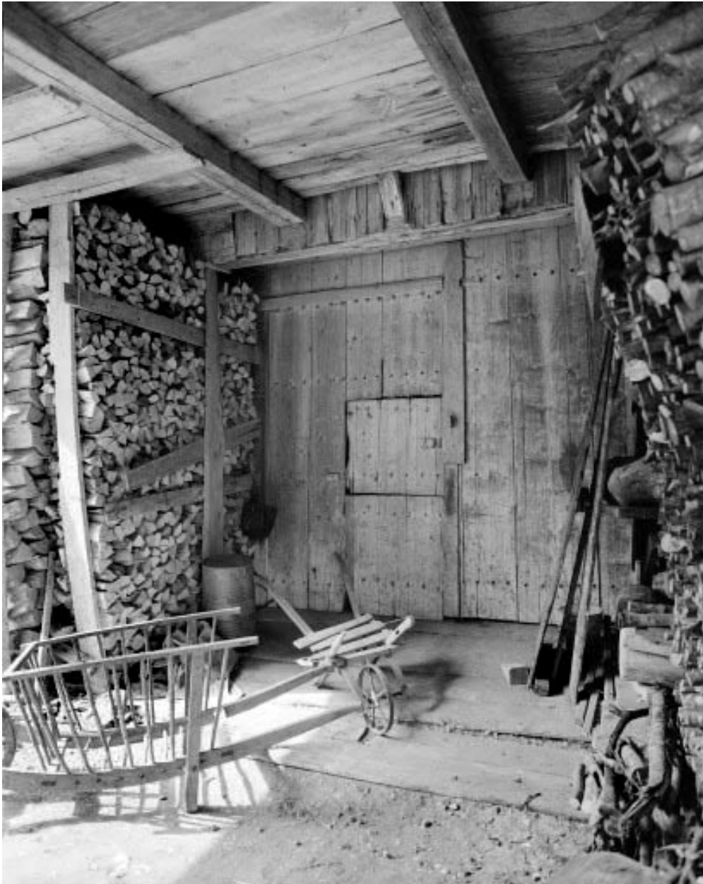
Façade postérieure : porte de grange.