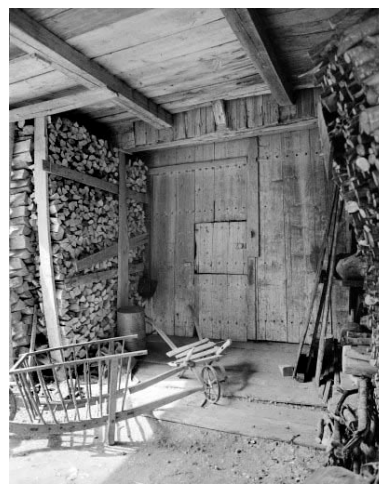
Façade postérieure : porte de grange. IVR43_19762500636X