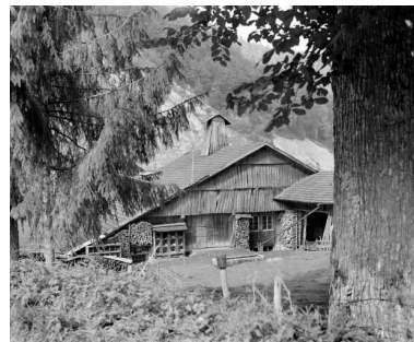
Façade postérieure. IVR43_19762500631X