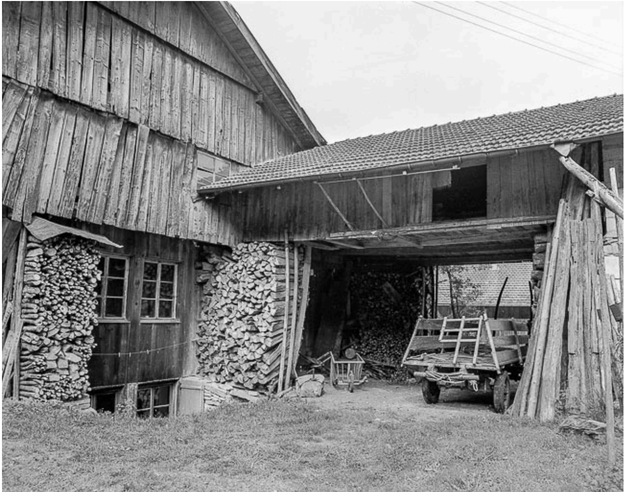
Détail : entrée de grange.