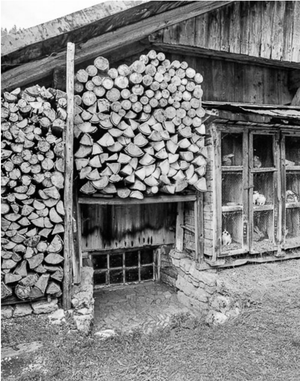
Détail : fenêtre de l'écurie.