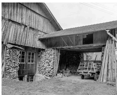
Détail : entrée de grange. IVR43_19762500632X