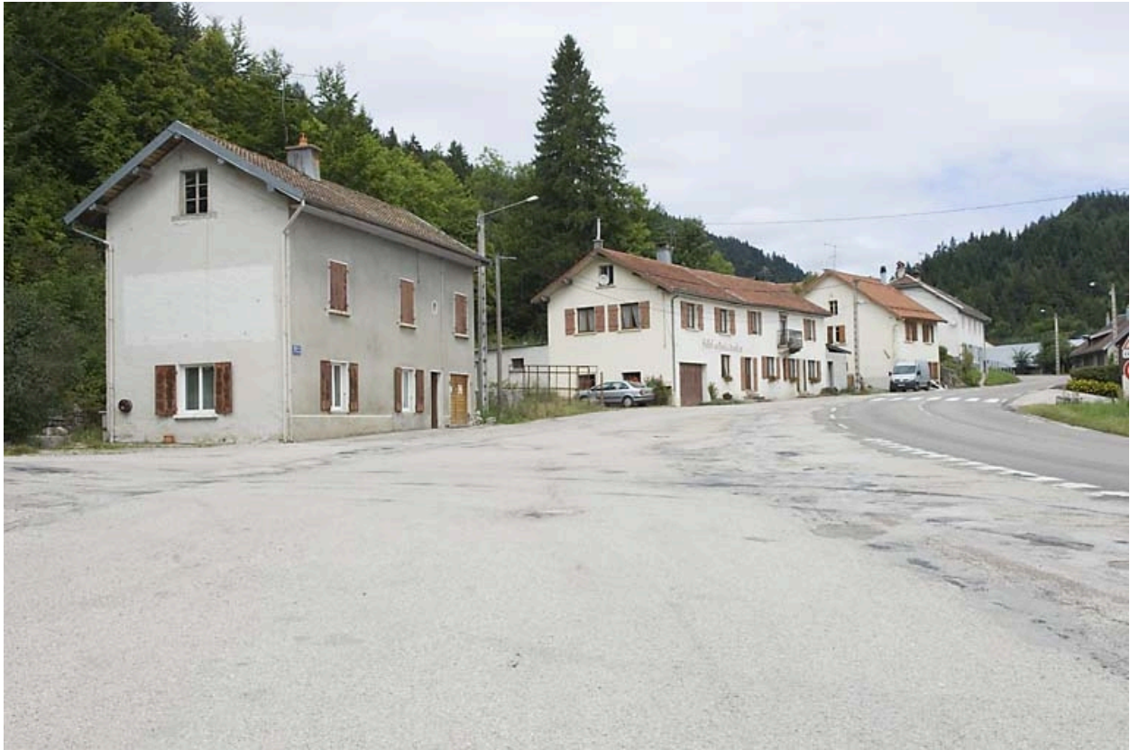
Vue générale, depuis le sud.