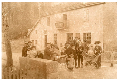
[Vue générale de l'hôtel de voyageurs], 1913. IVR43_20102501518NUC4A