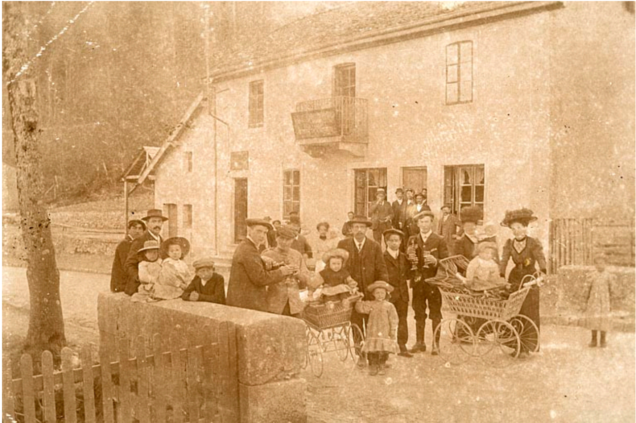
[Vue générale de l'hôtel de voyageurs], 1913.