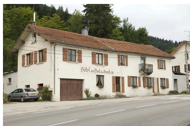
Façade antérieure, de trois quarts gauche. IVR43_20082500864NUC2A