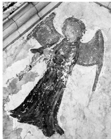
Ange IVR26_19852101771X