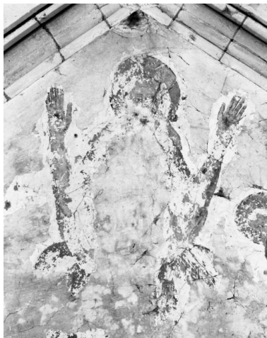
Le Christ IVR26_19852101774X