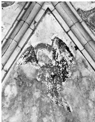
Ange IVR26_19852101772X