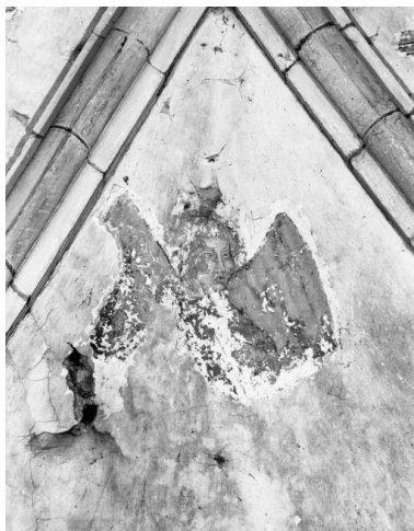
Ange