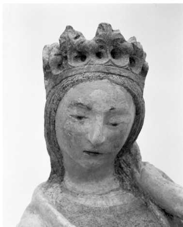
Détail. IVR26_19872100258X