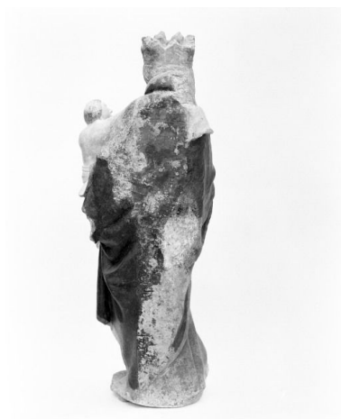
Vue du revers. IVR26_19872100257X