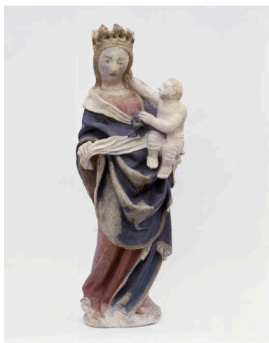
Vue de face. IVR26_19872100254XA