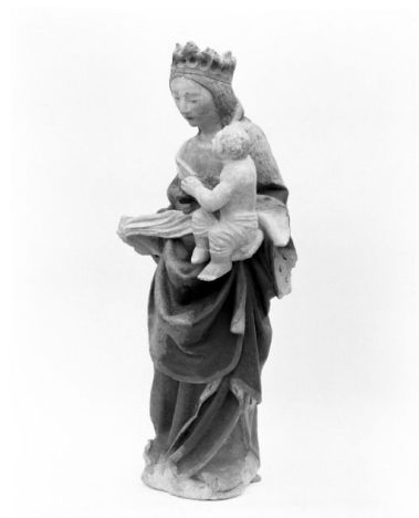
Vue de trois-quarts. IVR26_19872100255X