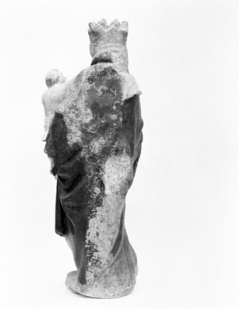
Vue du revers.