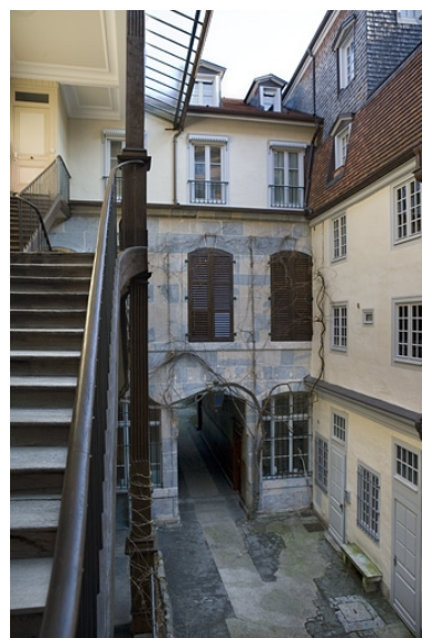
Façade du premier logis secondaire depuis l'escalier à cage ouverte.

IVR43_20082500216NUC2A