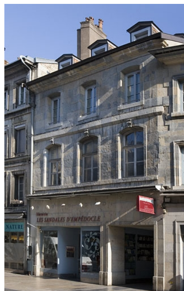
Façade sur rue : de trois quarts droit. IVR43_20082500213NUC2A