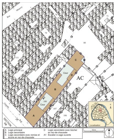
Plan masse et de situation. Extrait du plan cadastral, 1974, section AC.

Dess. André Céréza IVR43_20072500085NUDA