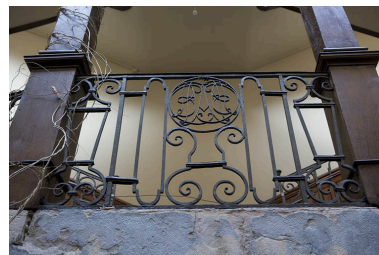
Détail de la ferronnerie de l'escalier à cage ouverte. IVR43_20082500214NUC2A