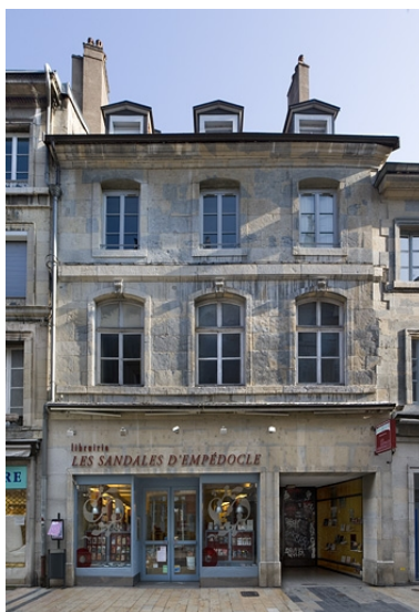
Façade sur rue : de face. IVR43_20082500212NUC2A

IVR43_20072500085NUDA