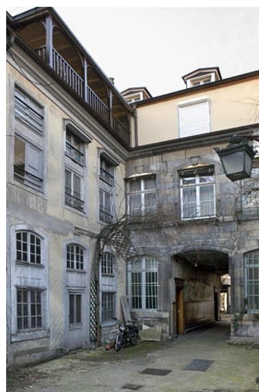
Façade postérieure et aile droite du premier logis secondaire depuis le fond de la deuxième cour.

IVR43_20082500219NUC2A