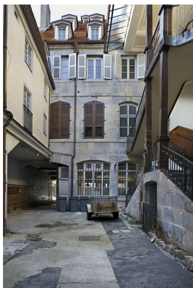
Façade postérieure du logis principal depuis le fond de la première cour.

IVR43_20082500218NUC2A