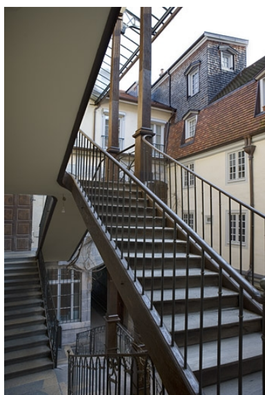
Détail de l'escalier à cage ouverte depuis l'intérieur de la cage.

IVR43_20082500215NUC2A