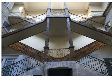
Détail de l'escalier à cage ouverte, de face. IVR43_20082500222NUC2A

IVR43_20082500223NUC2A