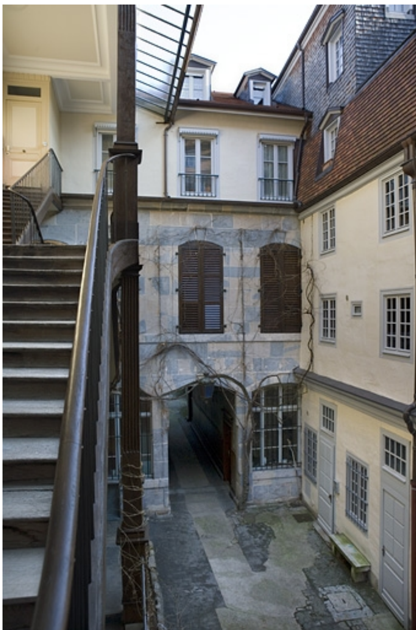
Façade du premier logis secondaire depuis l'escalier à cage ouverte.