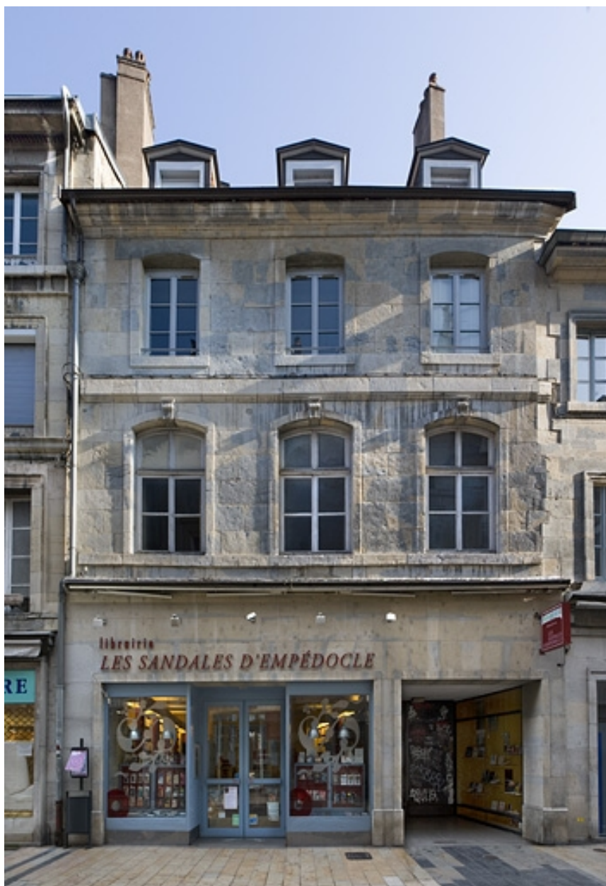
Façade sur rue : de face.