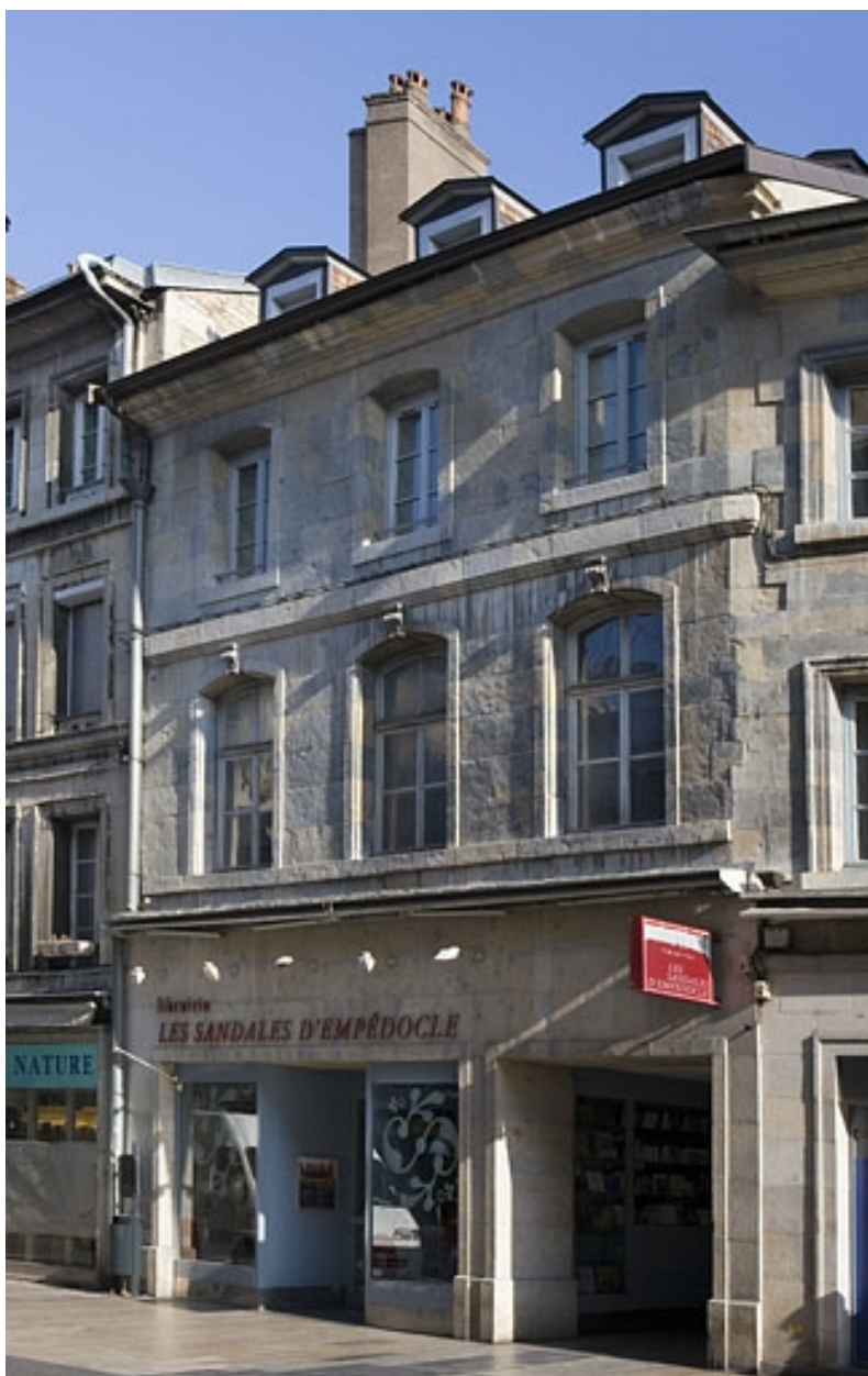
Façade sur rue : de trois quarts droit.