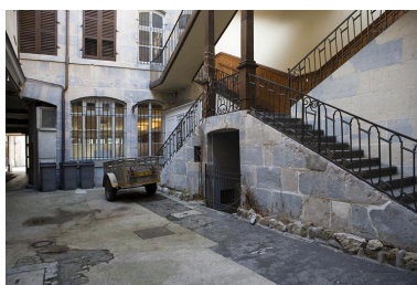
Détail de la première volée de l'escalier à cage ouverte depuis le fond de la première cour. IVR43_20082500217NUC2A

IVR43_20082500218NUC2A