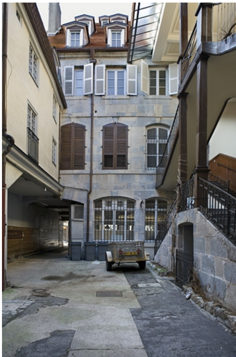
Façade postérieure du logis principal depuis le fond de la première cour.