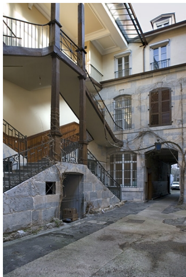
Détail de l'escalier à cage ouverte et de la façade antérieure du premier logis secondaire.

Phot. Yves Sancey IVR43_20082500223NUC2A