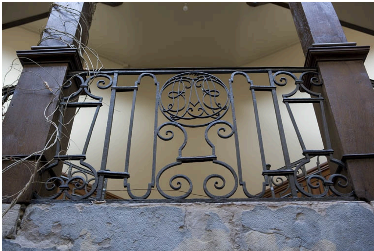
Détail de la ferronnerie de l'escalier à cage ouverte.