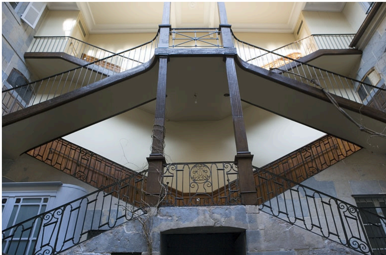
Détail de l'escalier à cage ouverte, de face.