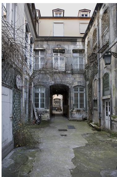
Façade postérieure du premier logis secondaire depuis le fond de la deuxième cour.

IVR43_20082500215NUC2A