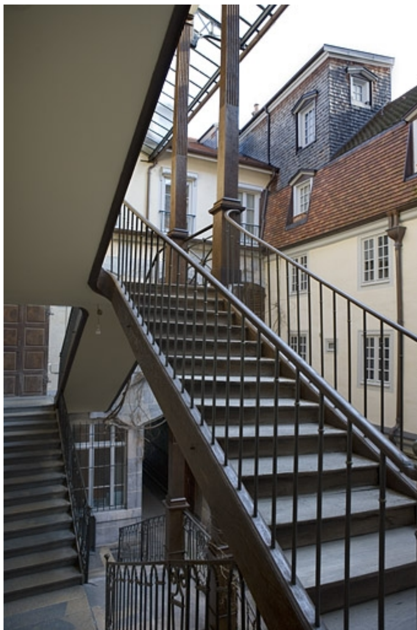
Détail de l'escalier à cage ouverte depuis l'intérieur de la cage.