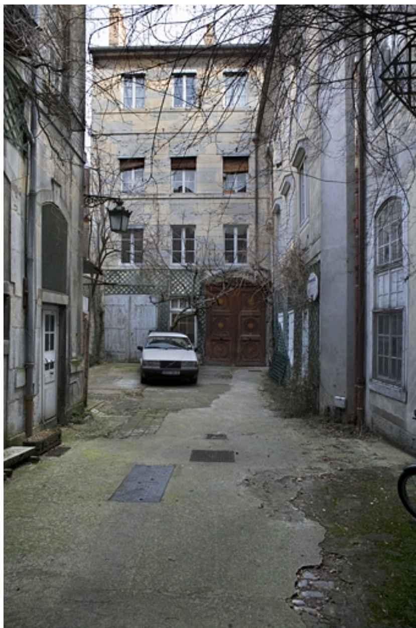
Vue d'ensemble des logis secondaires au fond de la deuxième cour.