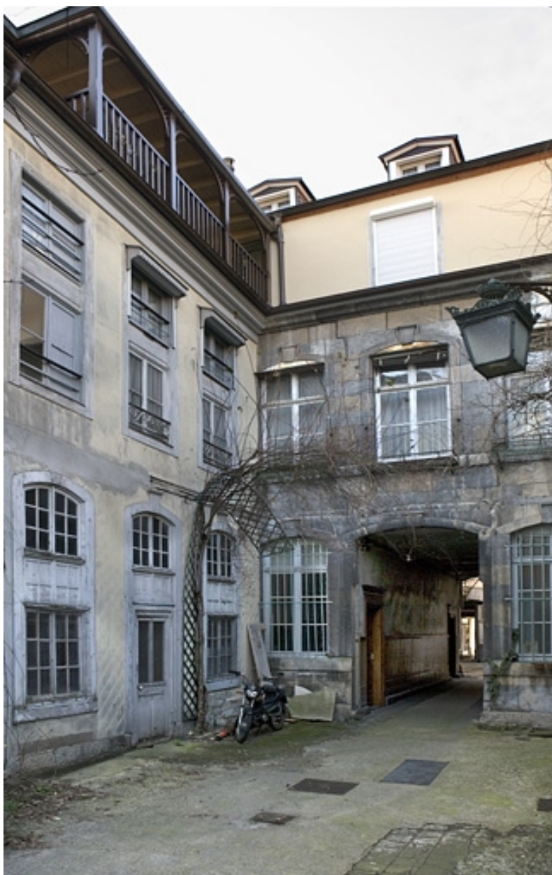
Façade postérieure et aile droite du premier logis secondaire depuis le fond de la deuxième cour.