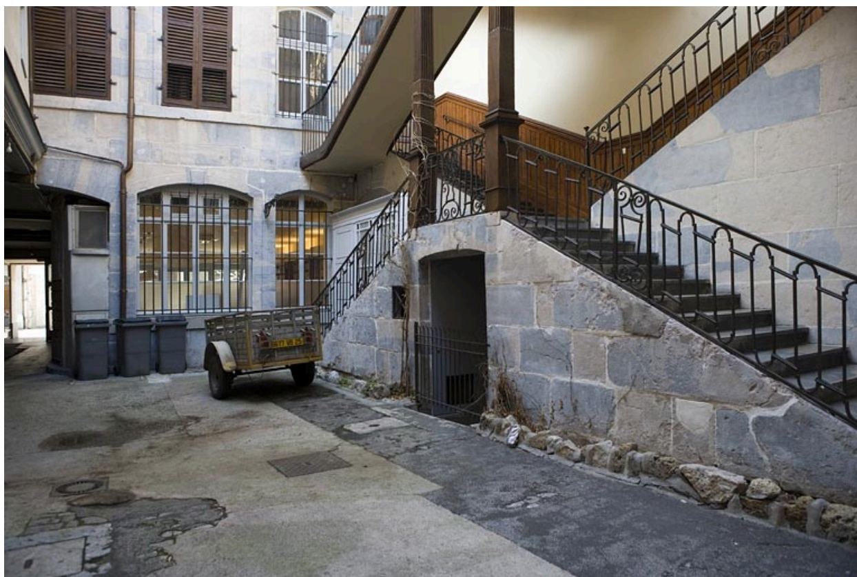
Détail de la première volée de l'escalier à cage ouverte depuis le fond de la première cour.