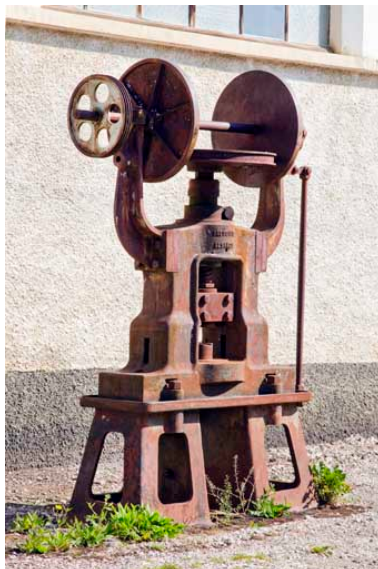
Vue de trois quarts gauche. IVR43_20132501260NUC2A