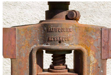
Inscription. IVR43_20132501262NUC2A