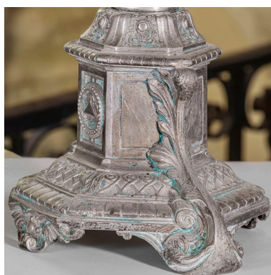
Détail du socle. IVR26_20248900264NUC4A