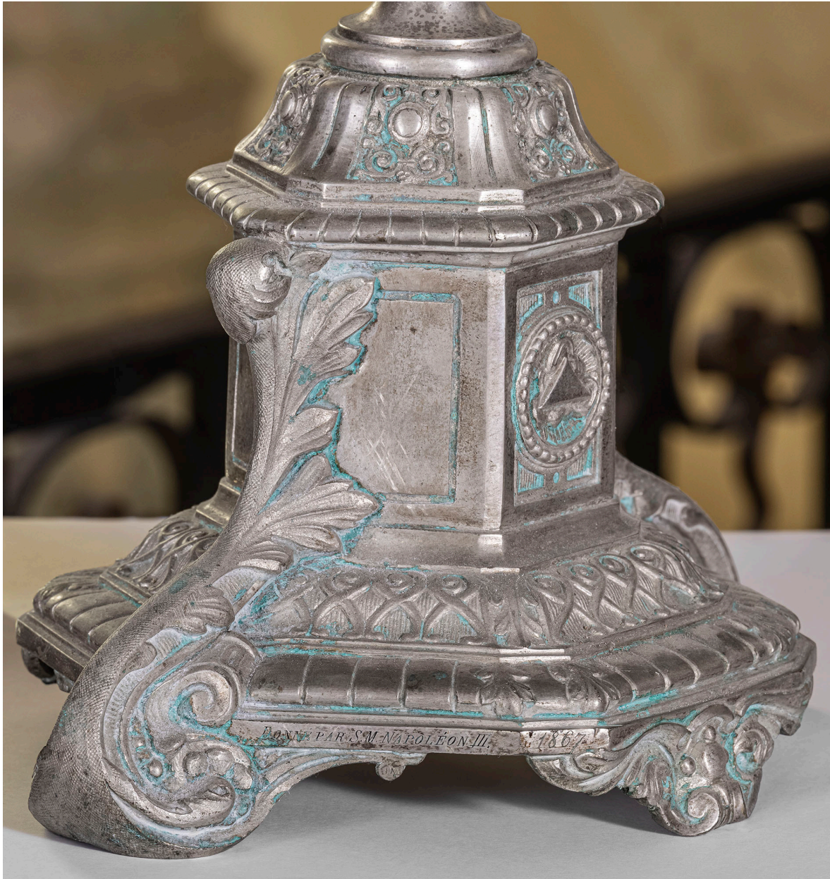
Détail de la base.