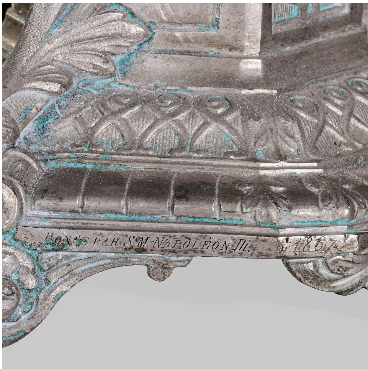
Détail de la base : inscription.