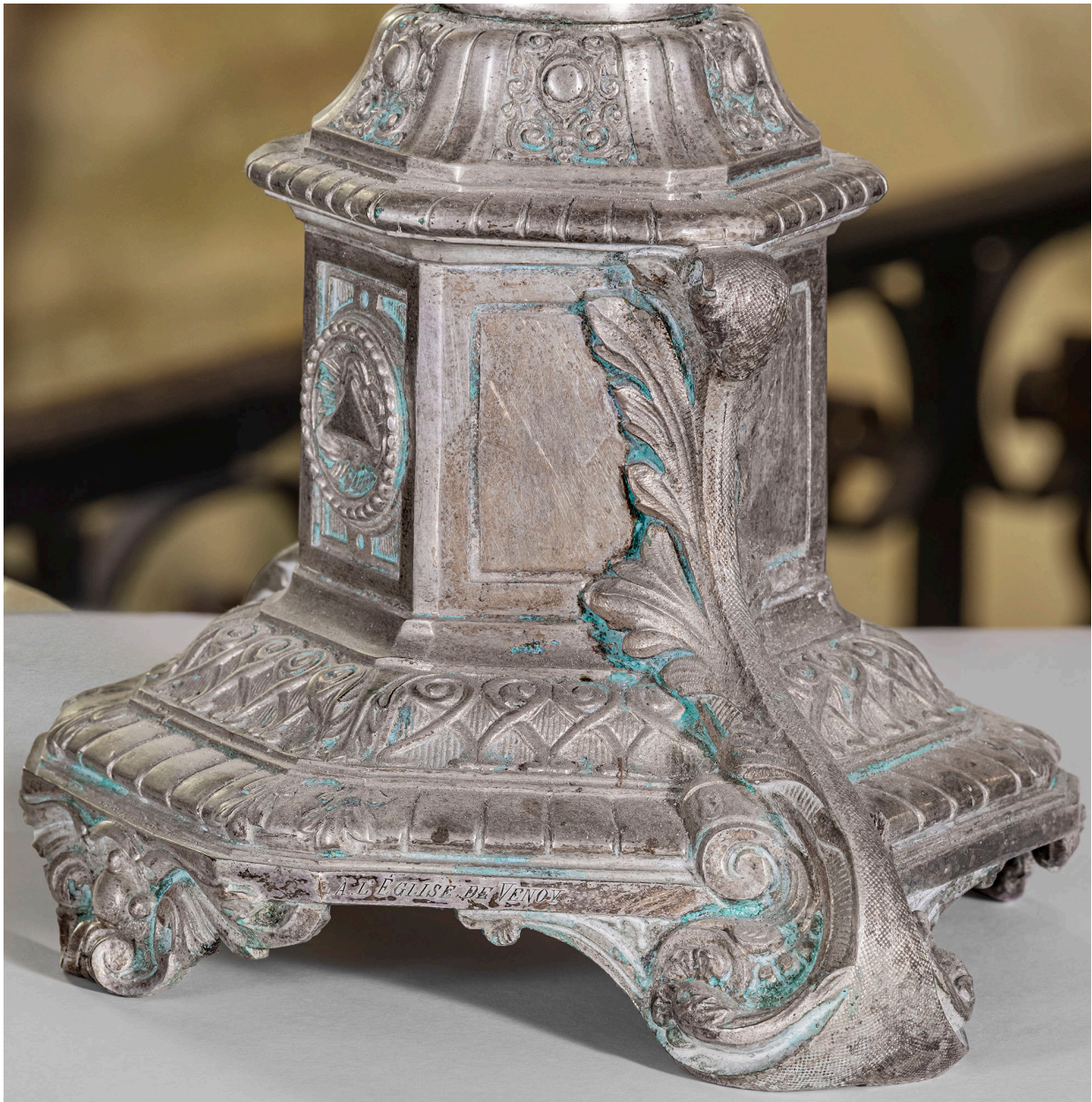
Détail du socle.