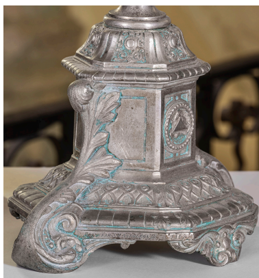
Détail de la base. IVR26_20248900262NUC4A