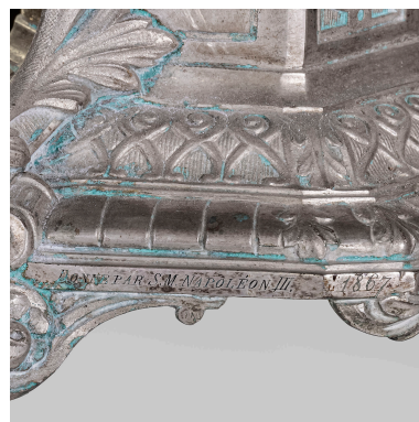
Détail de la base : inscription. IVR26_20248900263NUC4A