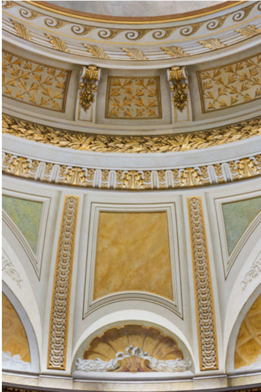
Peinture d'une travée de la coupole.