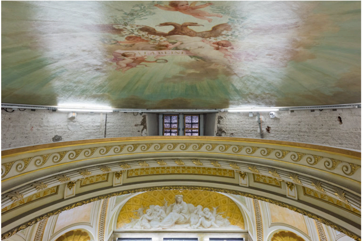
Calotte peinte et ouverture zénithale de la coupole, avec vue sur l'allégorie de l'Hiver.