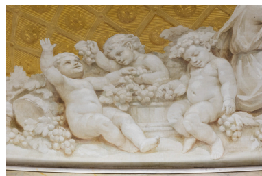
Allégorie de l'Automne : détail (putti et grappes de raisin). IVR26_20257100270NUC4A