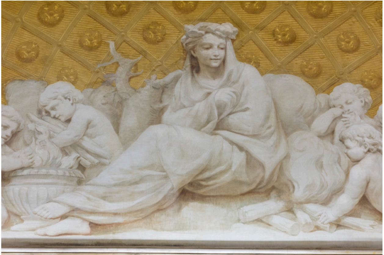
Allégorie de l'Hiver : détail.