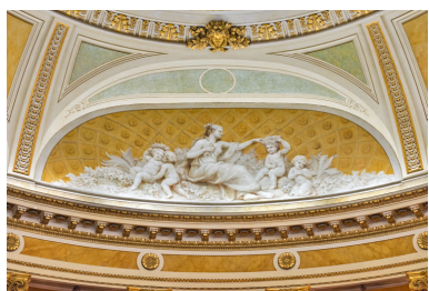
Allégorie du Printemps (côté cour). IVR26_20257100266NUC4A