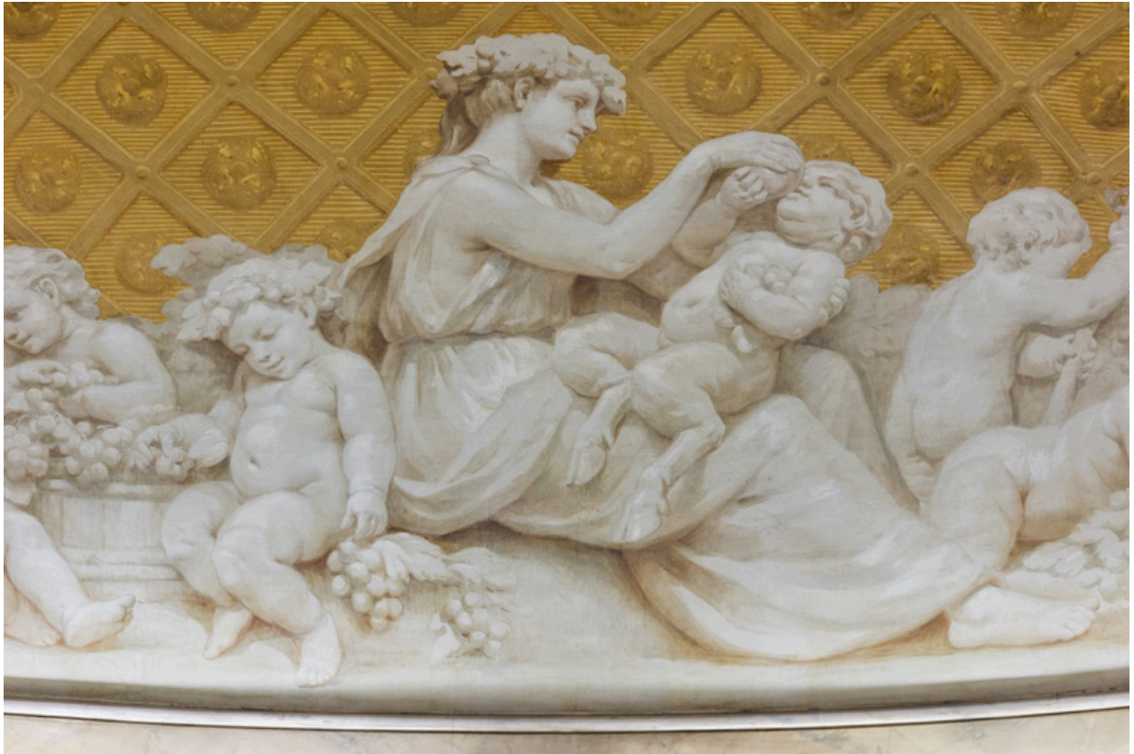
Allégorie de l'Automne : détail (femme faisant boire un jeune faune).