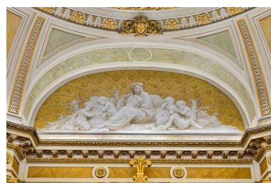
Allégorie de l'Hiver (au- dessus du cadre de scène). IVR26_20257100267NUC4A