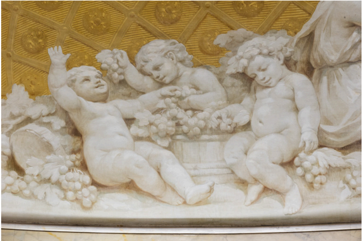
Allégorie de l'Automne : détail (putti et grappes de raisin).