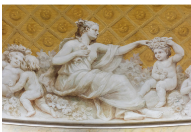
Allégorie du Printemps : détail. IVR26_20257100274NUC4A