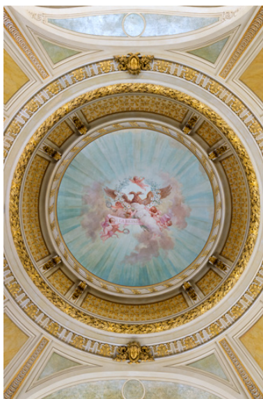
Décor de la calotte. IVR26_20257100279NUC4A