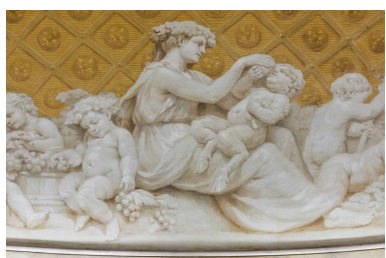
Allégorie de l'Automne : détail (femme faisant boire un jeune faune). IVR26_20257100271NUC4A