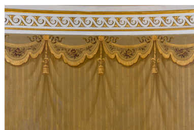
Draperies peintes sur le mur de la galerie.