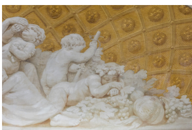
Allégorie de l'Automne : détail (putto endormi et nature morte). IVR26_20257100272NUC4A