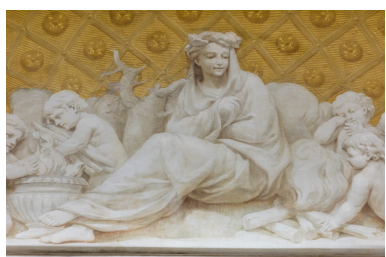
Allégorie de l'Hiver : détail. IVR26_20257100273NUC4A