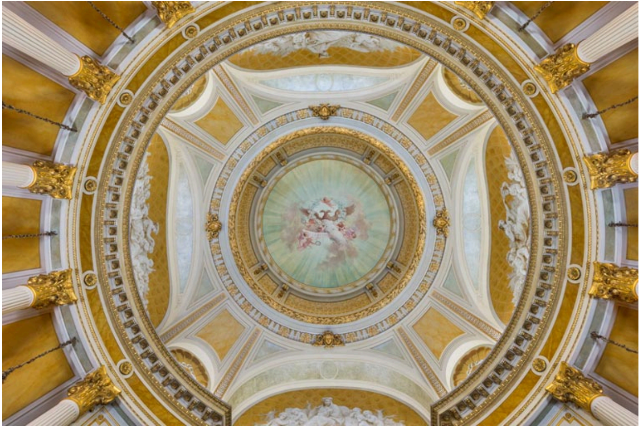
Vue d'ensemble de la coupole et de la calotte.