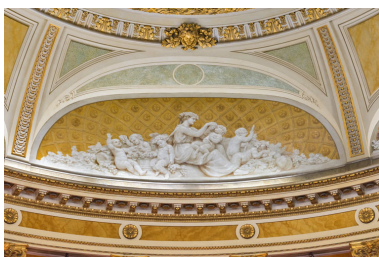
Allégorie de l'Automne (côté jardin). IVR26_20257100268NUC4A