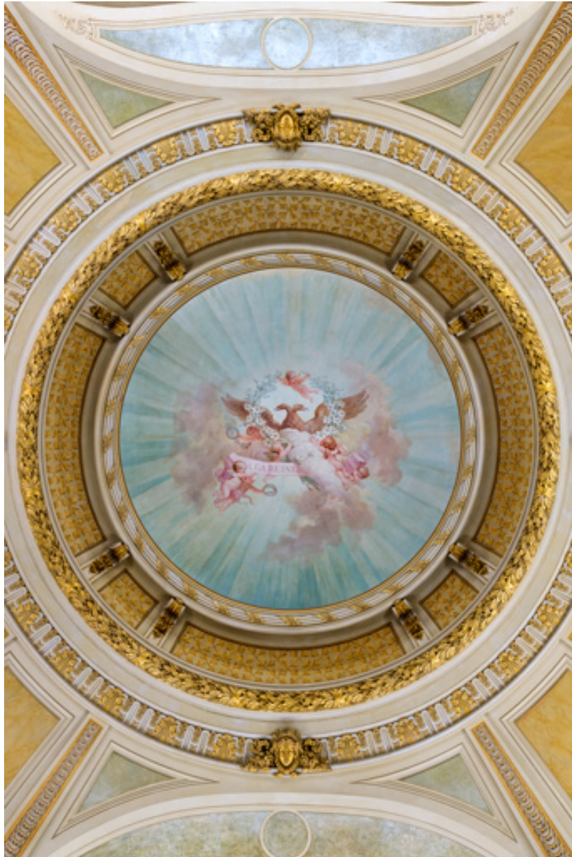
Décor de la calotte.