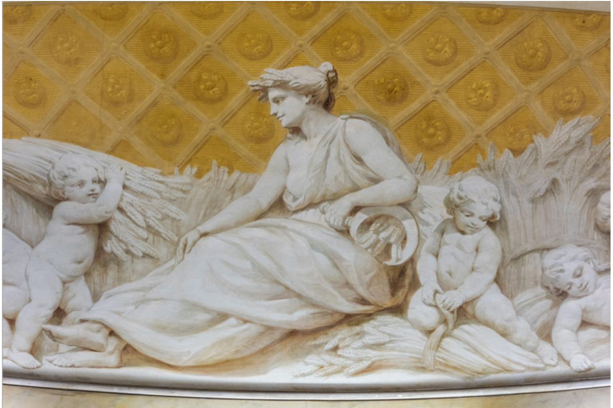
Allégorie de l'Eté : détail.