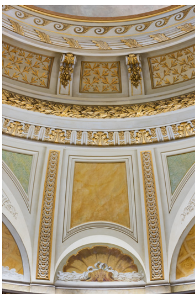
Peinture d'une travée de la coupole. IVR26_20257100278NUC4A