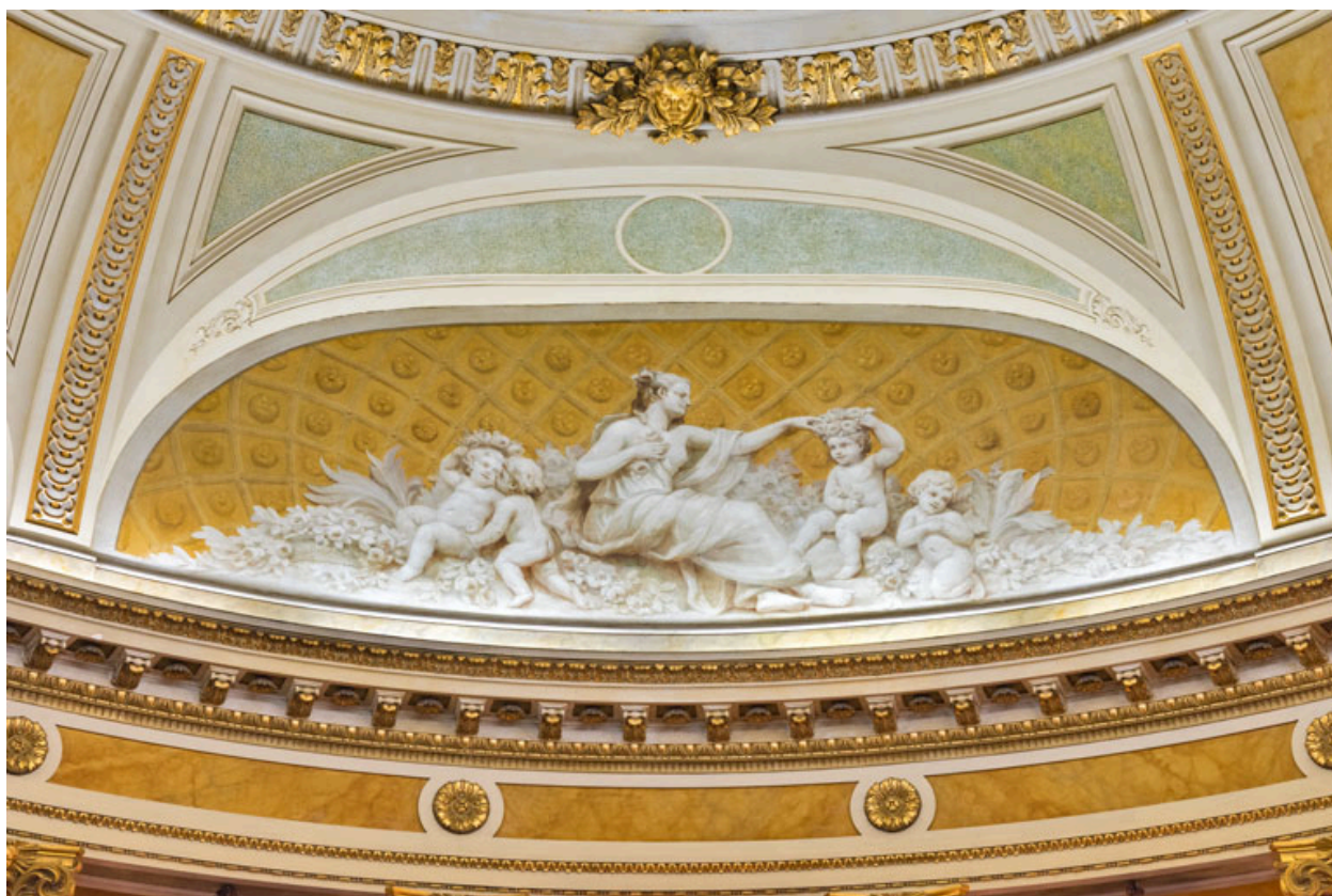
Allégorie du Printemps (côté cour).