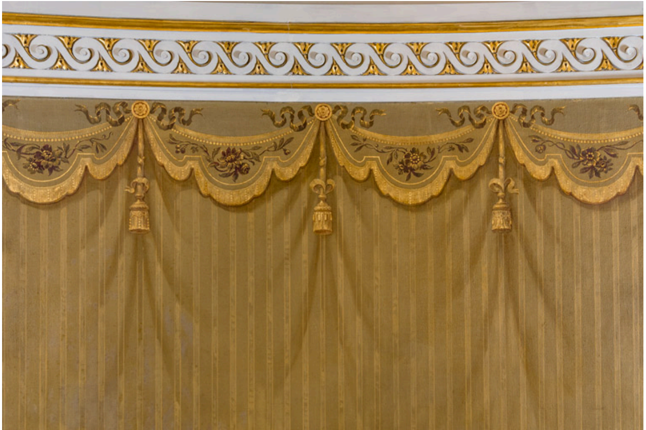
Draperies peintes sur le mur de la galerie.