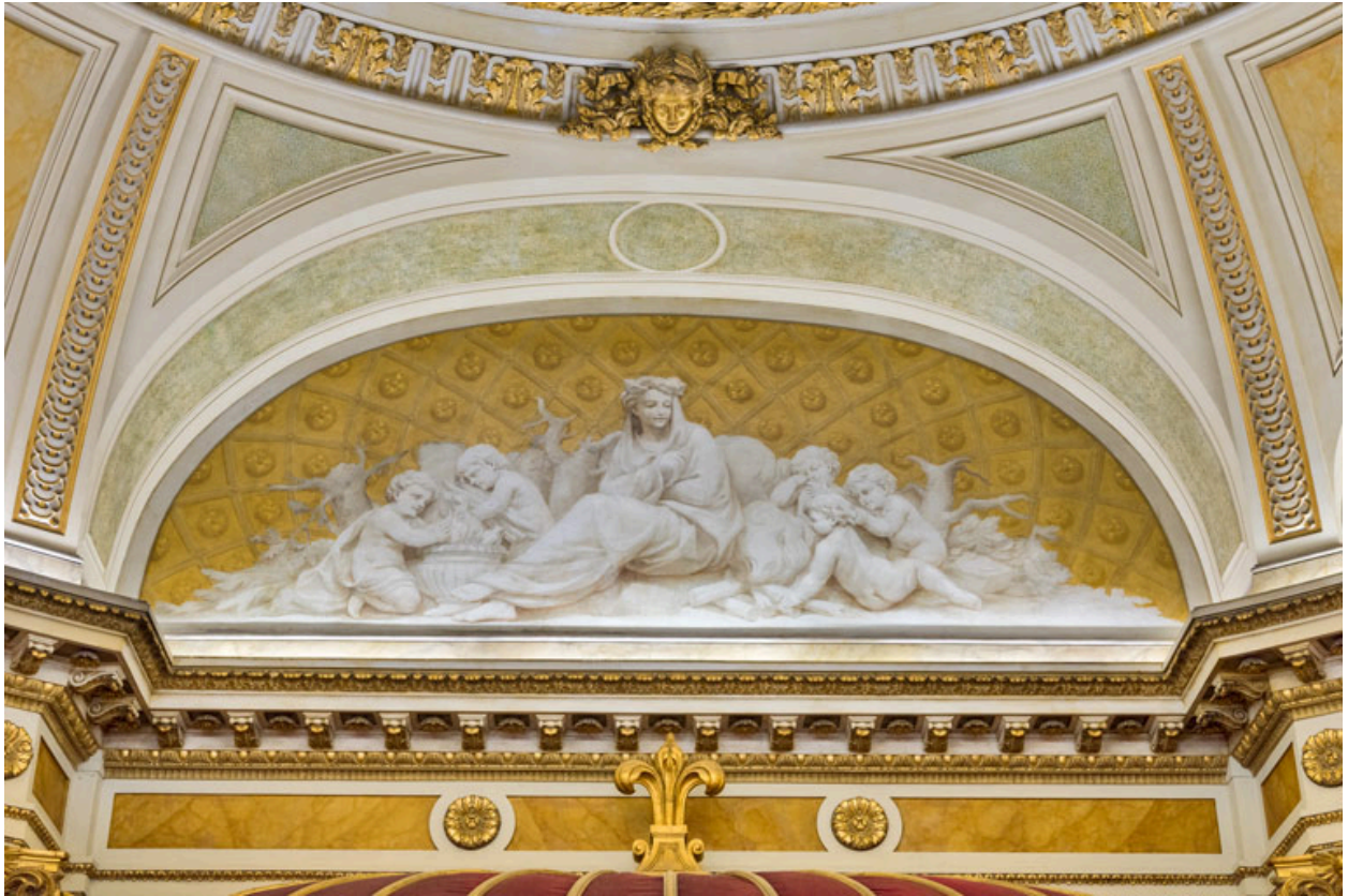
Allégorie de l'Hiver (au-dessus du cadre de scène).