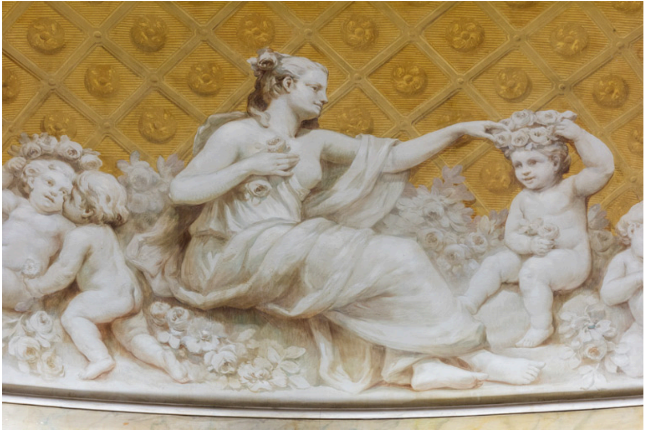
Allégorie du Printemps : détail.