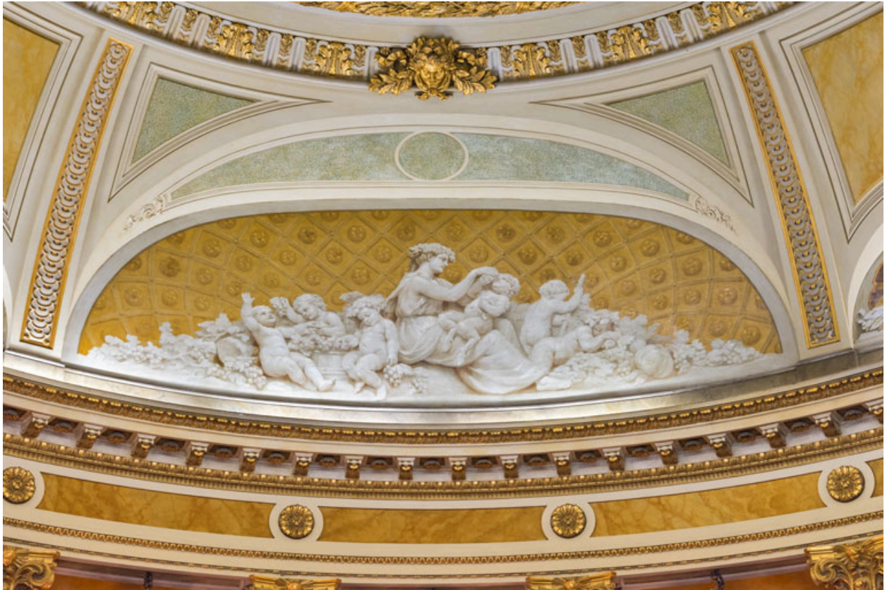
Allégorie de l'Automne (côté jardin).