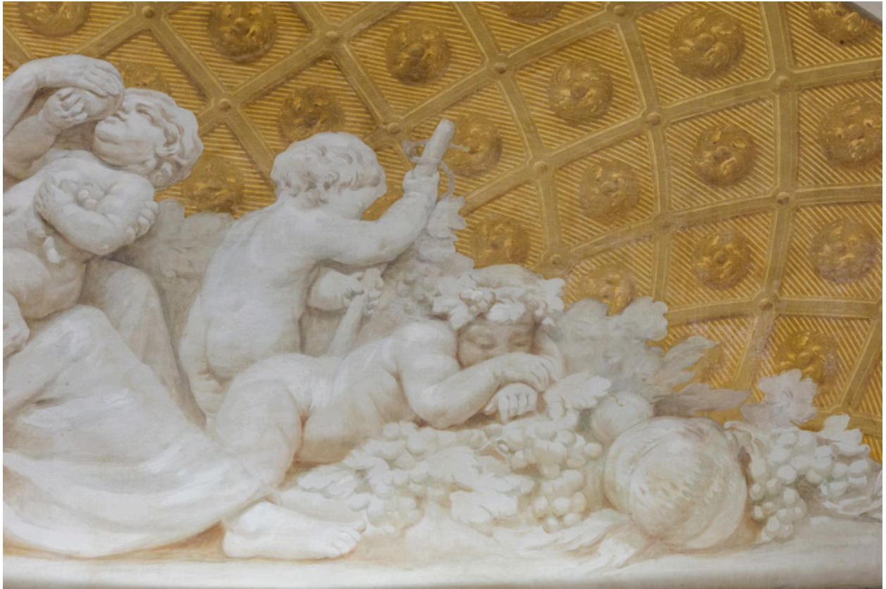
Allégorie de l'Automne : détail (putto endormi et nature morte).