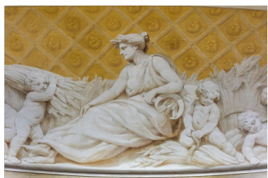
Allégorie de l'Eté : détail. IVR26_20257100275NUC4A