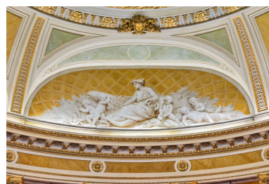
Allégorie de l'Eté (en fond de salle).