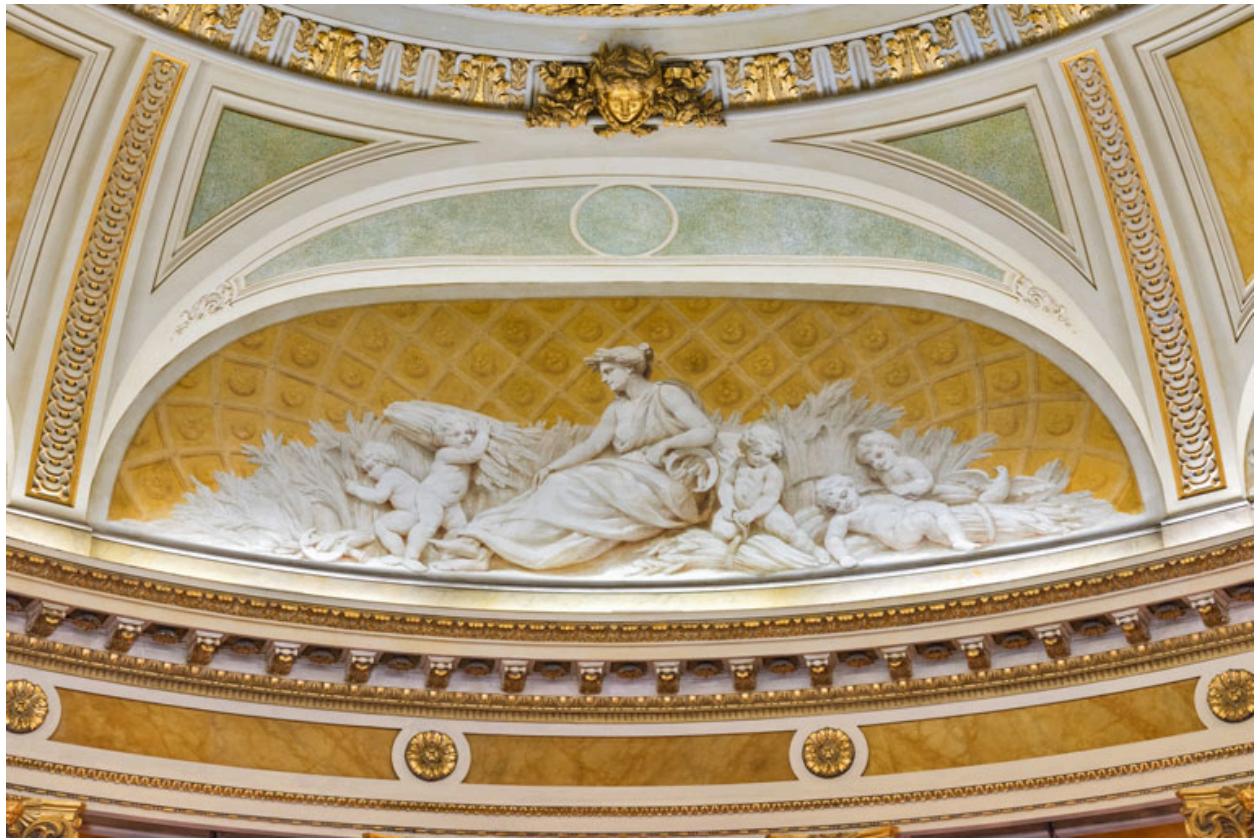
Allégorie de l'Eté (en fond de salle).