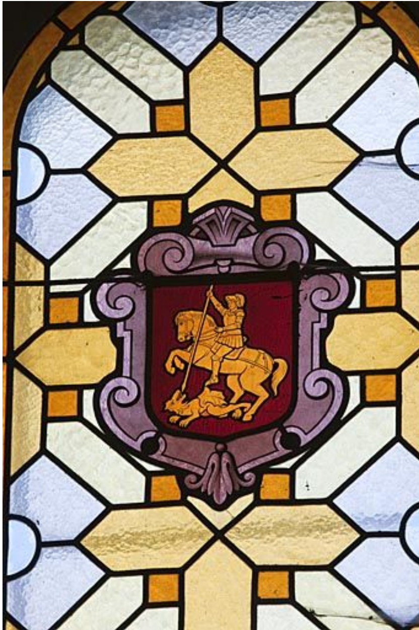
Armoiries de la confrérie de saint Georges.