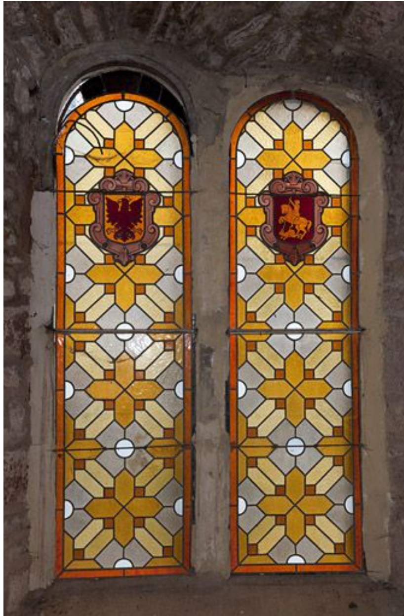
Vue générale : armoiries de la famille de Rougemont et de la confrérie de saint Georges.