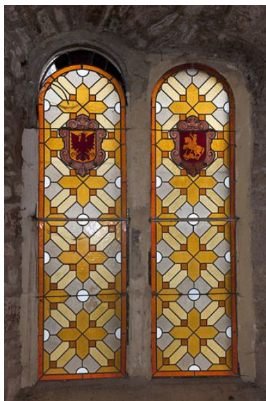
Vue générale : armoiries de la famille de Rougemont et de la confrérie de saint Georges. IVR43_20112500388NUC4A