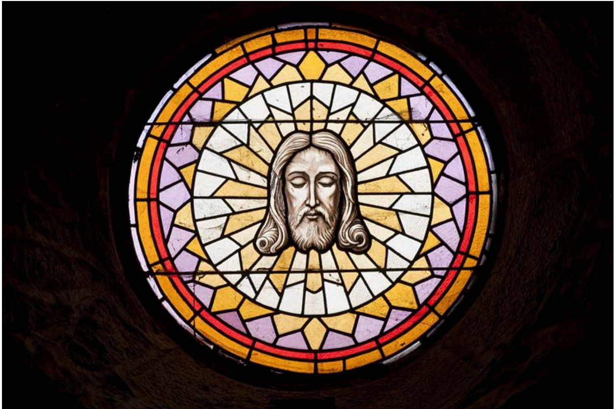
Verrière fermant l'oculus : tête du Christ.