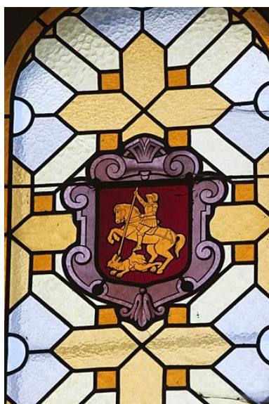
Armoiries de la confrérie de saint Georges. IVR43_20112500330NUC4A