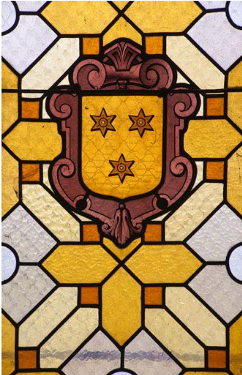
Armoiries de Philibert de Molans.