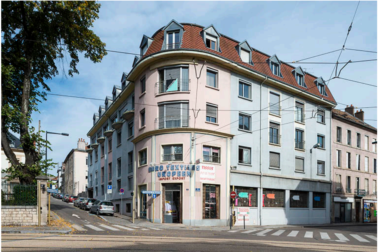
Vue d'ensemble depuis le haut de l'avenue Carnot.