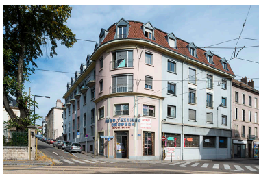
Vue d'ensemble depuis le haut de l'avenue Carnot. IVR43_20172501112NUC4A