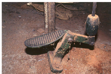
Détail de la pédale. IVR43_20003901014ZA