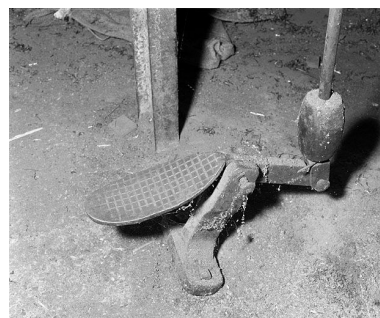
Détail de la pédale. IVR43_20003901013X