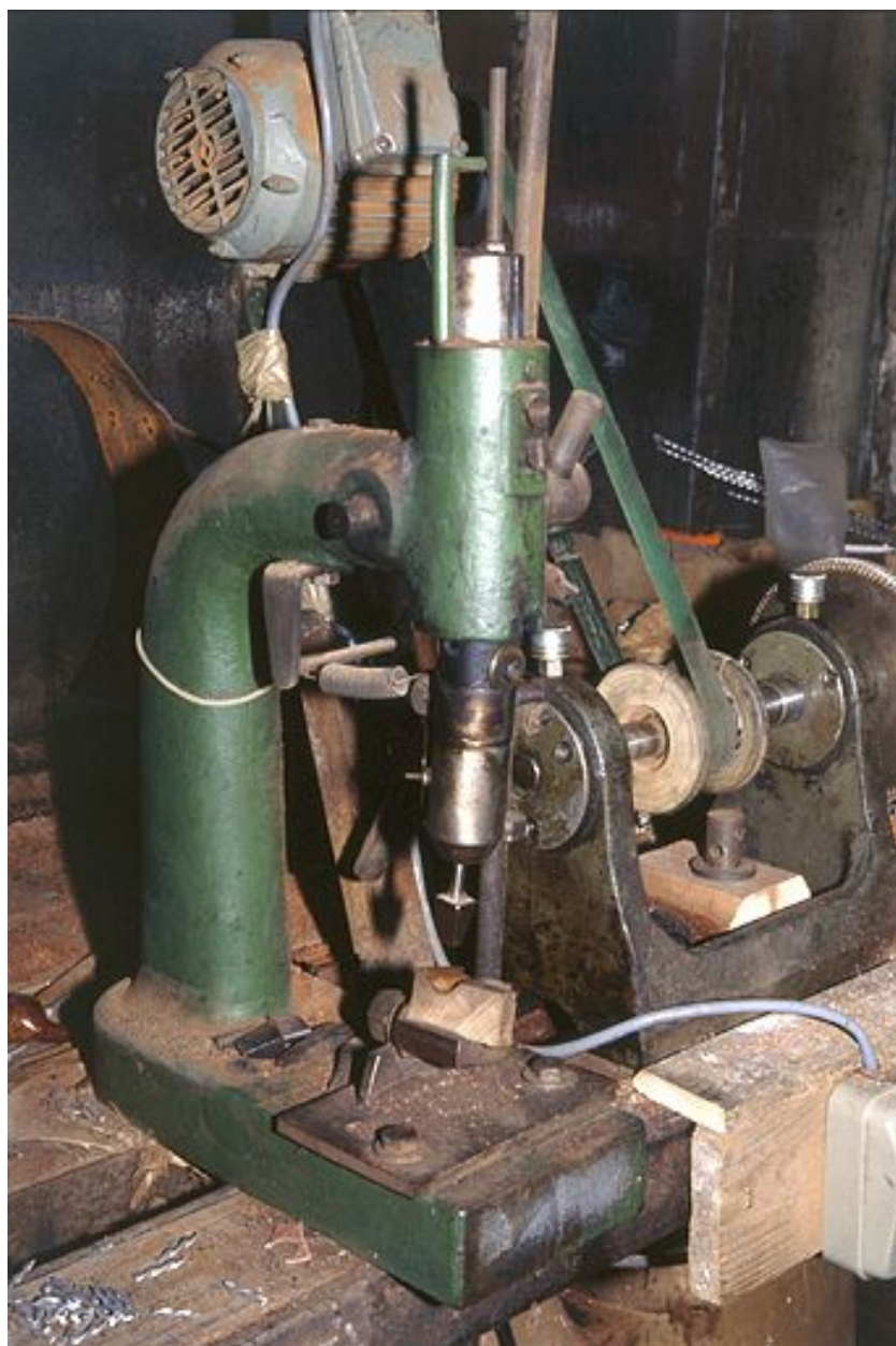
Vue d'ensemble rapprochée.