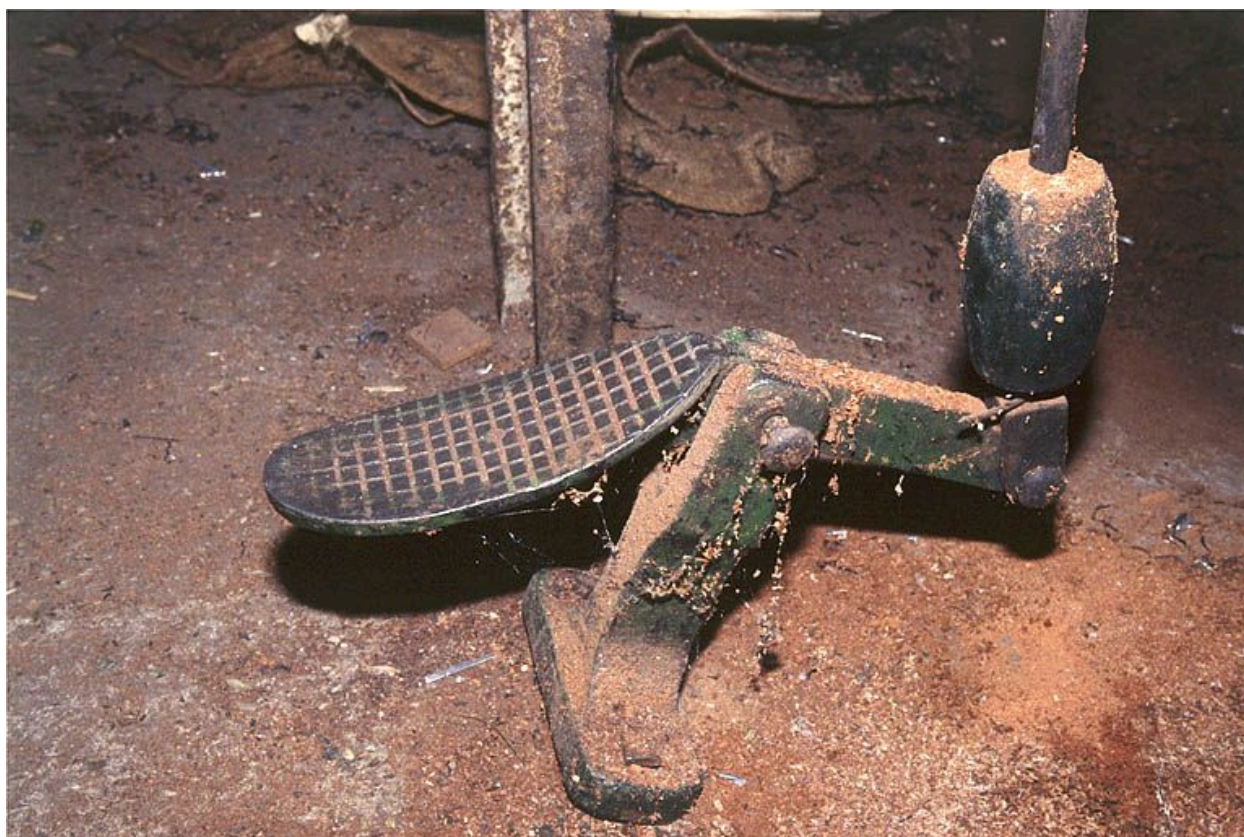
Détail de la pédale.