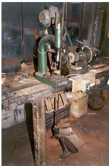
Vue d'ensemble.