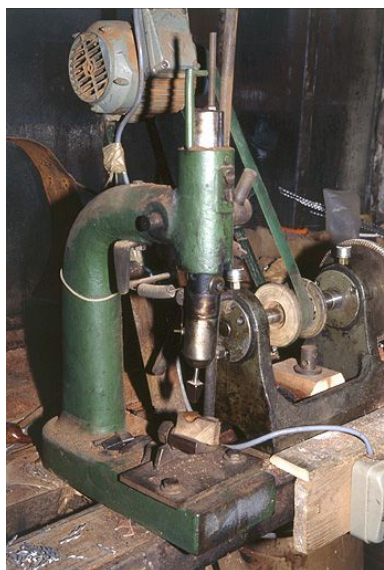
Vue d'ensemble rapprochée. IVR43_20003901012ZA