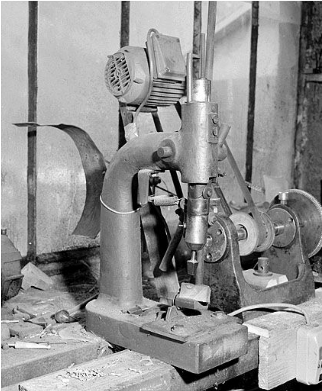
Vue d'ensemble rapprochée.