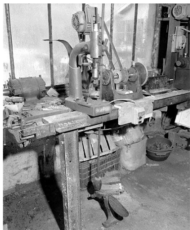
Vue d'ensemble. IVR43_20003901009X