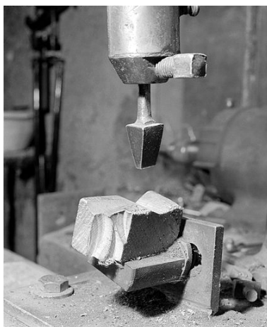
Détail du poinçon et du support de pipe. IVR43_20003901216X