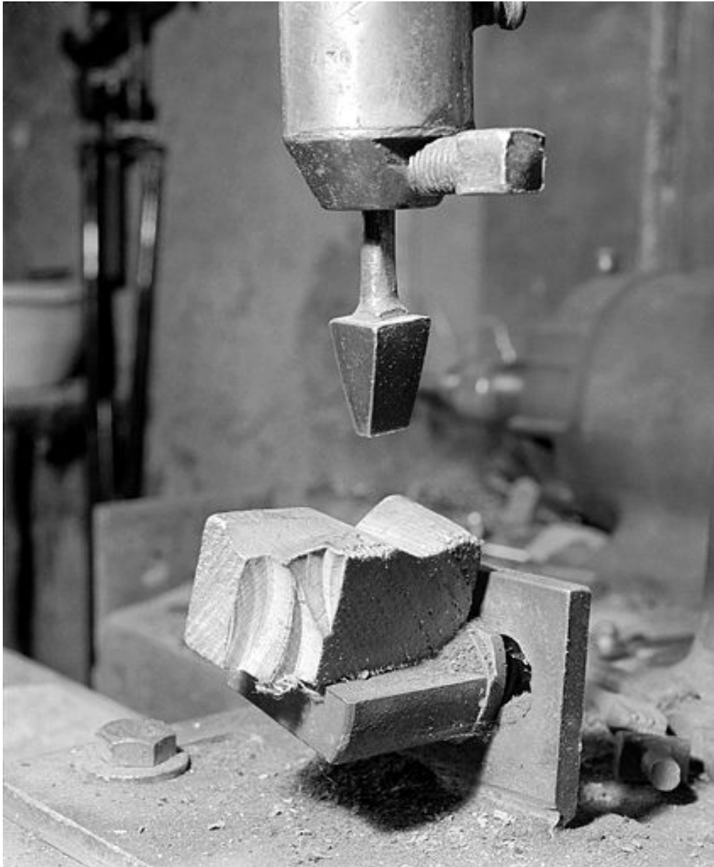
Détail du poinçon et du support de pipe.