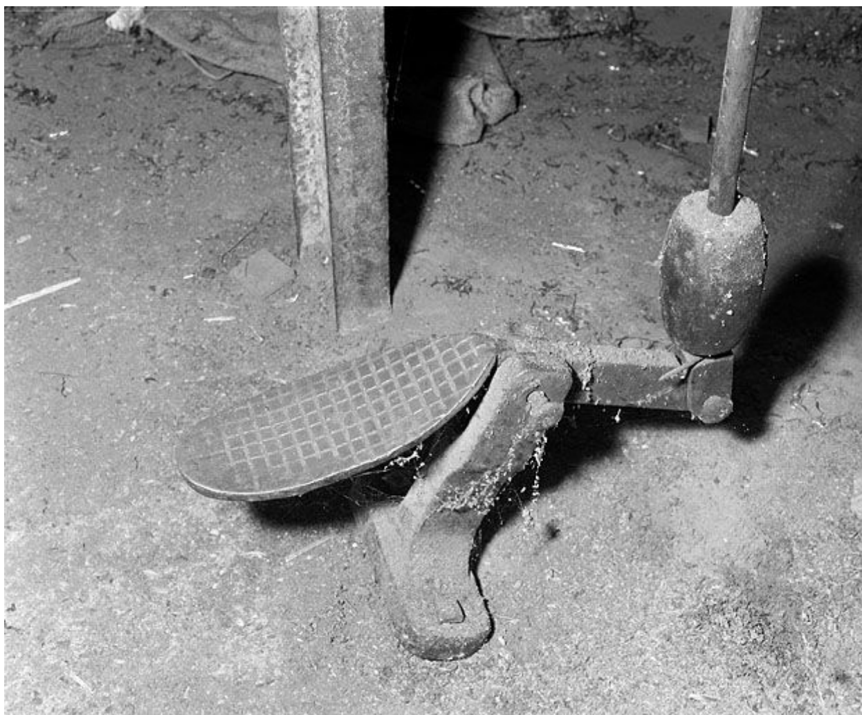
Détail de la pédale.