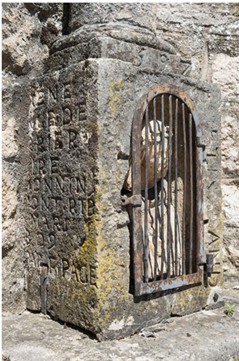
Inscriptions (côté gauche) sur le socle de la croix située au centre du village.