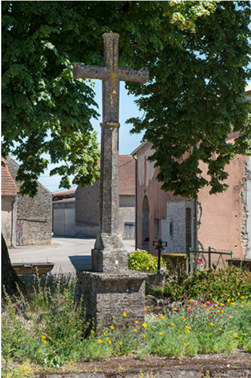
Croix en pierre située à l'extrémité sud du village.