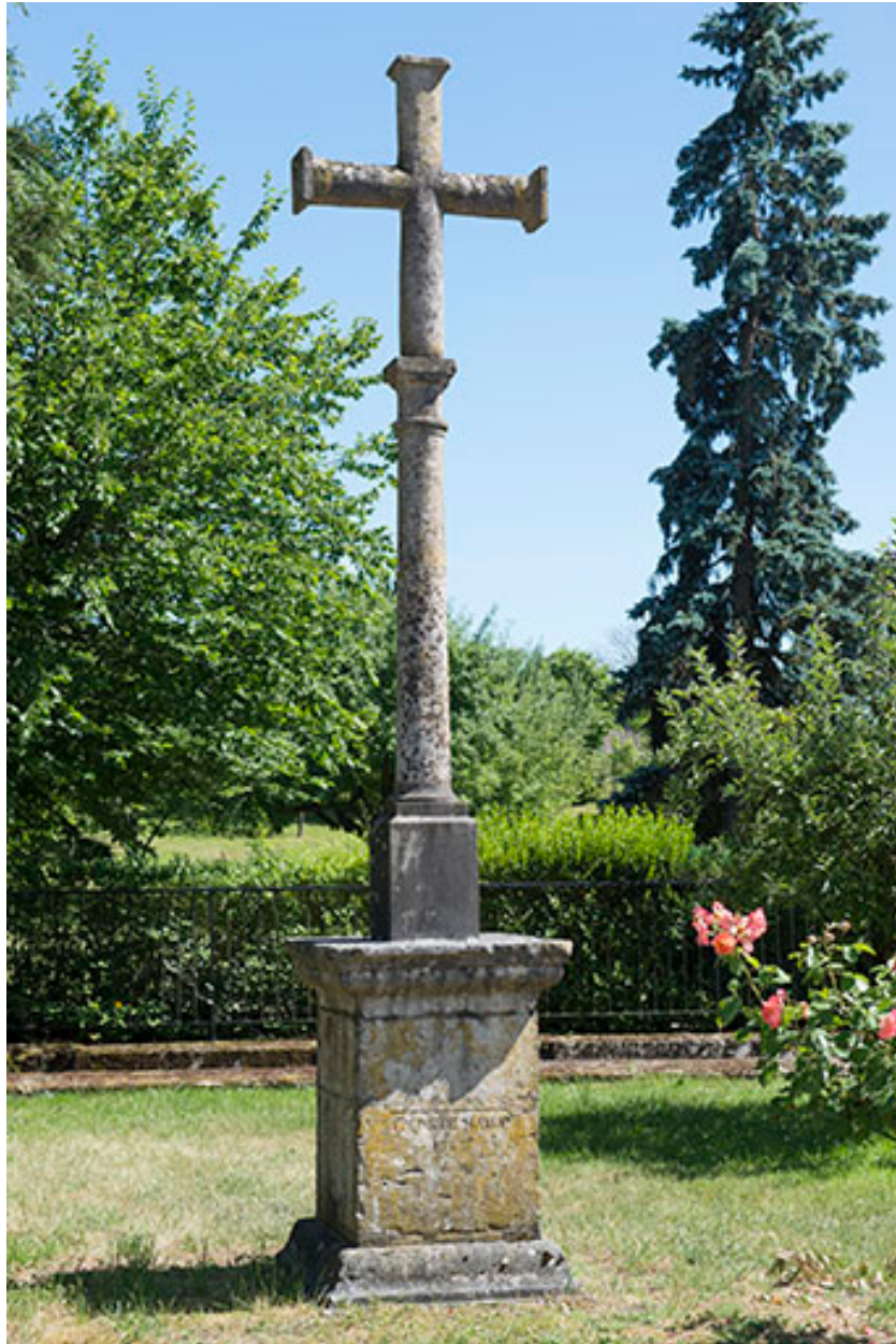
Croix en pierre située route de Port-sur-Saône.