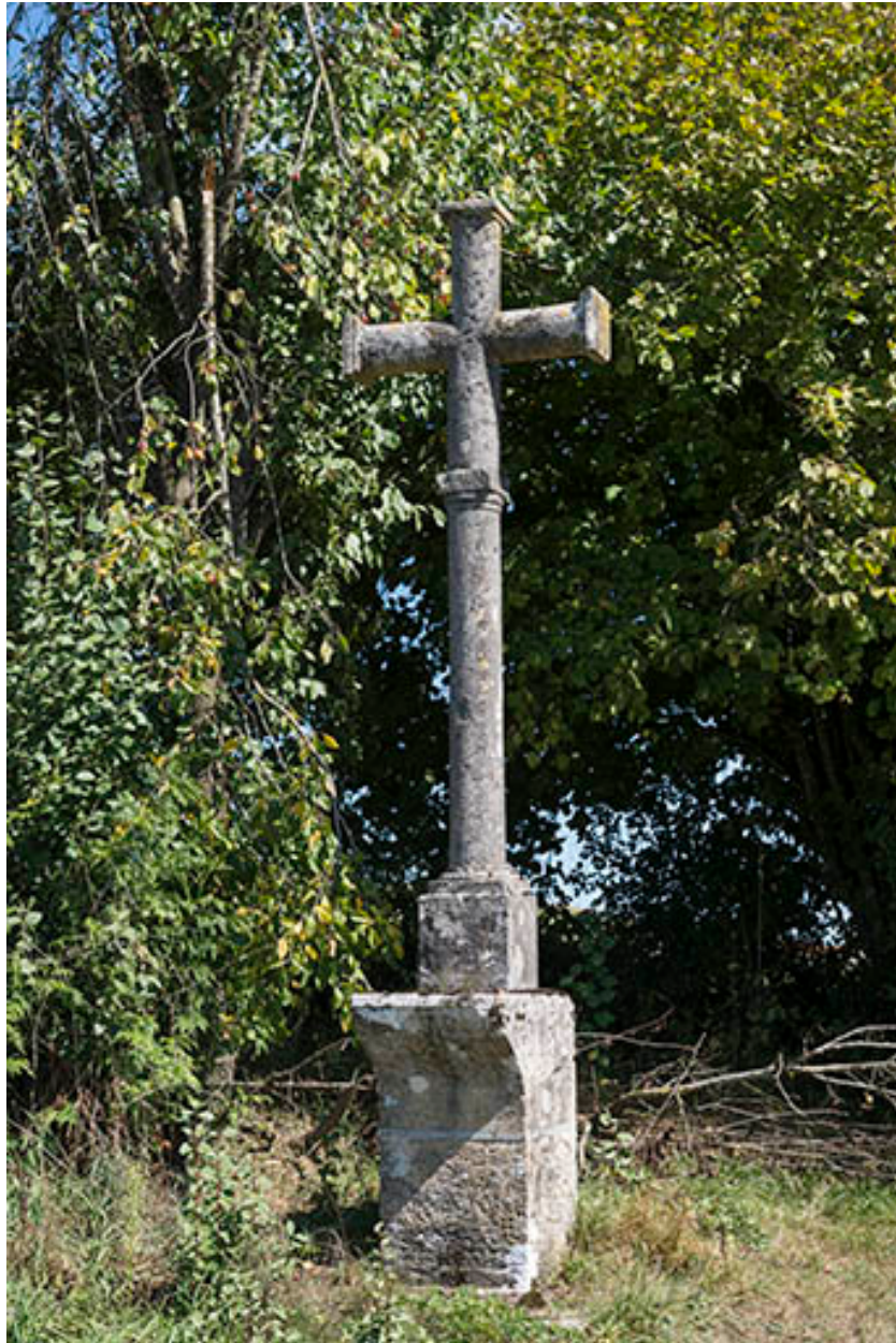
Croix en pierre située rue de la Grande Vie.