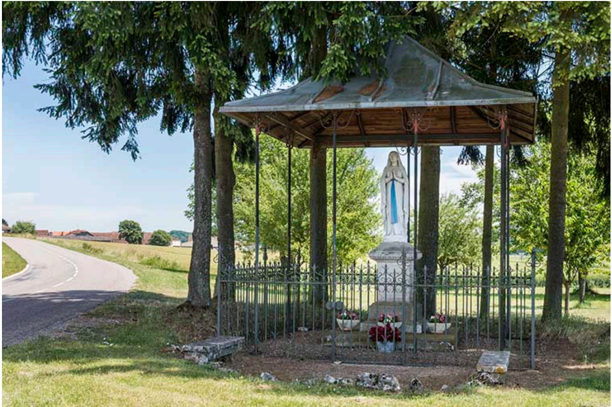
Oratoire de la Vierge situé à l'entrée du village route de Scey-sur-Saône