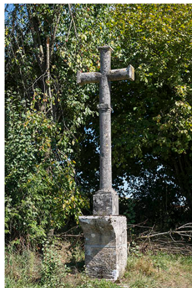
Croix en pierre située rue de la Grande Vie.

IVR43_20177000775NUC4A