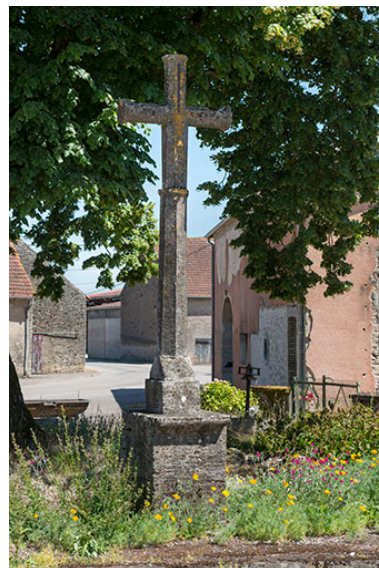
Croix en pierre située à l'extrémité sud du village.

IVR43_20177000798NUC4A