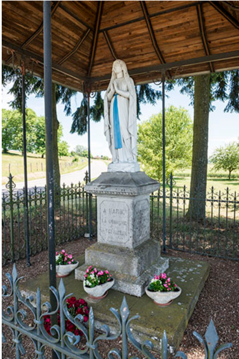
Statue de la Vierge de l'oratoire situé à l'entrée du village route de Scey-sur-Saône.