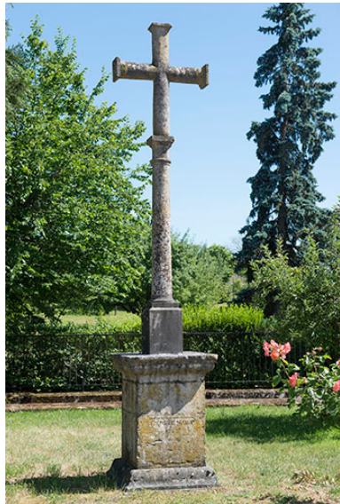
Croix en pierre située route de Port-sur-Saône. IVR43_20177000813NUC4A