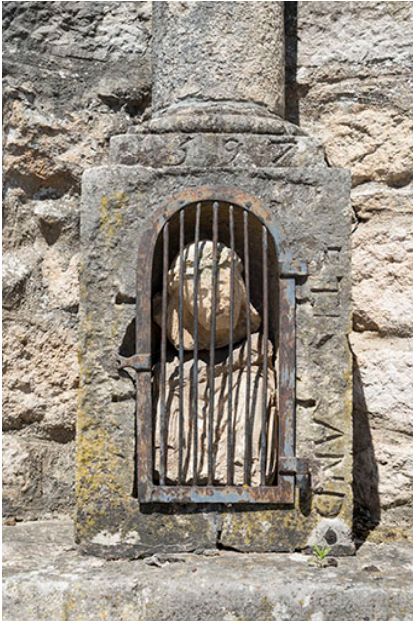
Niche dans le socle de la croix en pierre située au centre du village