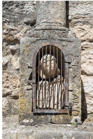
Niche dans le socle de la croix en pierre située au centre du village