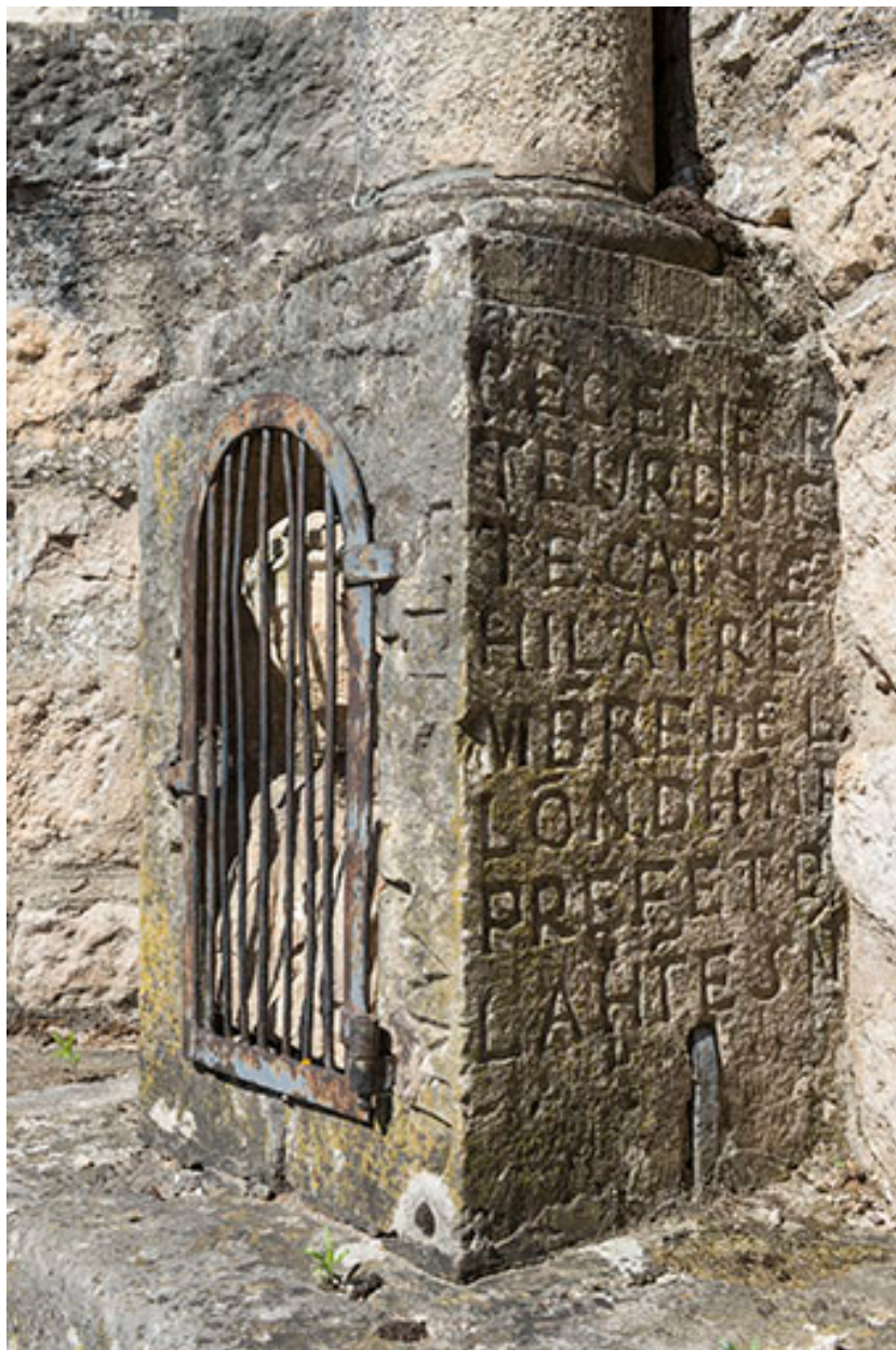
Inscriptions (côté droit) sur le socle de la croix située au centre du village.