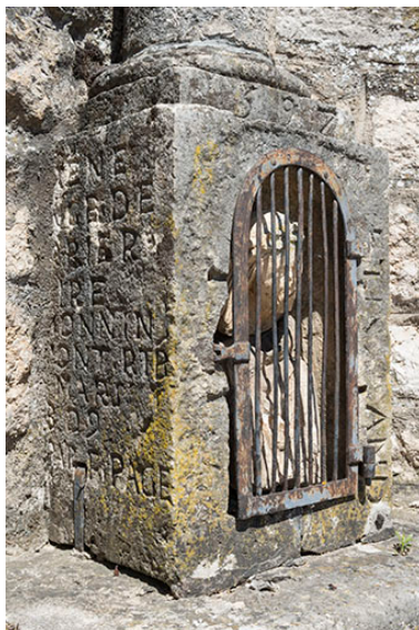
Inscriptions (côté gauche) sur le socle de la croix située au centre du village.

Phot. Jérôme Mongreville IVR43_20177000797NUC4A