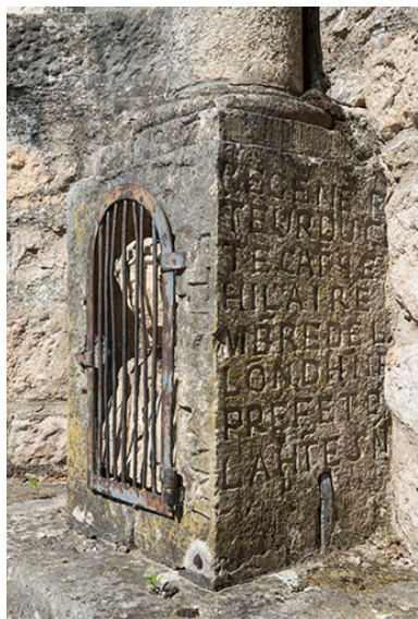
Inscriptions (côté droit) sur le socle de la croix située au centre du village.

IVR43_20177000797NUC4A