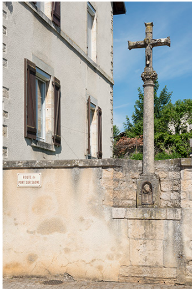
Croix en pierre située au centre du village, à côté de la maison commune.