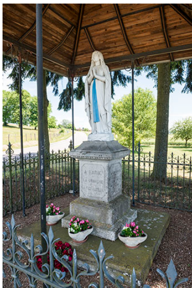
Statue de la Vierge de l'oratoire situé à l'entrée du village route de Scey-sur-Saône.

IVR43_20177000776NUC4A