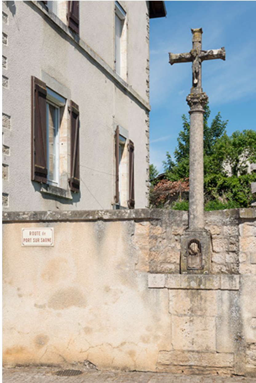
Croix en pierre située au centre du village, à côté de la maison commune.