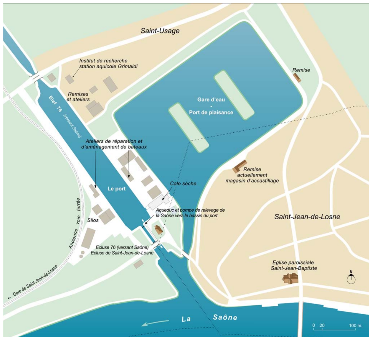
Plan schématique du port et de la gare d'eau.