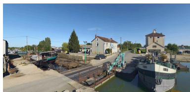
La cale sèche. IVR26_20112103355NUC4A