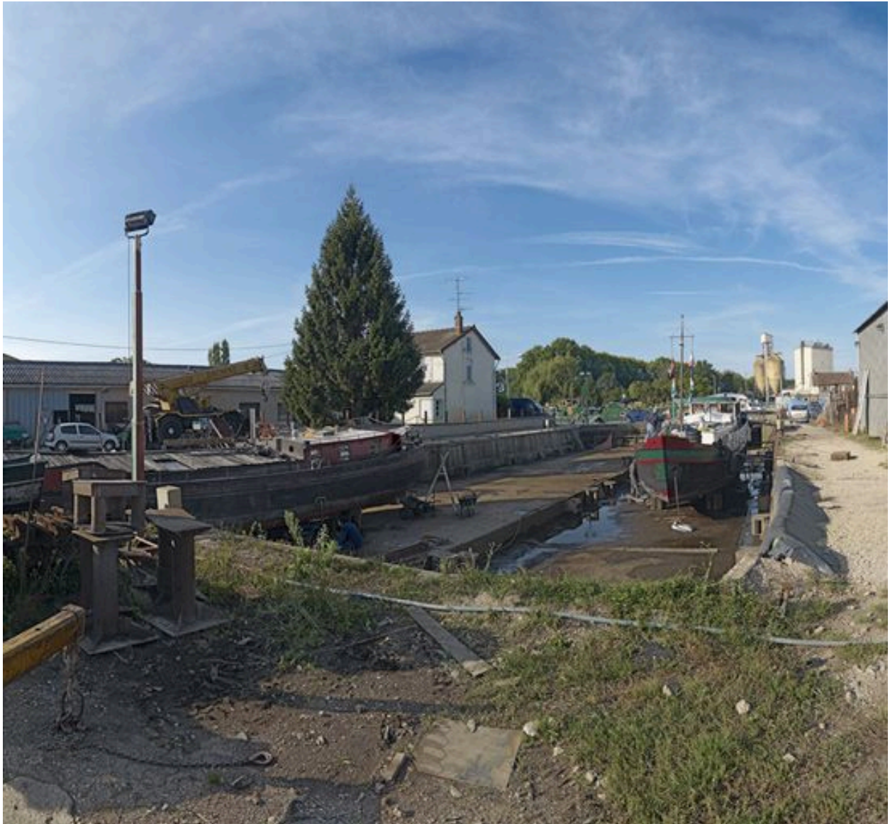
Détail du port : les cales pour réparer ou déchirer les bateaux.