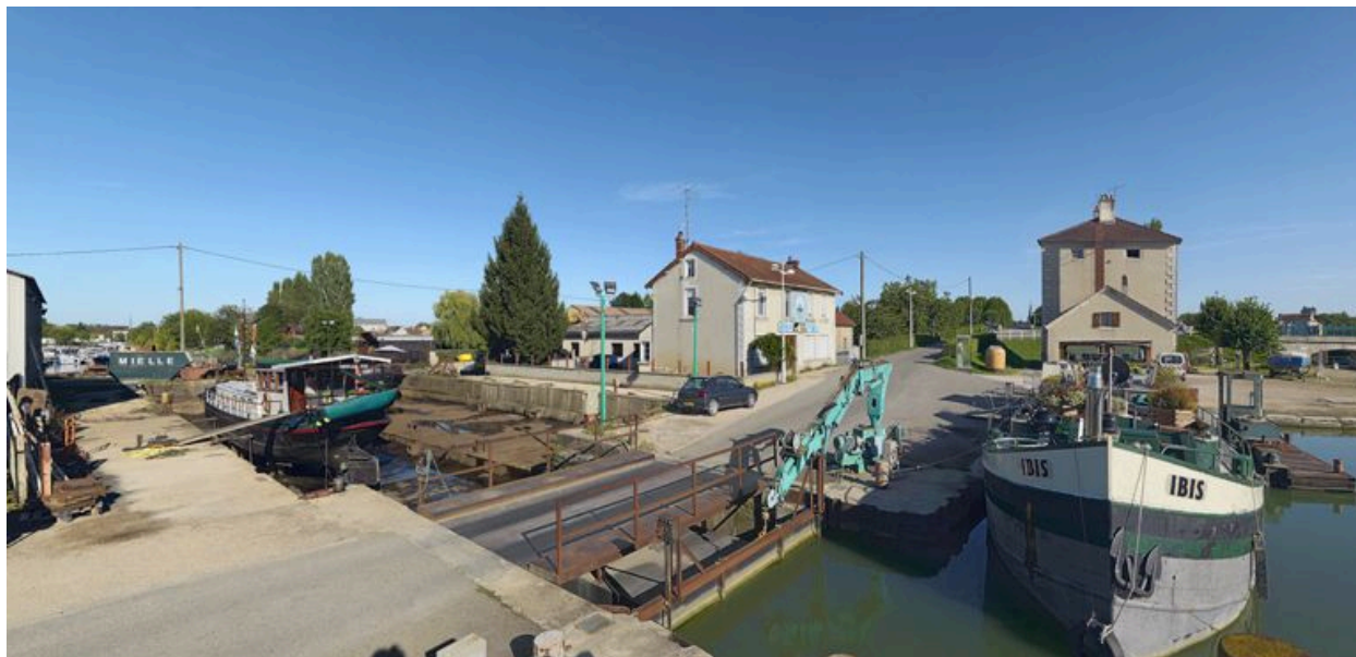
La cale sèche.