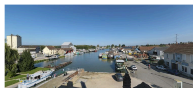
Vue d'ensemble du port prise d'aval. IVR26_20112103351NUC4A