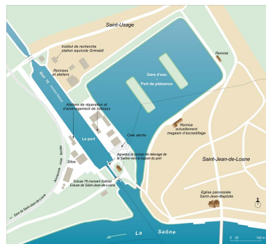
Plan schématique du port et de la gare d'eau. IVR26_20132100098NUDA