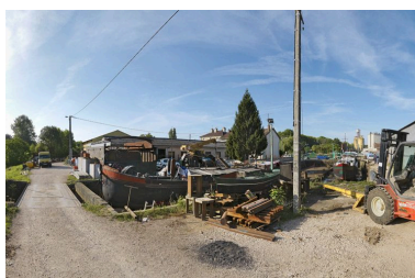
Détail du port : les cales pour réparer ou déchirer les bateaux. IVR26_20112103357NUC4A