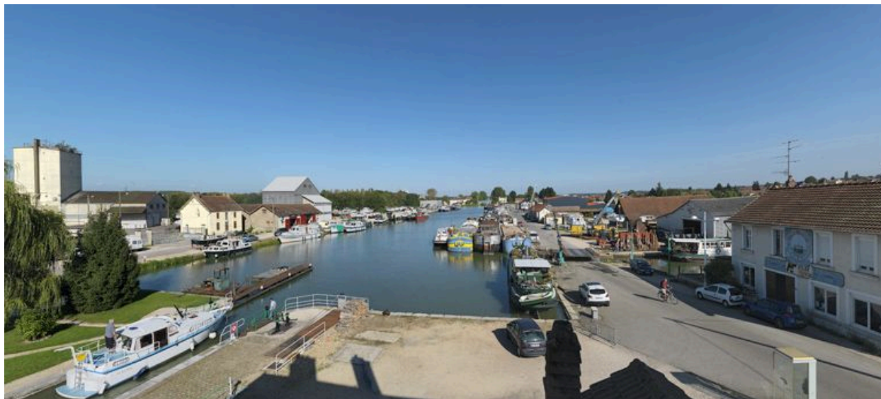
Vue d'ensemble du port prise d'aval.