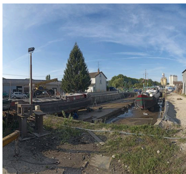
Détail du port : les cales pour réparer ou déchirer les bateaux. IVR26_20112103358NUC4A