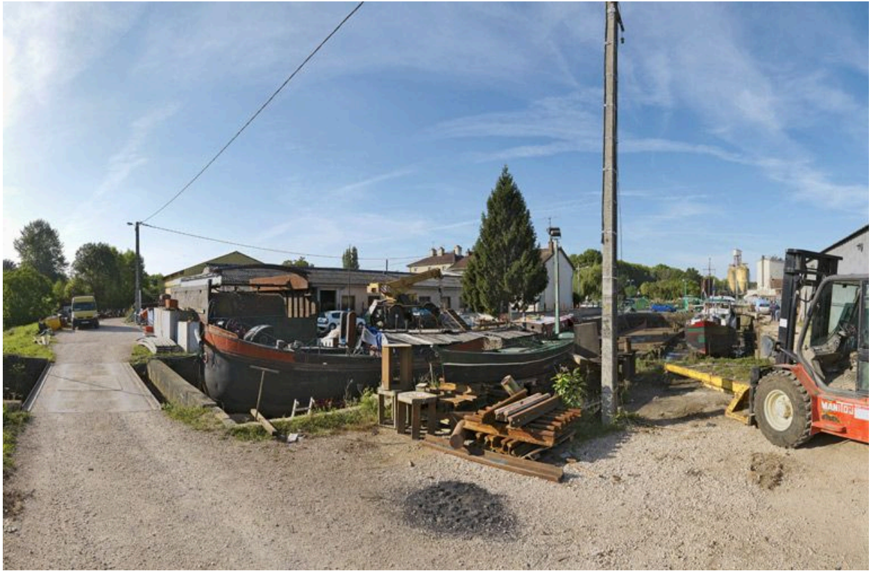
Détail du port : les cales pour réparer ou déchirer les bateaux.