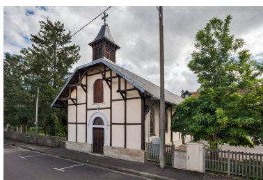
Façade antérieure. Vue de trois quarts. IVR26_20238901088NUC4A

IVR26_20258900139NUDA