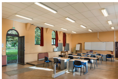
Nef de la chapelle aménagée en salle de formation. Vue de trois quarts en direction du sud-est. IVR26_20238901103NUC4A