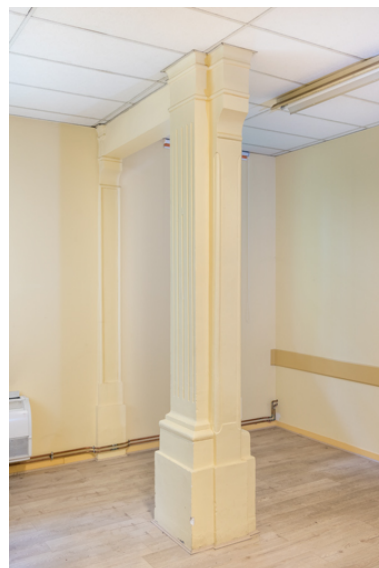
Pilier délimitant l'espace du chœur. Détail. IVR26_20238901102NUC4A