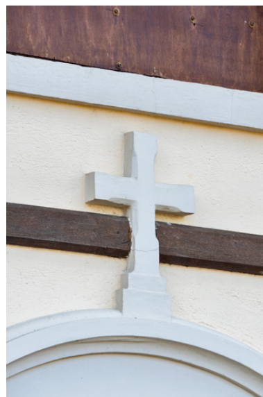
Détail de la croix surmontant la porte de la façade antérieure.