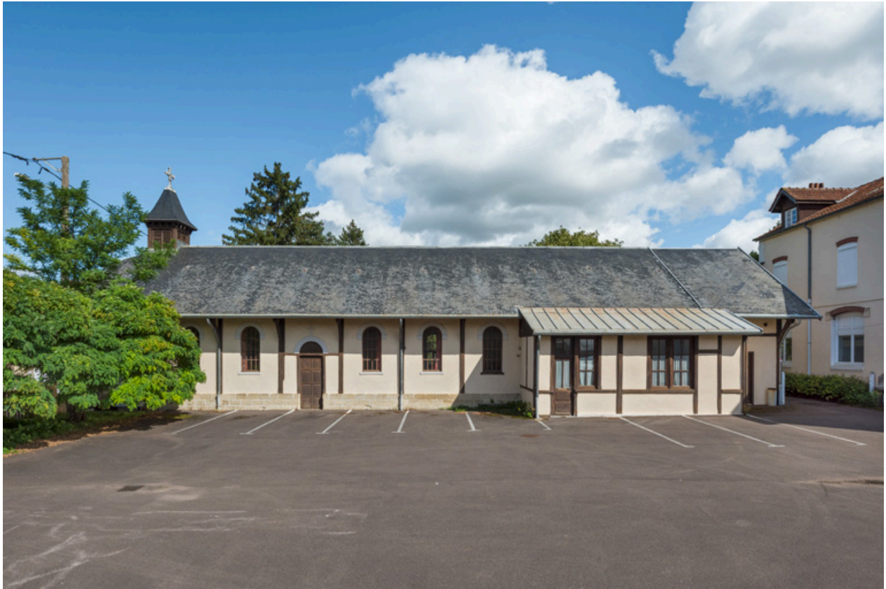
Façade ouest. Vue d'ensemble.