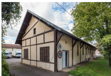
Façades sud et est. Vue de trois quarts. IVR26_20238901100NUC4A