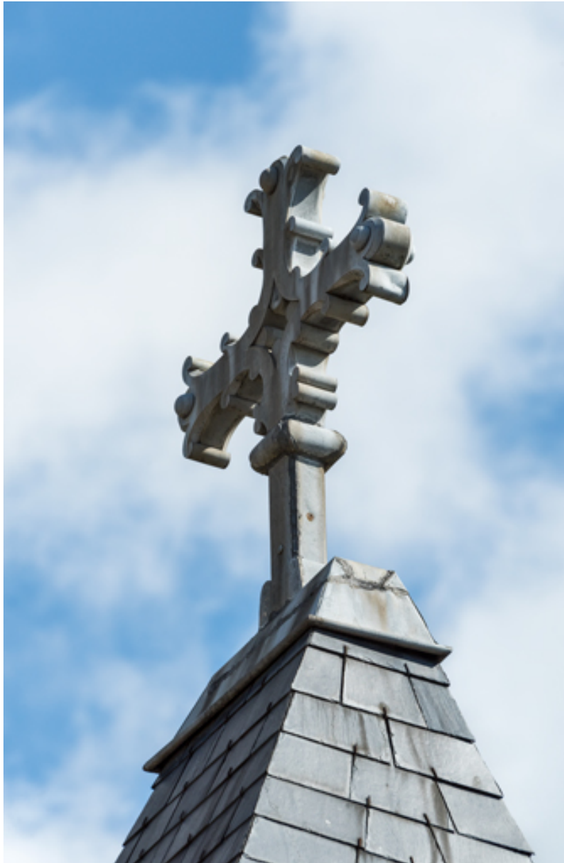
Détail de la croix du campanile.