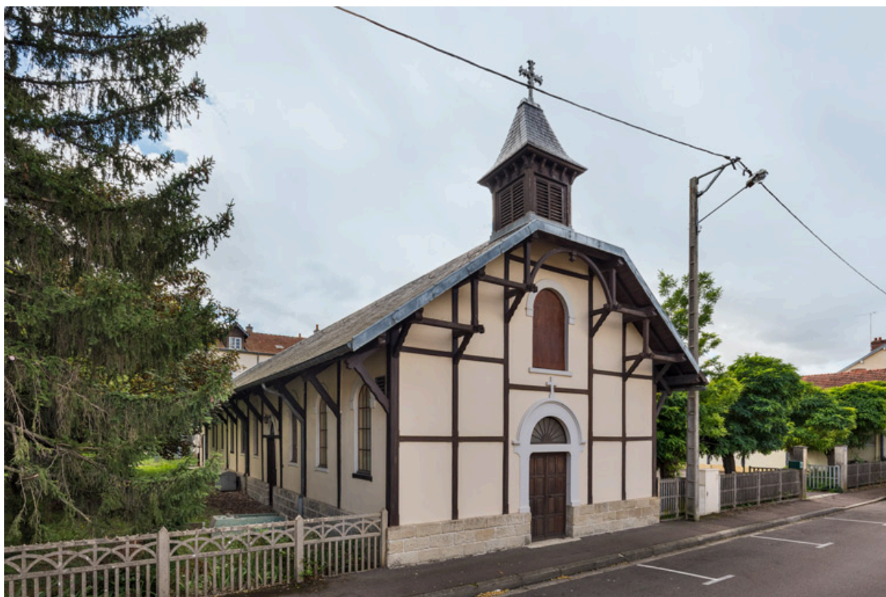
Façades nord (antérieure) et est. Vue de trois quarts.