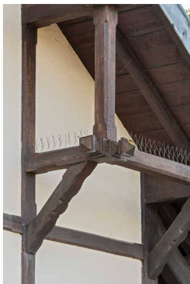
Détail de la charpente en bois. IVR26_20238901091NUC4A