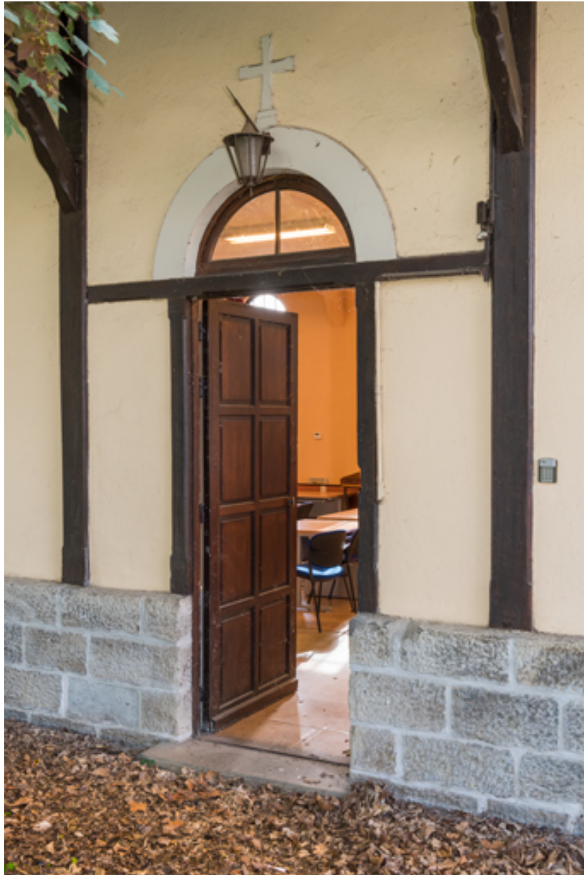
Entrée de la façade est. Vue de trois quarts.