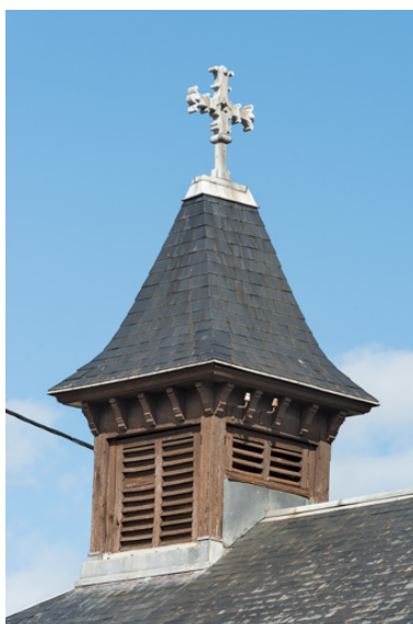
Campanile. Vue de trois quarts. IVR26_20238901096NUC4A