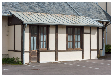
Extension en appentis (sacristie ?). Vue de trois quarts.