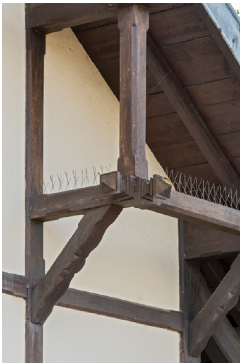
Détail de la charpente en bois.