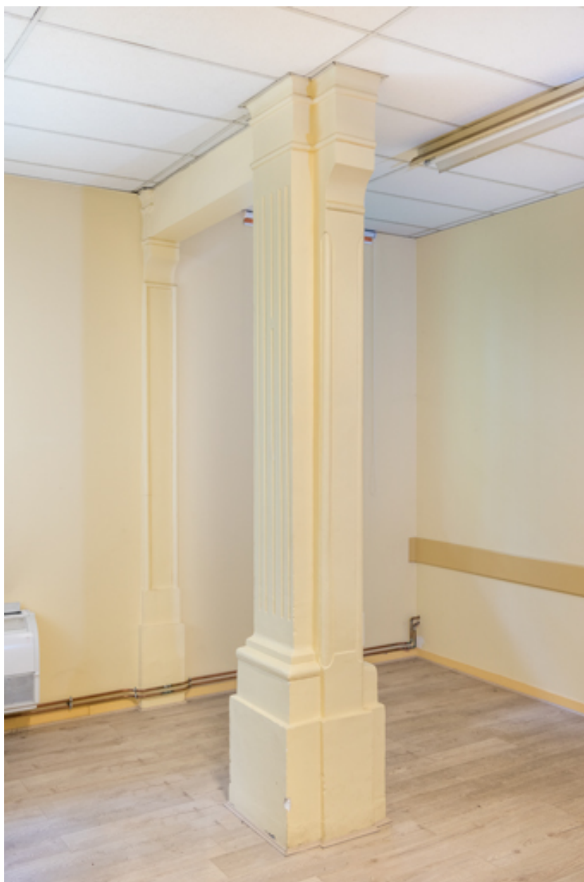
Pilier délimitant l'espace du chœur. Détail.