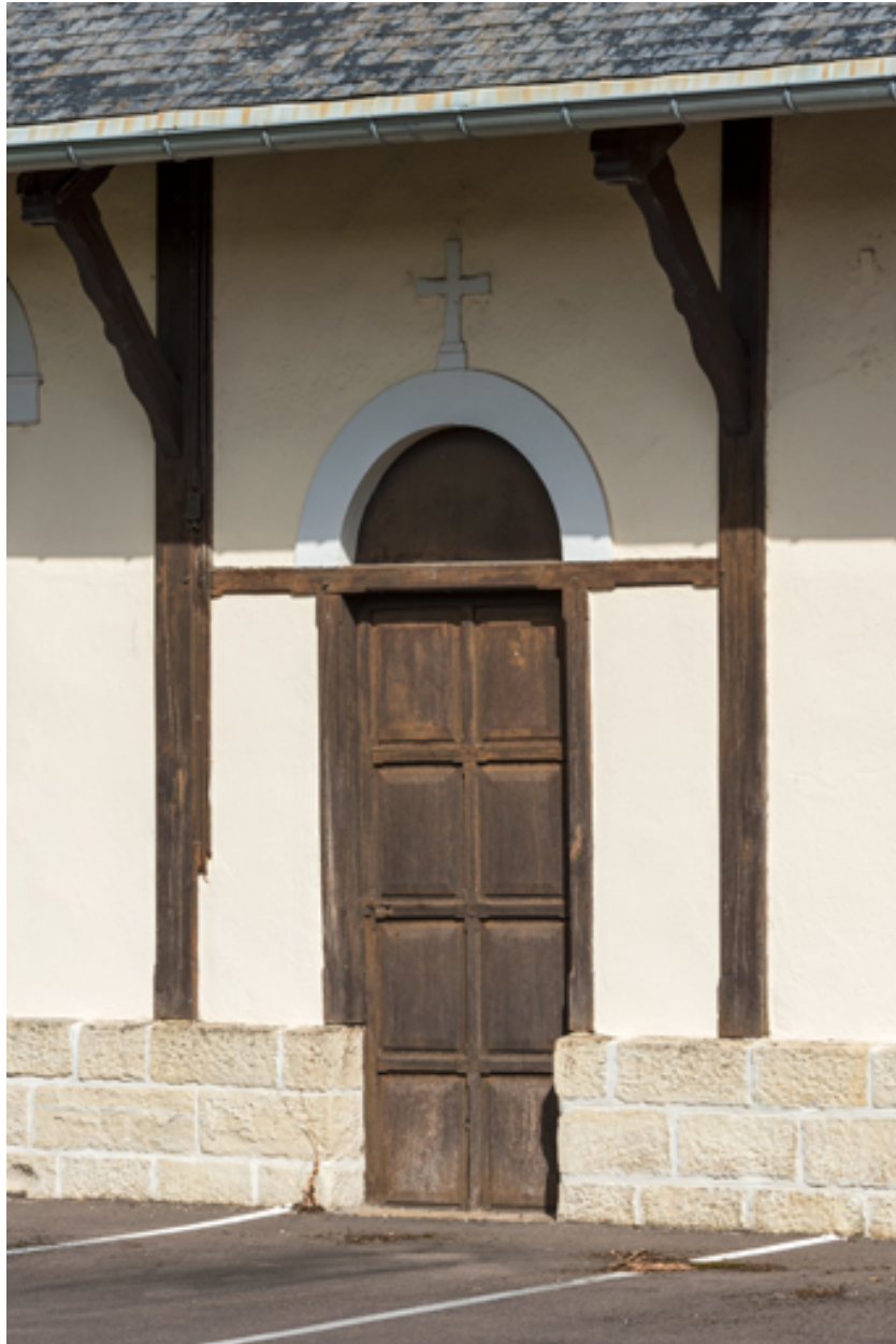
Porte de la façade ouest. Vue de trois quarts.