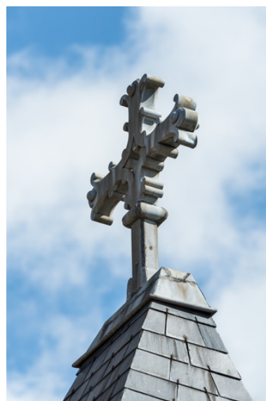
Détail de la croix du campanile. IVR26_20238901093NUC4A