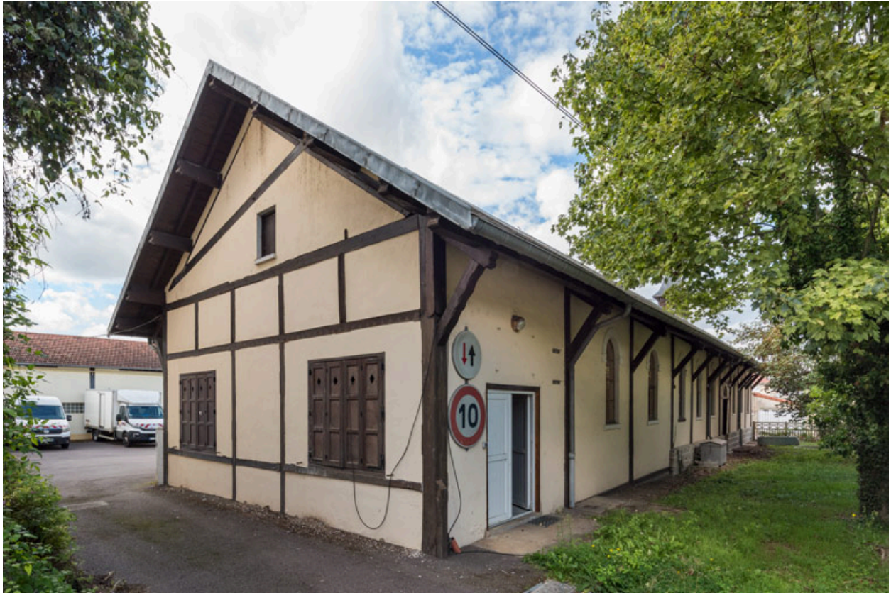
Façades sud et est. Vue de trois quarts.