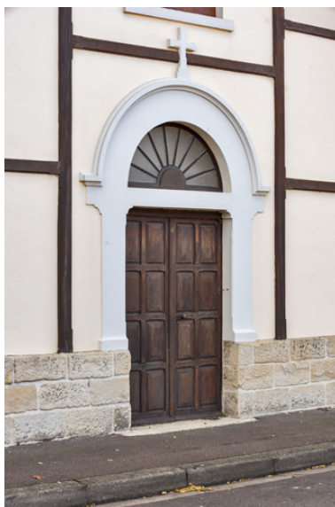
Porte de la façade antérieure. IVR26_20238901090NUC4A