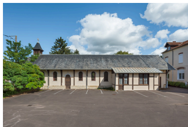
Façade ouest. Vue d'ensemble. IVR26_20238901094NUC4A