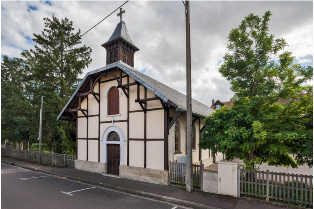
Façade antérieure. Vue de trois quarts.