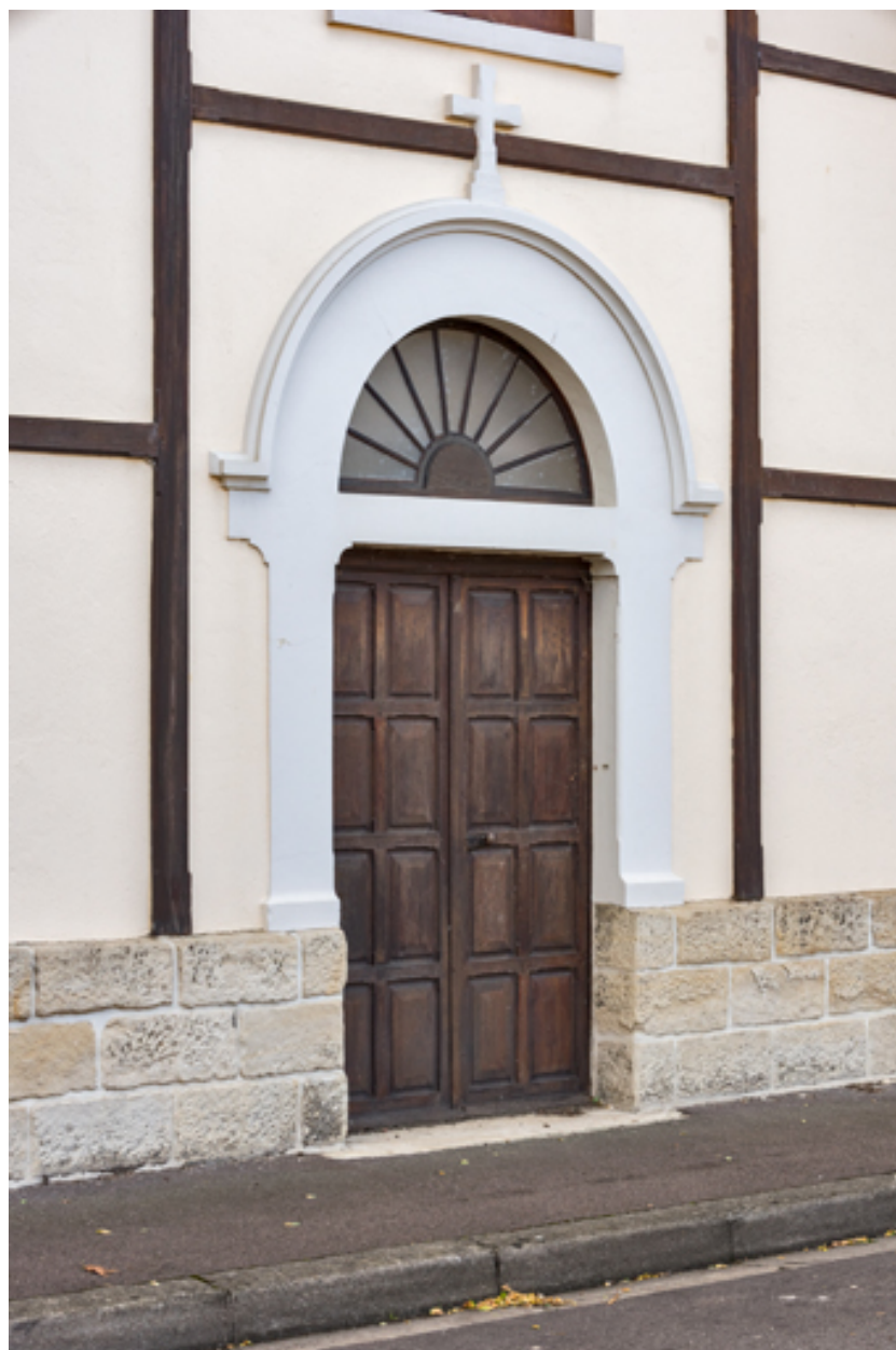
Porte de la façade antérieure.