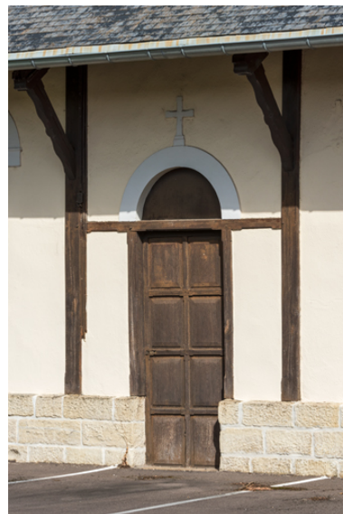
Porte de la façade ouest. Vue de trois quarts. IVR26_20238901097NUC4A