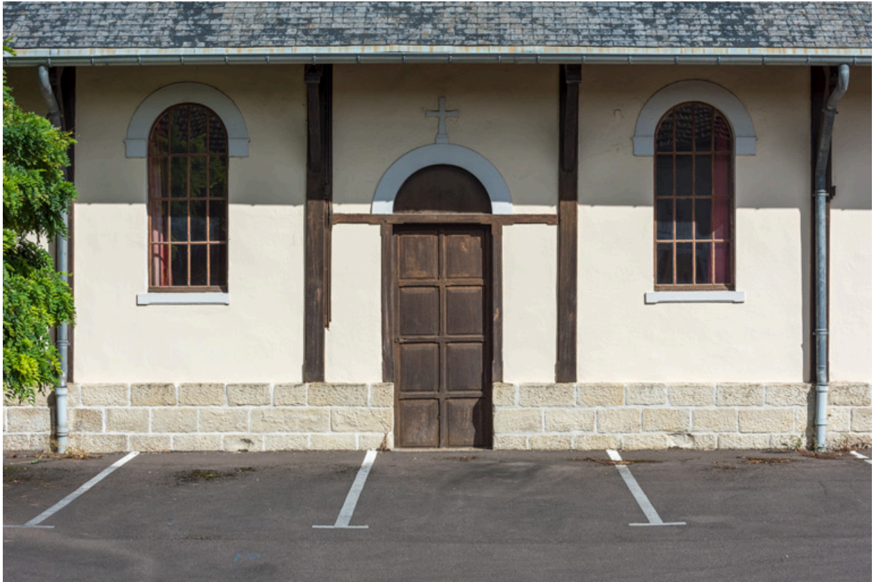
Façade ouest. Vue de trois travées.