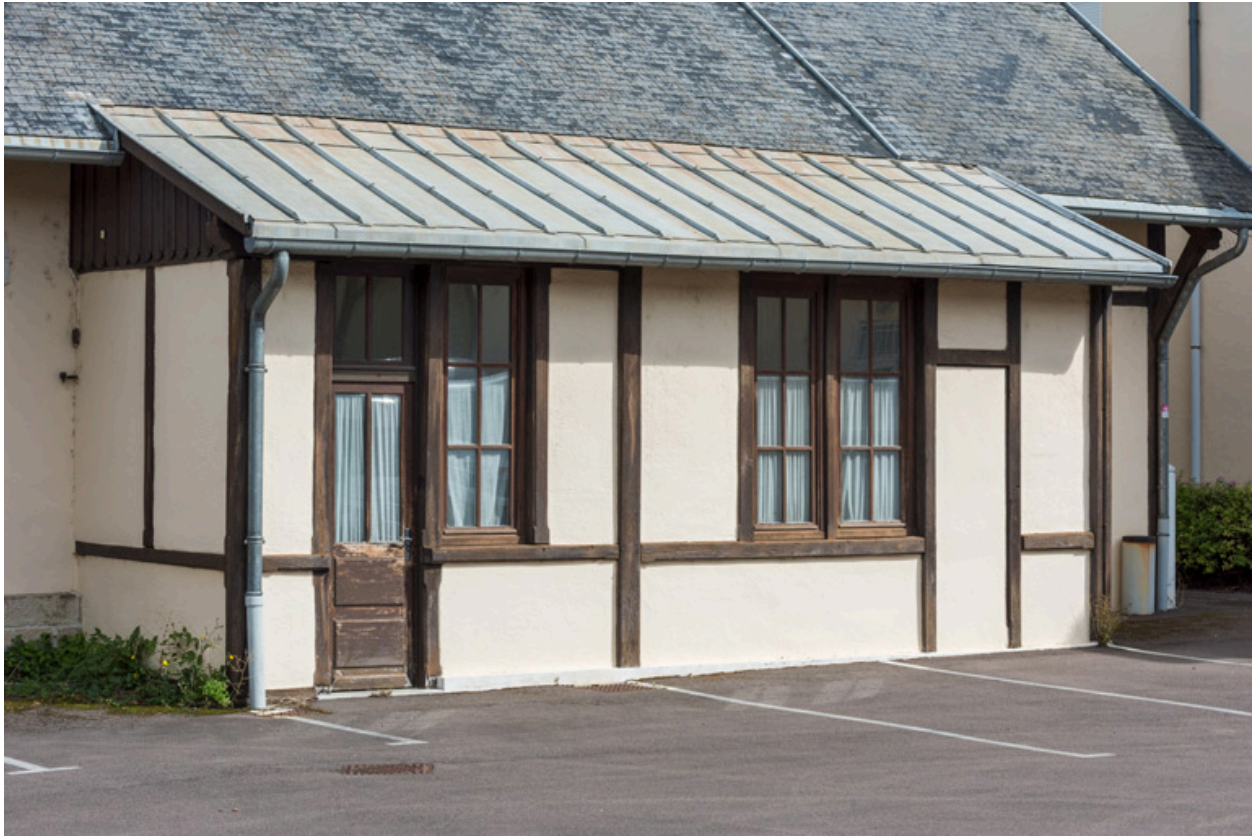
Extension en appentis (sacristie ?). Vue de trois quarts.