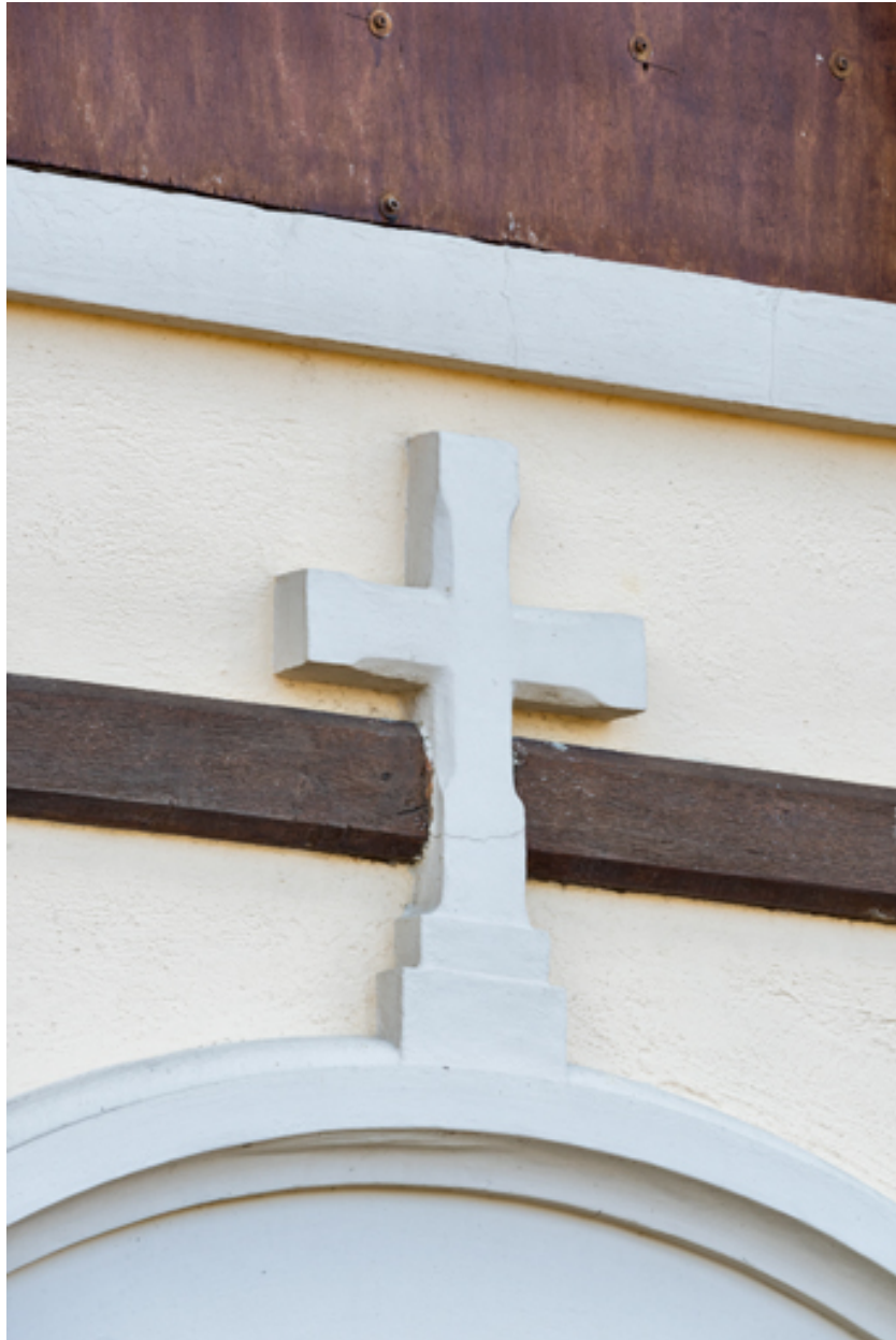
Détail de la croix surmontant la porte de la façade antérieure.