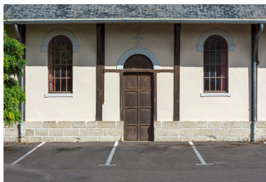
Façade ouest. Vue de trois travées. IVR26_20238901098NUC4A