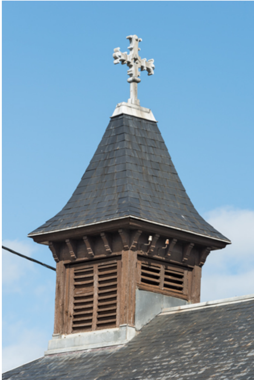
Campanile. Vue de trois quarts.