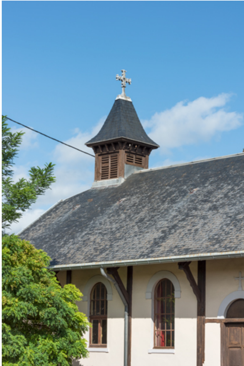
Campanile. Vue de trois quarts depuis le sud ouest.