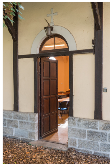
Entrée de la façade est. Vue de trois quarts. IVR26_20238901104NUC4A