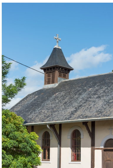
Campanile. Vue de trois quarts depuis le sud ouest. IVR26_20238901095NUC4A