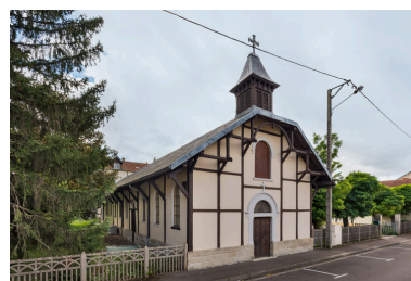
Façades nord (antérieure) et est. Vue de trois quarts. IVR26_20238901089NUC4A