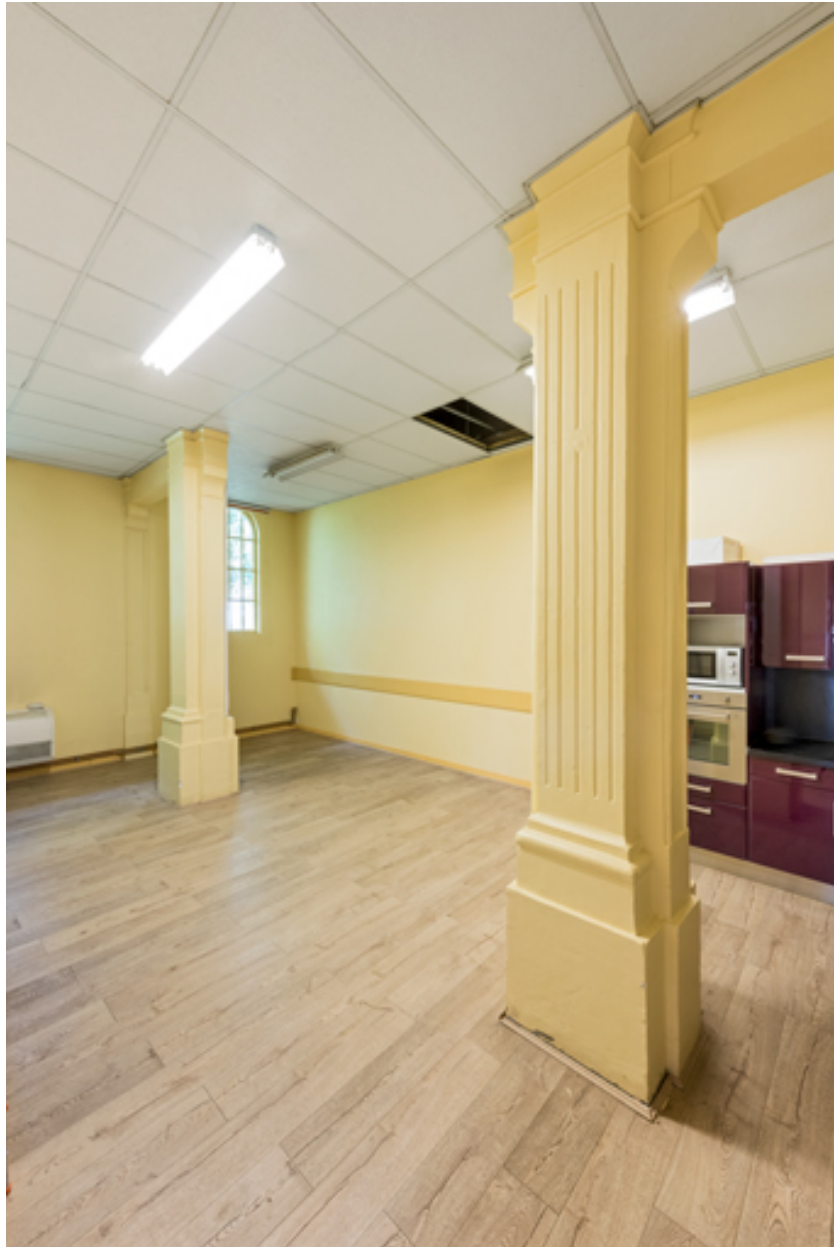
Ancien chœur, devenu cuisine. Vue de trois quarts en direction du sud-est.