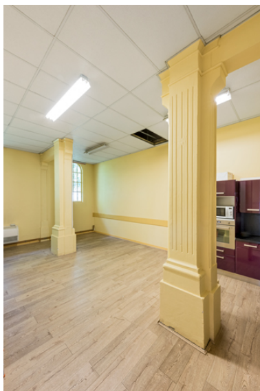
Ancien chœur, devenu cuisine. Vue de trois quarts en direction du sud-est.