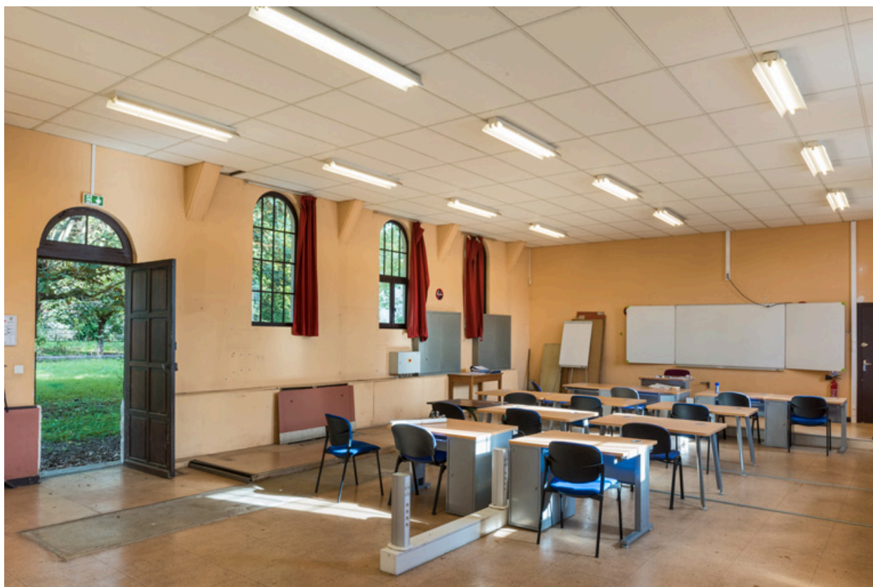
Nef de la chapelle aménagée en salle de formation. Vue de trois quarts en direction du sud-est.