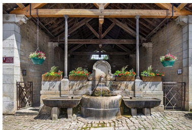
Détail de la face antérieure du lavoir.