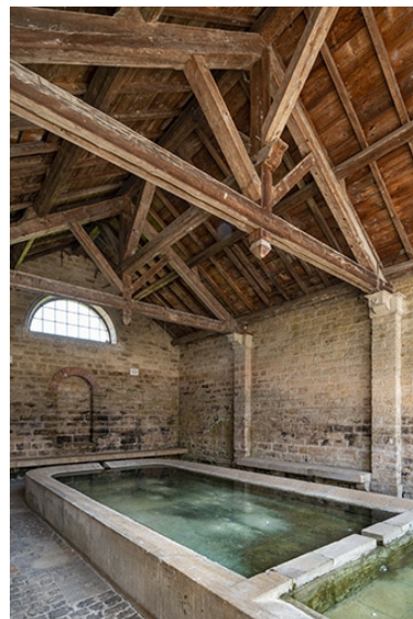
L'intérieur du lavoir, depuis l'entrée. IVR43_20217000415NUC4A