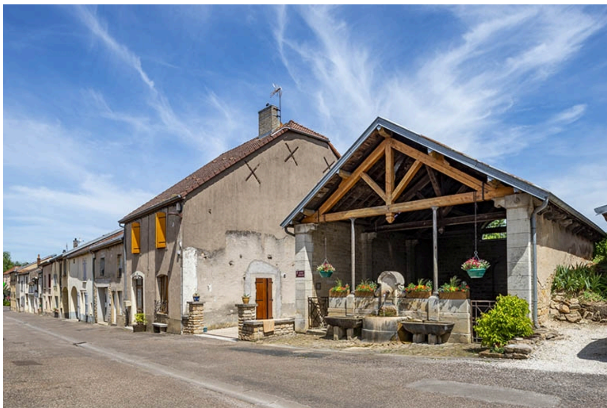
Trois quarts droit du lavoir.