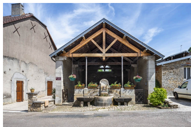
Façade du lavoir.