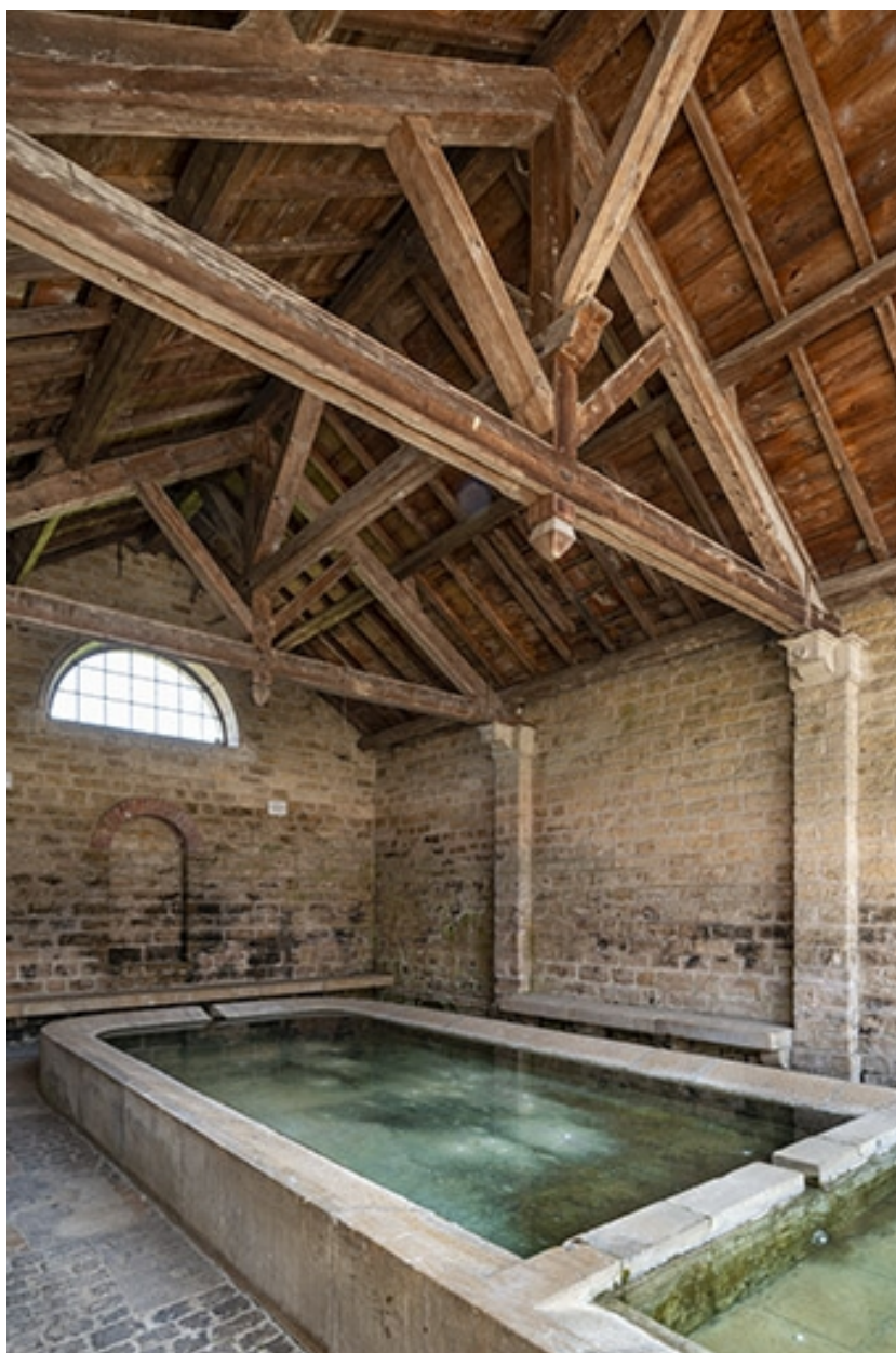
L'intérieur du lavoir, depuis l'entrée.