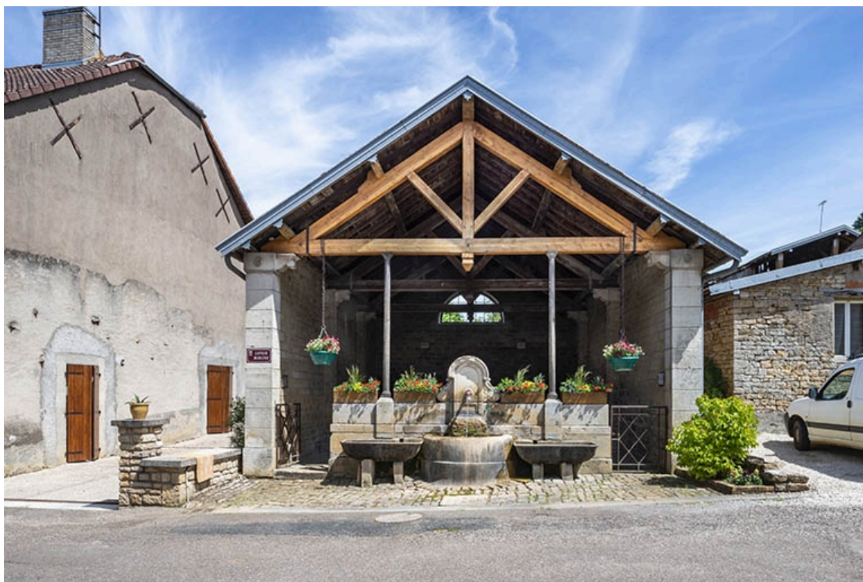
Façade du lavoir.