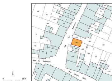
Plan-masse et de situation. Extrait du plan cadastral numérisé de la direction générale des finances publiques, 2025, 1/500. Dess. Aline Thomas