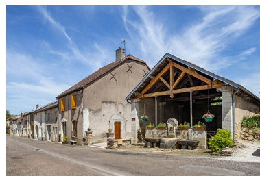
Trois quarts droit du lavoir.