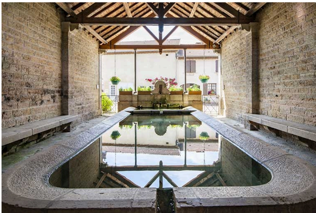
L'intérieur du lavoir, depuis le fond.