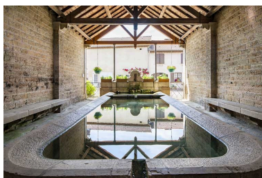
L'intérieur du lavoir, depuis le fond. IVR43_20217000414NUC4A