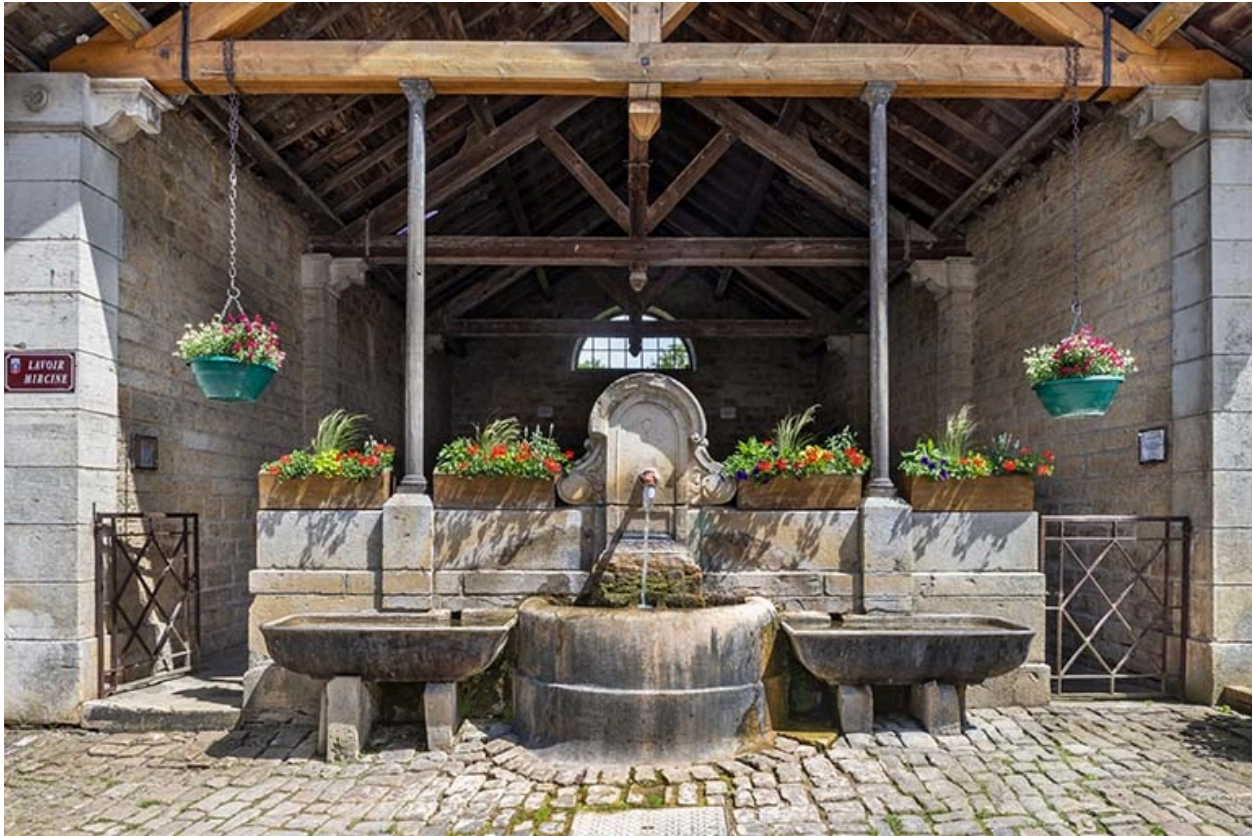
Détail de la face antérieure du lavoir.