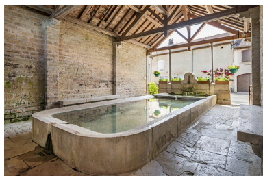
L'intérieur du lavoir, de trois quarts.