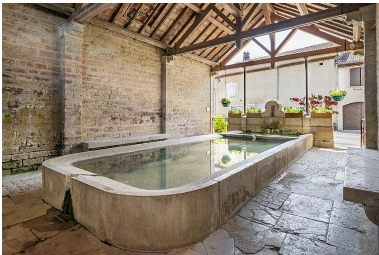
L'intérieur du lavoir, de trois quarts.