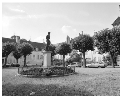
Espace libre sur l'emplacement de l'ancienne chapelle.