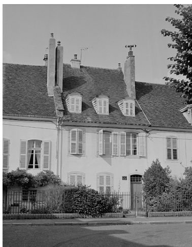
Maison de chanoinesse : 10 place Bichat. IVR43_19833900145X