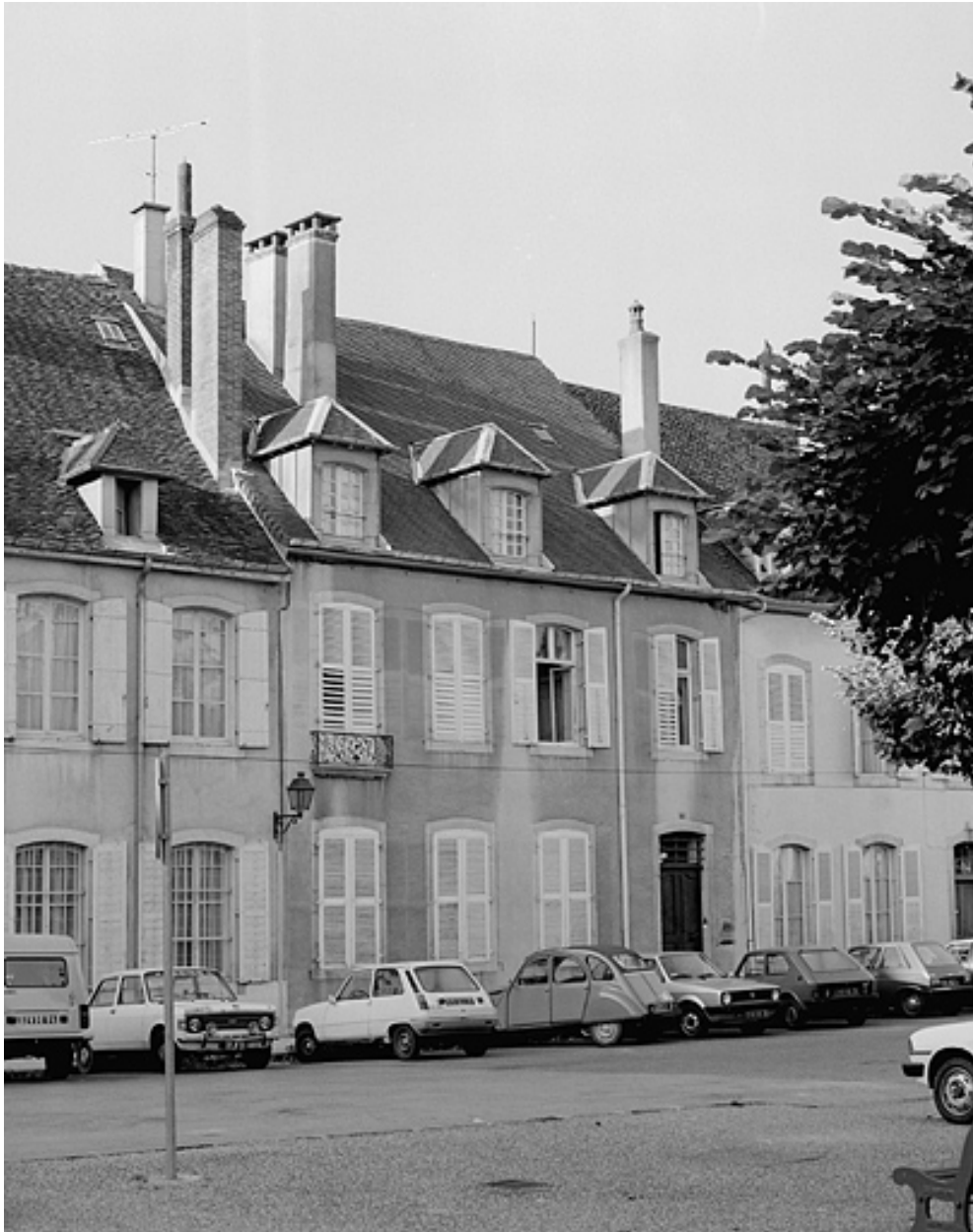
Maison de chanoinesse : 3 place Bichat.