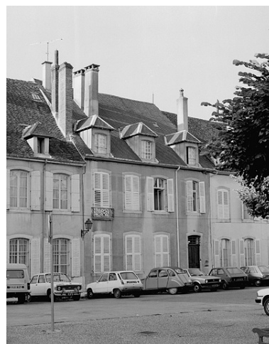
Maison de chanoinesse : 3 place Bichat.