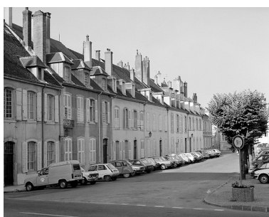
Maisons des chanoinesse. Vue d'ensemble : 1 à 13 place Bichat. IVR43_19833900146X