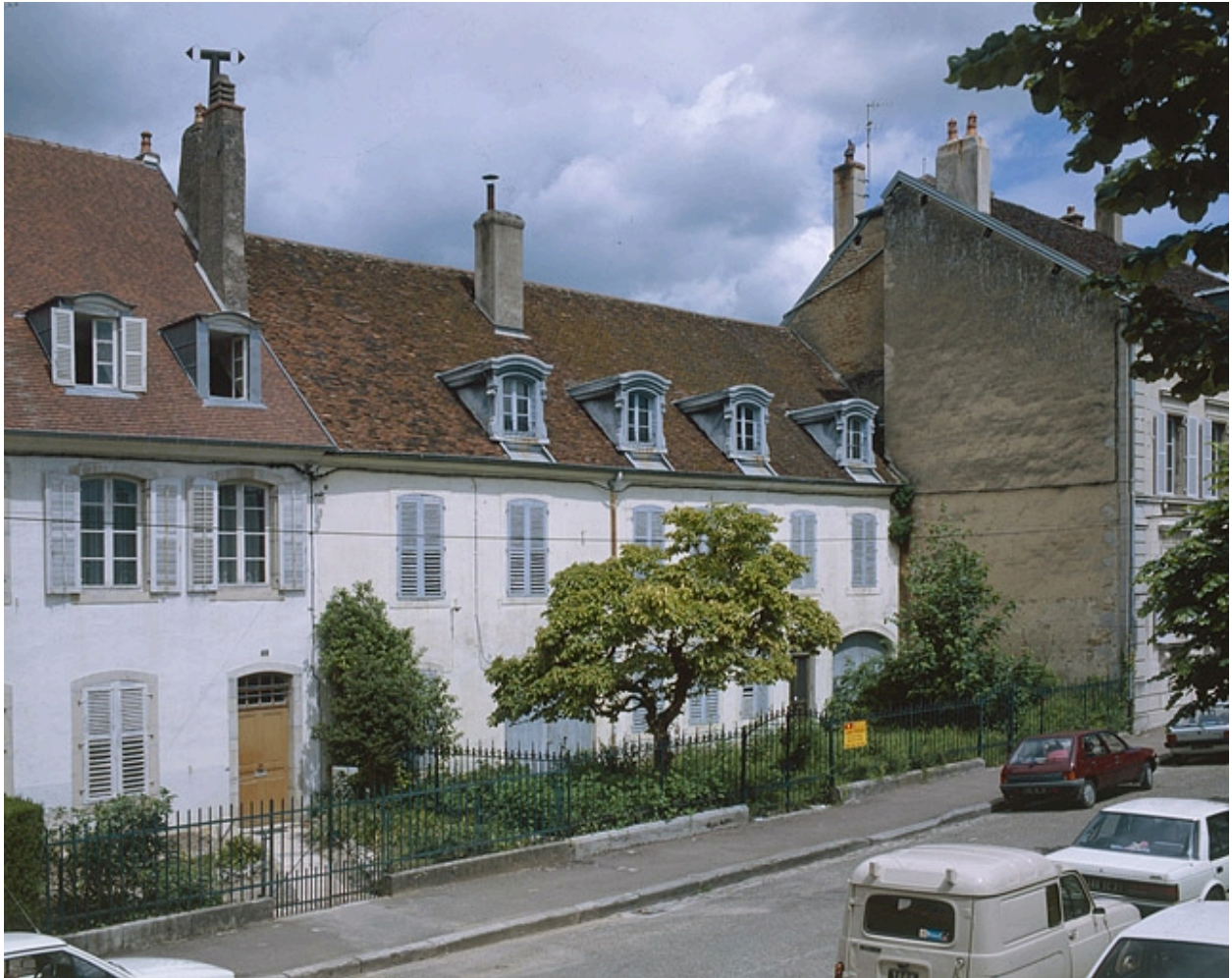
Maisons de chanoinesses.