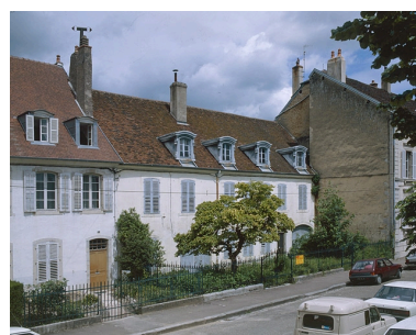
Maisons de chanoinesse. IVR43_19883900083XA