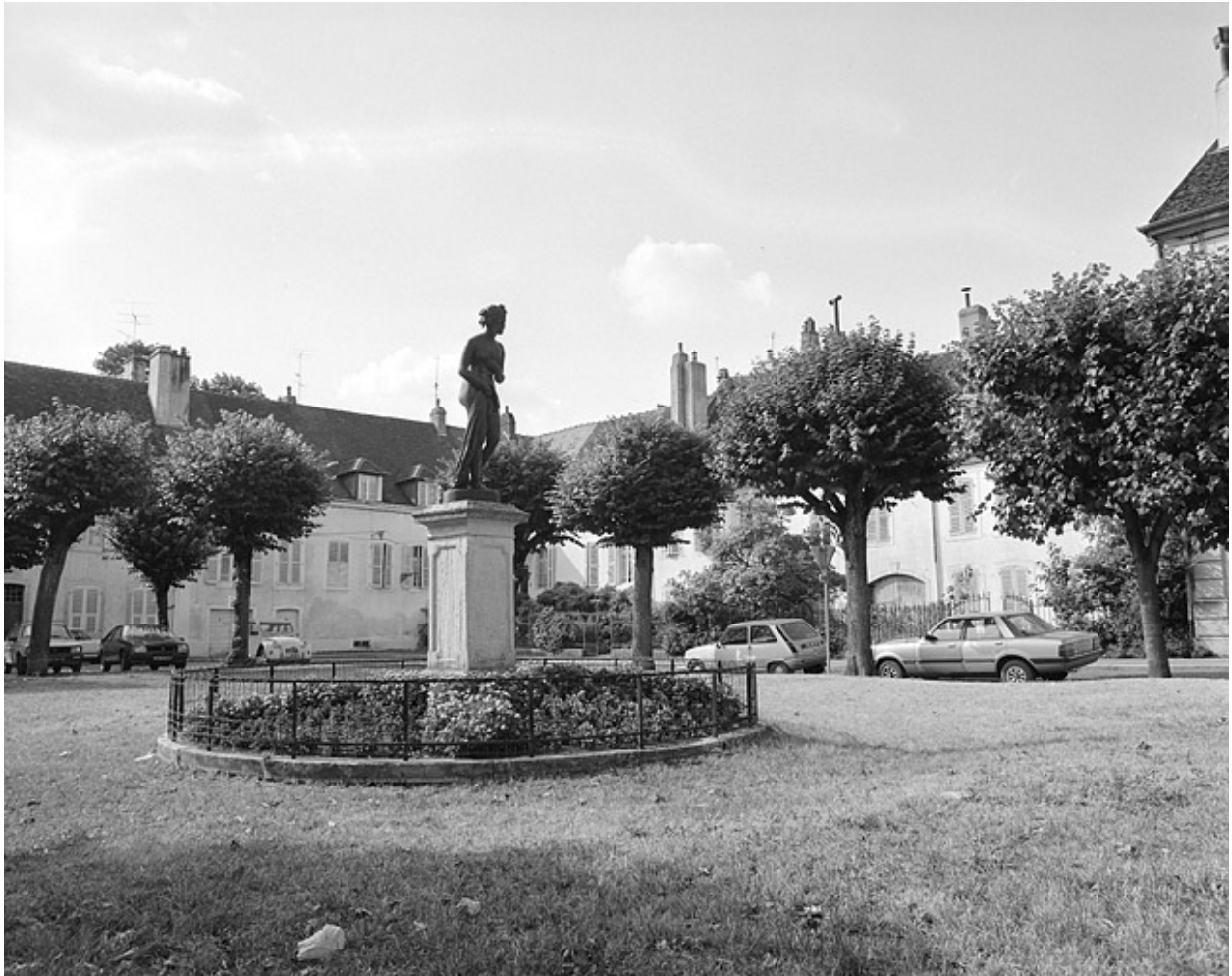
Espace libre sur l'emplacement de l'ancienne chapelle.