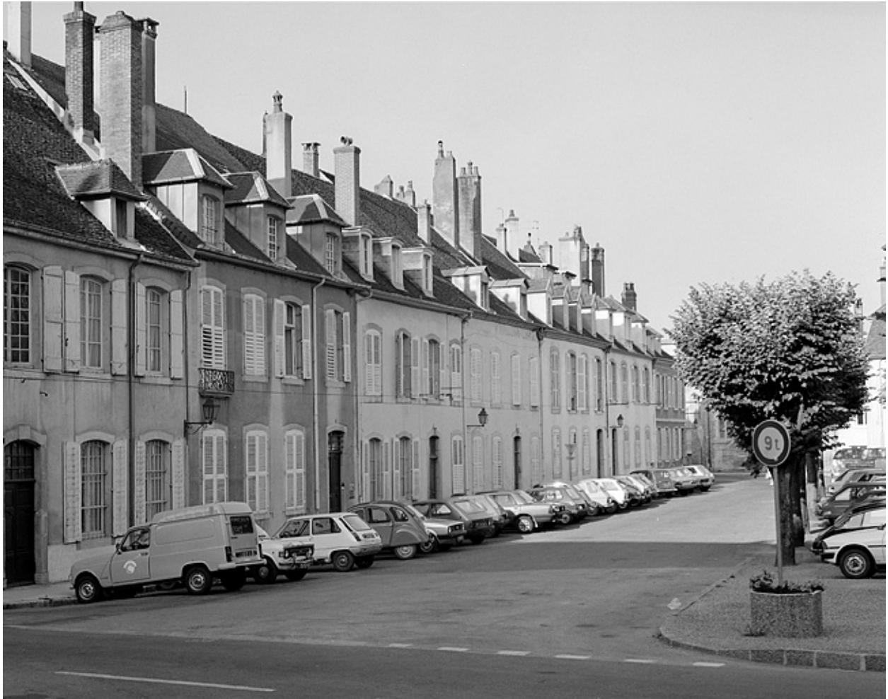
Maisons des chanoinesses. Vue d'ensemble : 1 à 13 place Bichat.