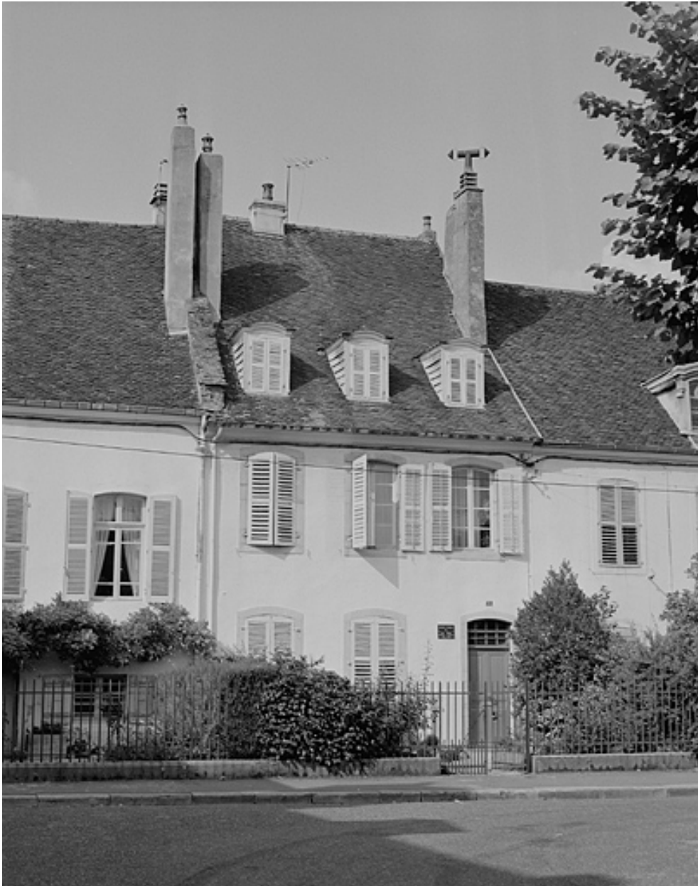
Maison de chanoinesse : 10 place Bichat.