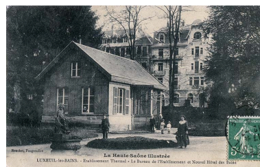
Situation de l'une des deux fontaines à son emplacement d'origine. IVR43_20217000008NUC4A