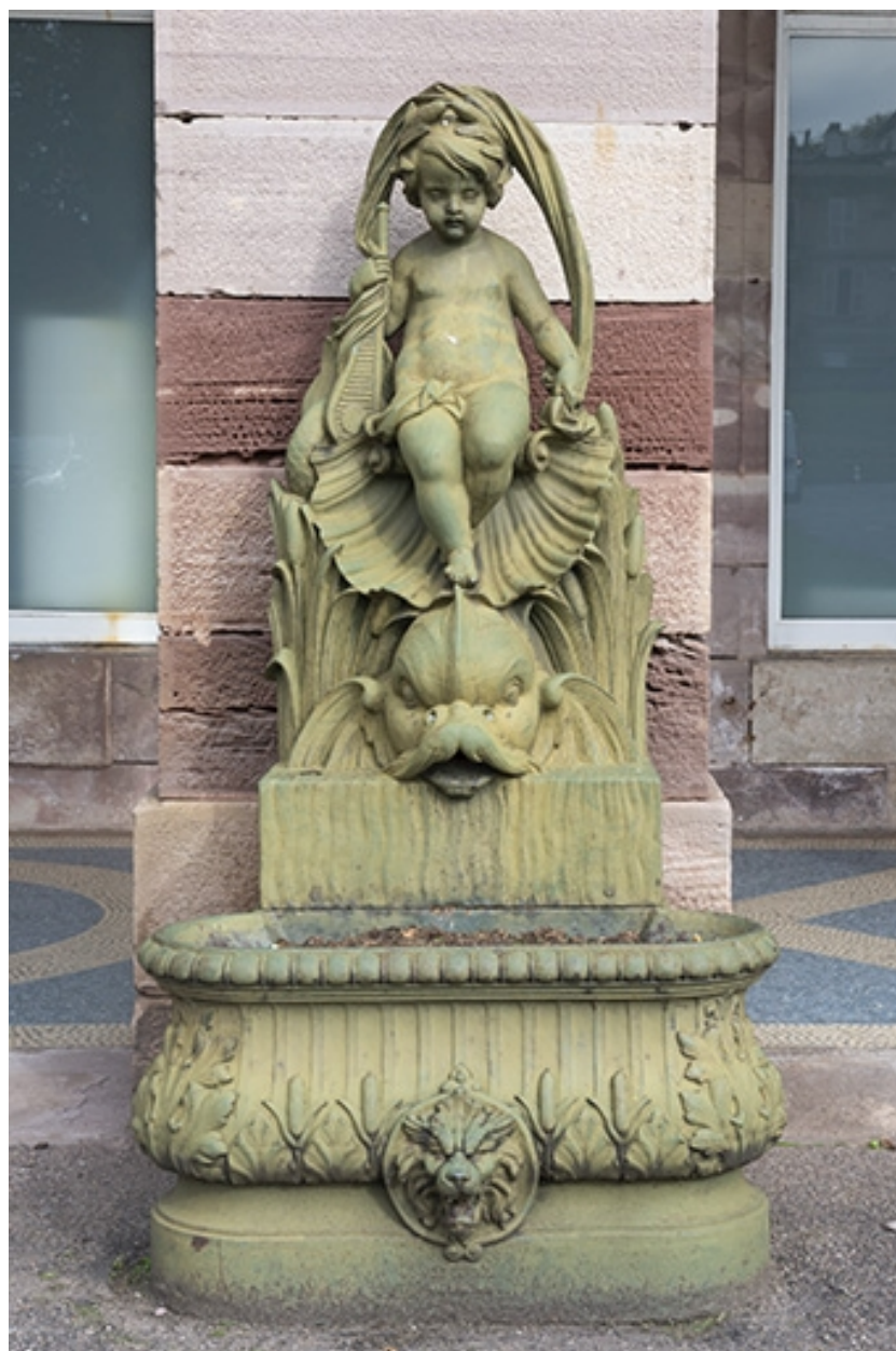
Fontaine du côté droit (est) : vue d'ensemble, de face.