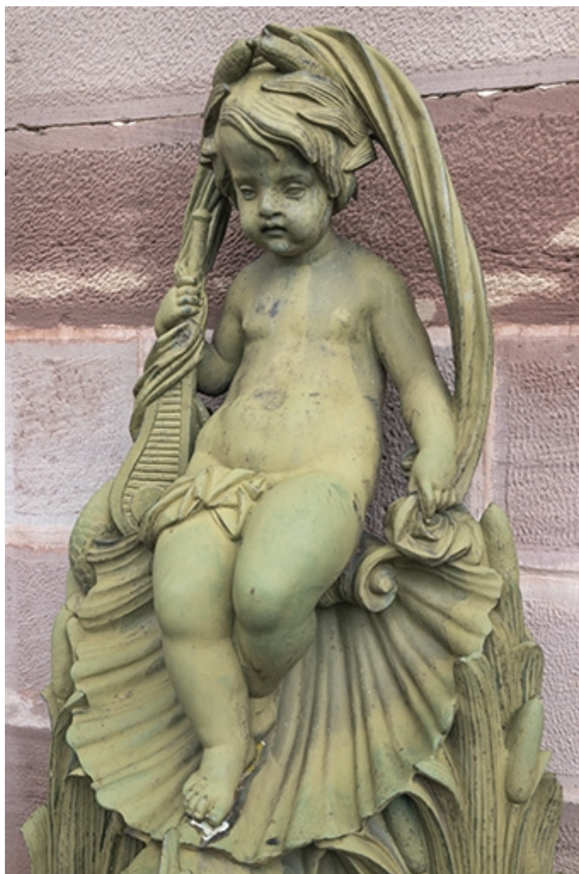
Fontaine du côté gauche (ouest) : vue de la partie supérieure.