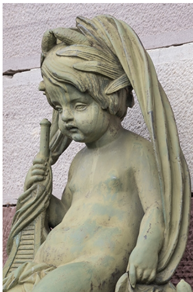
Fontaine du côté droit (est) : vue de la partie supérieure, détail de l'enfant. IVR43_20207000706NUC4A