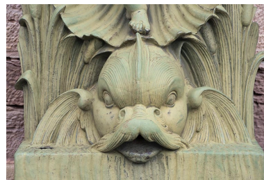
Fontaine du côté droit (est) : vue de la partie supérieure, détail du dauphin. IVR43_20207000704NUC4A