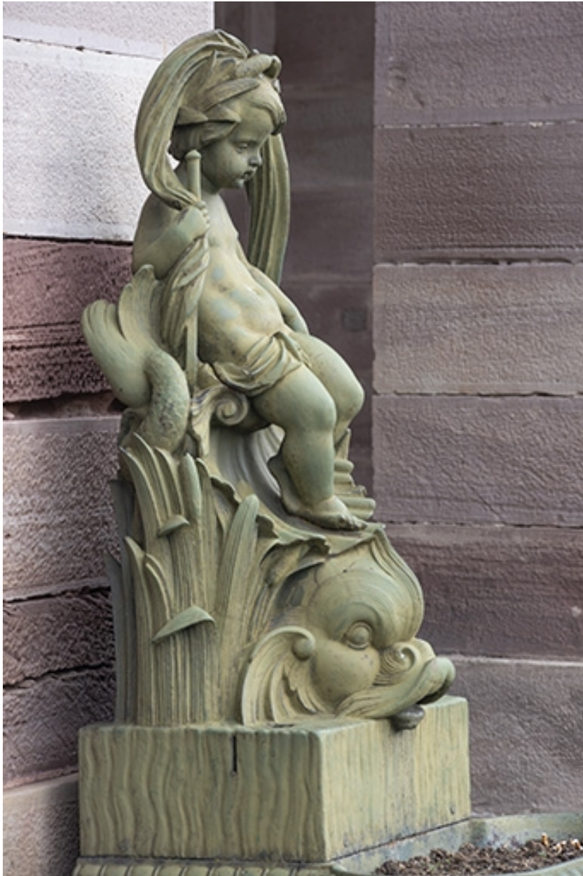
Fontaine du côté droit (est) : vue de la partie supérieure.