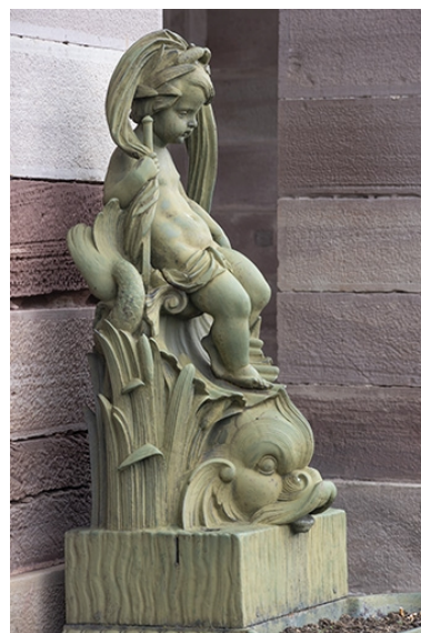
Fontaine du côté droit (est) : vue de la partie supérieure. IVR43_20207000703NUC4A