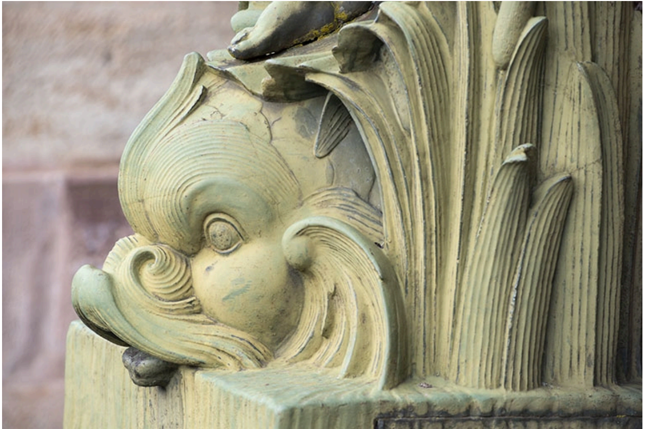
Fontaine du côté droit (est) : vue de la partie supérieure, détail du dauphin.