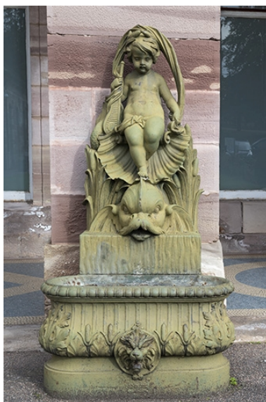
Fontaine du côté gauche (ouest) : vue d'ensemble, de face. IVR43_20207000701NUC4A