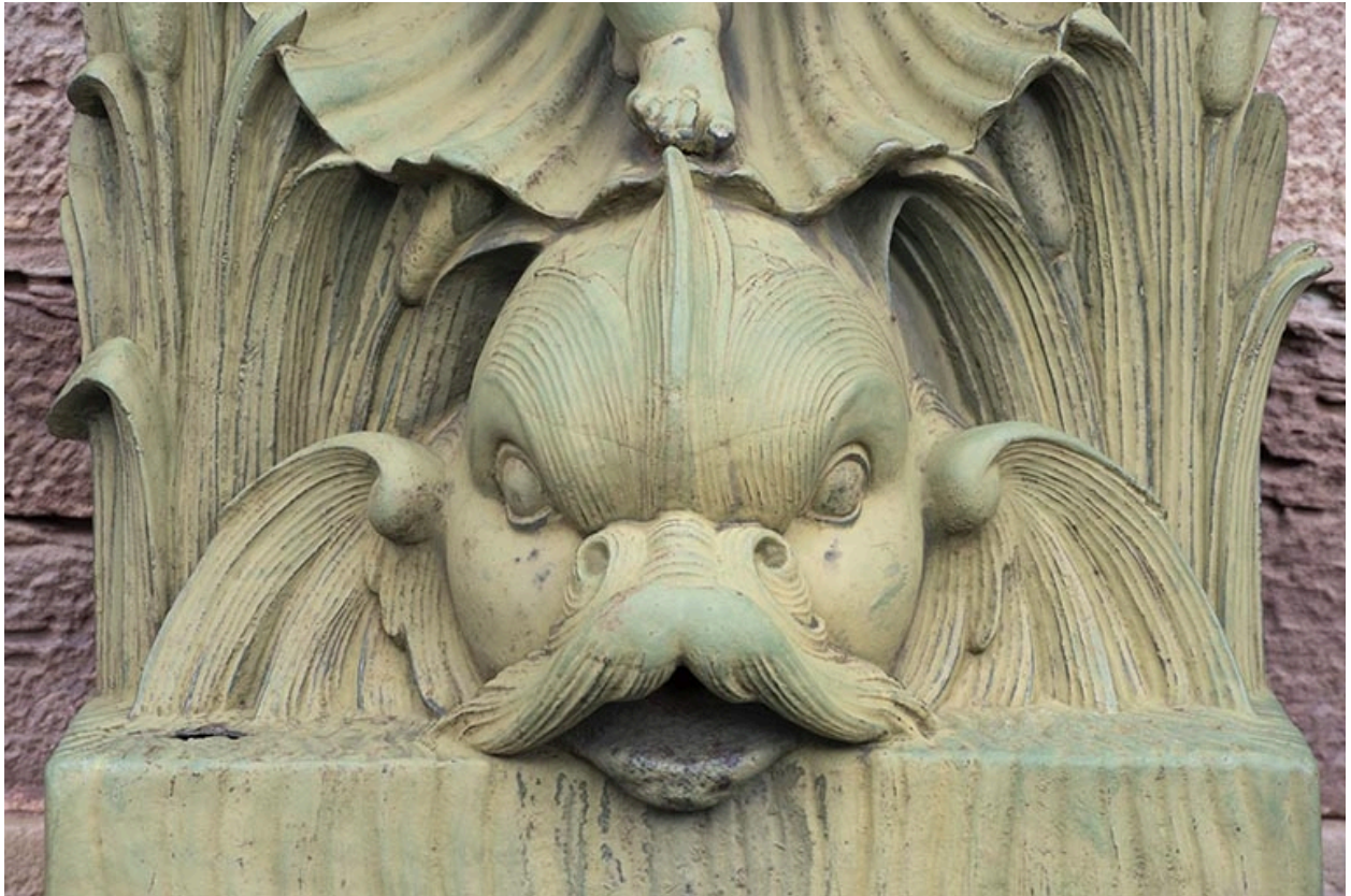
Fontaine du côté droit (est) : vue de la partie supérieure, détail du dauphin.