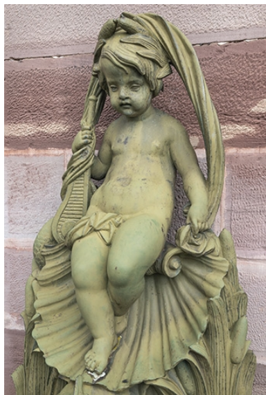
Fontaine du côté gauche (ouest) : vue de la partie supérieure. IVR43_20207000702NUC4A