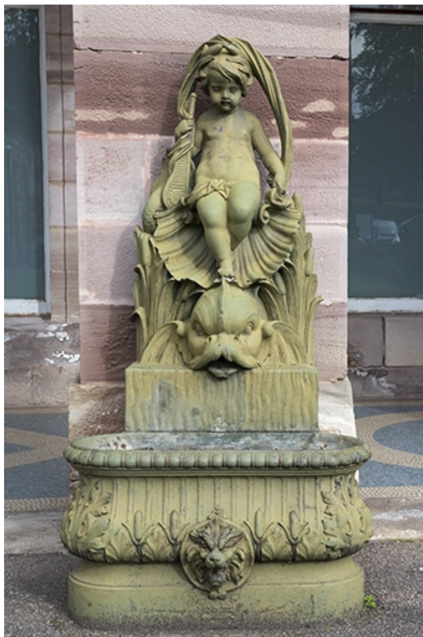
Fontaine du côté gauche (ouest) : vue d'ensemble, de face.