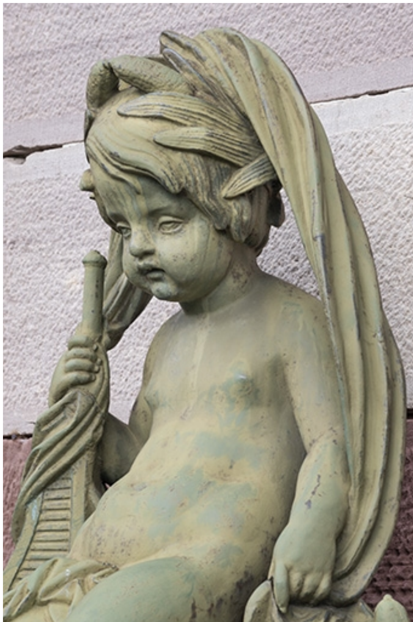
Fontaine du côté droit (est) : vue de la partie supérieure, détail de l'enfant.