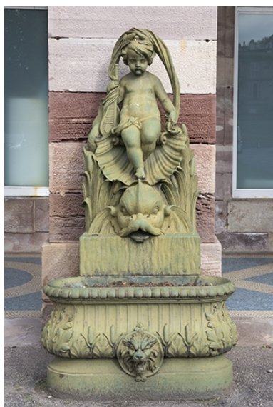
Fontaine du côté droit (est) : vue d'ensemble, de face.