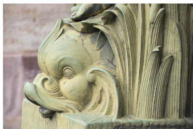
Fontaine du côté droit (est) : vue de la partie supérieure, détail du dauphin. IVR43_20207000705NUC4A