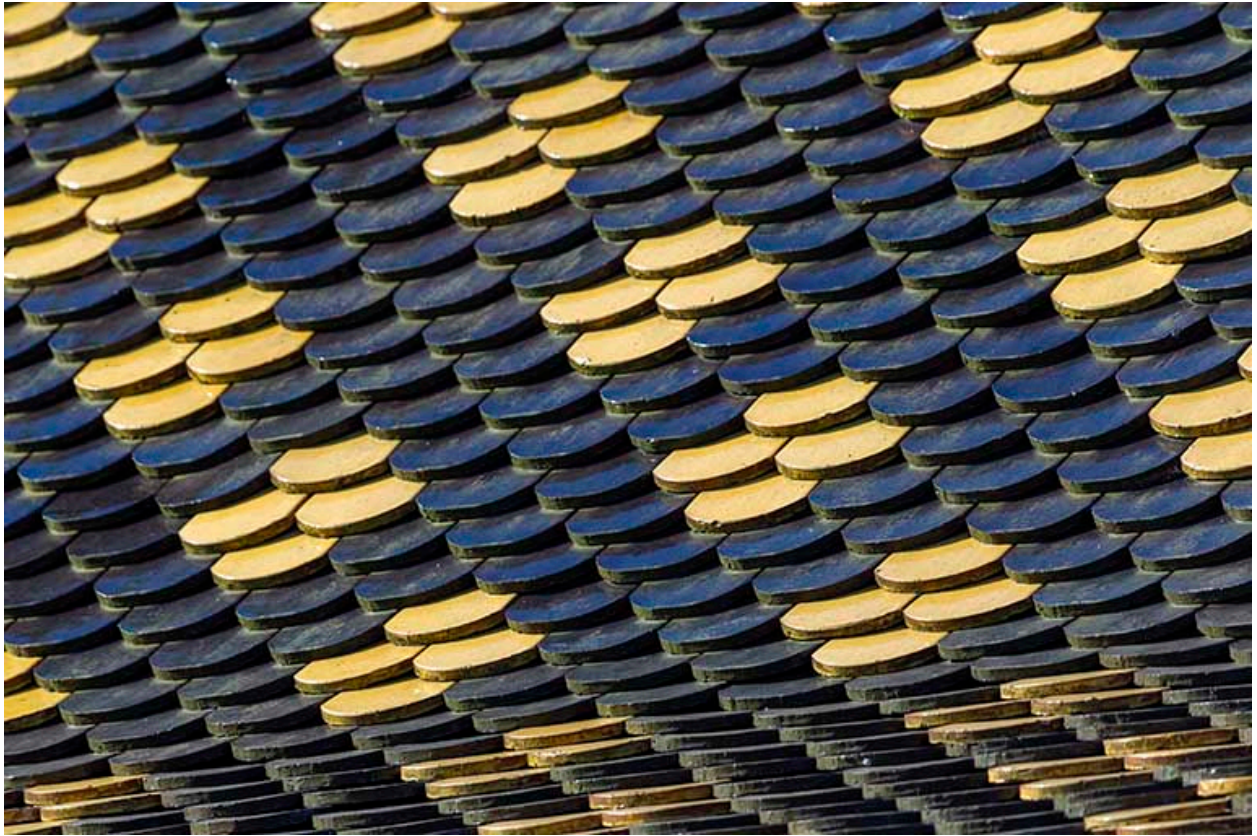
Tuiles vernissées de la toiture.