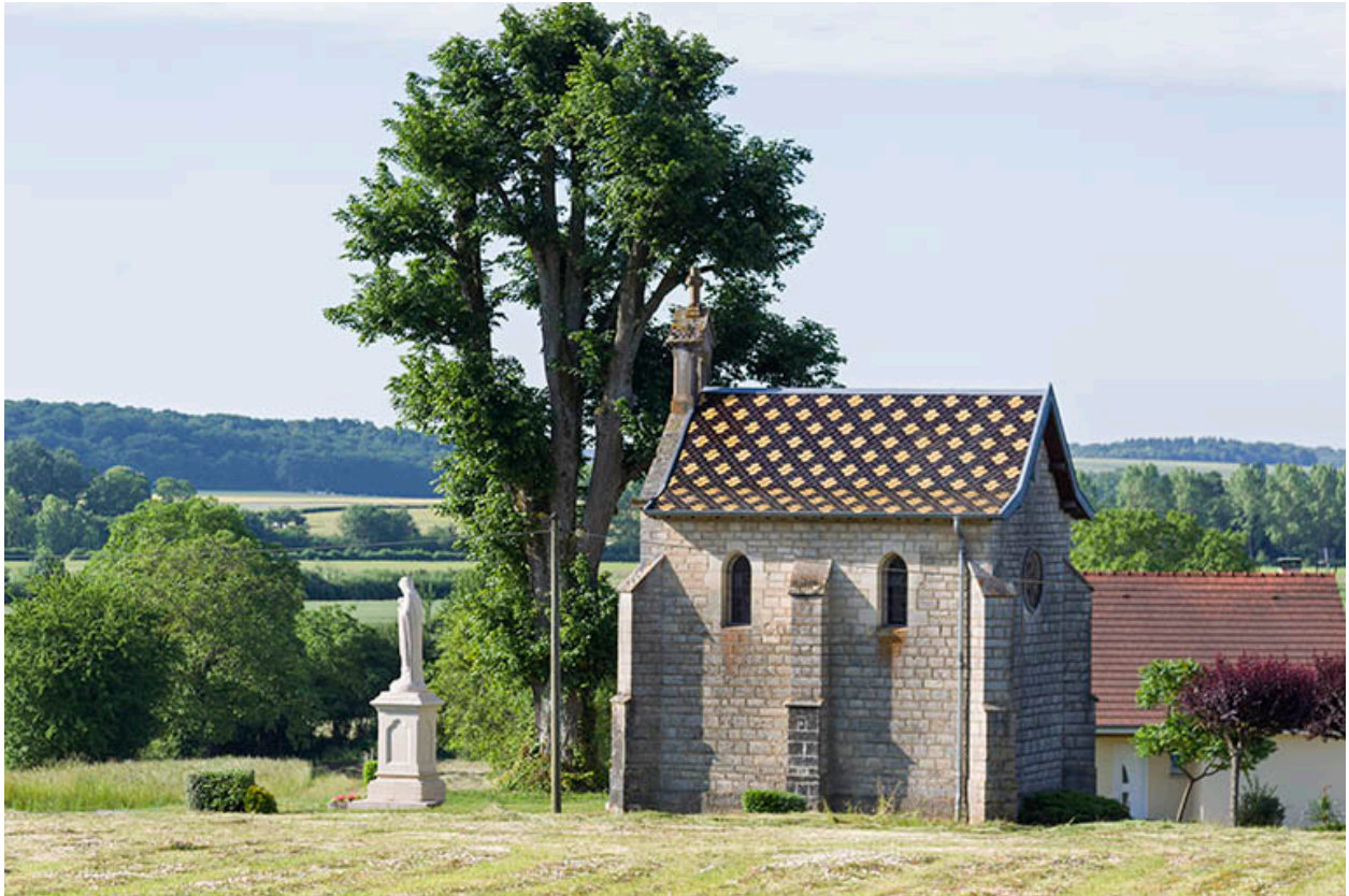
Le site de la chapelle au lieu-dit Vignes de Sainte-Anne.