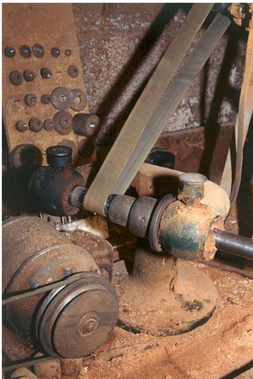
Détail du tour sur colonne.