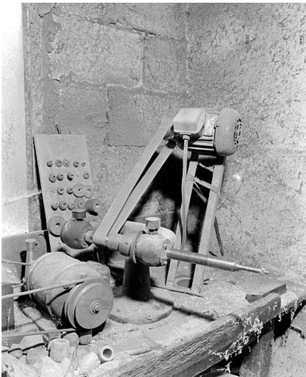
Vue d'ensemble, avec son moteur.