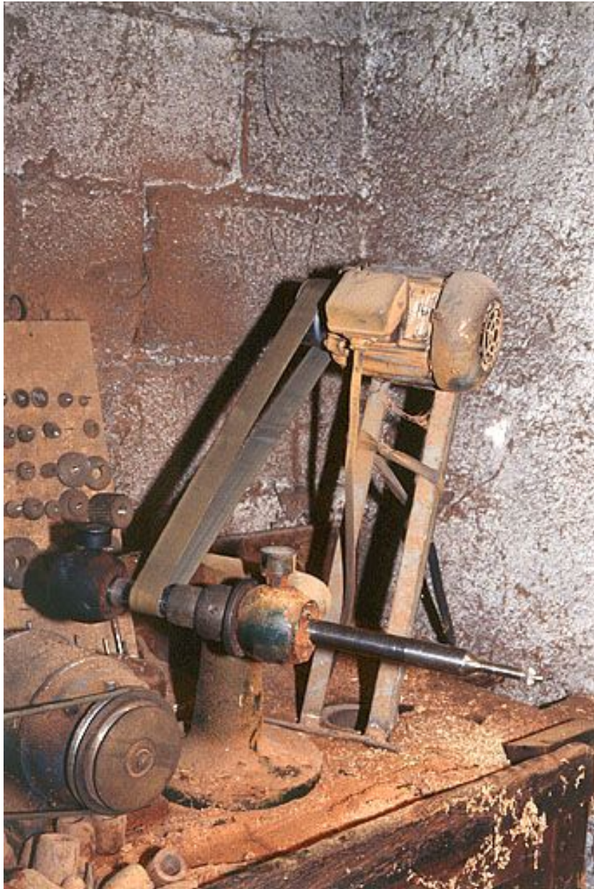
Vue d'ensemble, avec son moteur.