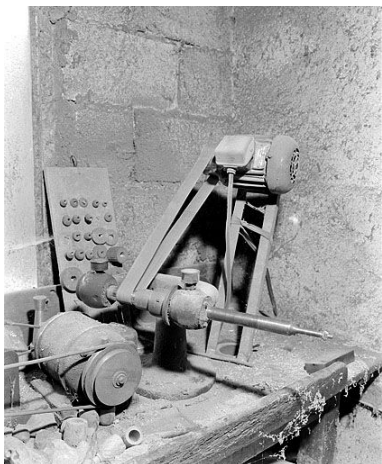
Vue d'ensemble, avec son moteur. IVR43_20003901017X