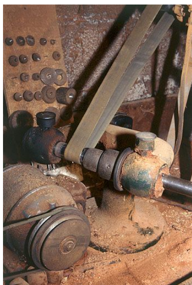
Détail du tour sur colonne. IVR43_20003901020ZA