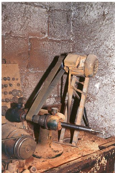
Vue d'ensemble, avec son moteur.