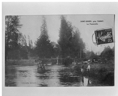
Vue d'ensemble. Carte postale ancienne, édit. Lherbette. Oblitération datée octobre 1907.