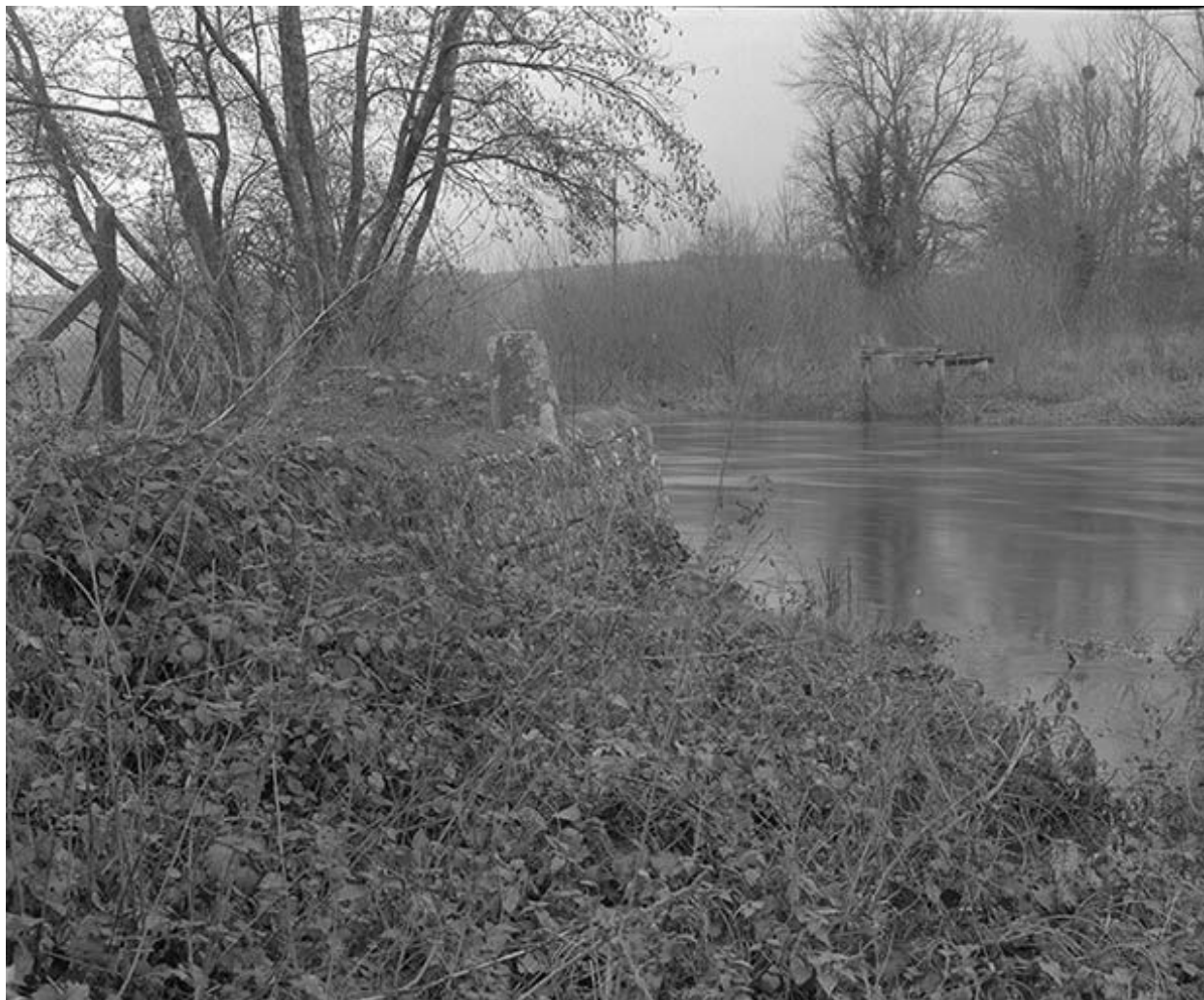
Vestiges de la passerelle. La culée ouest.