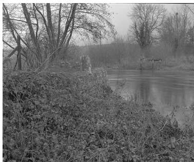
Vestiges de la passerelle. La culée ouest. IVR26_19925800261X