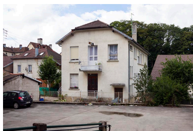
Façade latérale droite. IVR43_20132501791NUC2A