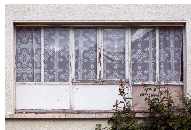
Façade antérieure : fenêtre d'atelier au rez-de-chaussée.