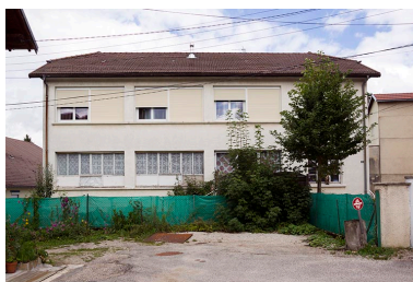
Façade antérieure.