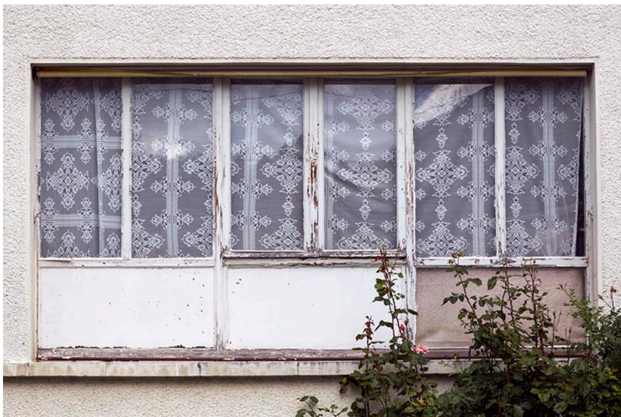
Façade antérieure : fenêtre d'atelier au rez-de-chaussée.