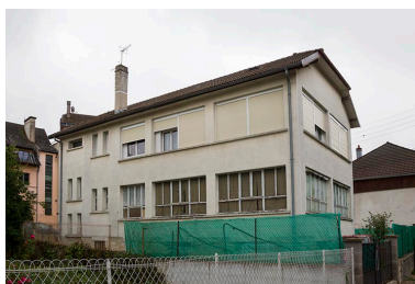
Façades postérieure et latérale gauche. IVR43_20132501787NUC2A