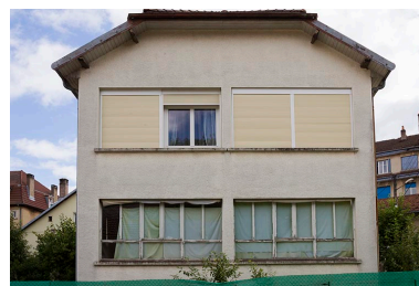
Façade latérale gauche. IVR43_20132501790NUC2A