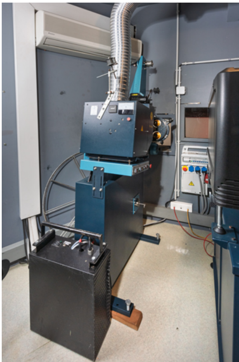
Vue d'ensemble, depuis l'arrière.