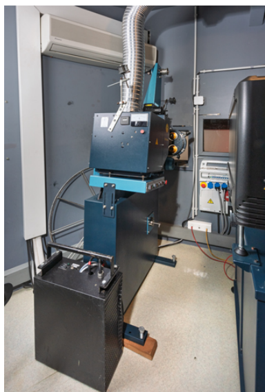
Vue d'ensemble, depuis l'arrière. IVR26_20257100186NUC4A