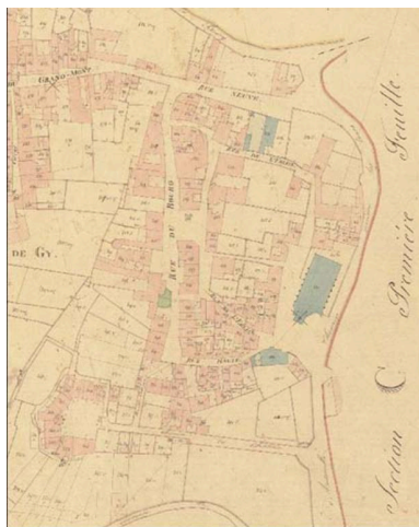
La partie haute de la ville sur le cadastre de 1837 IVR43_20137000883NUC2A