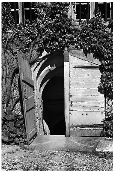
Entrée de la cave.