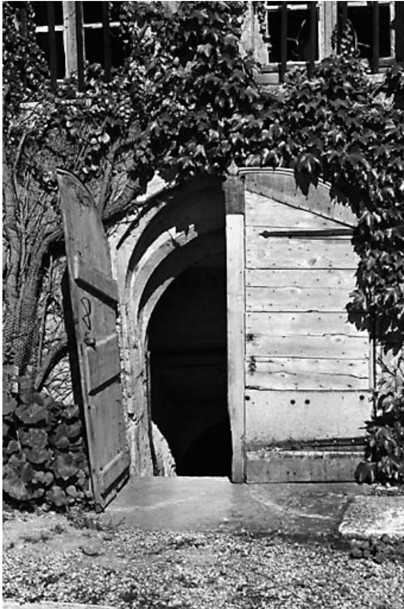
Entrée de la cave.