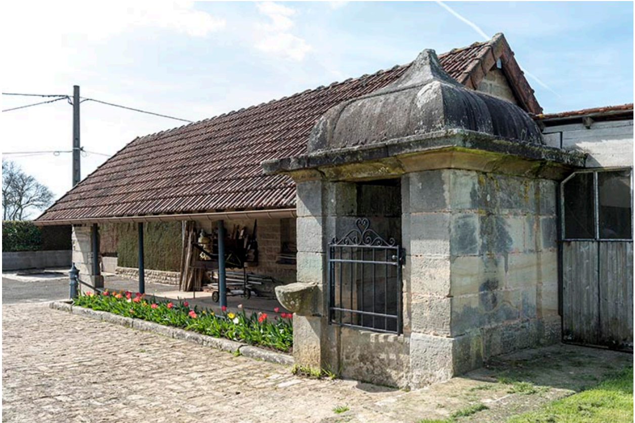
Ancienne fontaine-lavoir, 2 rue de Jonvelle : vue de trois-quart est.