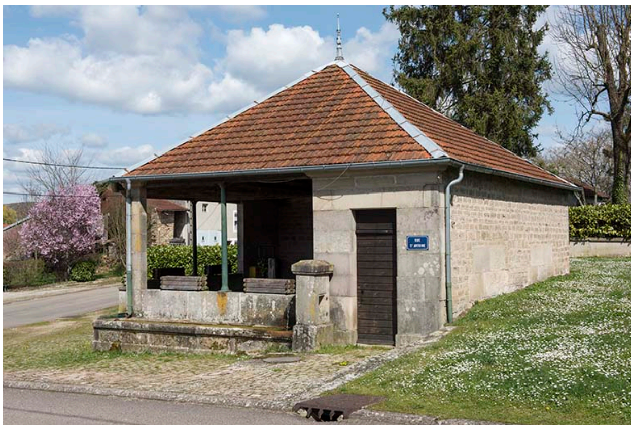
Fontaine-lavoir rue Saint Antoine : vue de trois-quart nord-est.