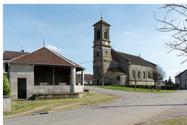
Fontaine-lavoir rue Saint Antoine : vue de la façade nord-ouest et de la place.