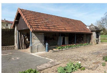
Ancienne fontaine-lavoir, 2 rue de Jonvelle : vue de trois-quart sud.