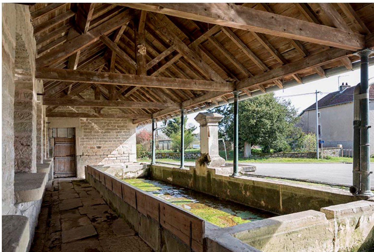
Fontaine-lavoir à l'angle de la Grande rue et de la rue du Bas : vue intérieure depuis le nord-ouest.