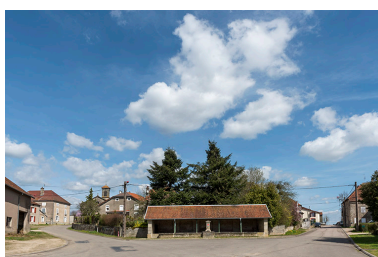
La fontaine-lavoir du bas du village vue de face.