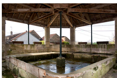
Fontaine-lavoir rue Saint Antoine : vue intérieure depuis l'angle nord-est.