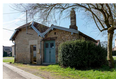
Fontaine-lavoir du Petit-Magny : vue de trois-quart nord.