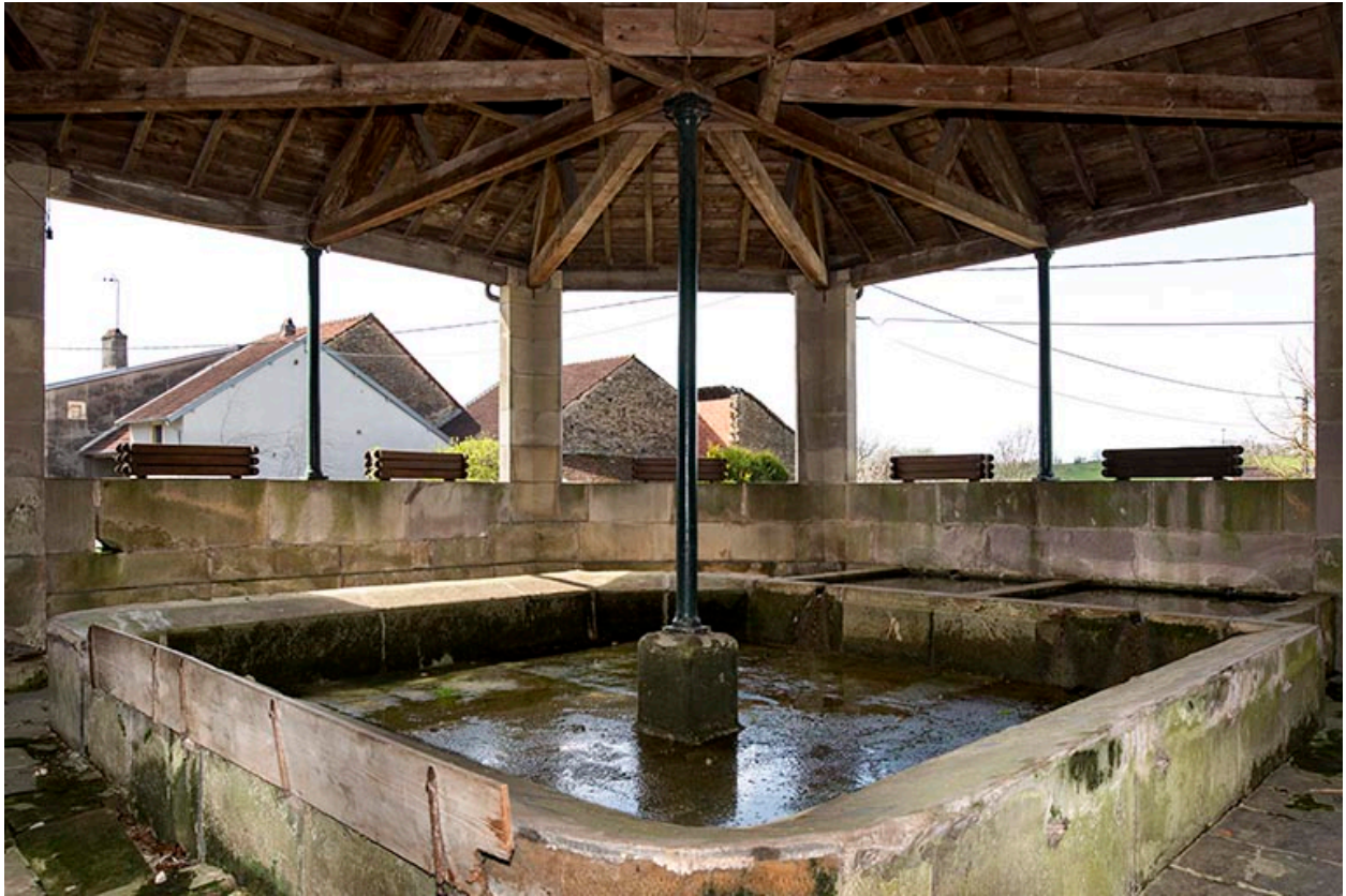
Fontaine-lavoir rue Saint Antoine : vue intérieure depuis l'angle nord-est.