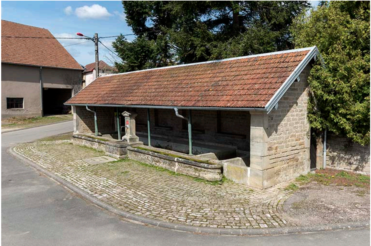
Fontaine-lavoir à l'angle de la Grande rue et de la rue du Bas : vue de trois-quart sud-est.