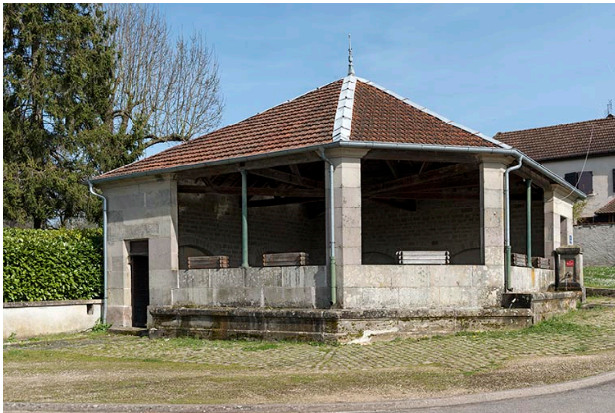
Fontaine-lavoir rue Saint Antoine : vue de trois -quart sud-ouest.