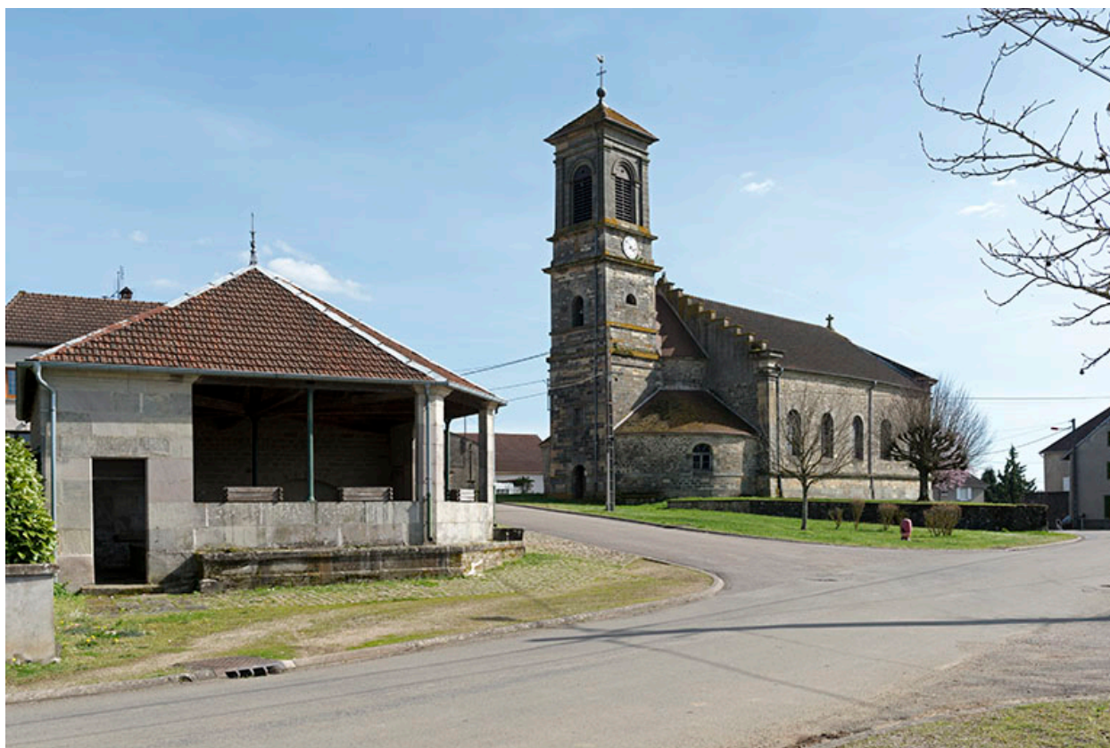
Fontaine-lavoir rue Saint Antoine : vue de la façade nord-ouest et de la place.