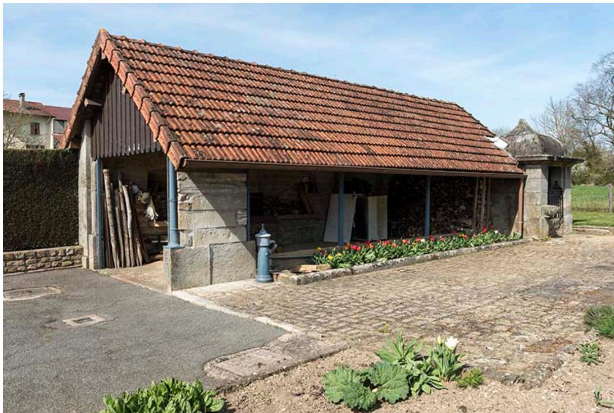
Ancienne fontaine-lavoir, 2 rue de Jonvelle : vue de trois-quart sud.