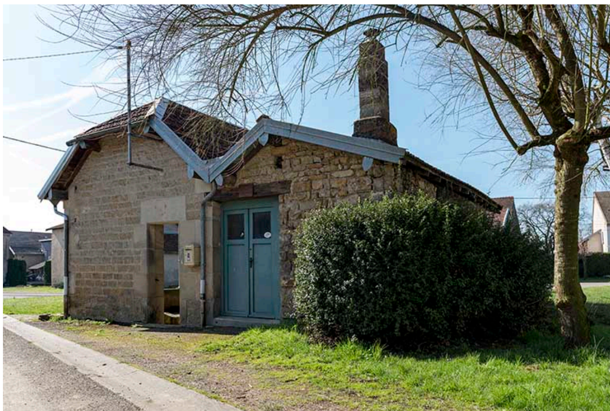
Fontaine-lavoir du Petit-Magny : vue de trois-quart nord.