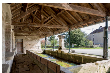
Fontaine-lavoir à l'angle de la Grande rue et de la rue du Bas : vue intérieure depuis le nord-ouest.