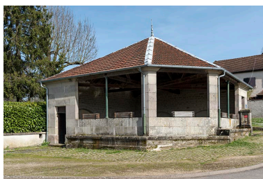
Fontaine-lavoir rue Saint Antoine : vue de trois-quart sud-ouest.