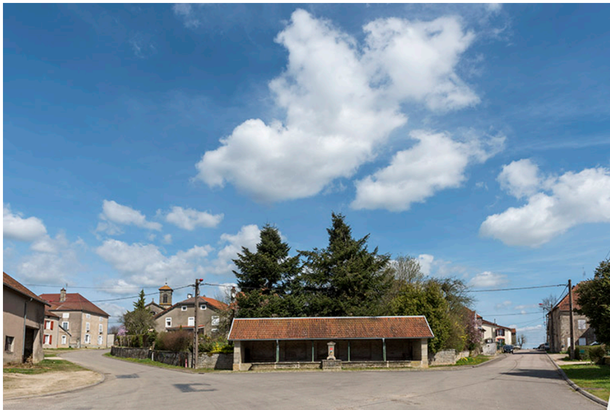
La fontaine-lavoir du bas du village vue de face.