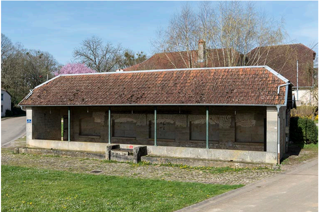
Fontaine-lavoir du Petit-Magny : vue de face depuis l'est.