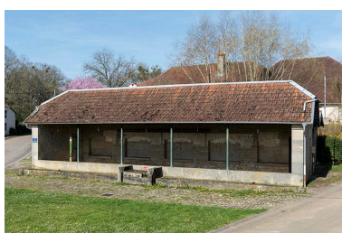
Fontaine-lavoir du Petit-Magny : vue de face depuis l'est.