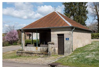
Fontaine-lavoir rue Saint Antoine : vue de trois-quart nord-est.