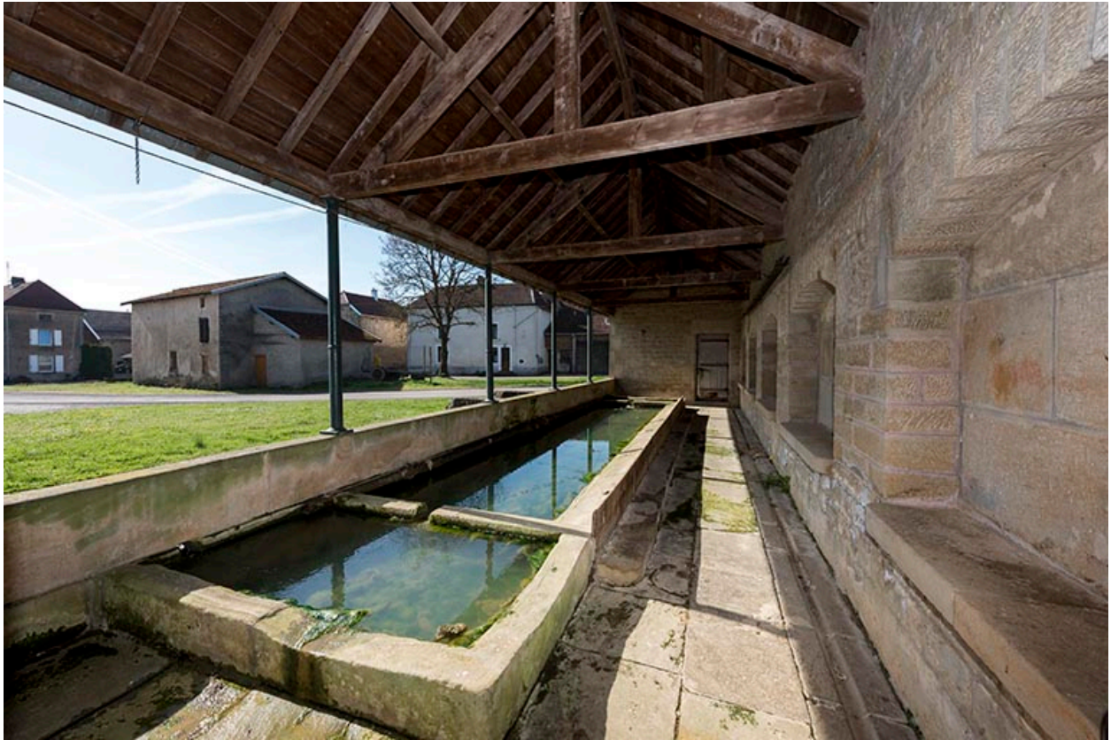
Fontaine-lavoir du Petit-Magny : vue intérieure depuis le nord-est.