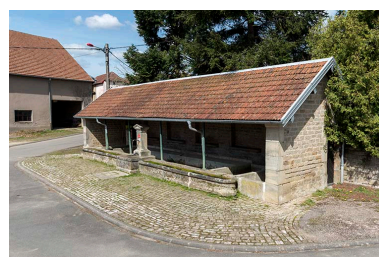
Fontaine-lavoir à l'angle de la Grande rue et de la rue du Bas : vue de trois-quart sud-est.