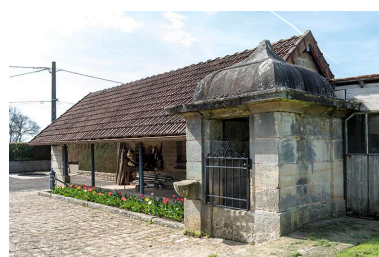
Ancienne fontaine-lavoir, 2 rue de Jonvelle : vue de trois-quart est.