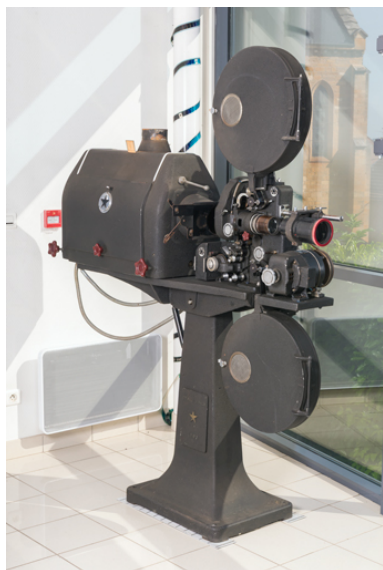
1er projecteur : vue d'ensemble. IVR26_20257100695NUC4A