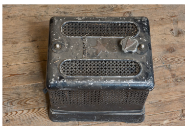
Redresseur. IVR26_20257100715NUC4A