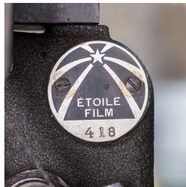
1er projecteur : plaque vissée sur le chrono. IVR26_20257100699NUC2A