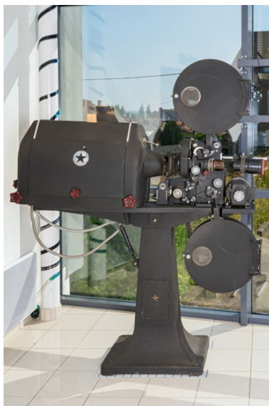
1er projecteur : face latérale gauche. IVR26_20257100696NUC4A