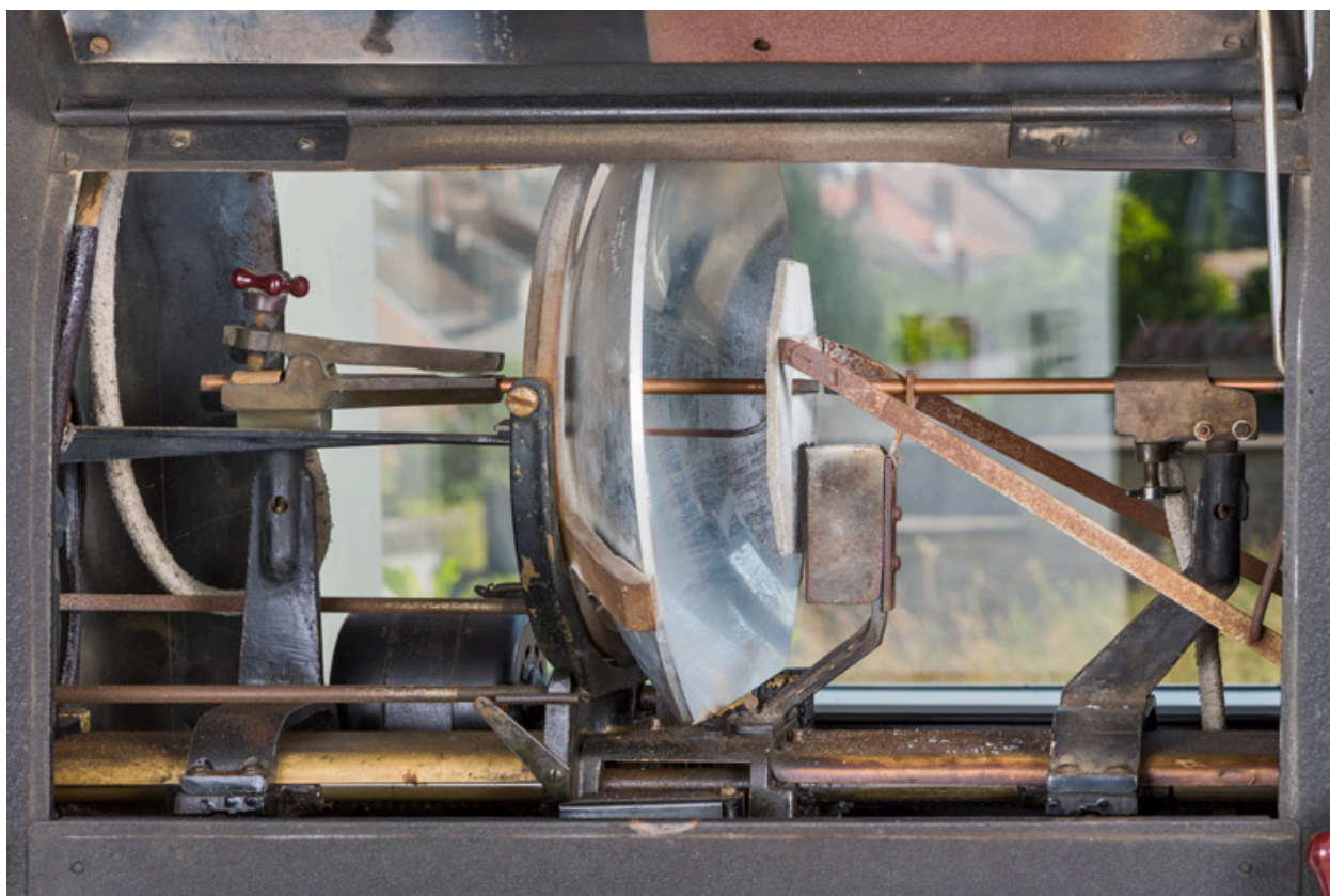
1er projecteur : lanterne ouverte, montrant miroir et électrodes, cache baissé.