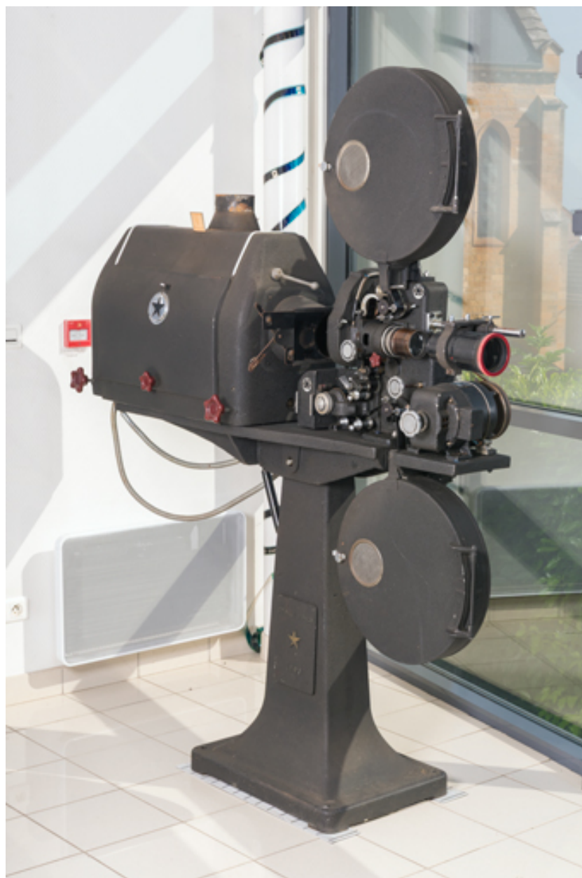
1er projecteur : vue d'ensemble.