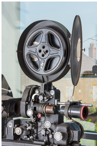
1er projecteur : porte- bobine ouvert et chrono (avec optique et moteur électrique). IVR26_20257100698NUC4A