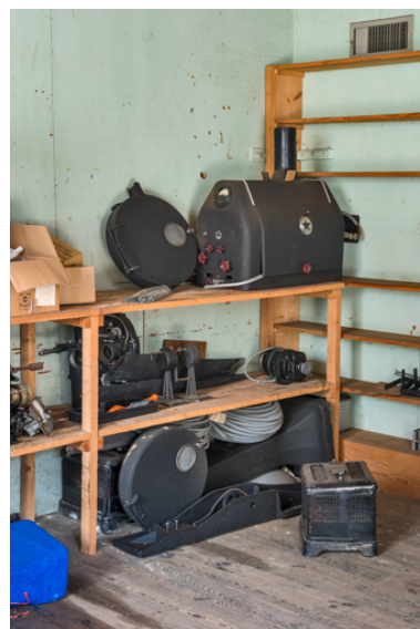
2e projecteur (démonté). IVR26_20257100713NUC4A