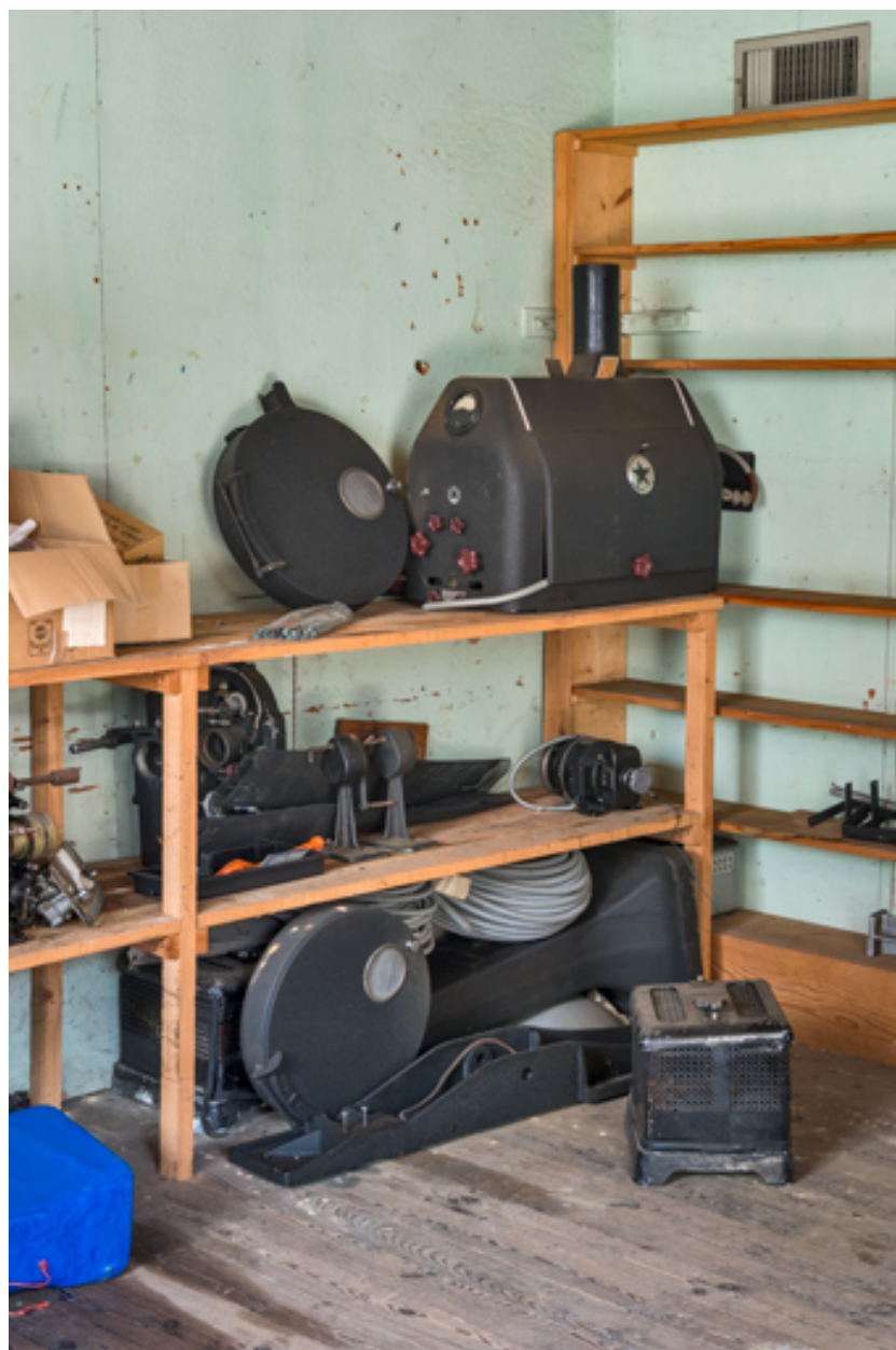
2e projecteur (démonté).