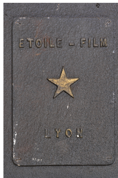
1er projecteur : nom du constructeur et logotype sur le couvercle vissée sur le pied.