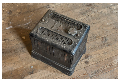
Redresseur. IVR26_20257100714NUC4A