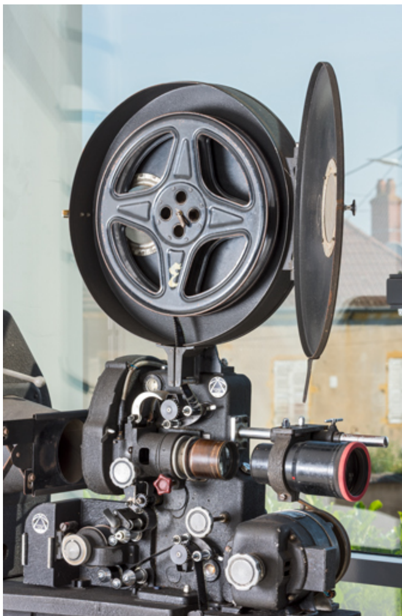
1er projecteur : porte-bobine ouvert et chrono (avec optique et moteur électrique).