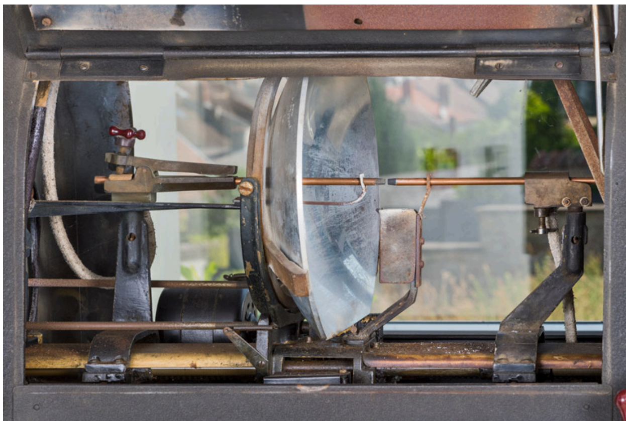
1er projecteur : lanterne ouverte, montrant miroir et électrodes.