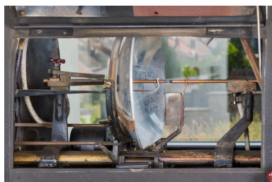
1er projecteur : lanterne ouverte, montrant miroir et électrodes. IVR26_20257100701NUC4A