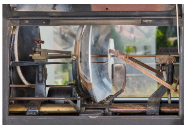
1er projecteur : lanterne ouverte, montrant miroir et électrodes, cache baissé. IVR26_20257100702NUC4A