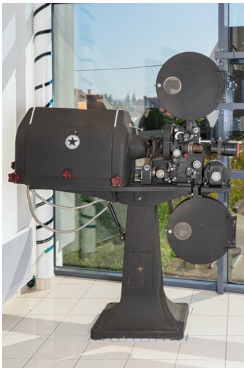
1er projecteur : face latérale gauche.