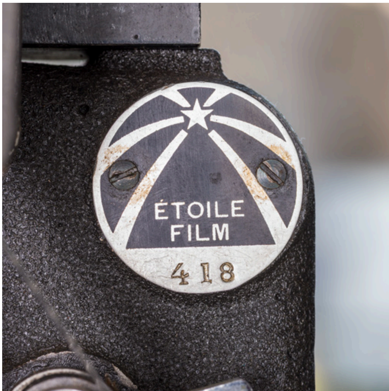
1er projecteur : plaque vissée sur le chrono.