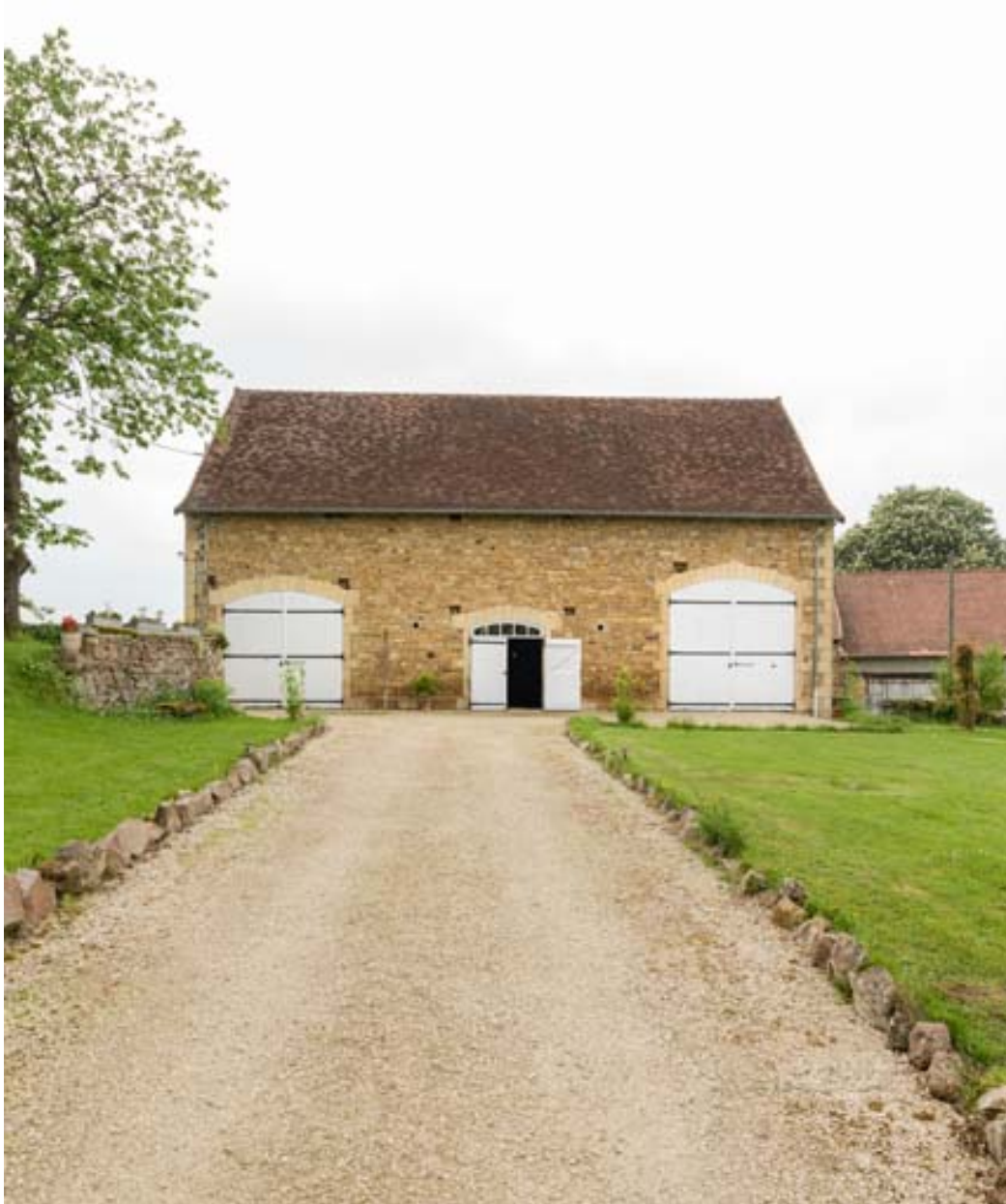
L'étable vue de face.