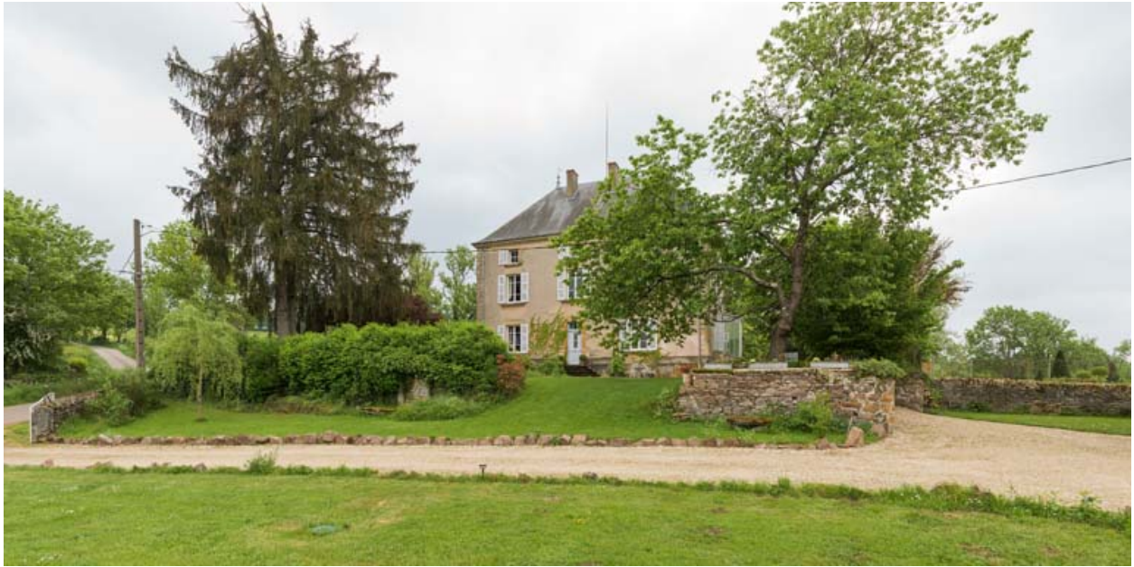
Maison d'habitation. Vue d'ensemble depuis le nord.