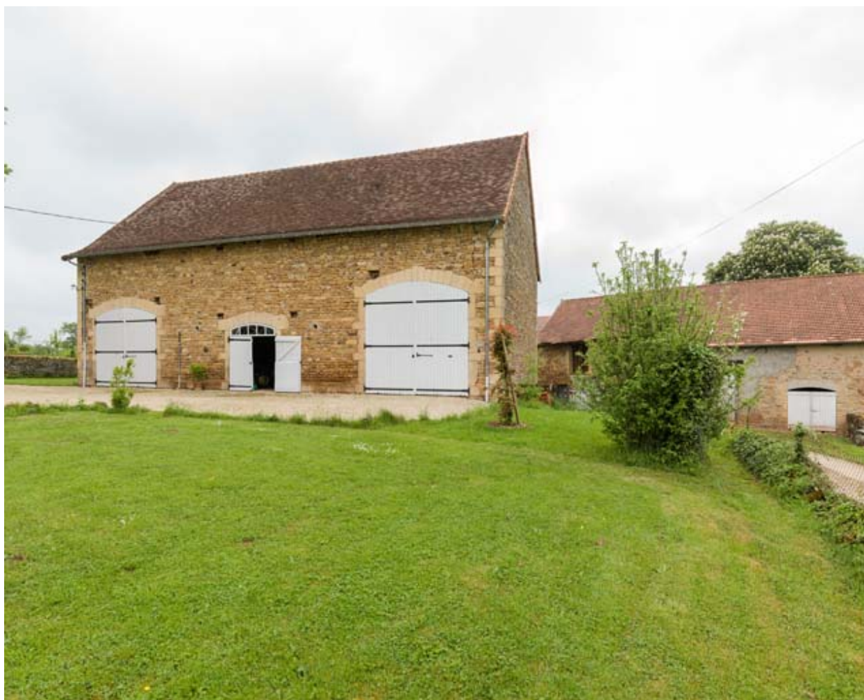
L'étable, vue de trois quart droite.