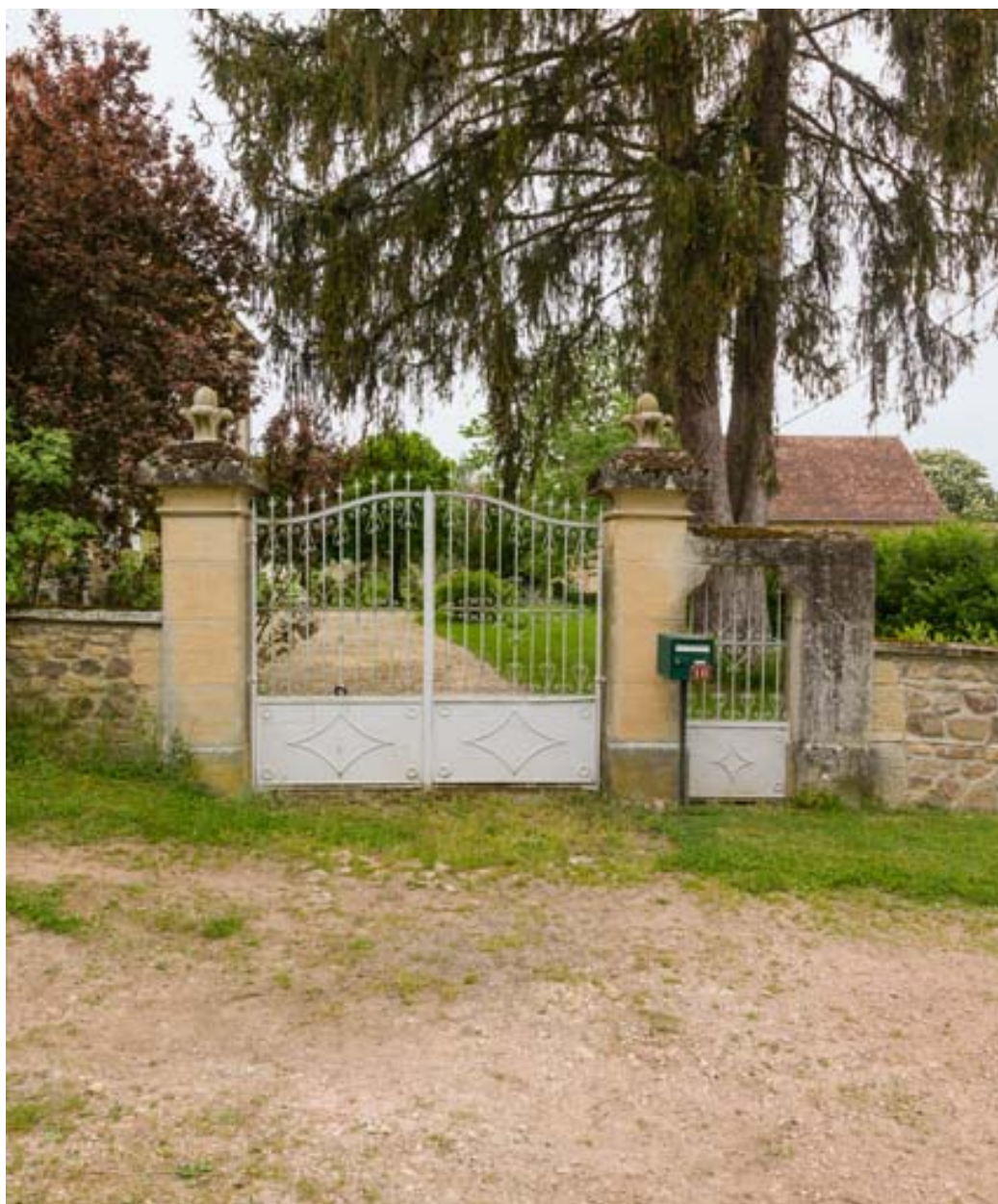
Le portail d'entrée.