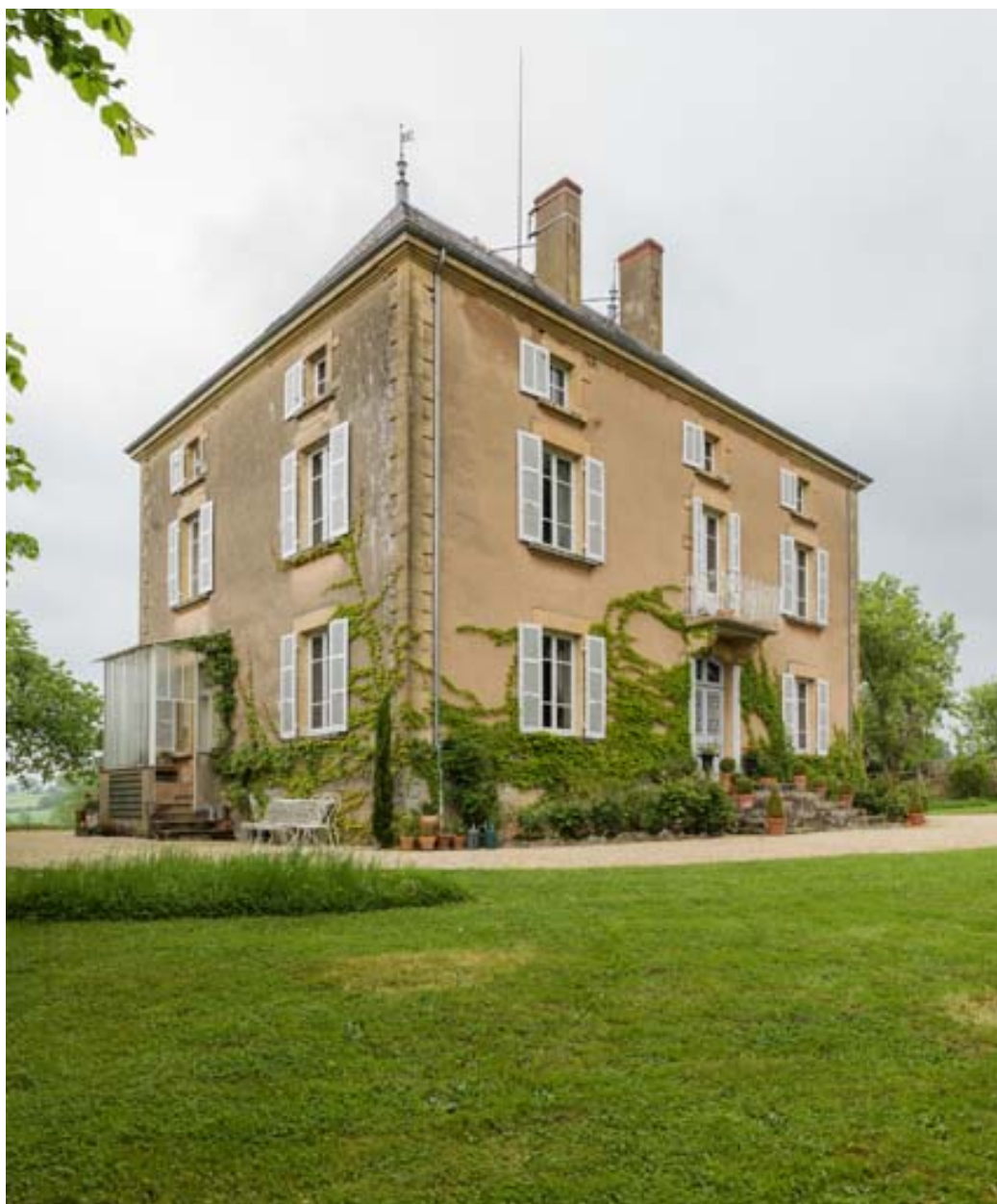
La maison, vue de trois quart gauche.