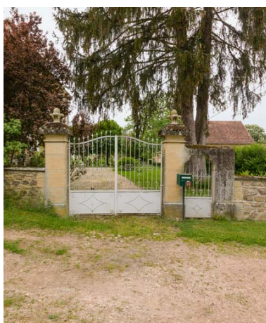
Le portail d'entrée.