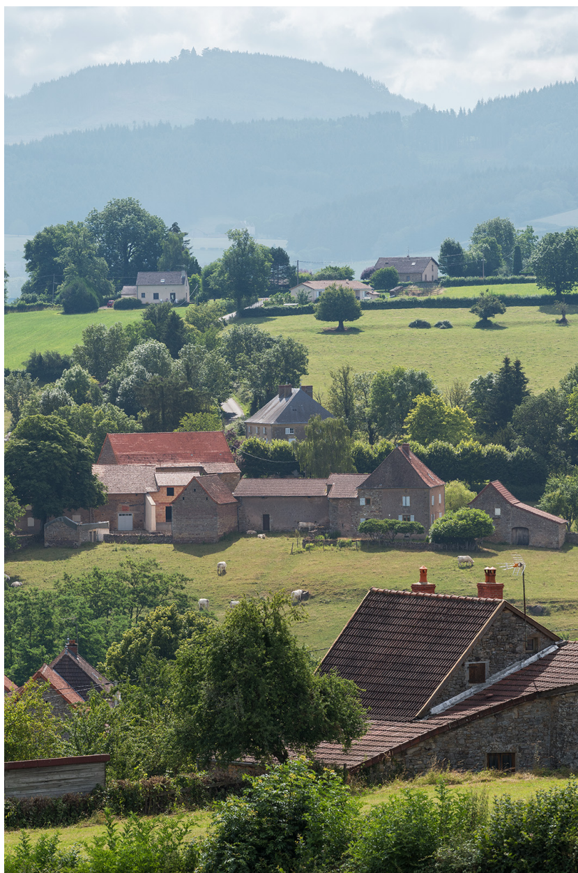
Le hameau des Chevennes (cadrage vertical).