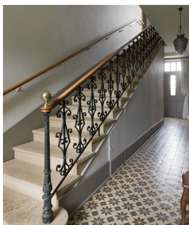
Escalier d'accès au premier étage. IVR26_20187100028NUC2A