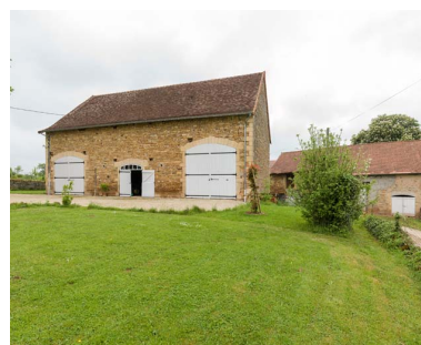
L'étable, vue de trois quart droite. IVR26_20187100023NUC4AQ