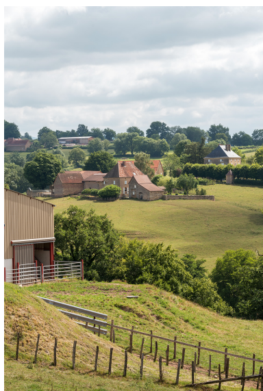
Vue d'ensemble depuis le sud-ouest. IVR26_20187100129NUC4A