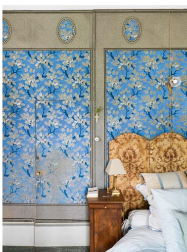
Chambre à coucher. Détail du papier peint. IVR26_20187100029NUC4A