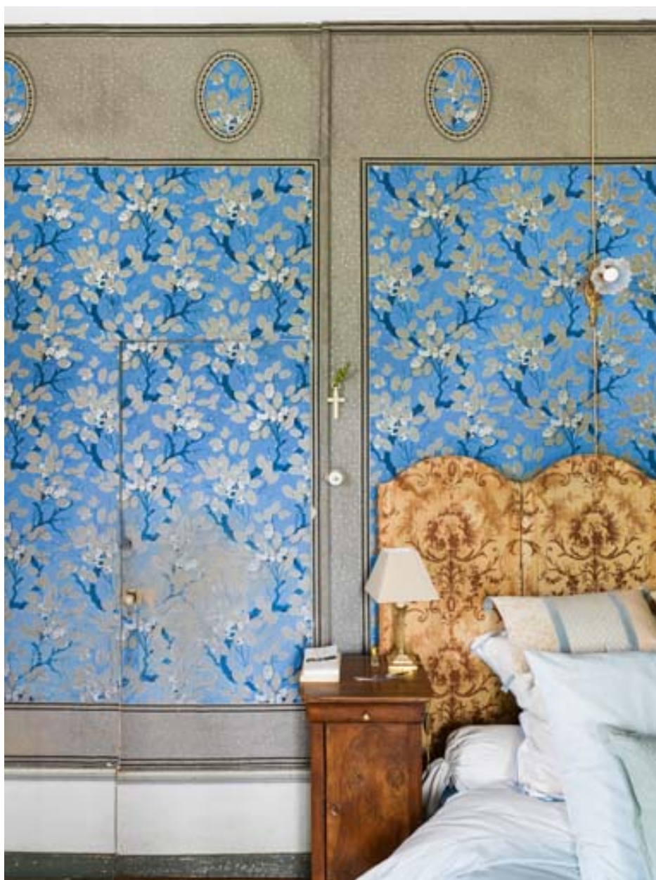
Chambre à coucher. Détail du papier peint.