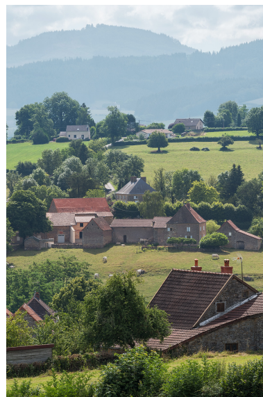
Le hameau des Chevennes (cadrage vertical).