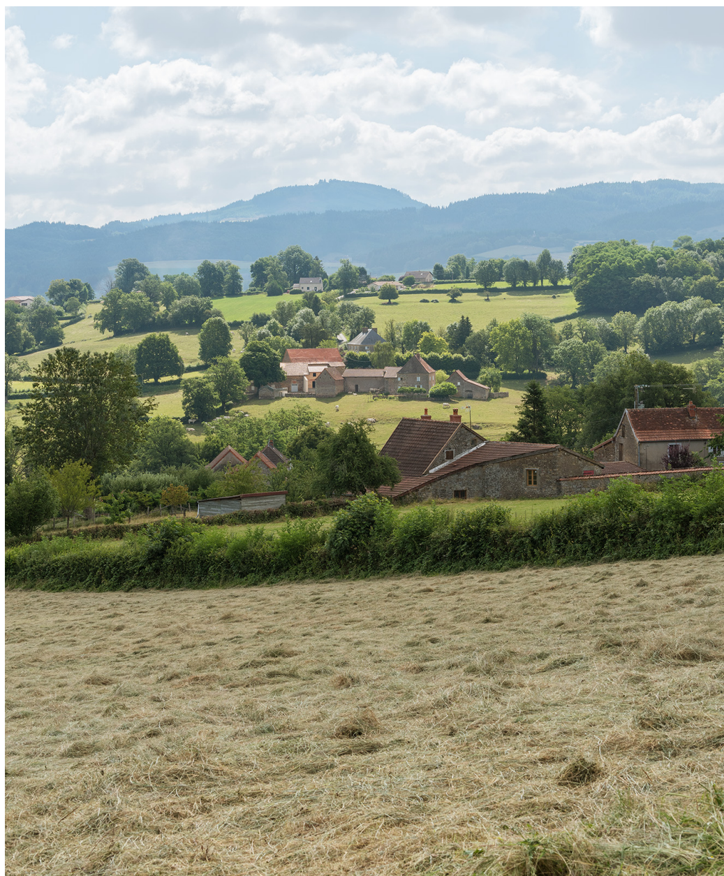
Le hameau des Chevennes dans la campagne brionnaise.