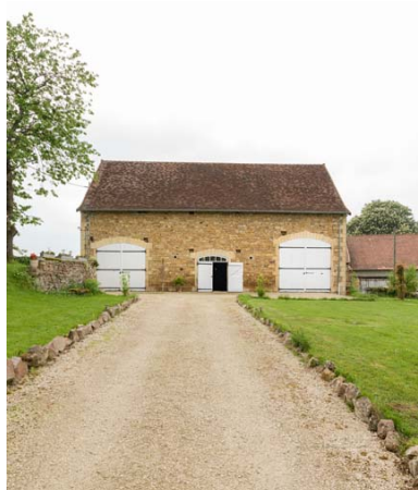
L'étable vue de face. IVR26_20187100022NUC2A