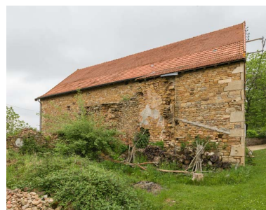
Façade postérieure de l'étable. IVR26_20187100025NUC2A