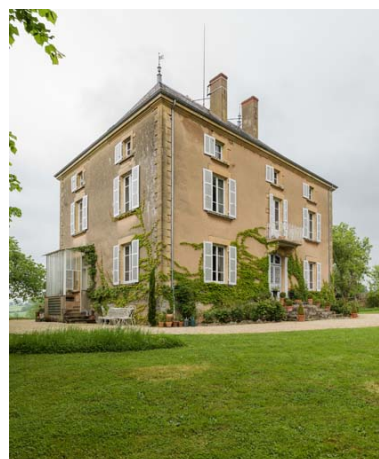
La maison, vue de trois quart gauche. IVR26_20187100019NUC2A