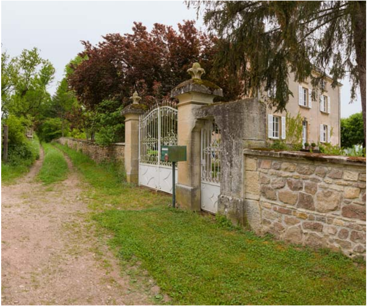
Le portail et la maison d'habitation.