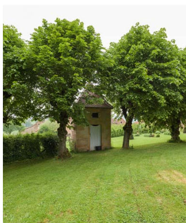
Le colombier. IVR26_20187100020NUC2A