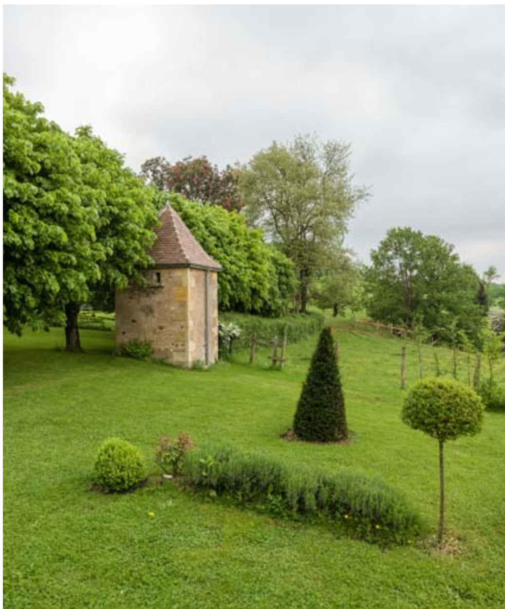
Le colombier, vu depuis le parc.