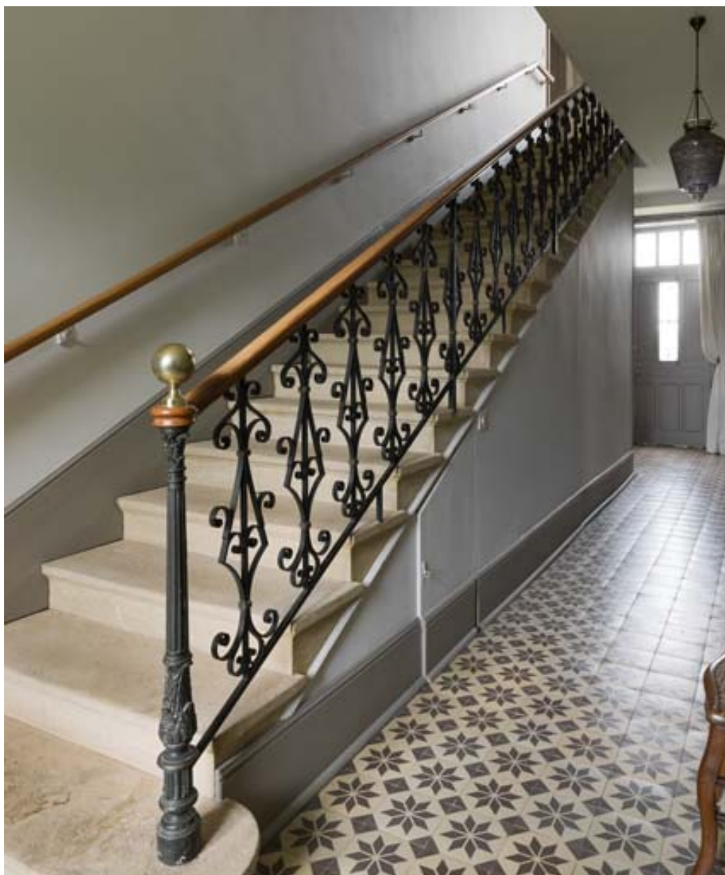
Escalier d'accès au premier étage.