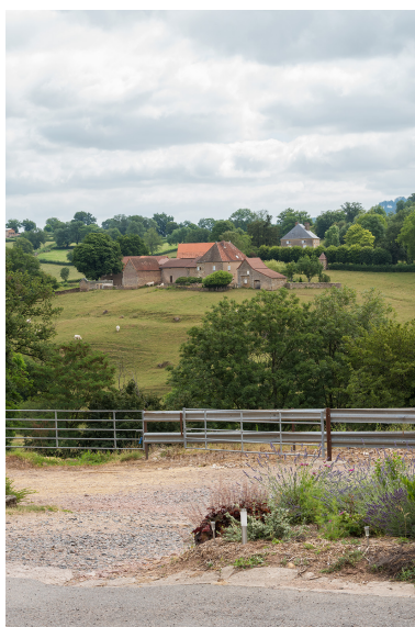
Vue d'ensemble depuis l'ouest. IVR26_20187100130NUC4A