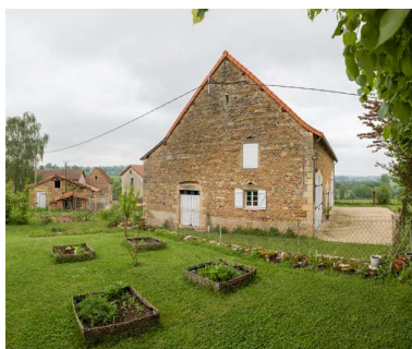
Pignon sud de l'étable. IVR26_20187100024NUC4AQ