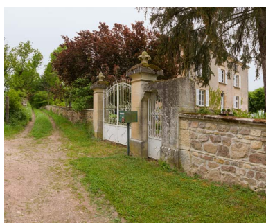
Le portail et la maison d'habitation.