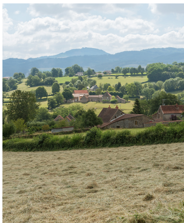
Le hameau des Chevennes dans la campagne brionnaise. IVR26_20187100127NUC2A

Plan de masse et de situation, présentant l'évolution des bâtiments du hameau. Extrait du plan cadastral, 2020, section C, échelle 1/5000. IVR26_20207100120NUDA