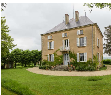
Façade postérieure, vue de trois quarts droite. IVR26_20187100018NUC2A