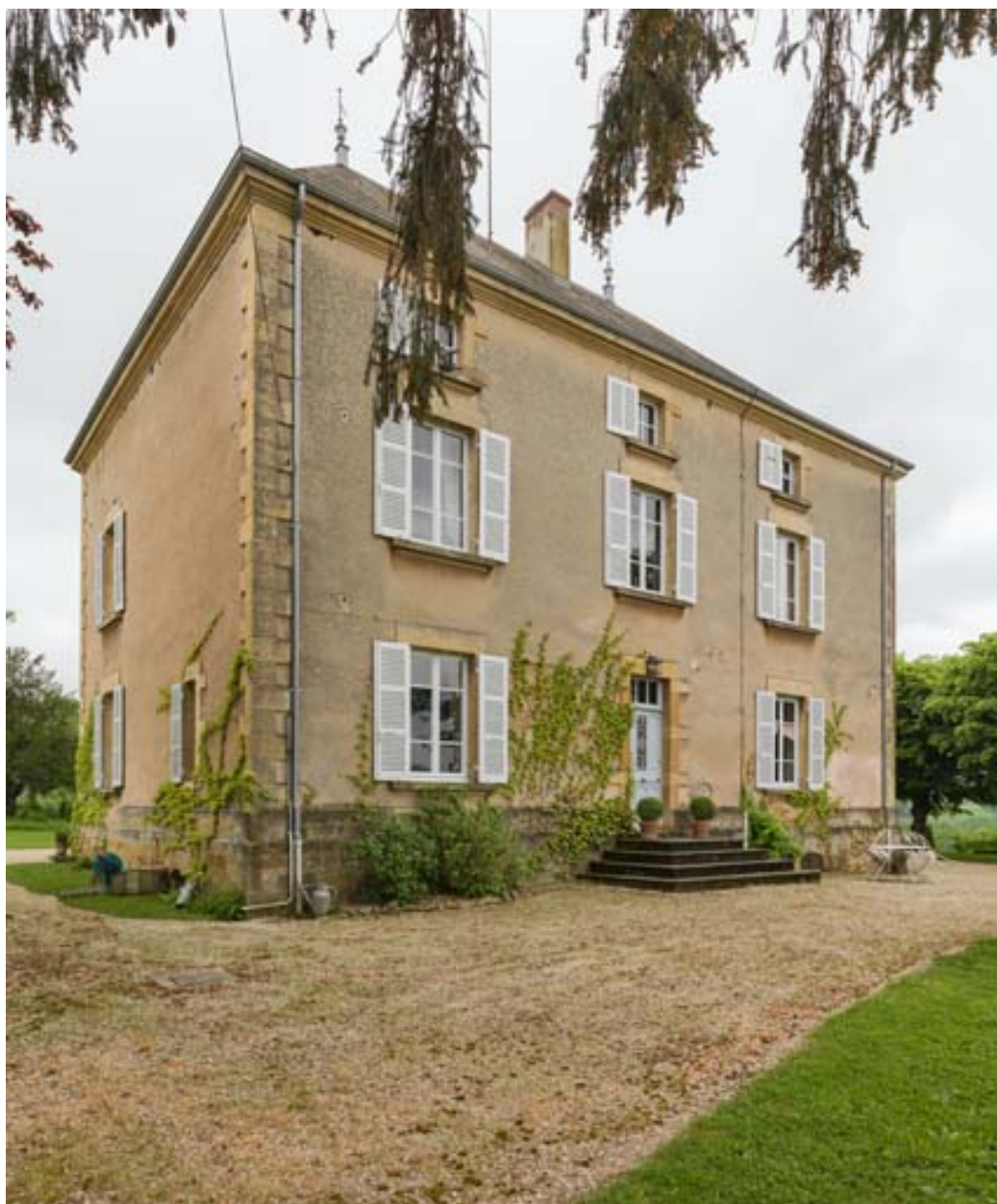
Façade nord de la maison, vue de trois quarts gauche.