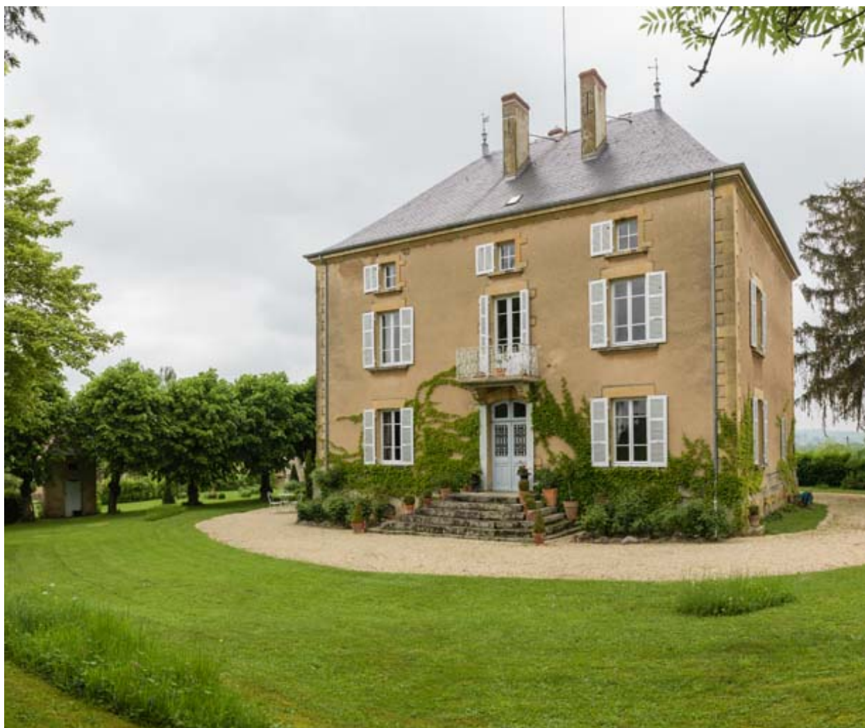
Façade postérieure, vue de trois quarts droite.