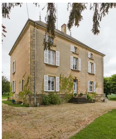
Façade nord de la maison, vue de trois quarts gauche. IVR26_20187100017NUC2A