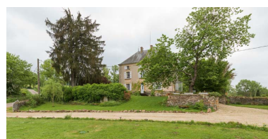
Maison d'habitation. Vue d'ensemble depuis le nord. IVR26_20187100016NUC2AQ