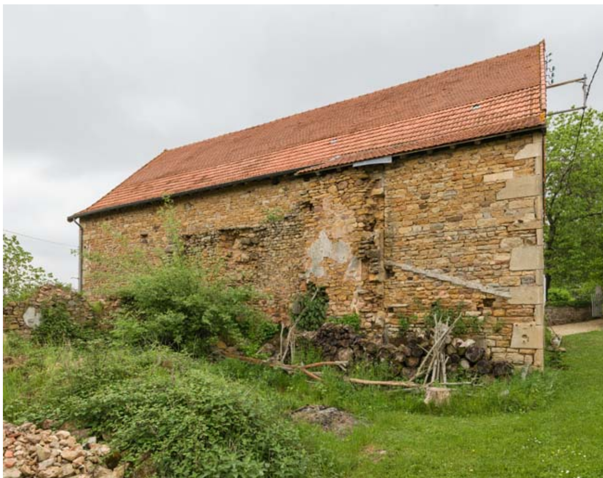
Façade postérieure de l'étable.