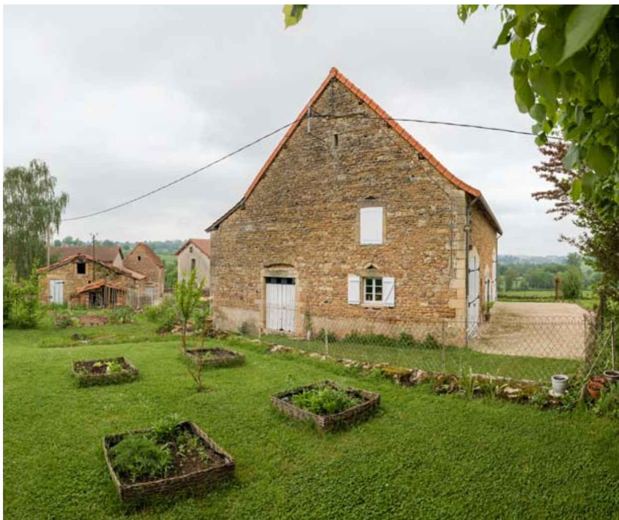
Pignon sud de l'étable.