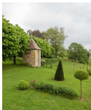
Le colombier, vu depuis le parc.