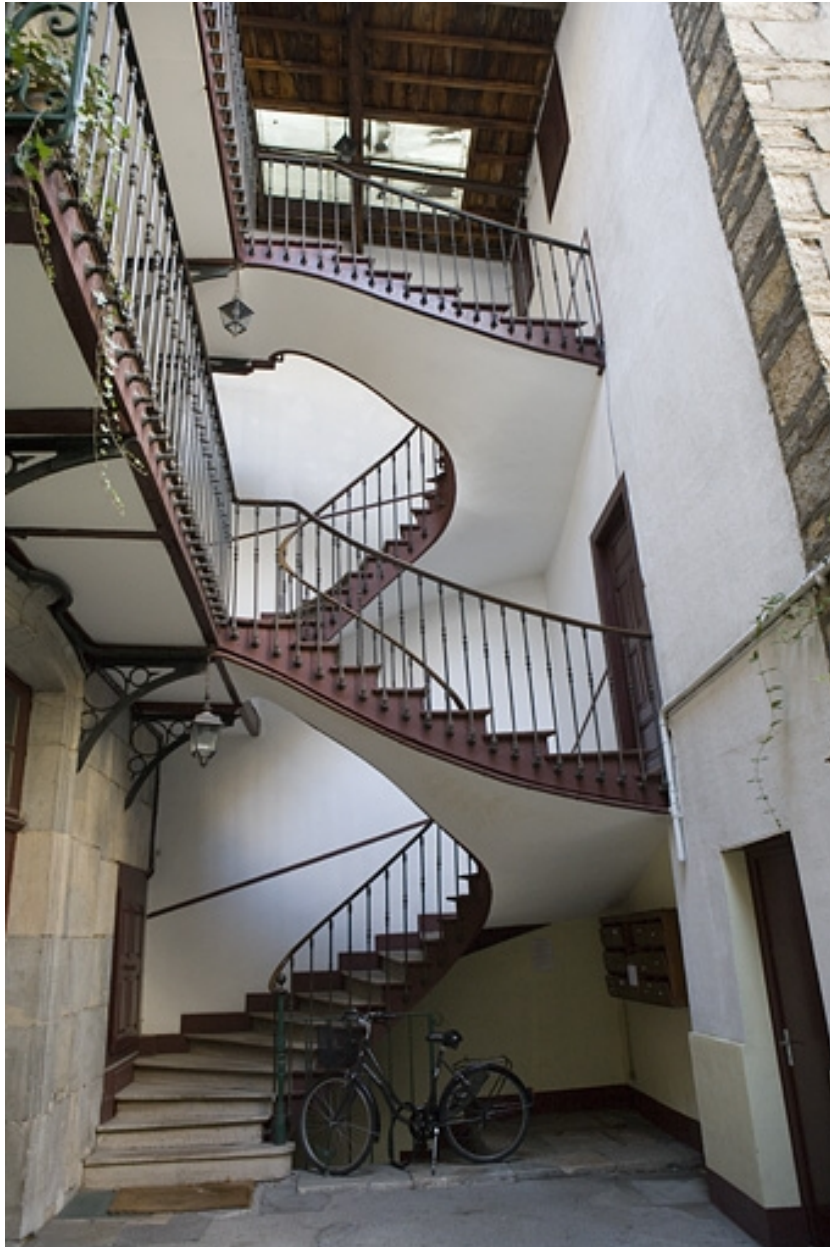
Détail de l'escalier à cage ouverte du logis principal.