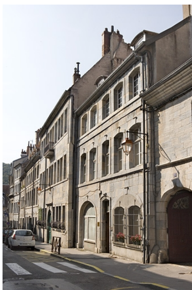
Vue d'ensemble du logis sur rue, de trois quarts droit.