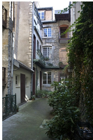
Vue d'ensemble des bâtiments depuis le fond de la cour. IVR43_20092501374NUC2A