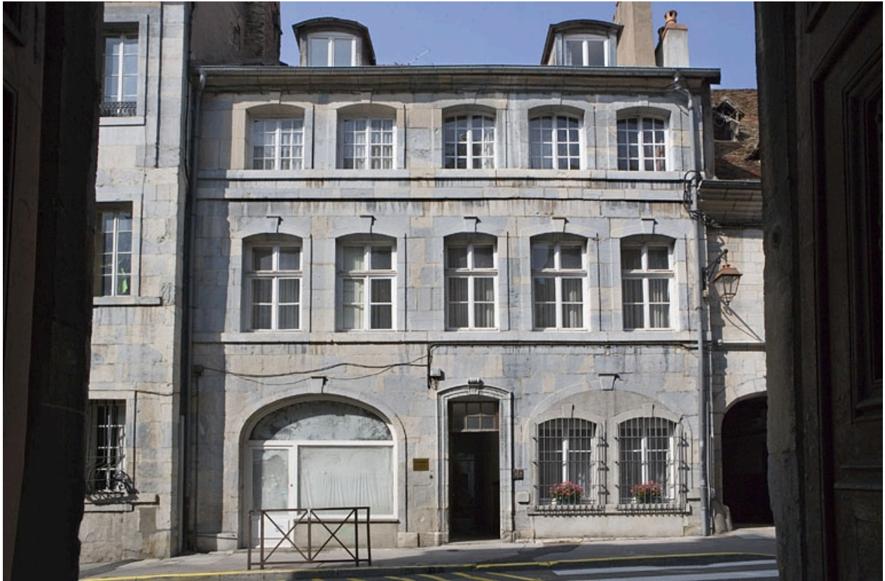
Vue d'ensemble du logis sur rue, de face.