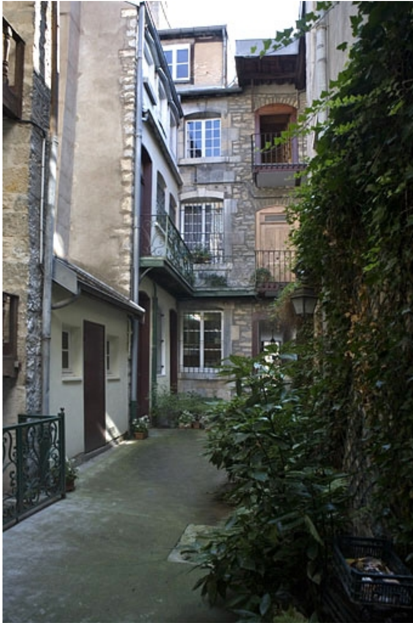
Vue d'ensemble des bâtiments depuis le fond de la cour.