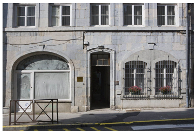
Logis sur rue, détail du rez-de-chaussée.