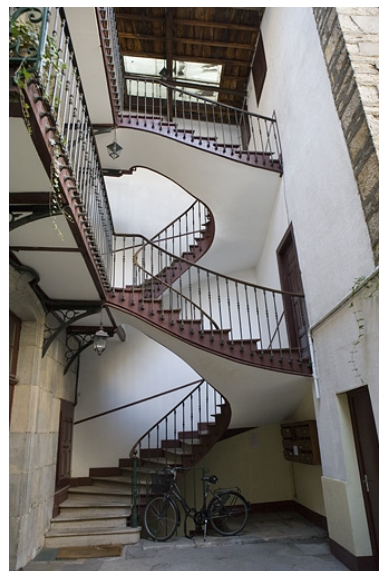
Détail de l'escalier à cage ouverte du logis principal. IVR43_20092501378NUC2A