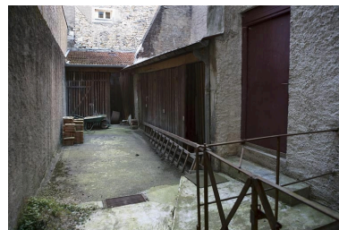
Vue d'ensemble des bûchers dans la deuxième cour.