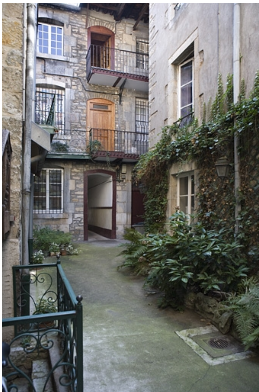
Vue d'ensemble de la façade postérieure du logis sur rue depuis le fond de la cour.