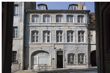
Vue d'ensemble du logis sur rue, de face.