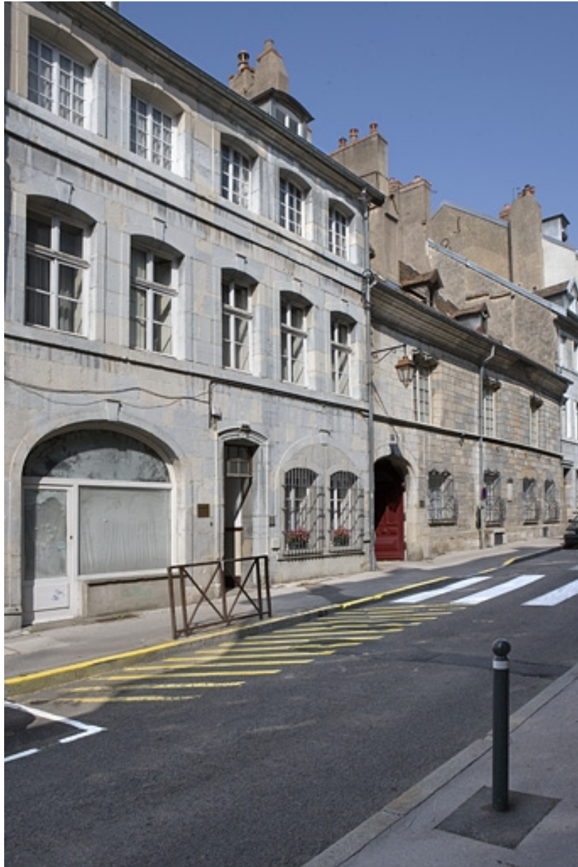
Vue d'ensemble du logis sur rue, de trois quarts gauche.