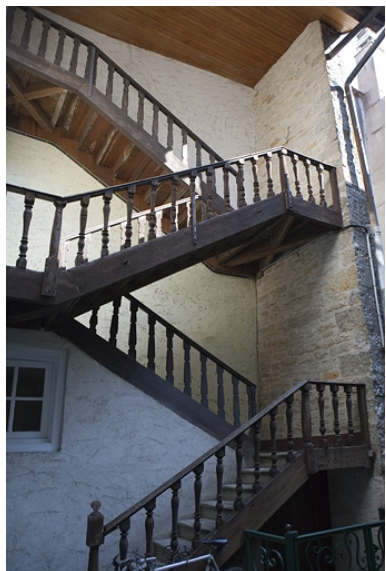
Détail de l'escalier à cage ouverte du logis secondaire. IVR43_20092501377NUC2A