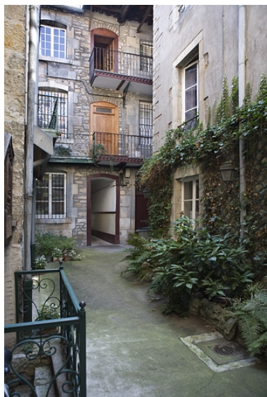
Vue d'ensemble de la façade postérieure du logis sur rue depuis le fond de la cour.