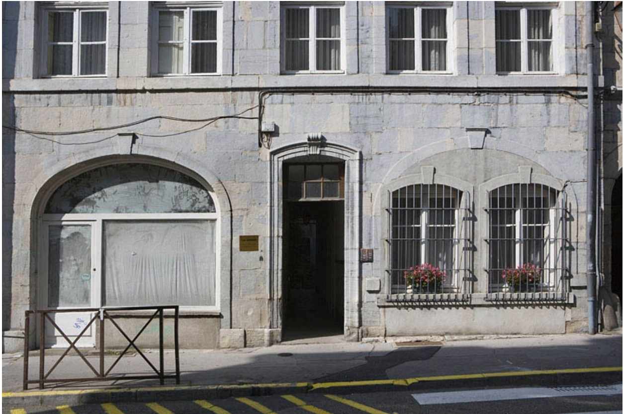
Logis sur rue, détail du rez-de-chaussée.