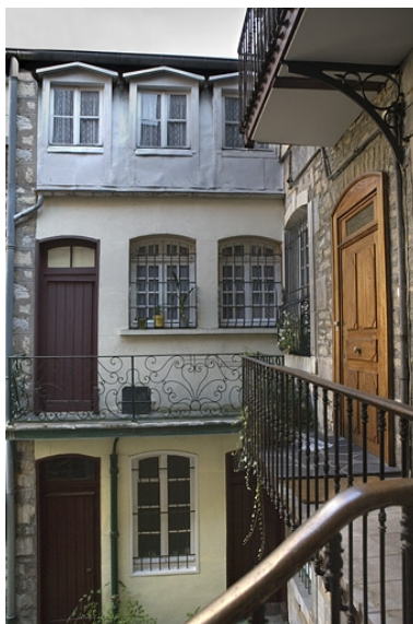
Détail de l'aile droite sur cour depuis l'escalier à cage ouverte. IVR43_20092501376NUC2A