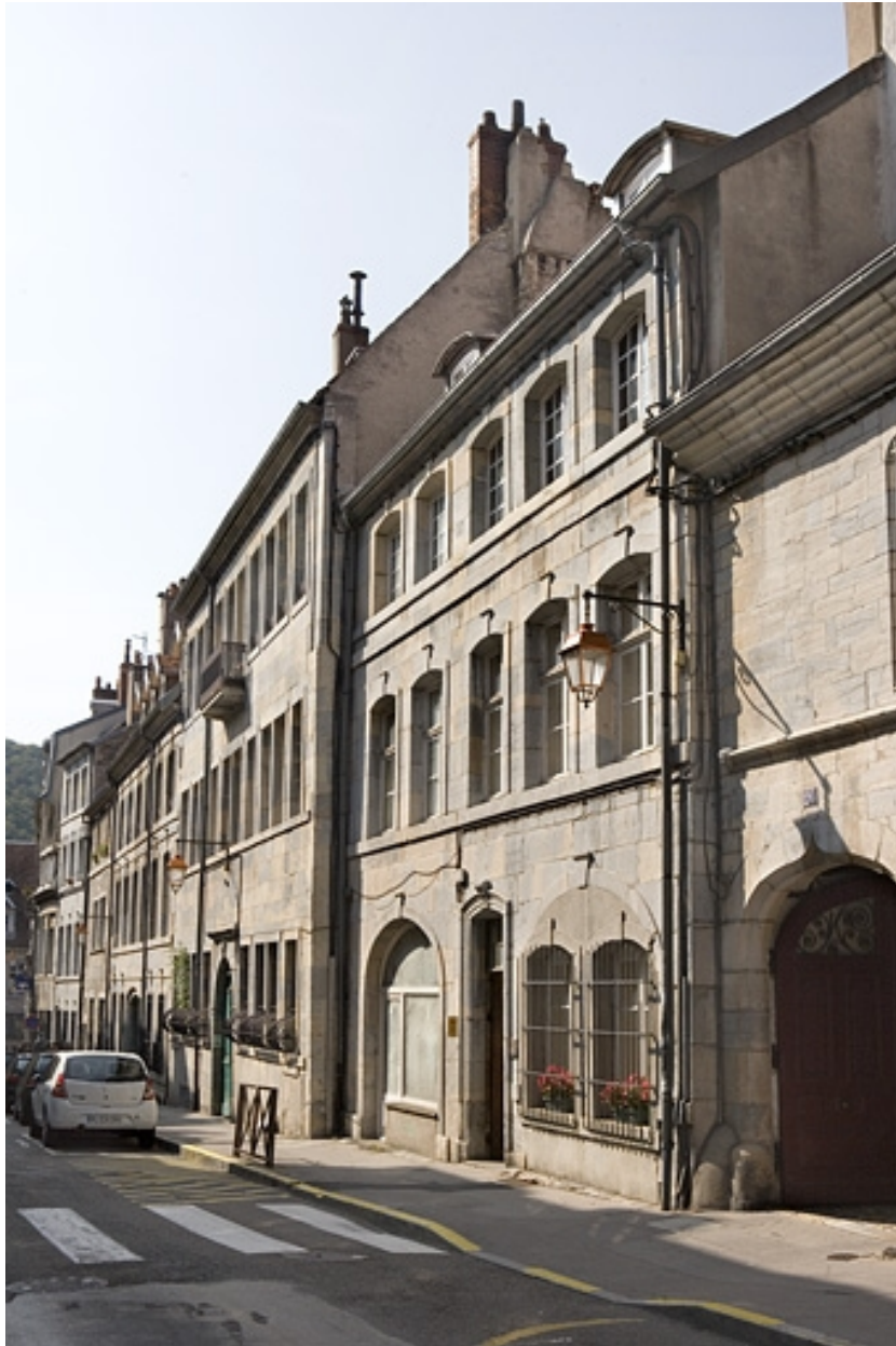
Vue d'ensemble du logis sur rue, de trois quarts droit.