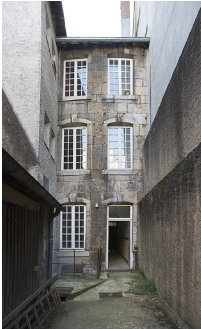
Vue d'ensemble de la façade postérieure du logis secondaire sur la deuxième cour.