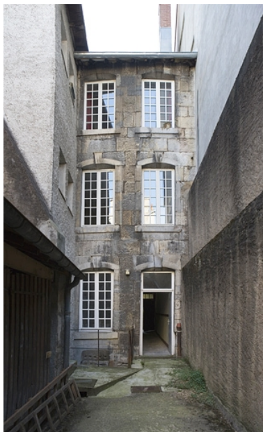
Vue d'ensemble de la façade postérieure du logis secondaire sur la deuxième cour.