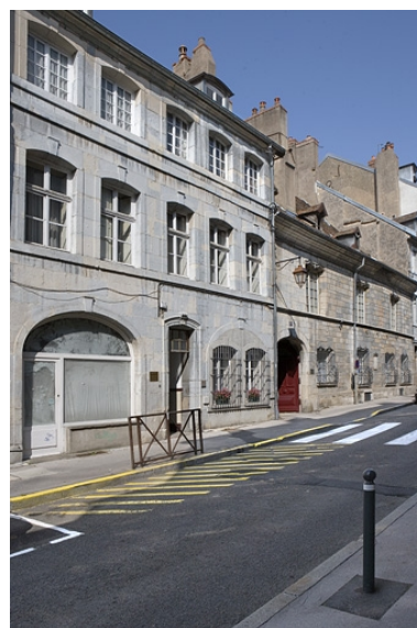
Vue d'ensemble du logis sur rue, de trois quarts gauche.