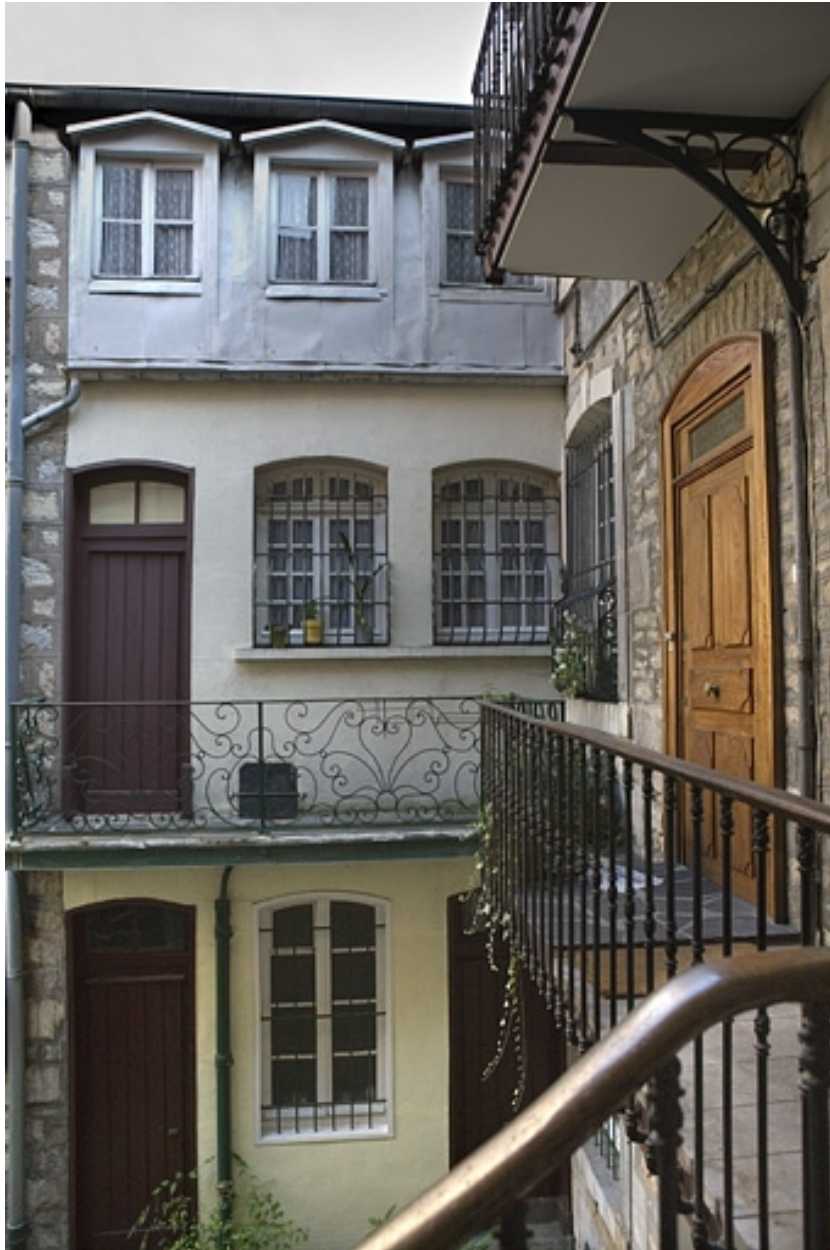
Détail de l'aile droite sur cour depuis l'escalier à cage ouverte.