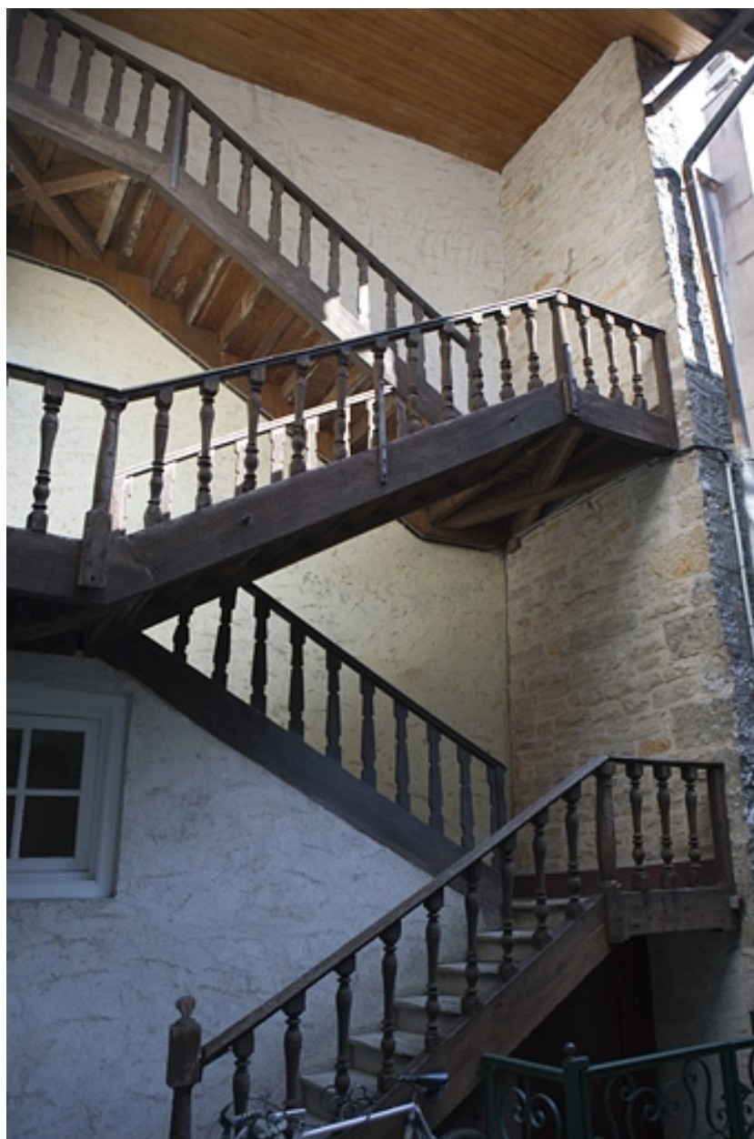
Détail de l'escalier à cage ouverte du logis secondaire.