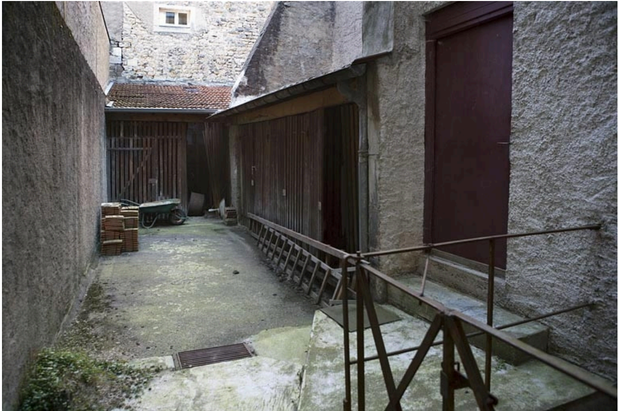
Vue d'ensemble des bûchers dans la deuxième cour.