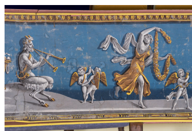
Décor de la galerie, partie gauche : satyre, putti et bacchante. IVR26_20238900370NUC4A