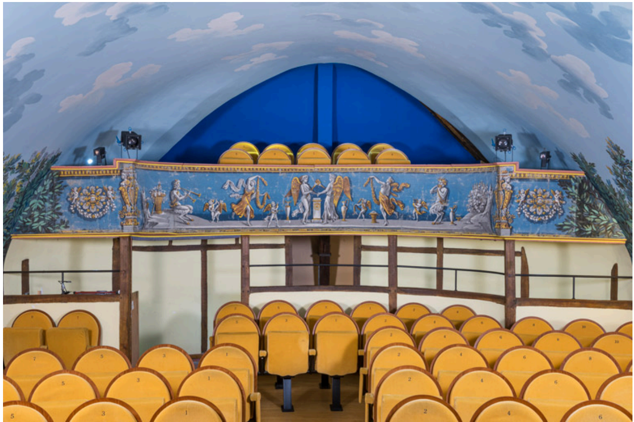
Décor de la galerie.