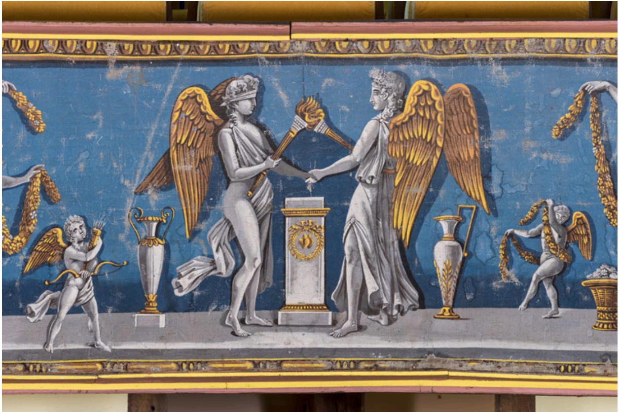
Décor de la galerie, partie centrale : l'Union de l'Hymen, avec putti.