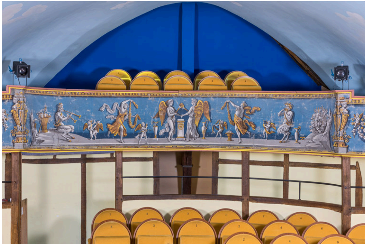
Décor de la galerie : partie centrale.