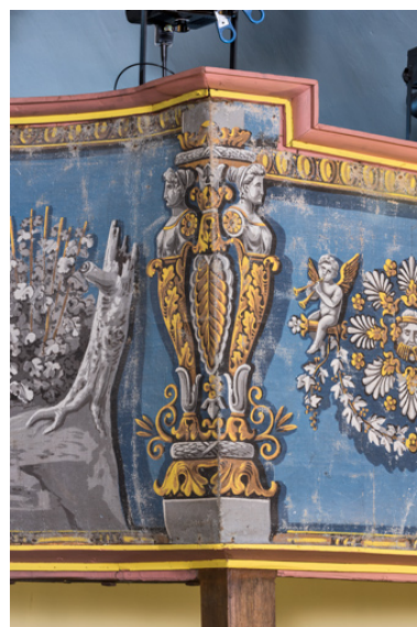
Décor de la galerie : termes sur l'angle de la travée de droite. IVR26_20238900379NUC4A