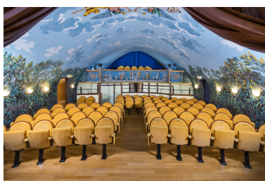
Vue vers la galerie. IVR26_20238900365NUC4A