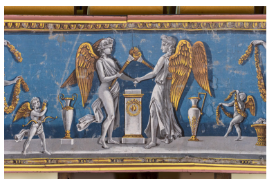
Décor de la galerie, partie centrale : l'Union de l'Hymen, avec putti. IVR26_20238900368NUC4A