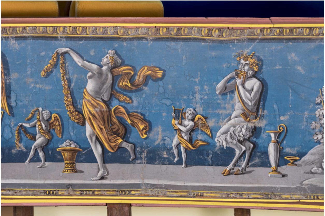
Décor de la galerie, partie droite : putti, bacchante et satyre.