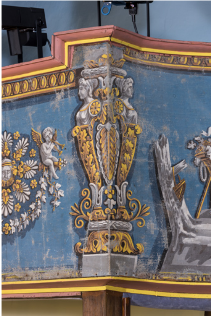
Décor de la galerie : termes sur l'angle de la travée de gauche.