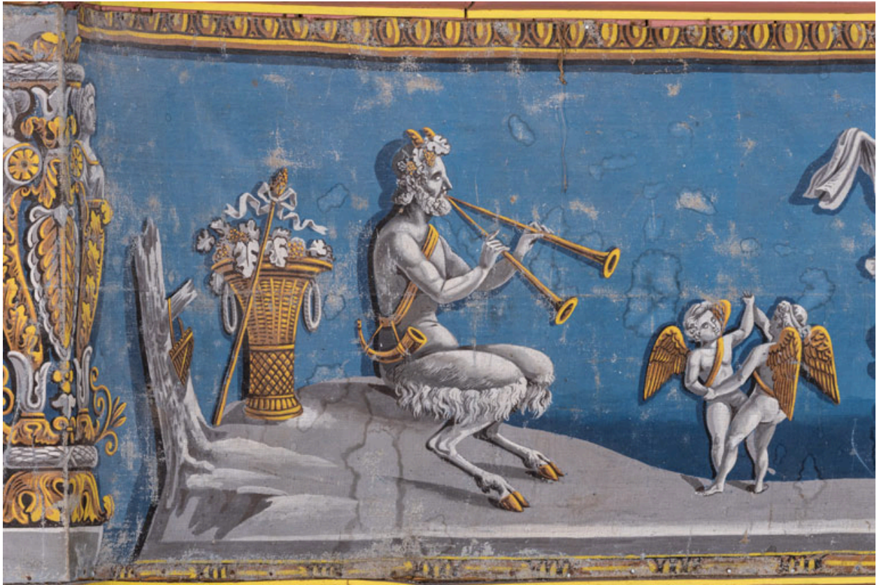
Décor de la galerie, partie gauche : satyre et putti dansant.