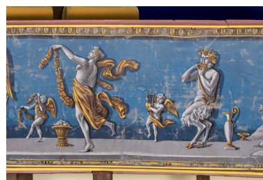
Décor de la galerie, partie droite : putti, bacchante et satyre. IVR26_20238900369NUC4A