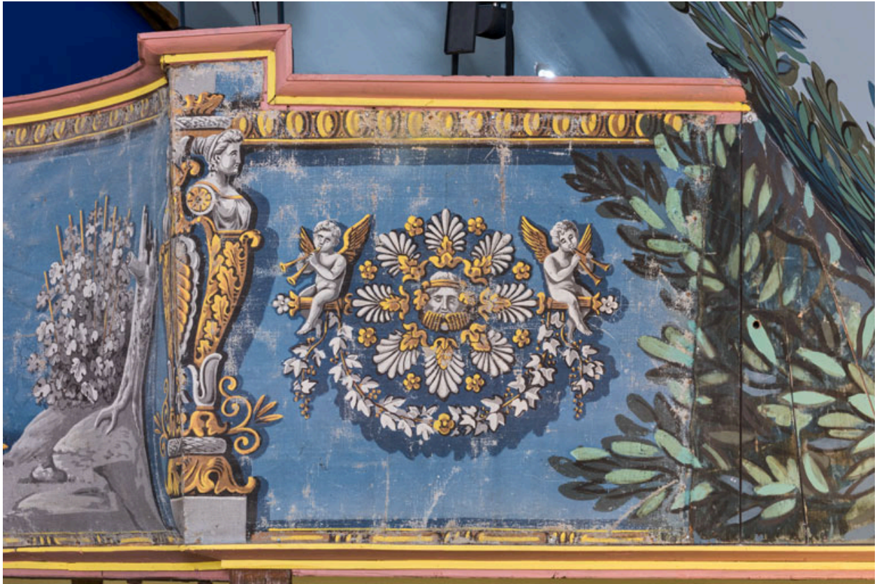
Décor de la galerie : motif sur la travée de droite (terme, putti et tête de bacchus ?).