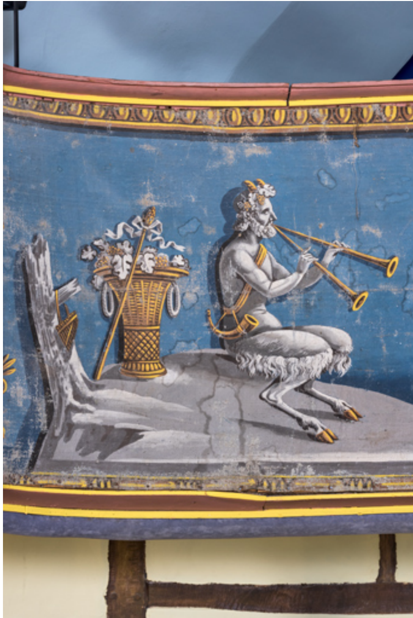
Décor de la galerie, partie gauche : satyre.