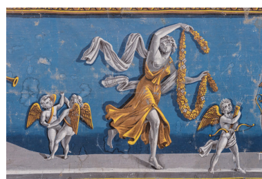
Décor de la galerie, partie gauche : putti et bacchante. IVR26_20238900371NUC4A