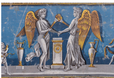
Décor de la galerie, partie centrale : l'Union de l'Hymen.