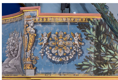
Décor de la galerie : motif sur la travée de droite (terme, putti et tête de bacchus ?). IVR26_20238900378NUC4A