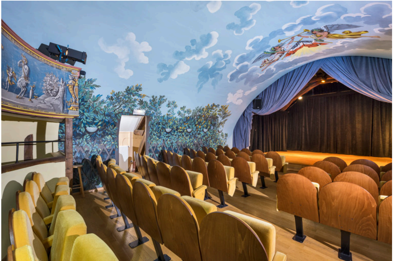
Galerie, paroi latérale gauche (côté jardin) et scène.