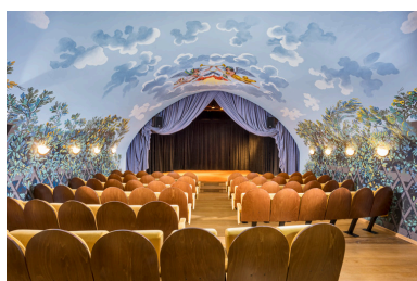
Vue vers la scène.