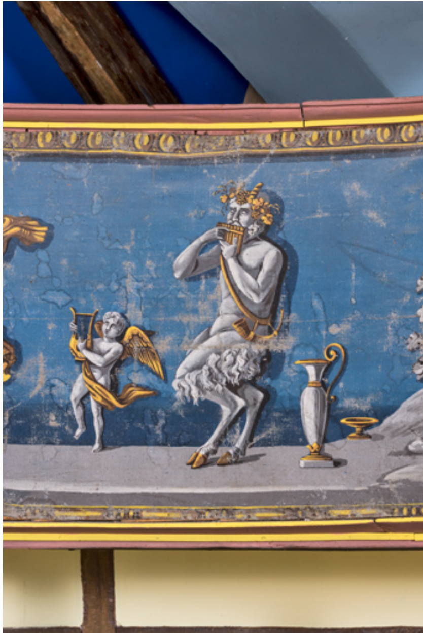
Décor de la galerie, partie droite : putto et satyre (cadrage vertical).