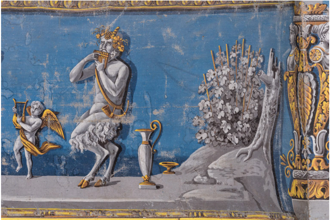
Décor de la galerie, partie droite : putto et satyre.