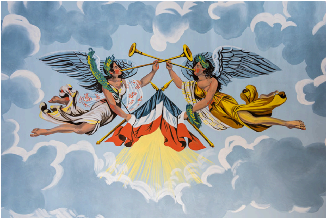
Décor de la fausse voûte : les renommées.