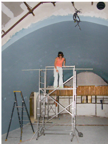
[Réfection des peintures de la voûte : la restauratrice sur l'échafaudage]. 2008.