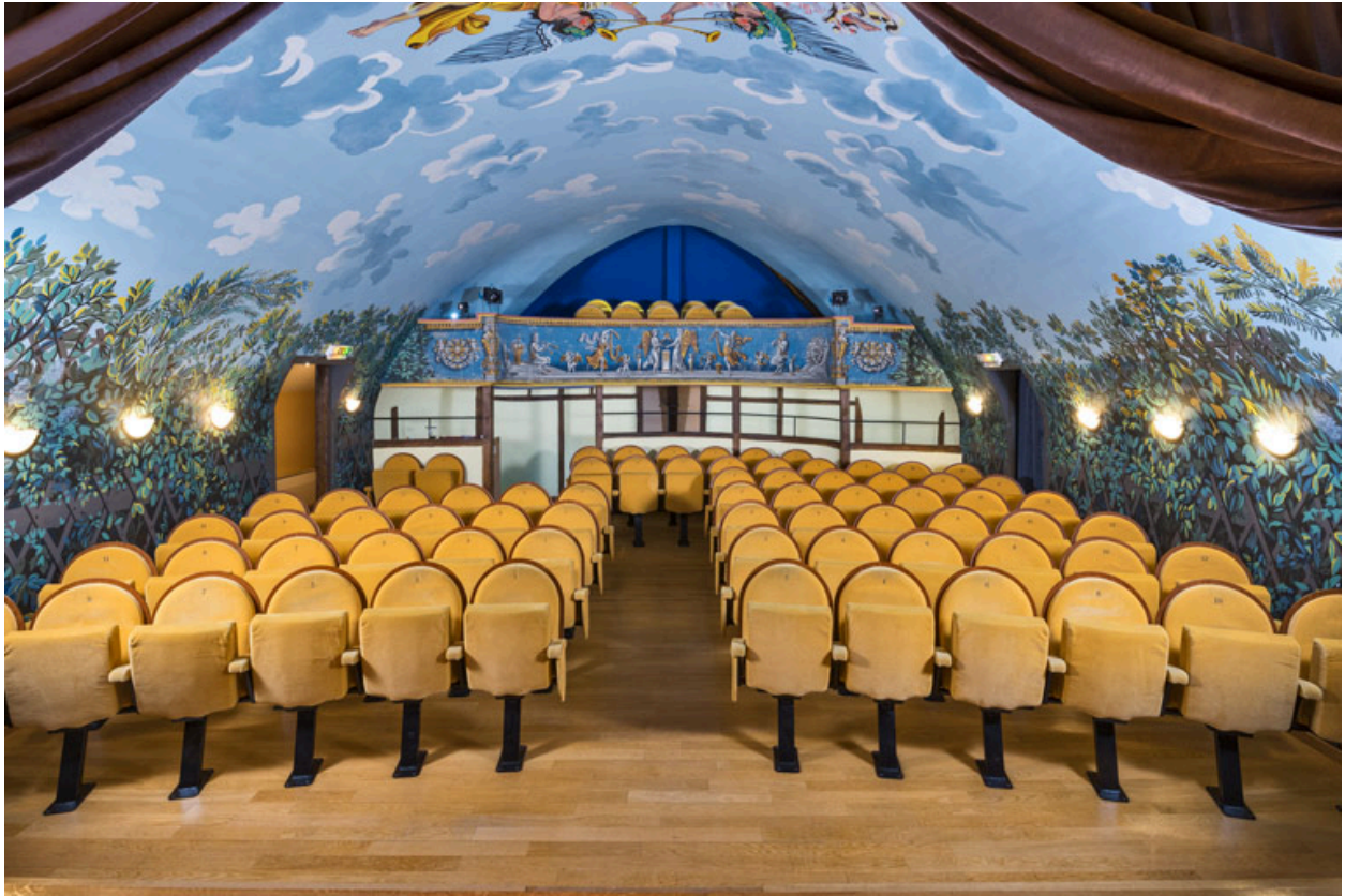
Vue vers la galerie.