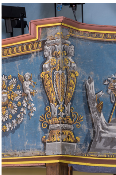
Décor de la galerie : termes sur l'angle de la travée de gauche. IVR26_20238900380NUC4A