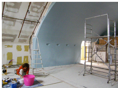
[Réfection des peintures de la voûte : préparation par la restauratrice]. 2008. IVR26_20238900271NUC4A