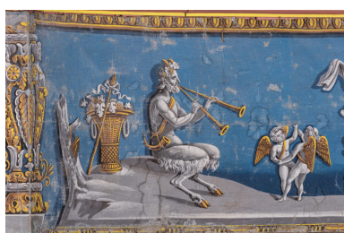
Décor de la galerie, partie gauche : satyre et putti dansant. IVR26_20238900374NUC4A