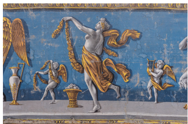
Décor de la galerie, partie droite : putti et bacchante. IVR26_20238900372NUC4A