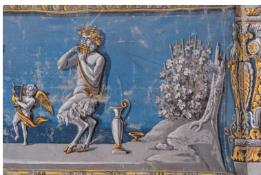
Décor de la galerie, partie droite : putto et satyre.