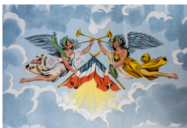
Décor de la fausse voûte : les renommées. IVR26_20238900364NUC4A