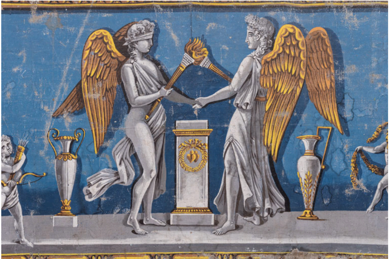
Décor de la galerie, partie centrale : l'Union de l'Hymen.