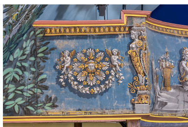
Décor de la galerie : motif sur la travée de gauche (tête de bacchus ?, putti et terme).