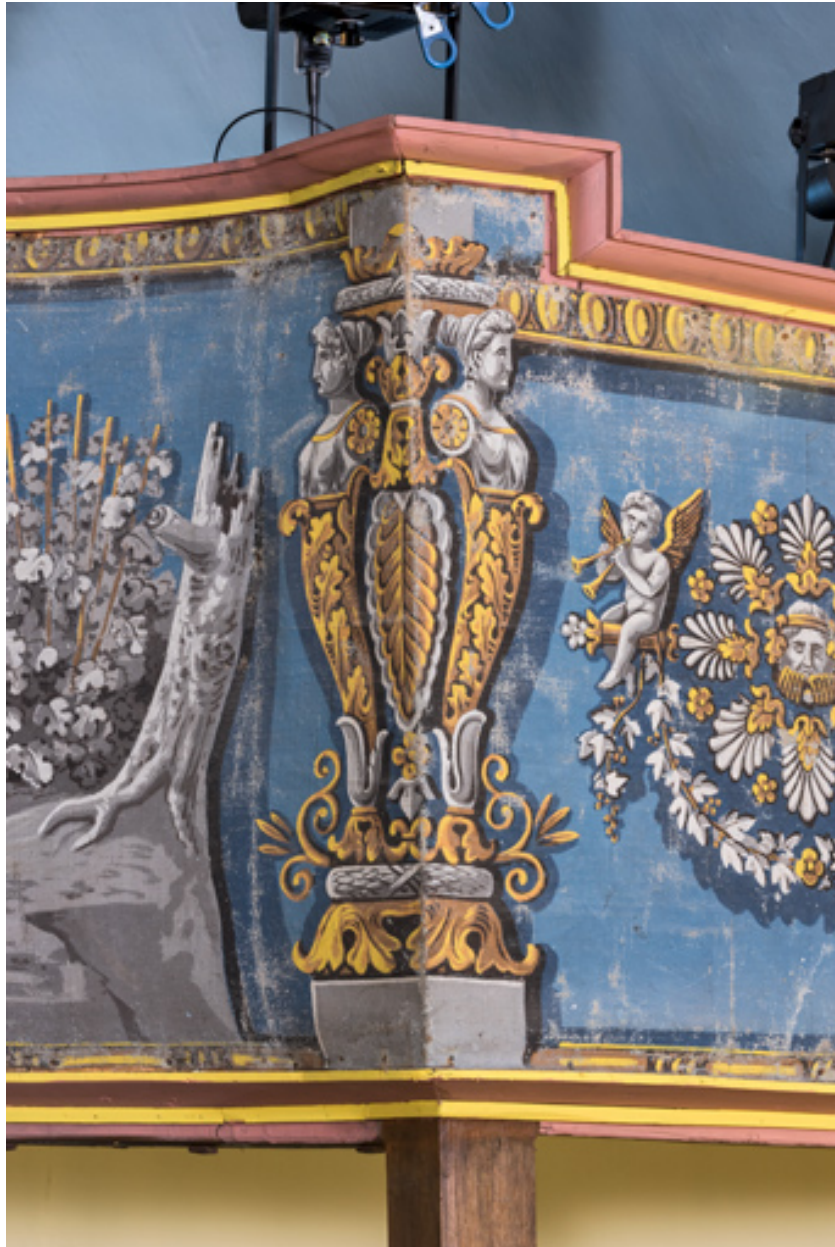
Décor de la galerie : termes sur l'angle de la travée de droite.