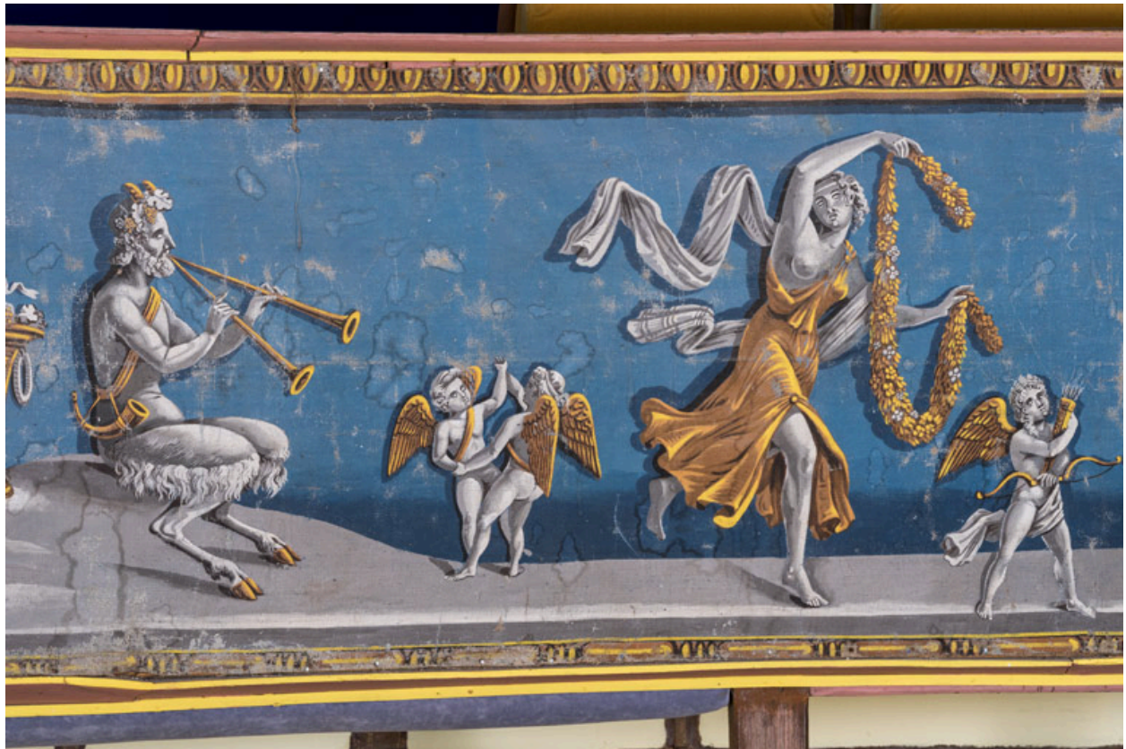
Décor de la galerie, partie gauche : satyre, putti et bacchante.