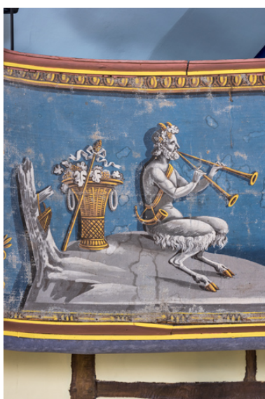
Décor de la galerie, partie gauche : satyre. IVR26_20238900381NUC4A