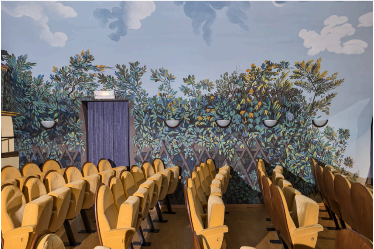
Décor de la fausse voûte : paroi latérale gauche (côté jardin).