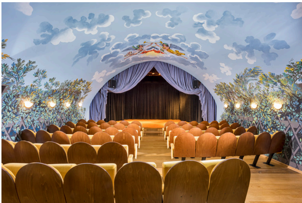
Vue vers la scène.