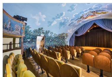
Galerie, paroi latérale gauche (côté jardin) et scène. IVR26_20238900361NUC4A