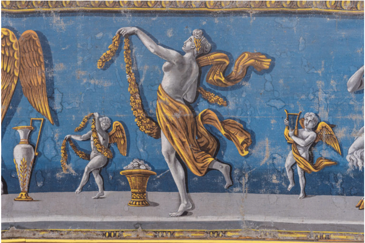
Décor de la galerie, partie droite : putti et bacchante.