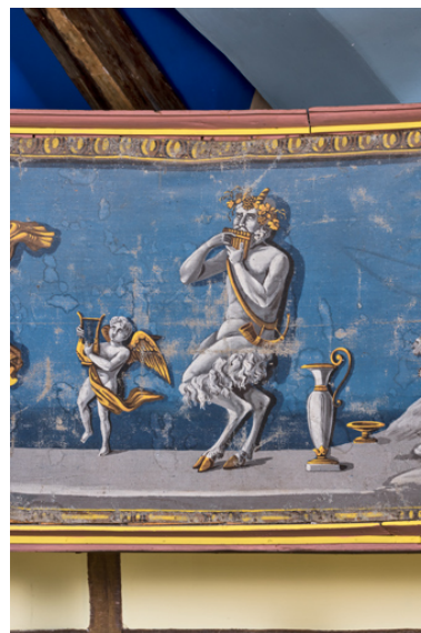
Décor de la galerie, partie droite : putto et satyre (cadrage vertical). IVR26_20238900382NUC4A