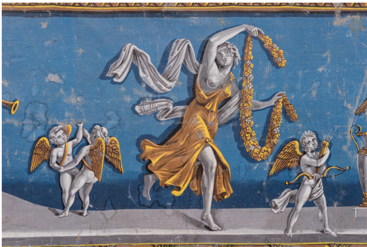
Décor de la galerie, partie gauche : putti et bacchante.