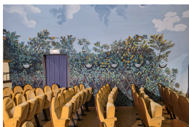
Décor de la fausse voûte : paroi latérale gauche (côté jardin). IVR26_20238900363NUC4A