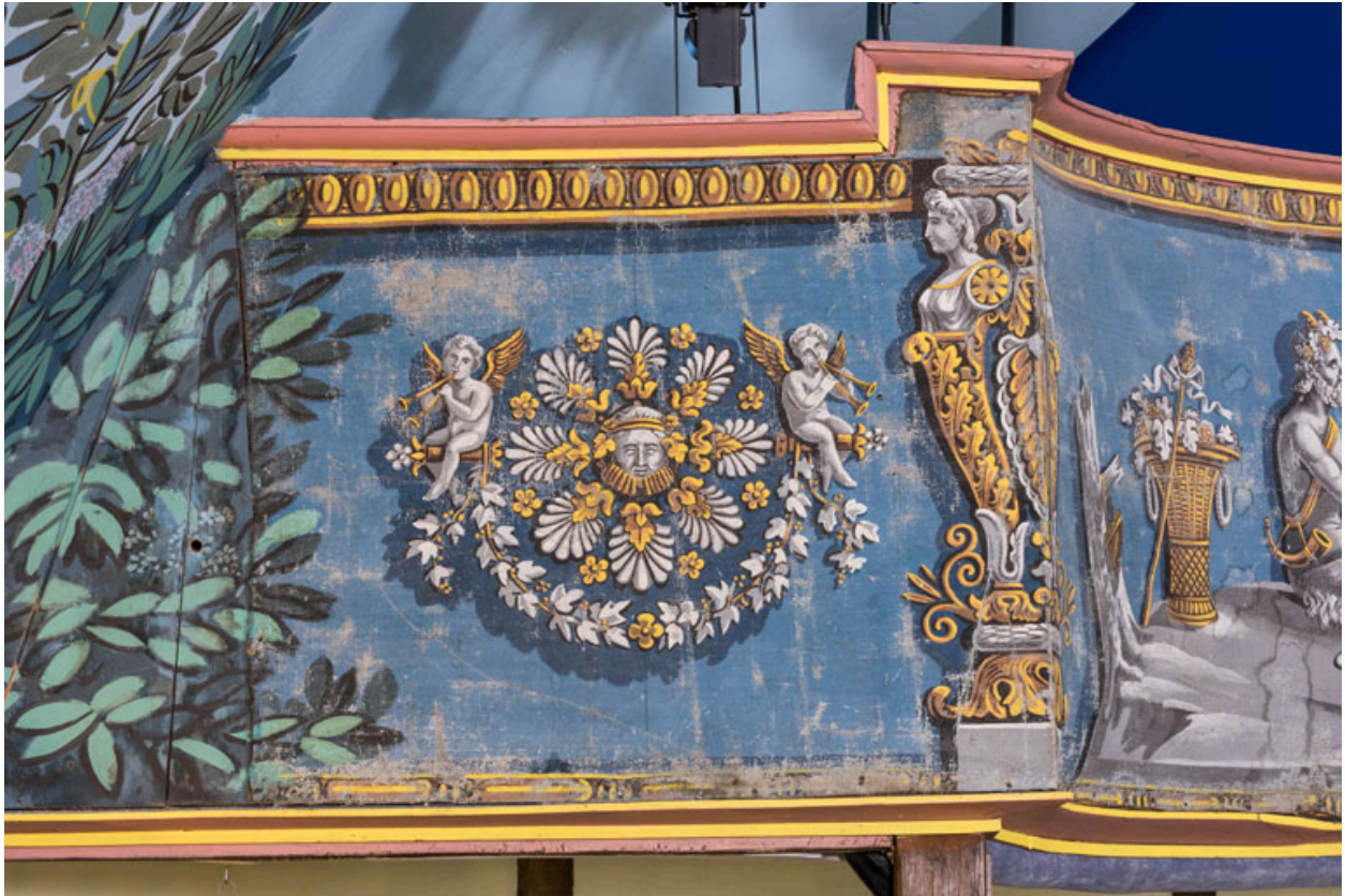
Décor de la galerie : motif sur la travée de gauche (tête de bacchus ?, putti et terme).