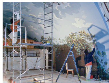
[Réfection des peintures de la voûte : restauratrices]. 2008. IVR26_20238900270NUC4A