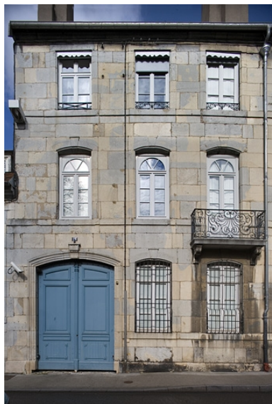
Vue d'ensemble de la façade sur rue : de face. IVR43_20072500203NUCA