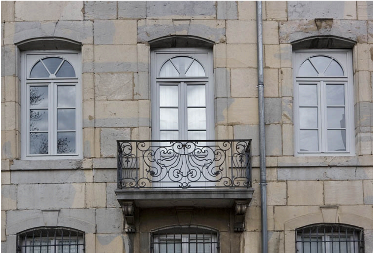
Vue du balcon en fer forgé de face.