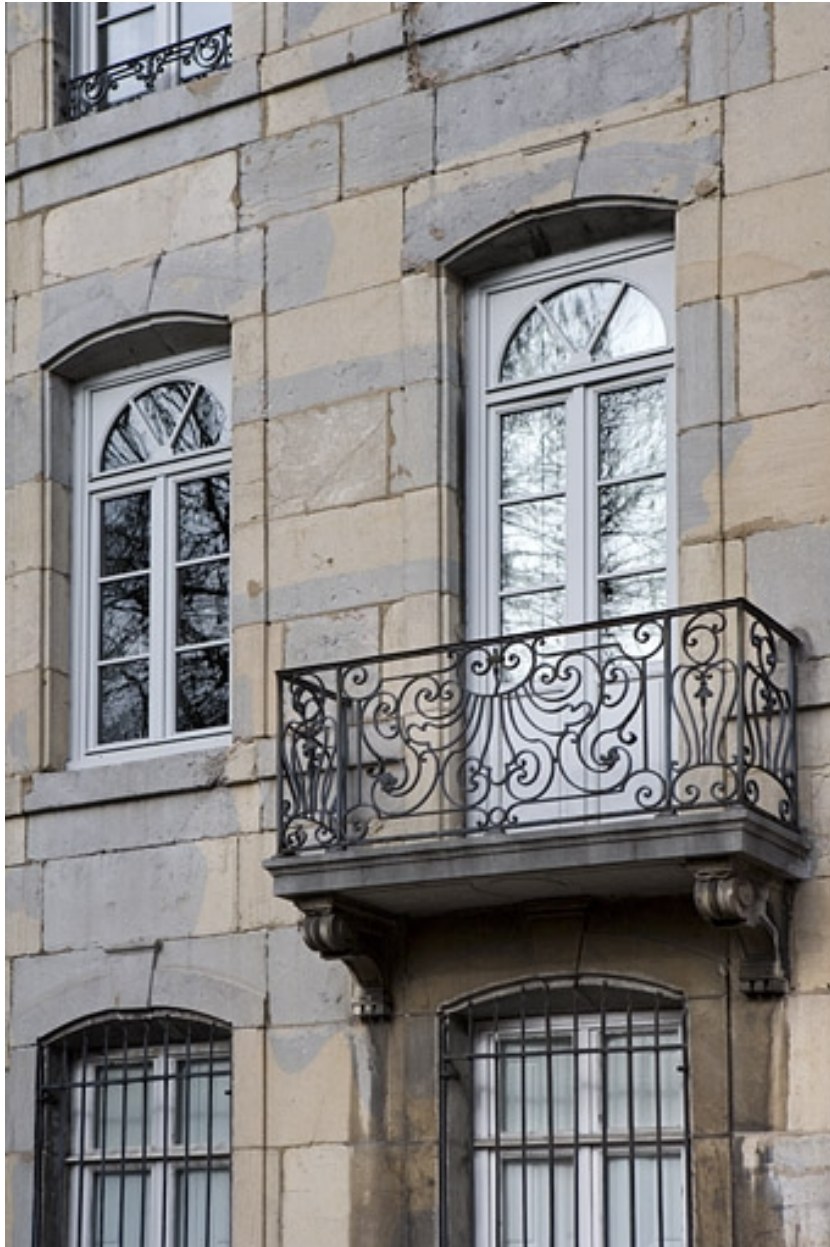
Vue du balcon en fer forgé de trois quarts droit.