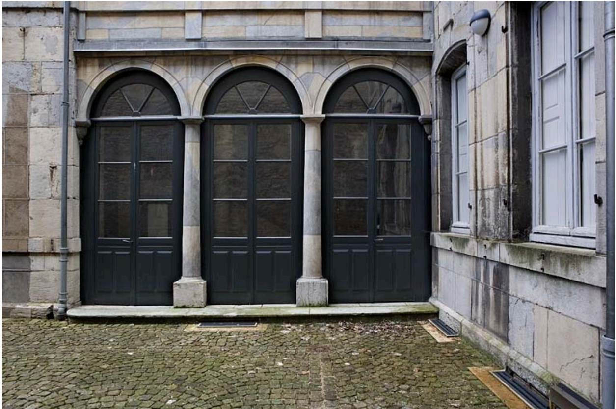
Vue extérieure de l'aile de l'escalier, de face.