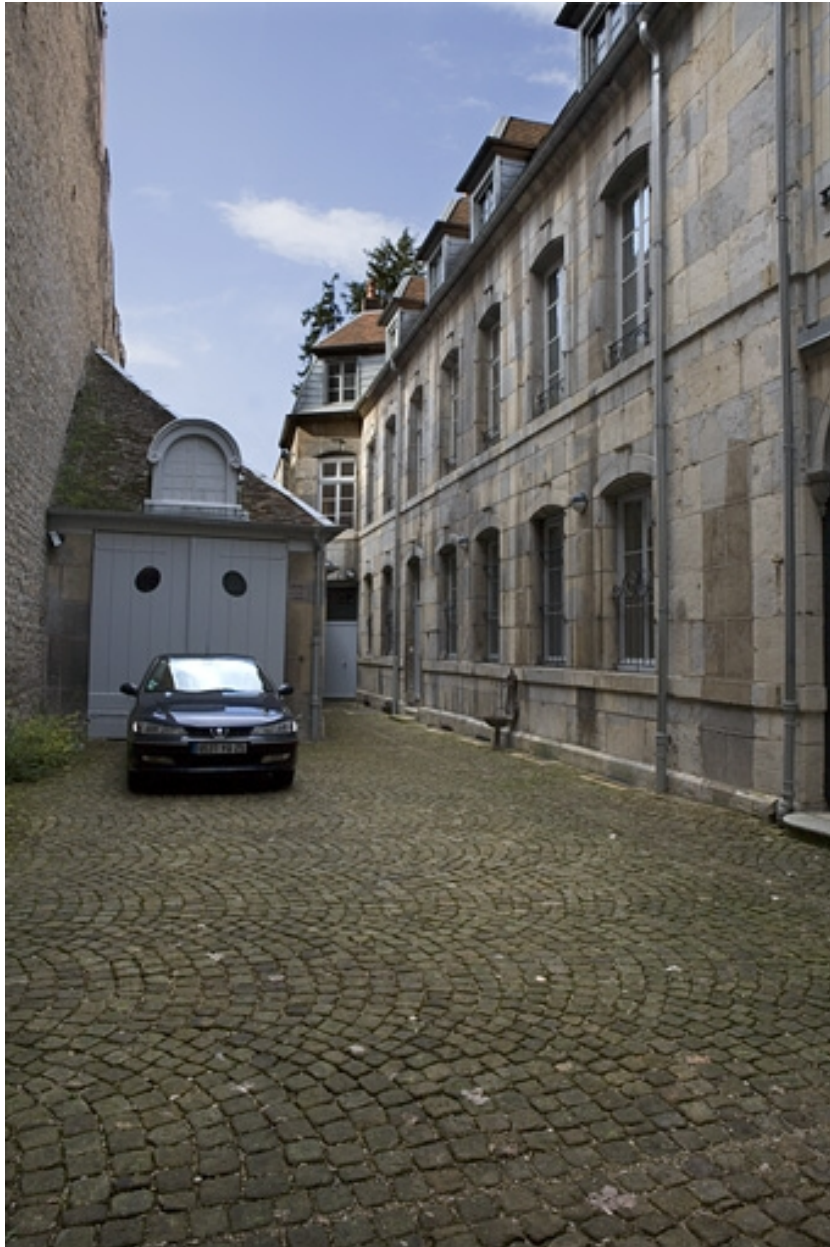
Vue d'ensemble de l' aile sur cour et du bâtiment des remise et écurie.