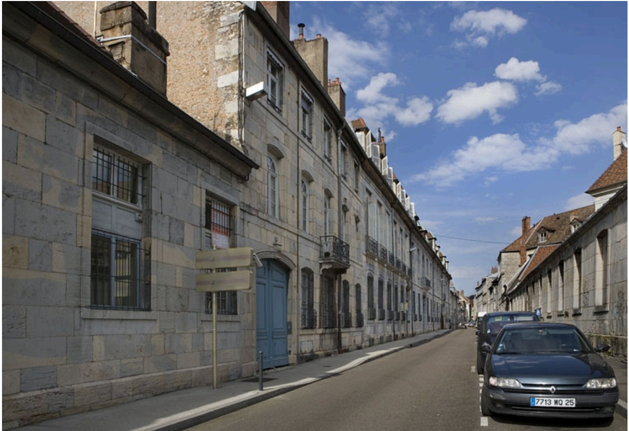
Vue d'ensemble de la façade sur rue dans l'alignement de la rue, de trois quarts gauche.