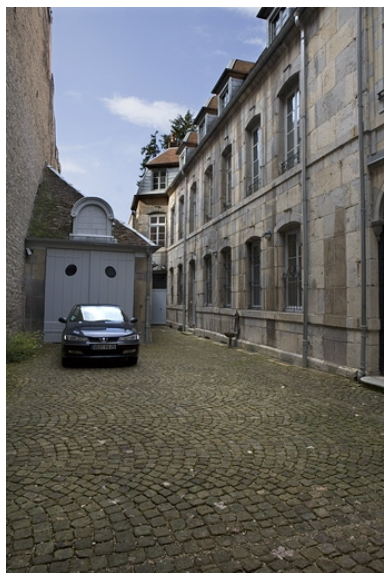
Vue d'ensemble de l'aile sur cour et du bâtiment des remise et écurie. IVR43_20072500209NUCA