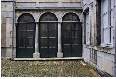
Vue extérieure de l'aile de l'escalier, de face. IVR43_20072500207NUCA