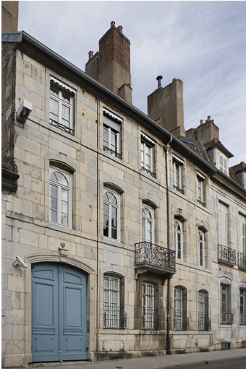
Vue d'ensemble de la façade sur rue de trois quarts gauche.