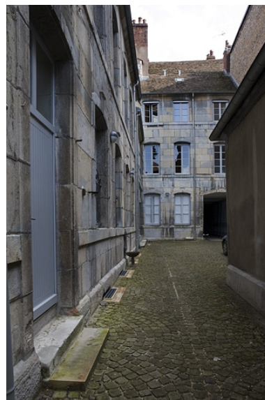
Vue d'ensemble des bâtiments depuis le fond de la cour.