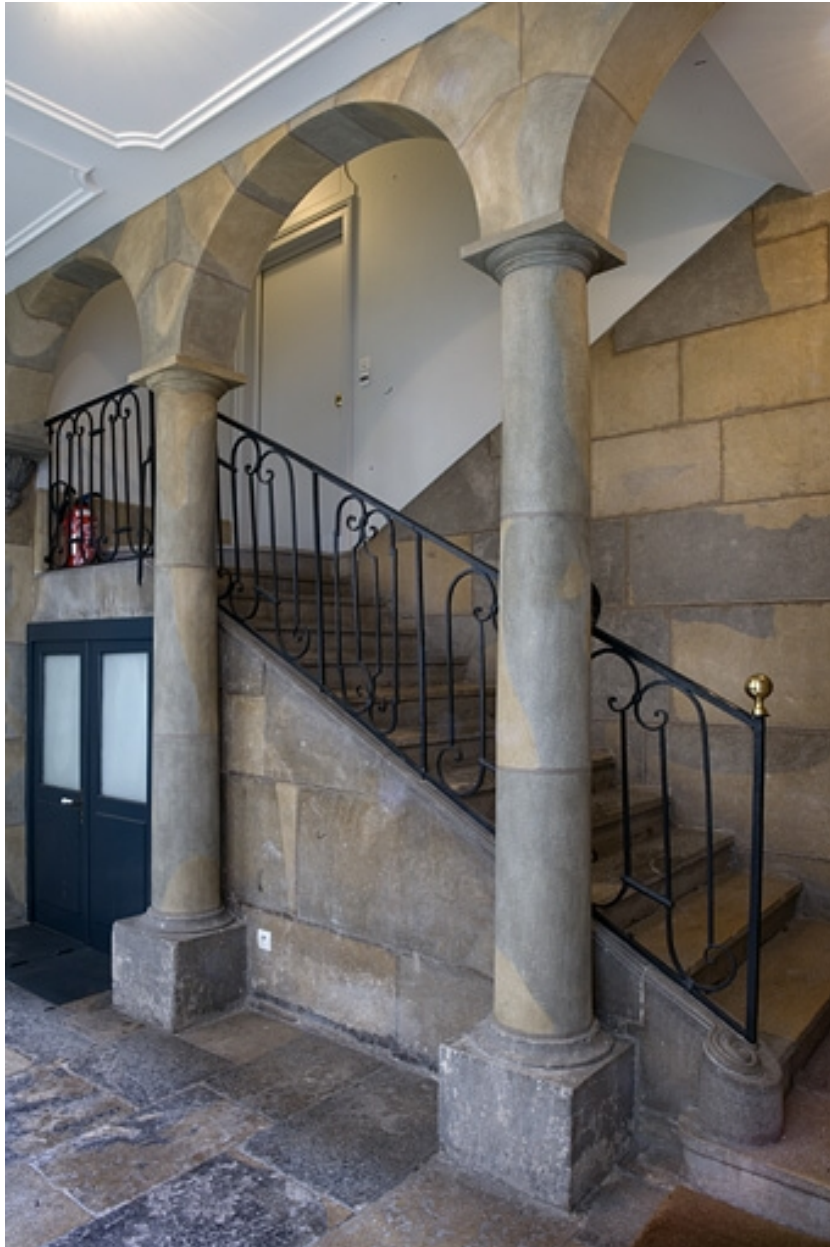
Vue d'ensemble de l'escalier.