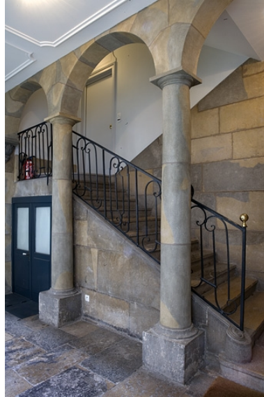
Vue d'ensemble de l'escalier. IVR43_20072500208NUCA