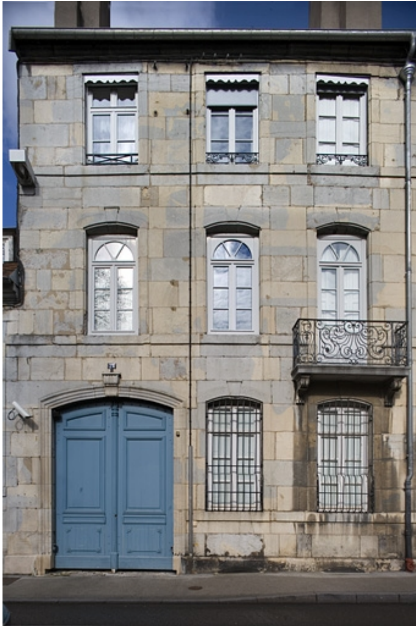
Vue d'ensemble de la façade sur rue : de face.