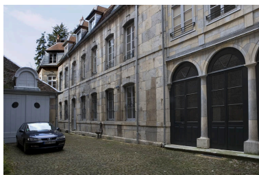
Vue d'ensemble de l'aile sur cour.