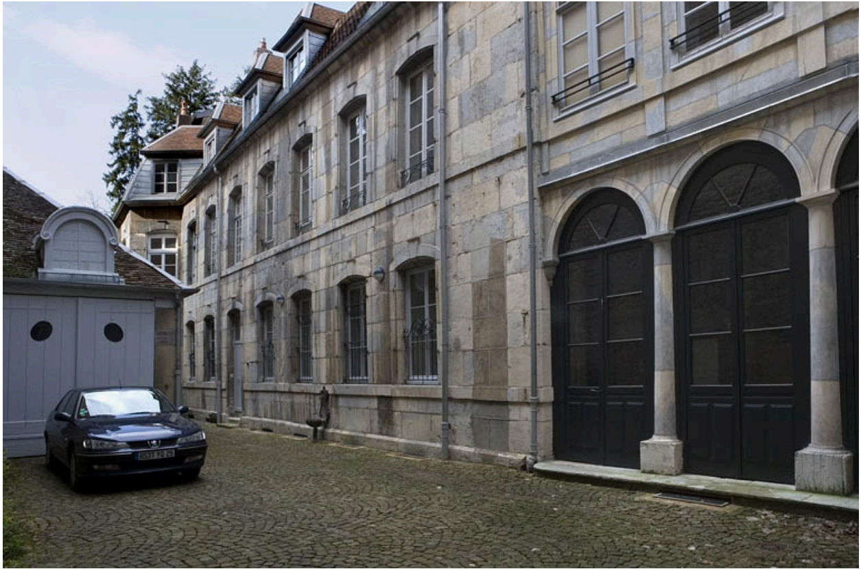
Vue d'ensemble de l' aile sur cour.