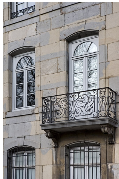
Vue du balcon en fer forgé de trois quarts droit. IVR43_20072500205NUCA