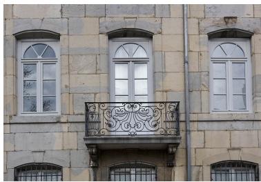
Vue du balcon en fer forgé de face. IVR43_20072500206NUCA