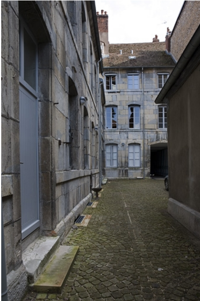
Vue d'ensemble des bâtiments depuis le fond de la cour.