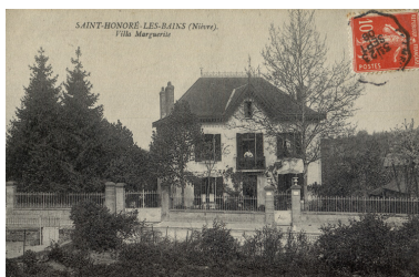
Façade de la villa avant sa transformation. IVR26_20195800268NUC4A