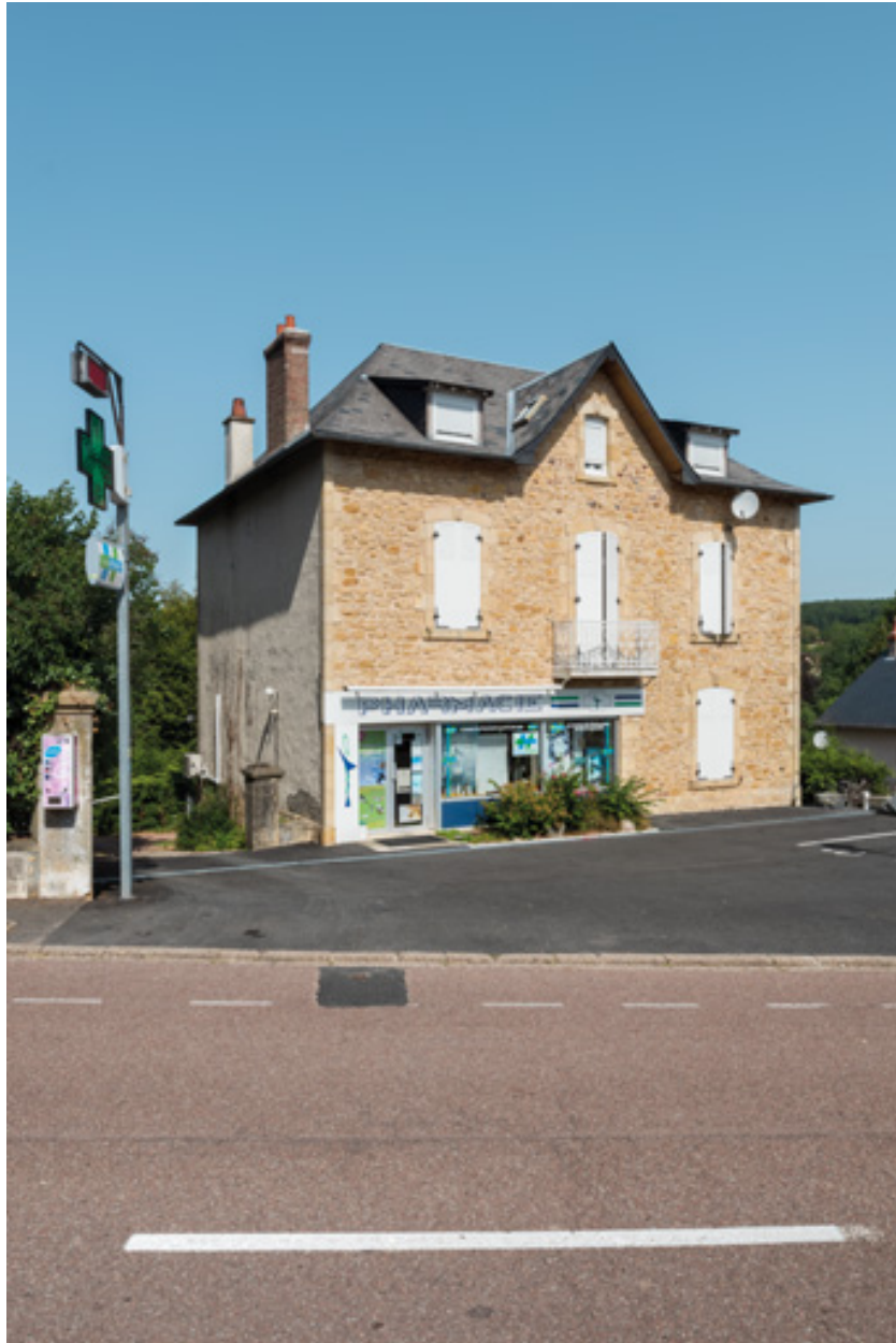
Façade de la villa après sa transformation.