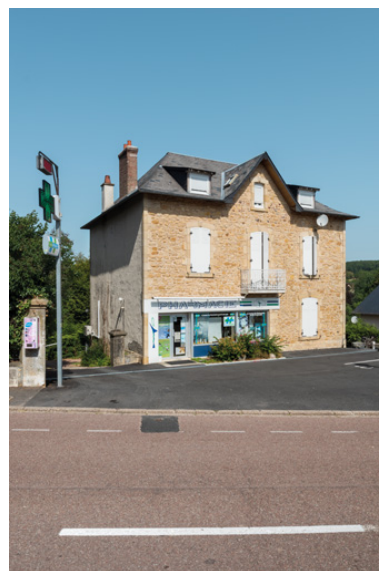
Façade de la villa après sa transformation.