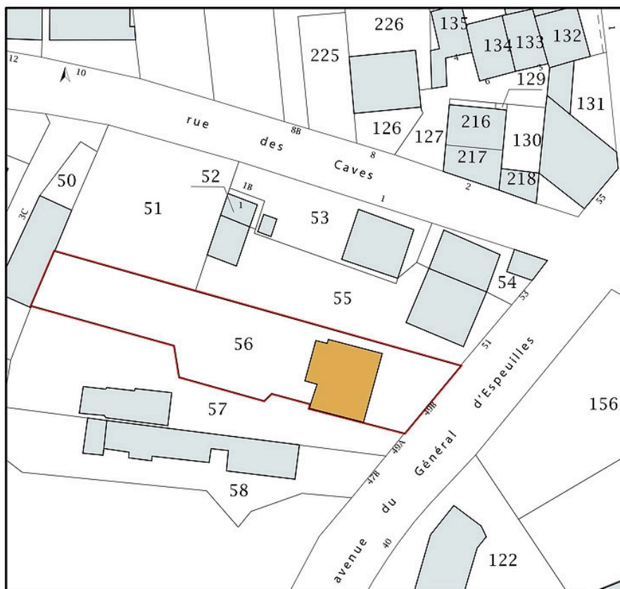
Plan-masse et de situation, extrait du plan cadastral (2020).