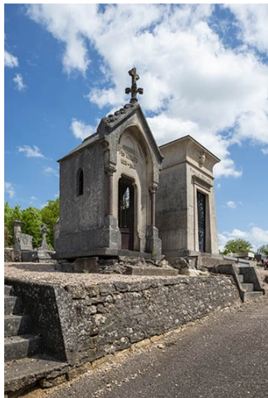
Le tombeau de trois quarts gauche, en contexte. IVR43_20217000266NUC4A