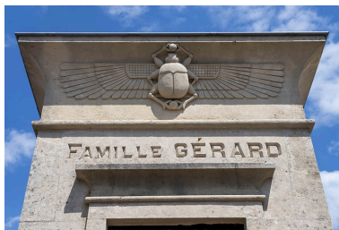
La corniche du tombeau. IVR43_20217000273NUC4A