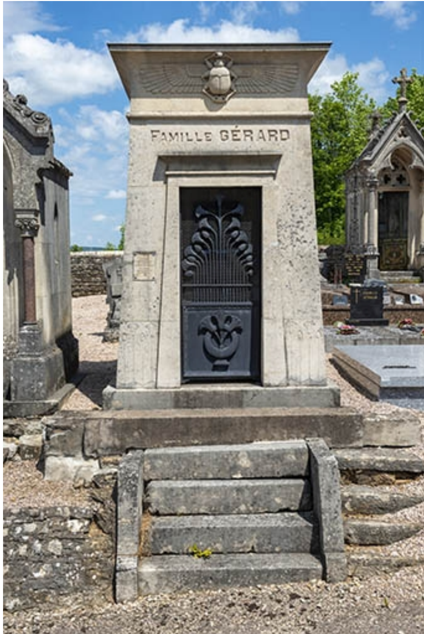
Le tombeau de face.