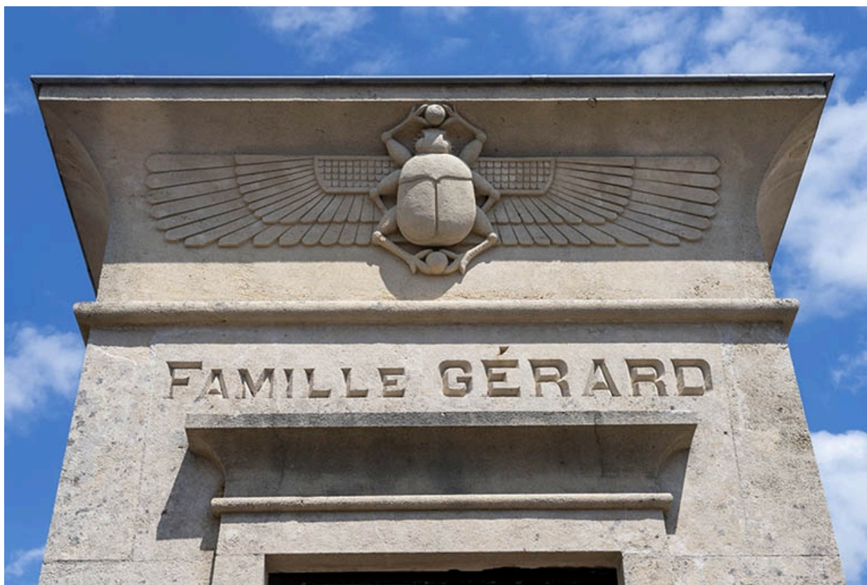
La corniche du tombeau.