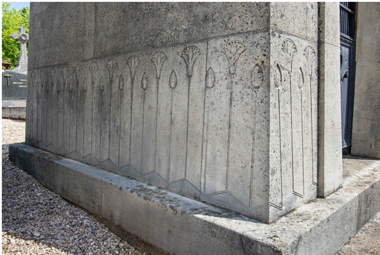
Le tombeau, de trois quarts gauche, partie basse.