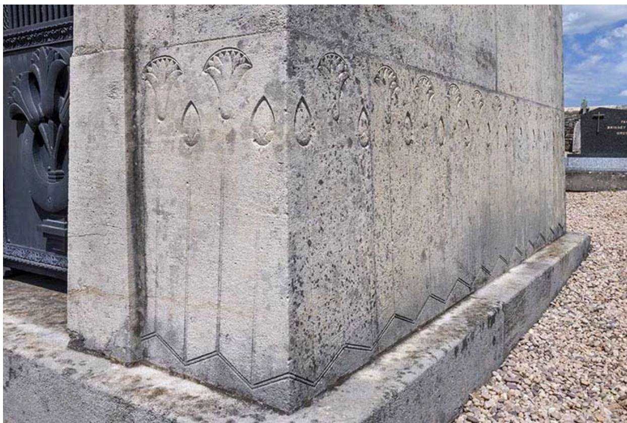
Le tombeau, de trois quarts droit, partie basse.