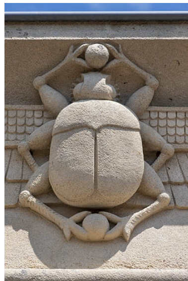
Détail du scarabée de la corniche.