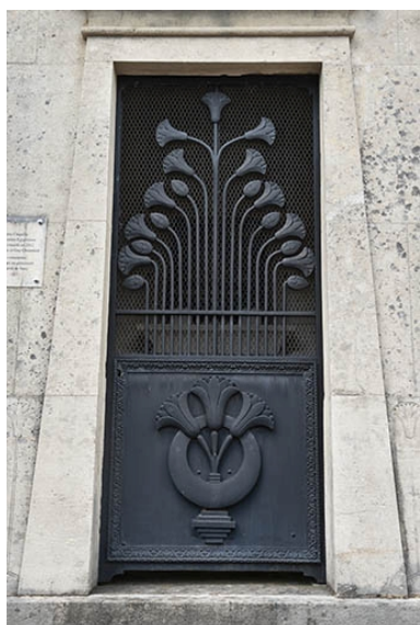
La porte. IVR43_20217000276NUC4A