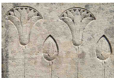
Détail des bas-reliefs du tombeau. IVR43_20217000268NUC4A