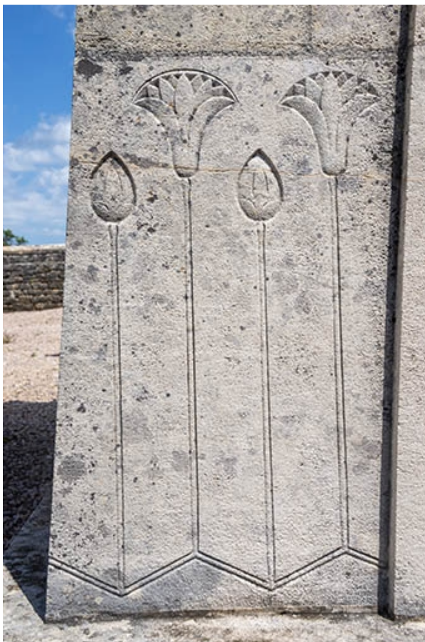
Ornements de la face antérieure (partie inférieure gauche).