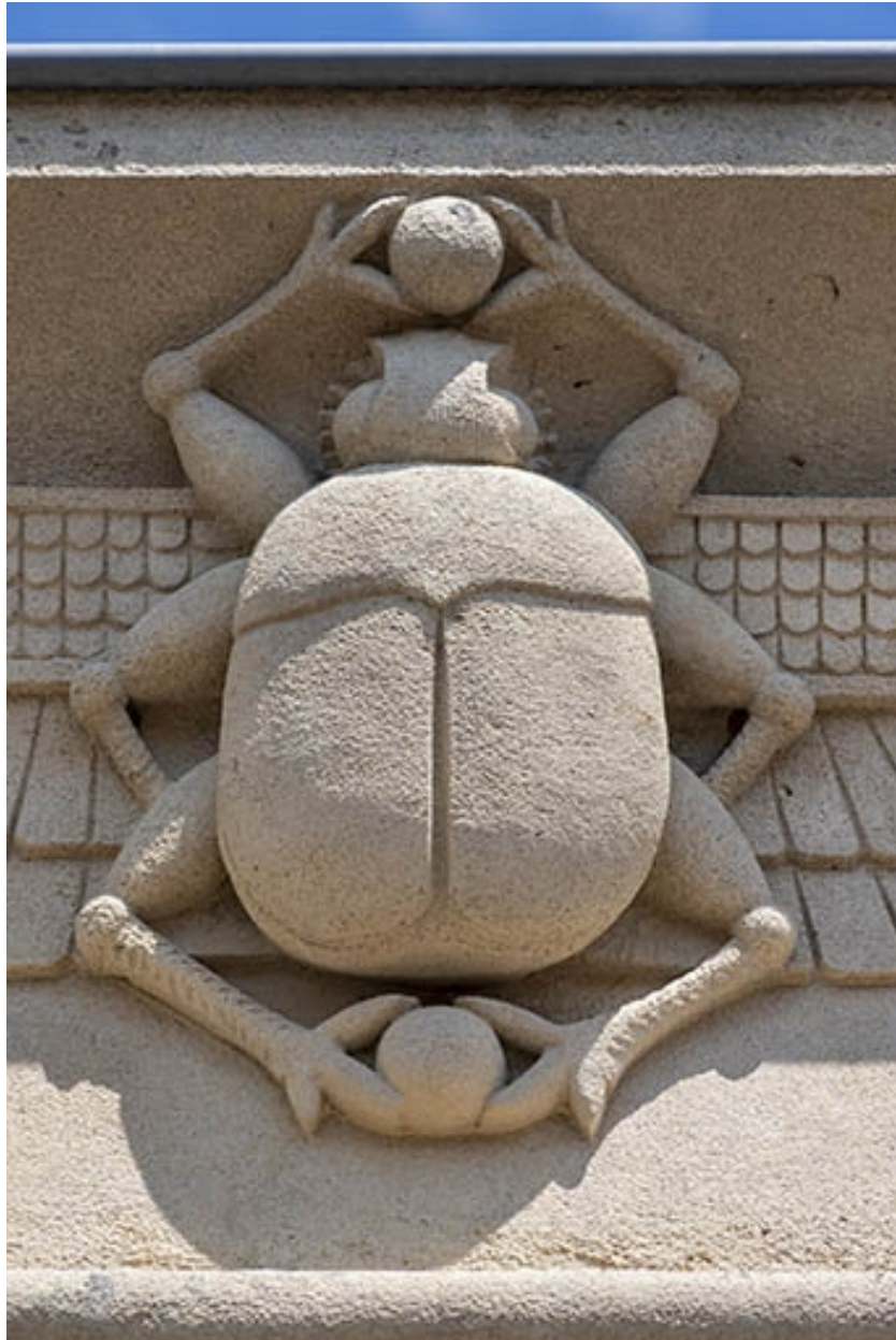
Détail du scarabée de la corniche.