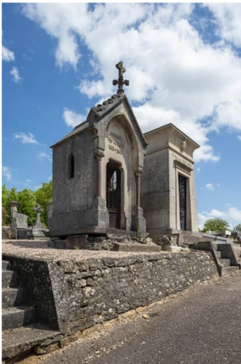
Le tombeau de trois quarts gauche, en contexte.