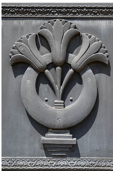
Détail du bas-relief de la porte