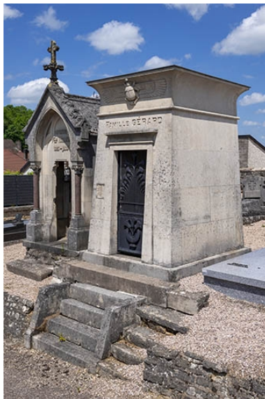
Le tombeau de trois quarts droit, en contexte. IVR43_20217000271NUC4A