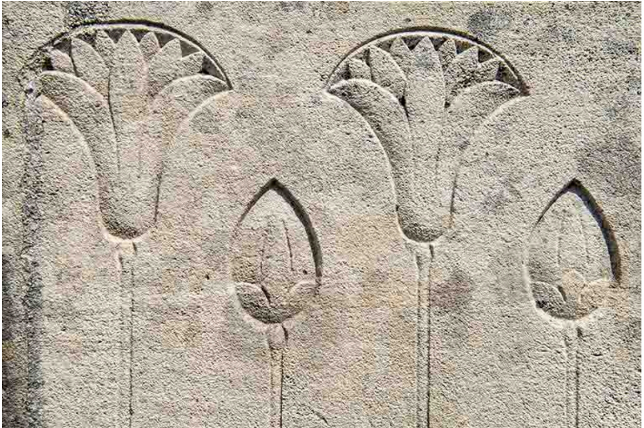
Détail des bas-reliefs du tombeau.