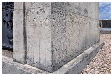
Le tombeau, de trois quarts droit, partie basse. IVR43_20217000272NUC4A