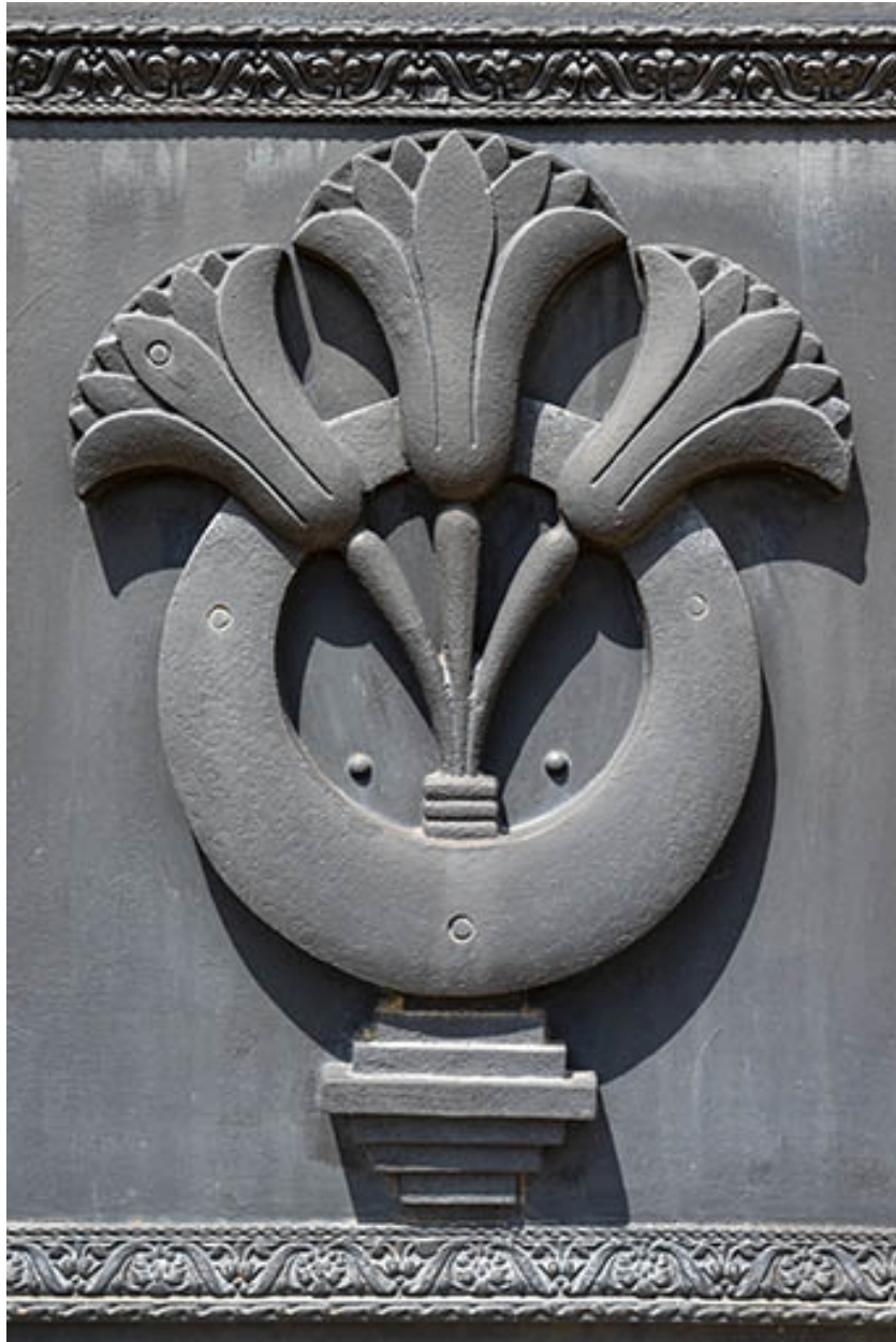
Détail du bas-relief de la porte