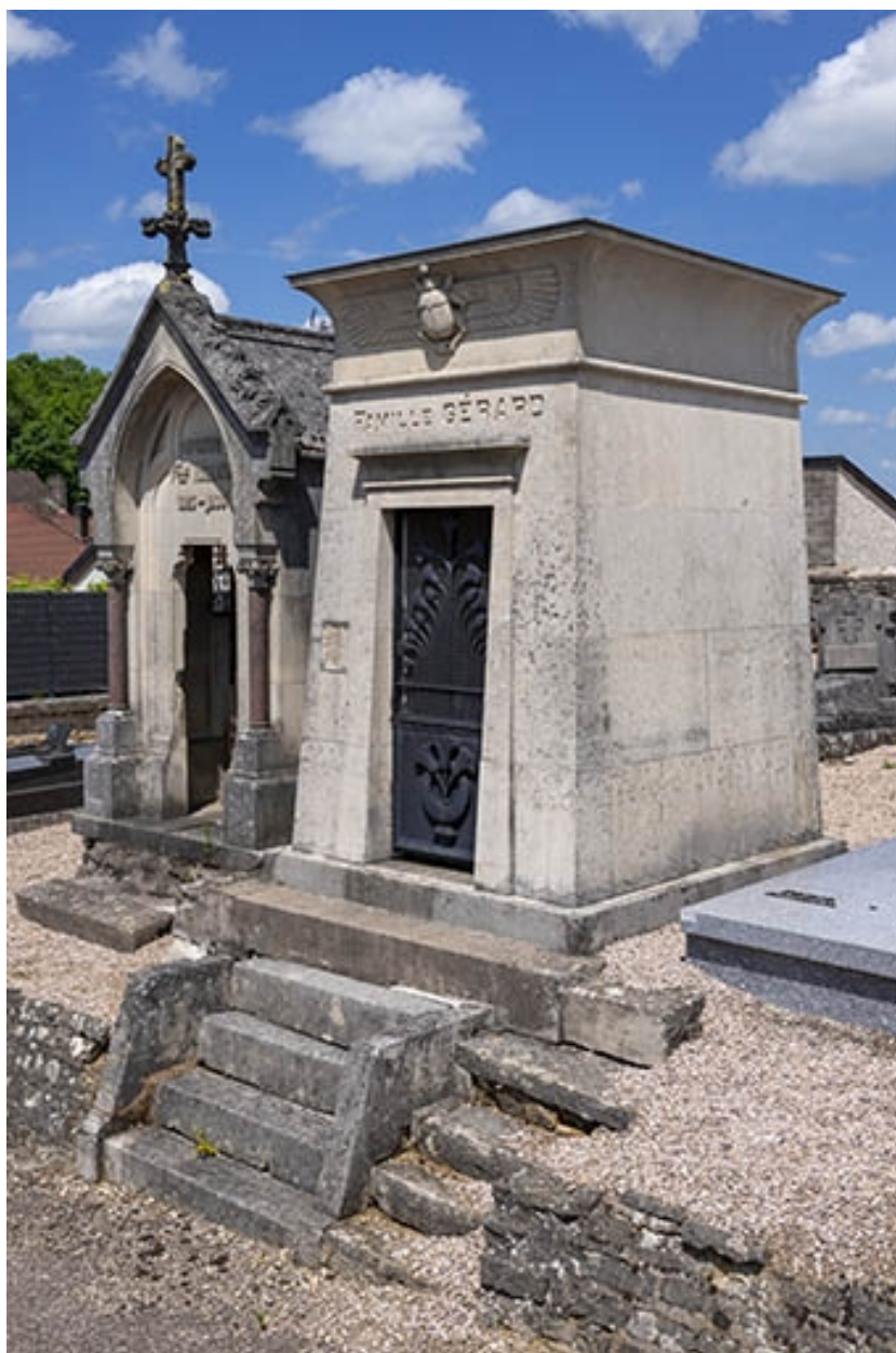
Le tombeau de trois quarts droit, en contexte.