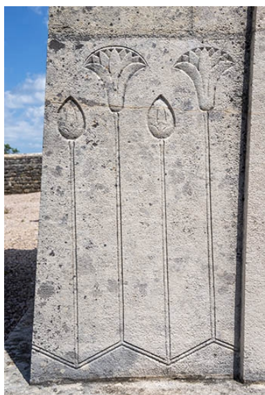
Ornements de la face antérieure (partie inférieure gauche).