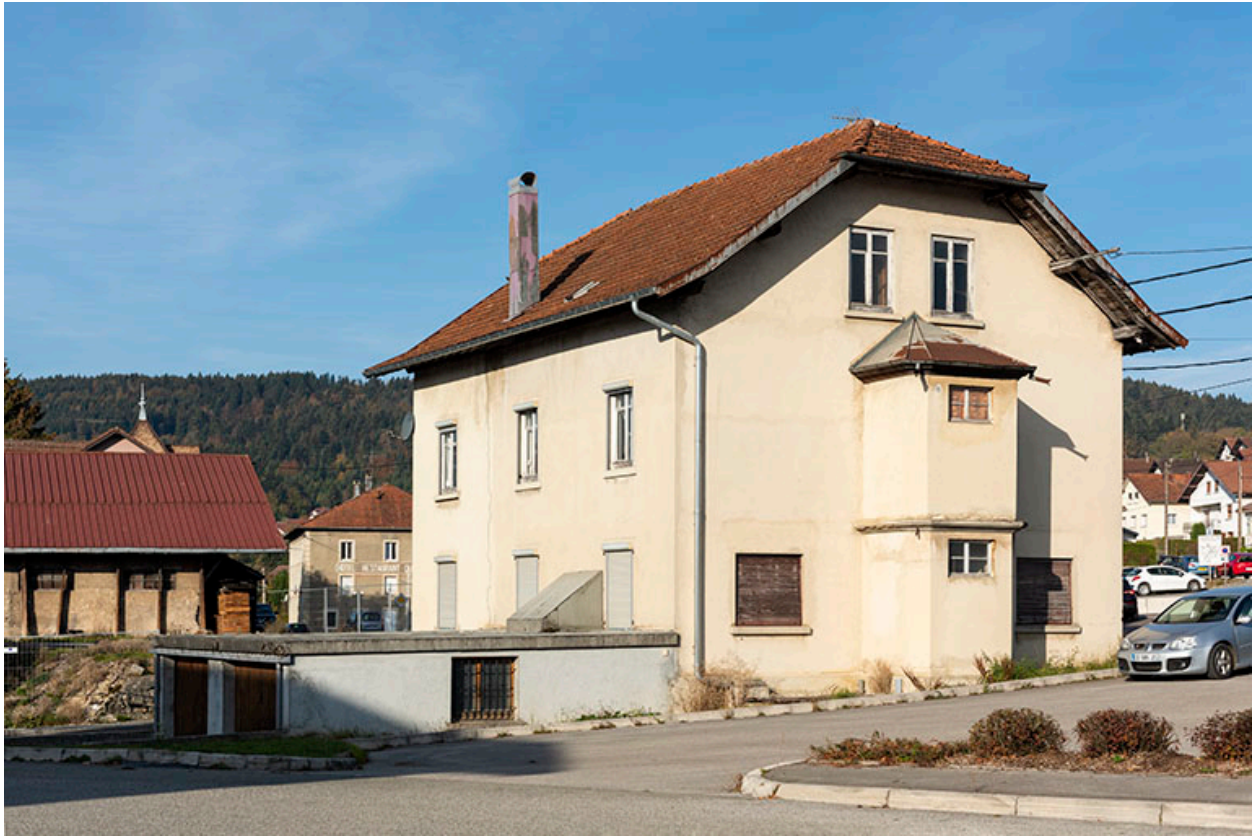
Maison de 1919 : façades postérieure et latérale gauche.