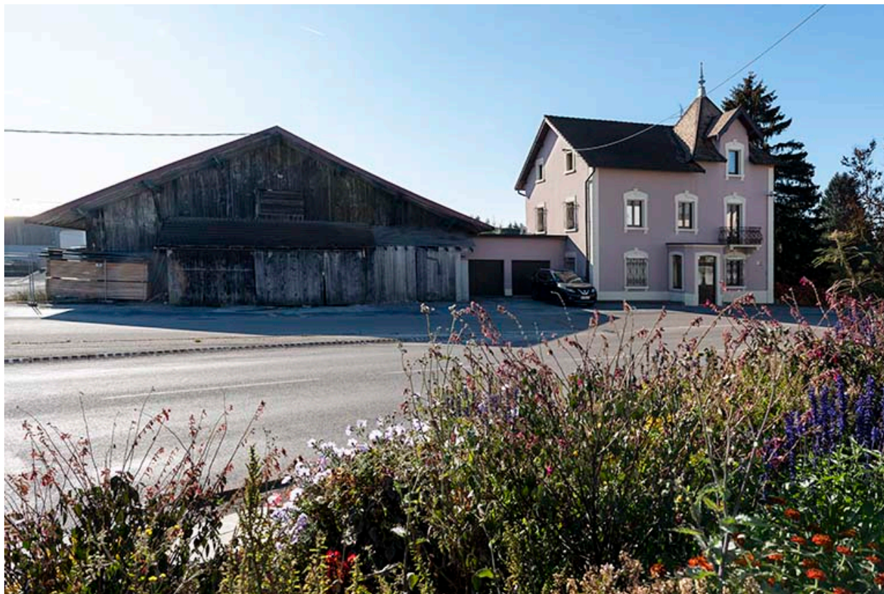
Atelier de 1919 et deuxième maison : façade antérieure (nord).