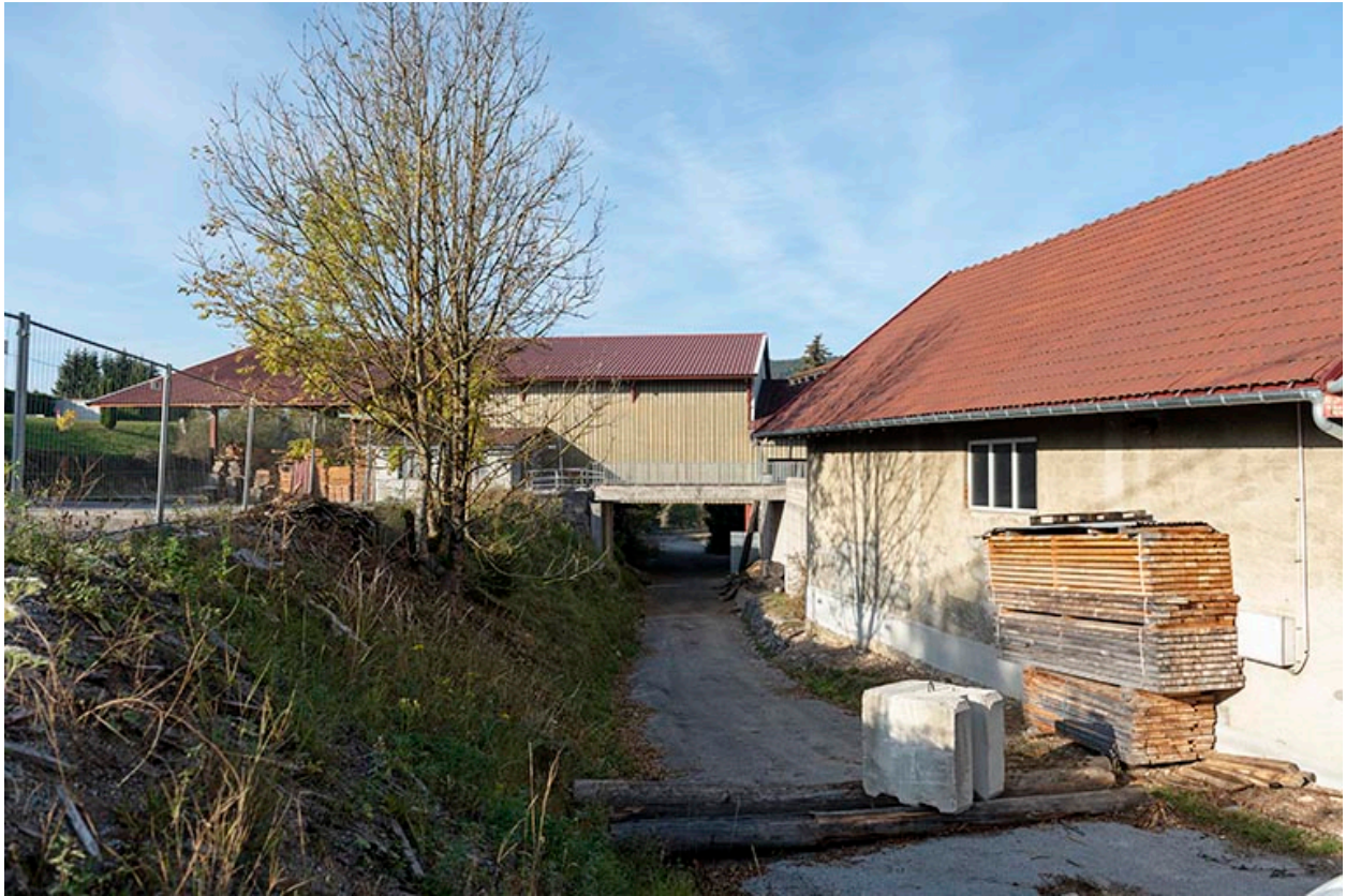
Atelier récent et chemin, depuis l'est.