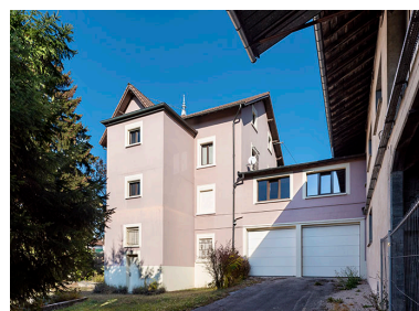
Deuxième maison : façade postérieure, de trois quarts droite. IVR43_20182501732NUC4A