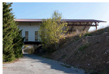
Atelier récent et chemin, depuis l'ouest. IVR43_20182501740NUC4A