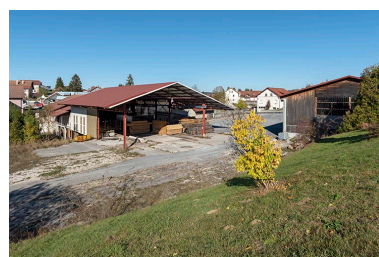
Ateliers de fabrication et magasin industriel, depuis le sud-ouest. IVR43_20182501738NUC4A