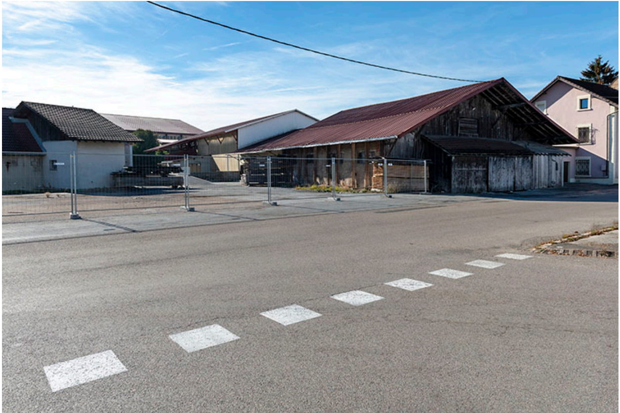
Ateliers de fabrication, depuis le nord-est.