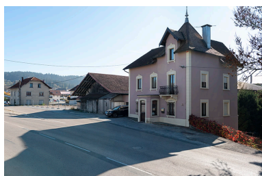
Vue d'ensemble du site, depuis l'ouest. Au premier plan, maison bâtie entre 1928 et 1938.