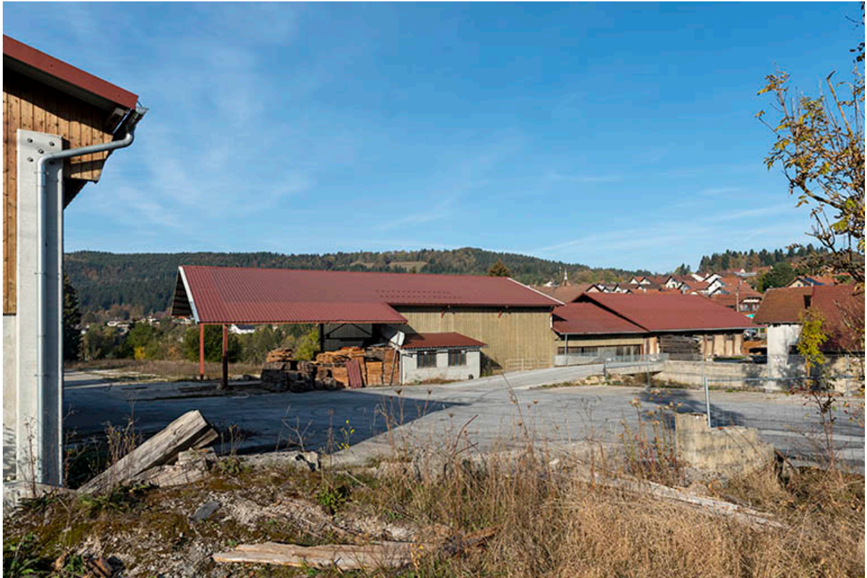
Ateliers de fabrication, depuis le sud-est.