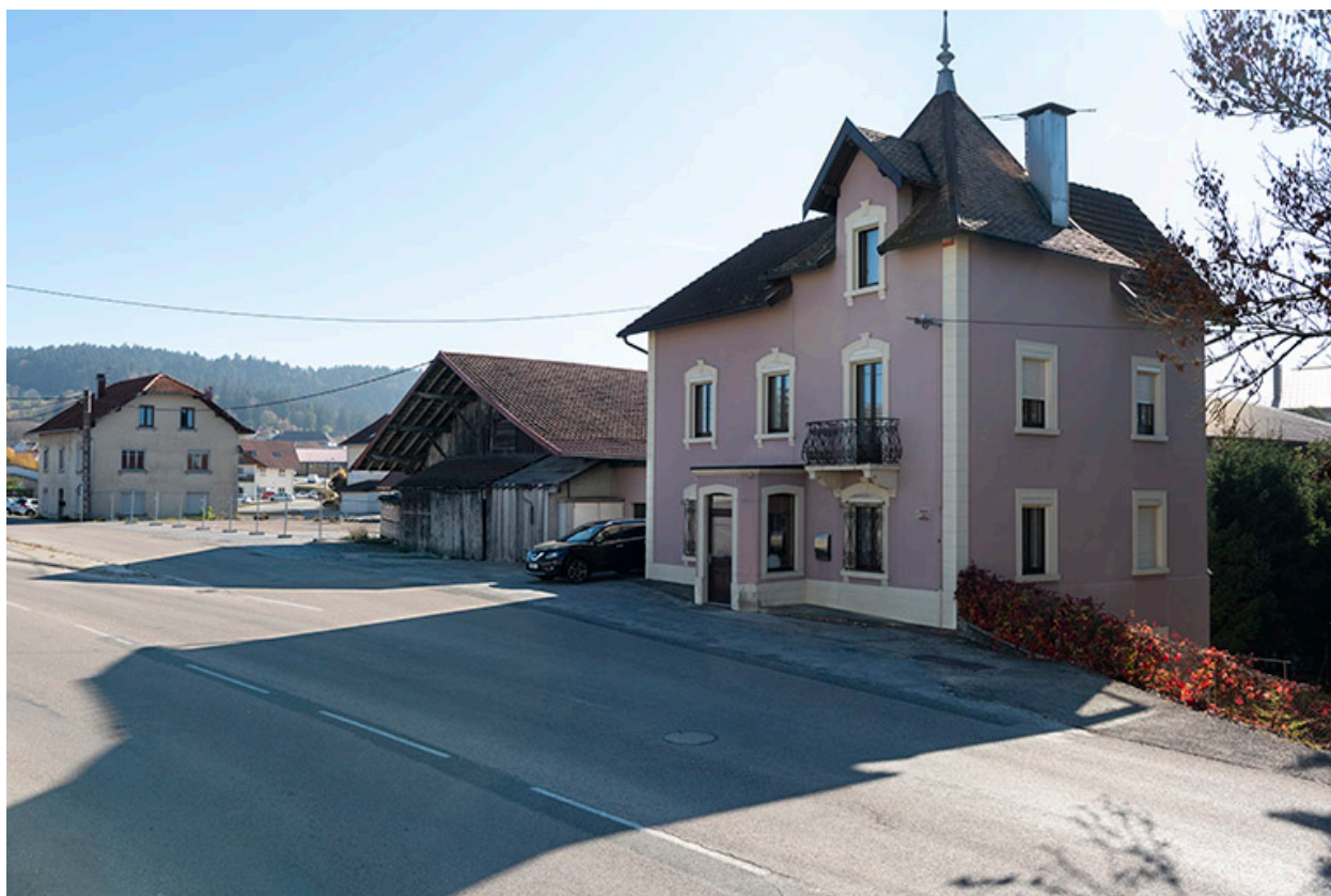
Vue d'ensemble du site, depuis l'ouest. Au premier plan, maison bâtie entre 1928 et 1938.