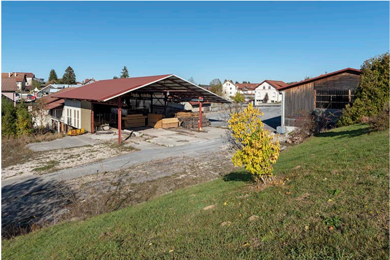
Ateliers de fabrication et magasin industriel, depuis le sud-ouest.