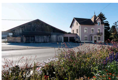
Atelier de 1919 et deuxième maison : façade antérieure (nord). IVR43_20182501731NUC4A