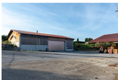
Magasin industriel, de trois quarts gauche.