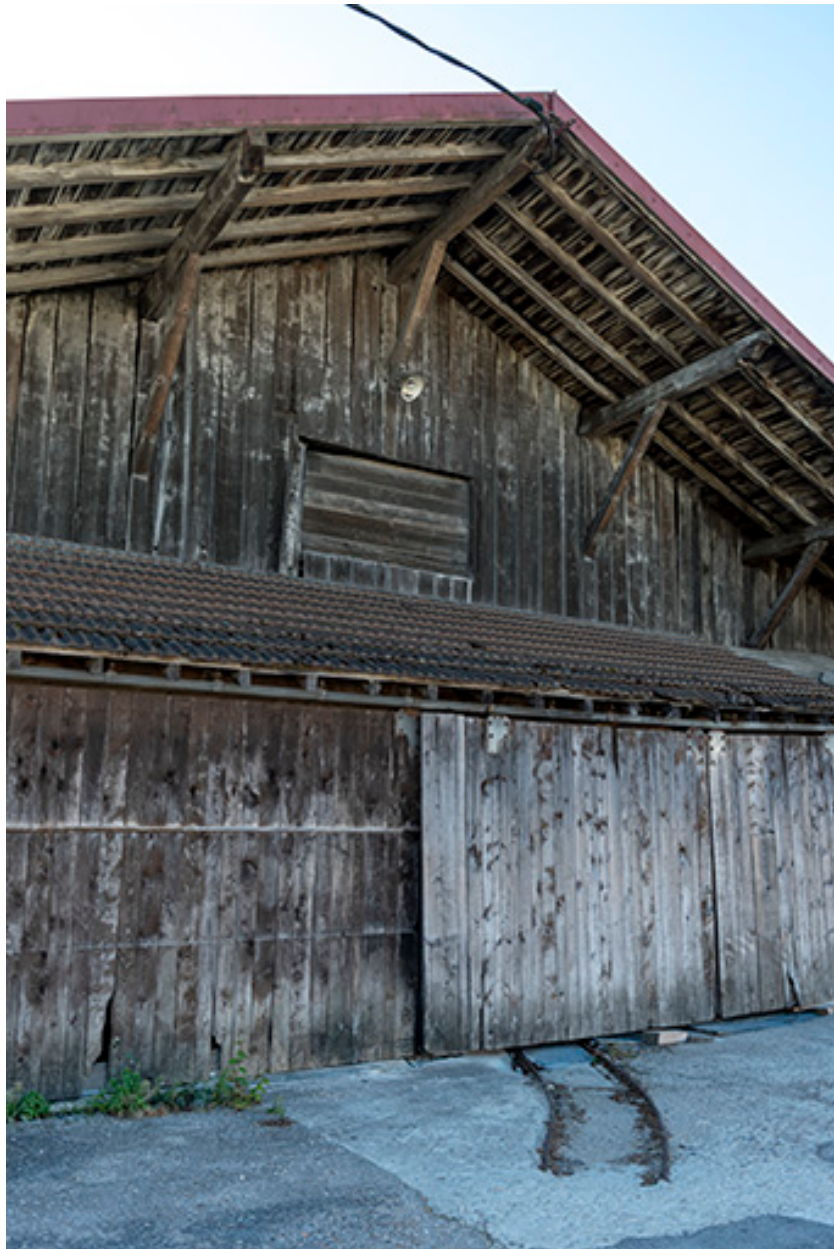
Atelier de 1919 : façade antérieure (nord).