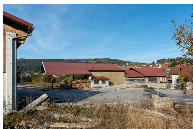
Ateliers de fabrication, depuis le sud-est.