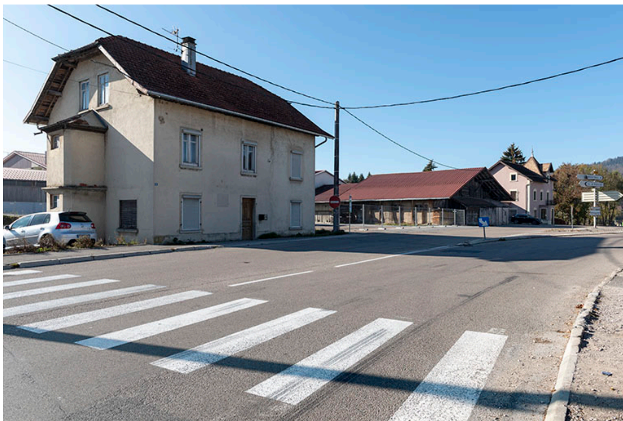
Vue d'ensemble du site, depuis l'est. Au premier plan, maison de 1919.