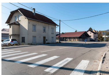
Vue d'ensemble du site, depuis l'est. Au premier plan, maison de 1919.