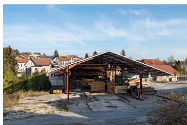
Atelier récent : façade sud.