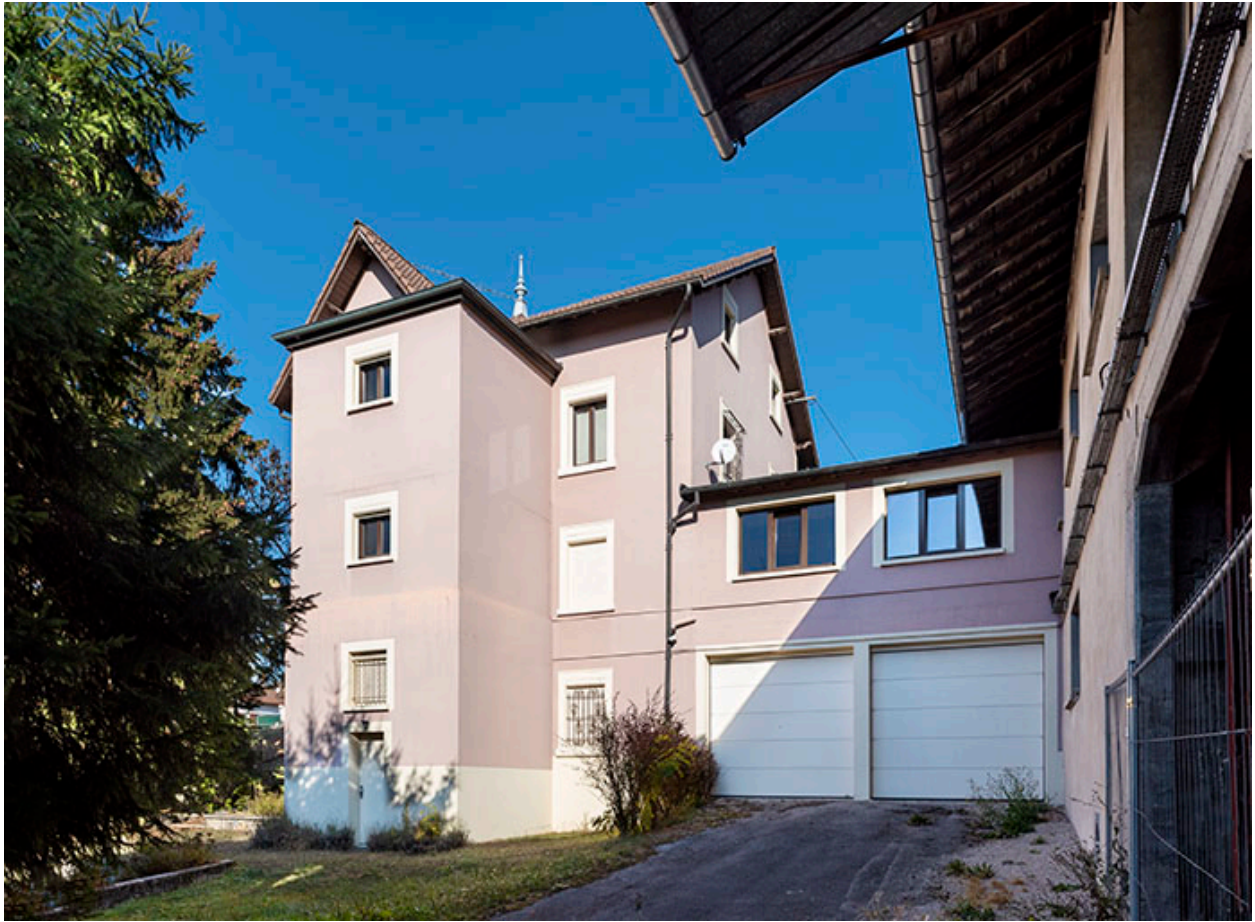
Deuxième maison : façade postérieure, de trois quarts droite.