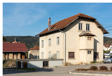
Maison de 1919 : façades postérieure et latérale gauche.