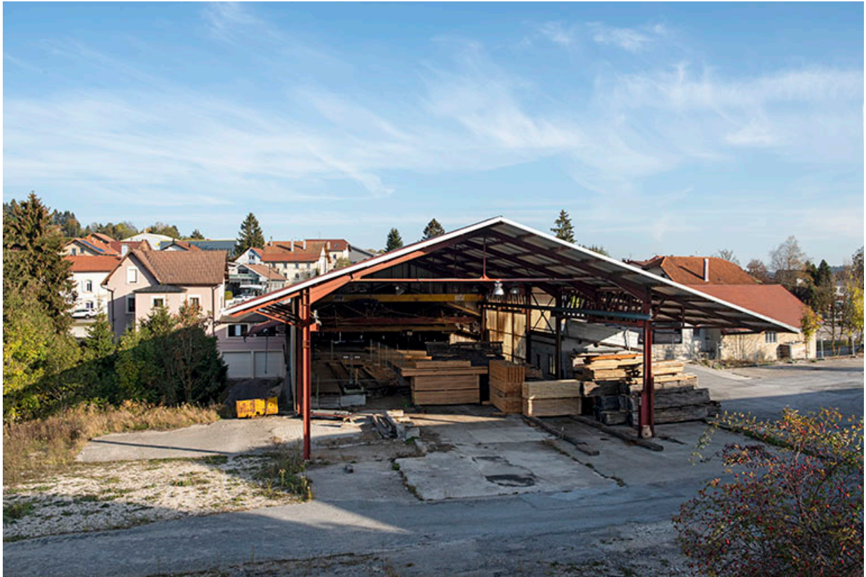
Atelier récent : façade sud.