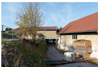
Atelier récent et chemin, depuis l'est. IVR43_20182501734NUC4A