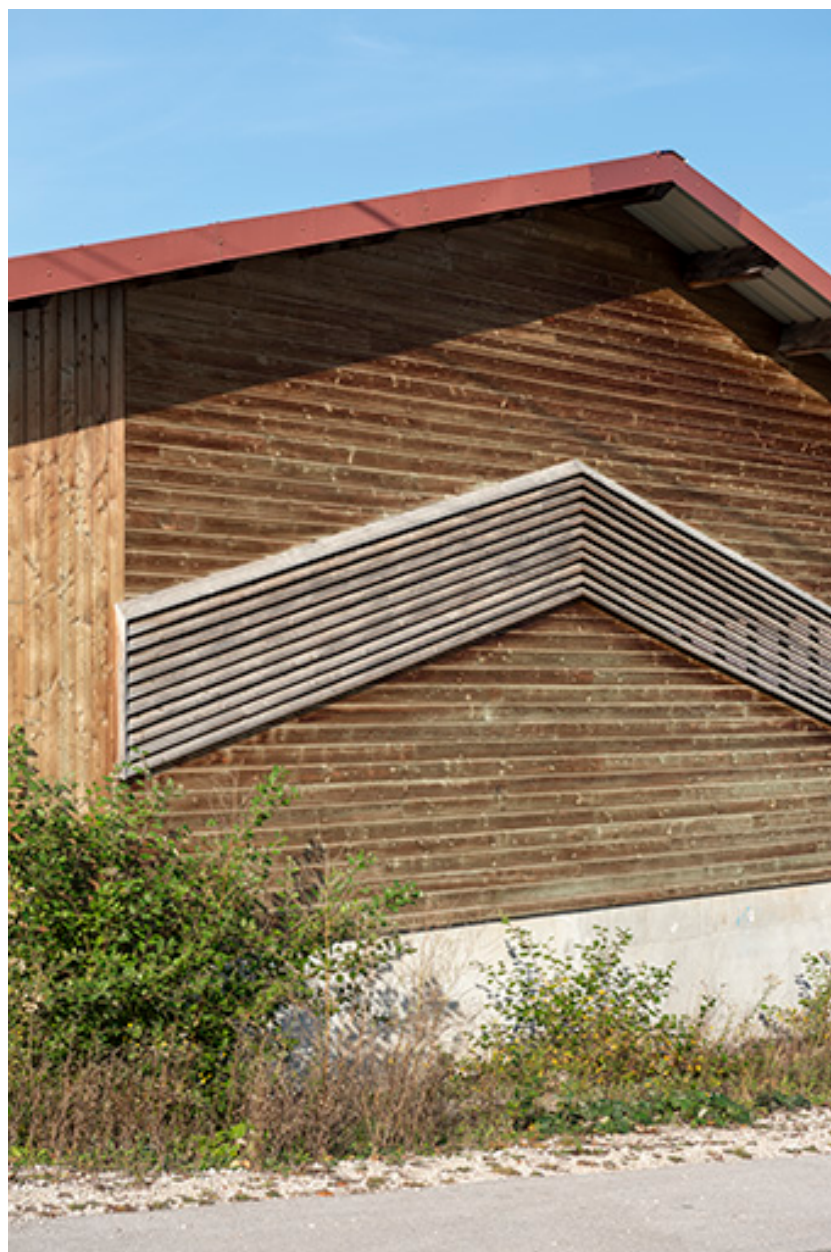
Magasin industriel : essentage de planches sur le mur est.