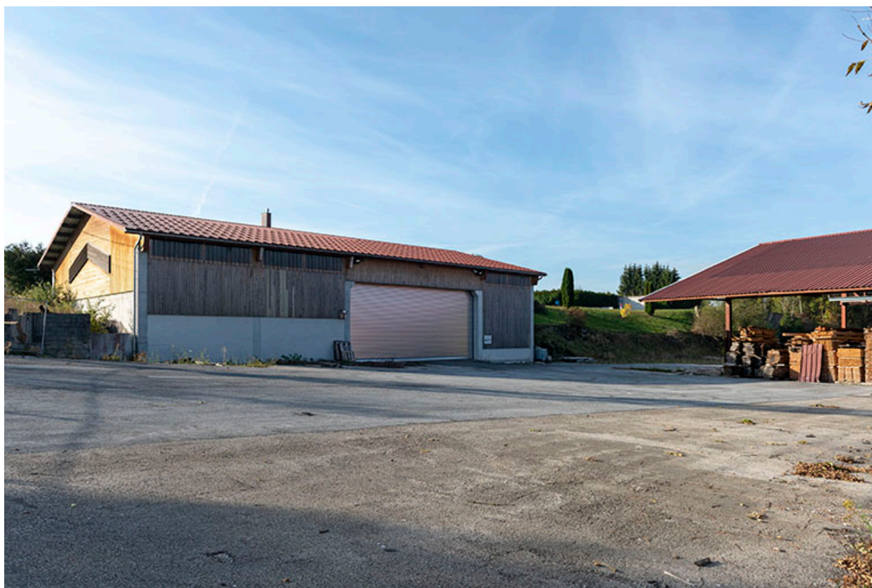
Magasin industriel, de trois quarts gauche.