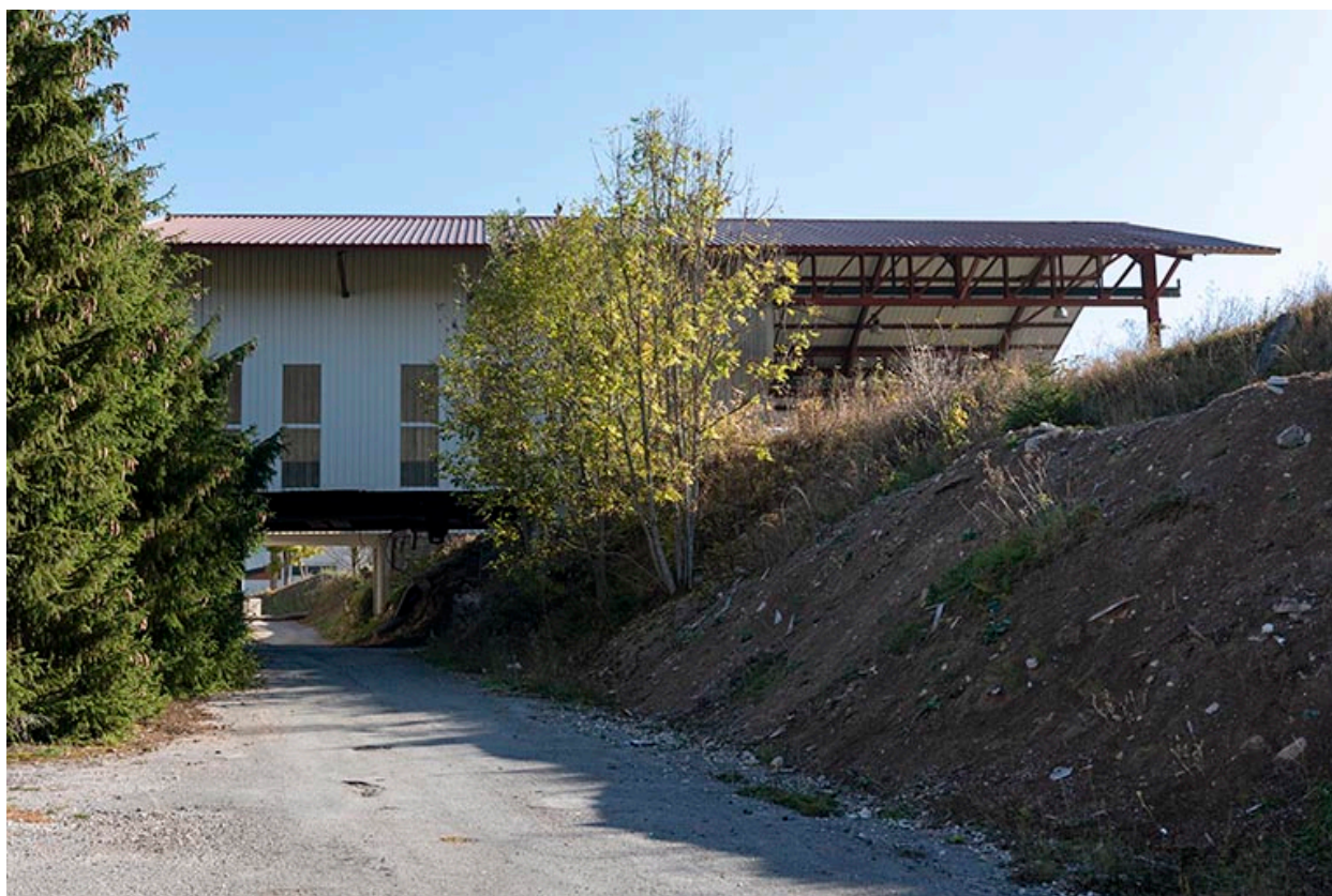
Atelier récent et chemin, depuis l'ouest.