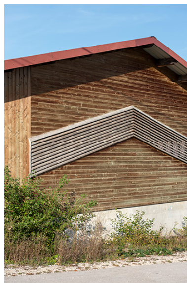
Magasin industriel : essentage de planches sur le mur est.