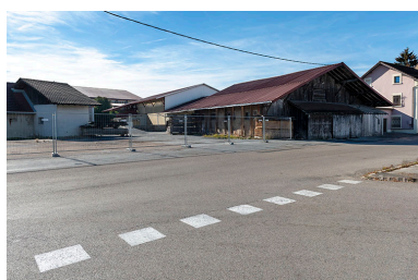
Ateliers de fabrication, depuis le nord-est.