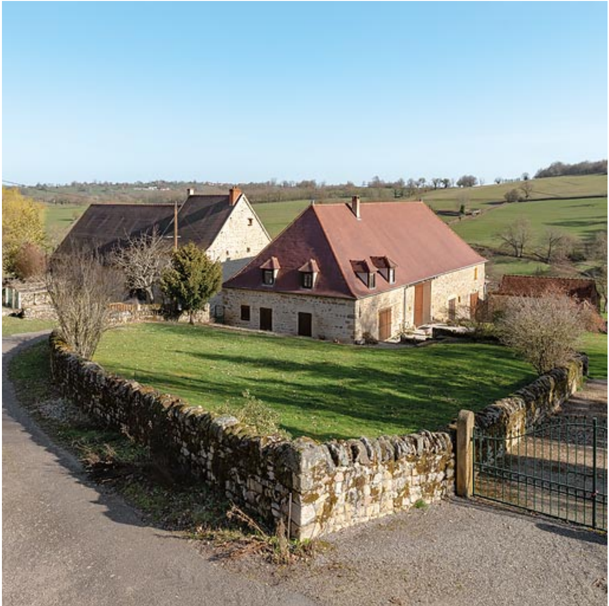
Vue de l'ancienne grange, qui comprenait une remise et deux étables, dont celle de gauche a été transformée en habitation.