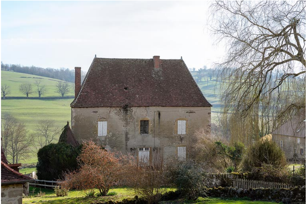
Vue de la façade antérieure de la maison.