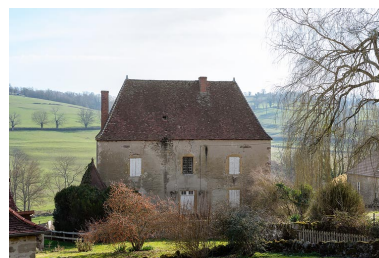
Vue de la façade antérieure de la maison. IVR26_20197100733NUC4A