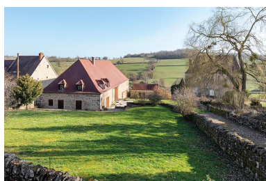
Vue de la ferme avec l'ancienne grange et l'allée menant à la demeure, qui sépare la cour de ferme du jardin potager.