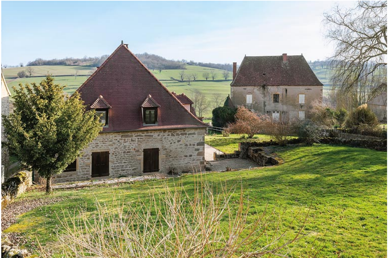
Vue de l'ancienne ferme d'embouche de la famille Mommessin. Au premier plan, l'ancienne grange. Au second plan, la maison construite en 1782.