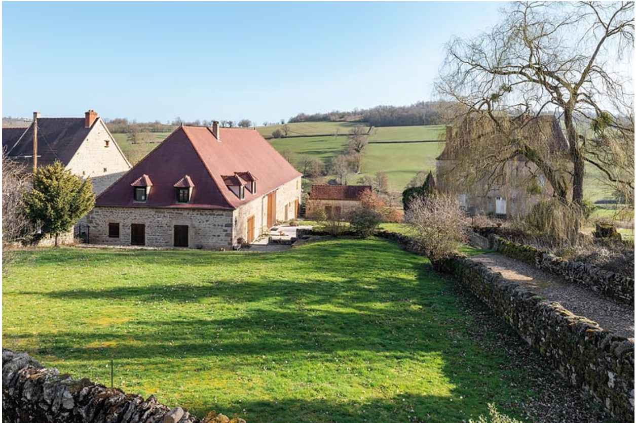
Vue de la ferme avec l'ancienne grange et l'allée menant à la demeure, qui sépare la cour de ferme du jardin potager.