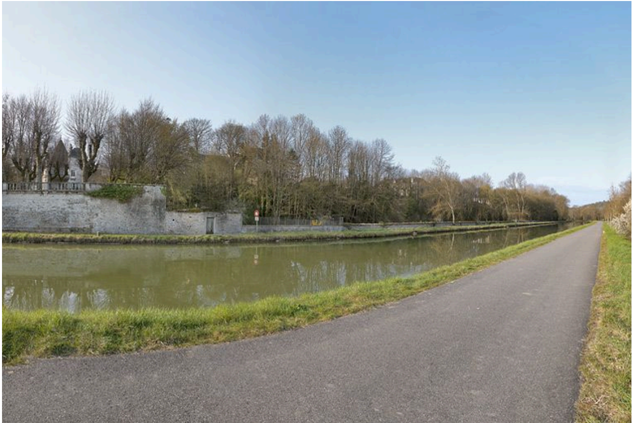
La traversée de Fleurey-sur-Ouche par le canal : enceinte du château de l'ancien prieuré Saint-Marcel et jardins des autres demeures.