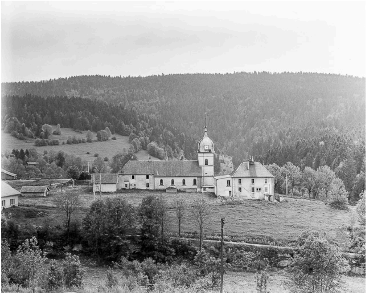
Façade latérale gauche.