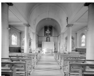
Intérieur : vue d'ensemble depuis l'entrée. IVR43_19752500687V