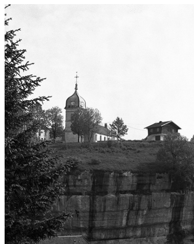
Façade antérieure et face latérale droite. IVR43_19752500648X