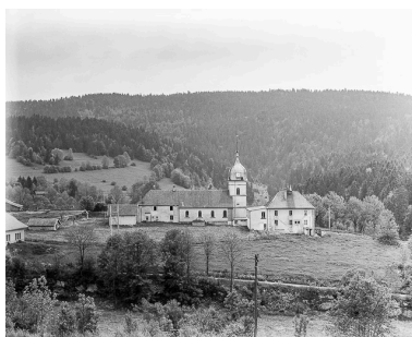
Façade latérale gauche. IVR43_19782500120V