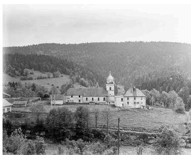
Façade latérale gauche. IVR43_19782500120V