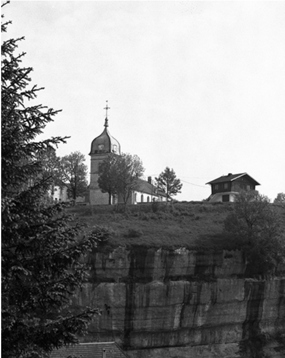
Façade antérieure et face latérale droite.