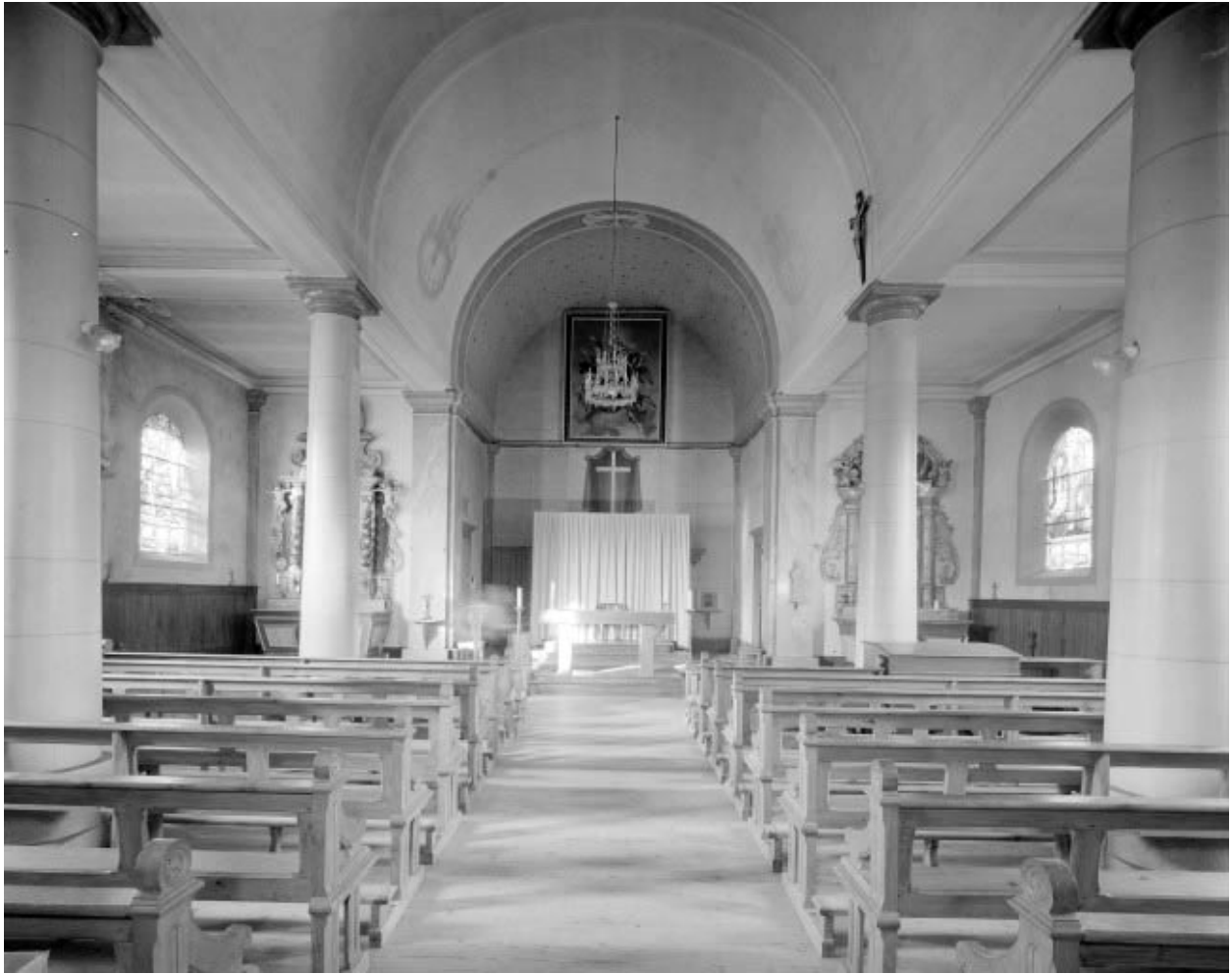
Intérieur : vue d'ensemble depuis l'entrée.