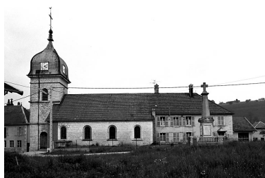
Façade latérale droite. IVR43_19752500647X