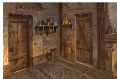
Intérieur rustique : portes dans l'angle côté jardin.