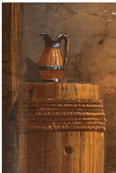
Intérieur rustique : pichet sur un tonneau (au lointain). IVR26_20257101084NUC4A

Intérieur rustique : angle côté jardin. IVR26_20257101083NUC4A