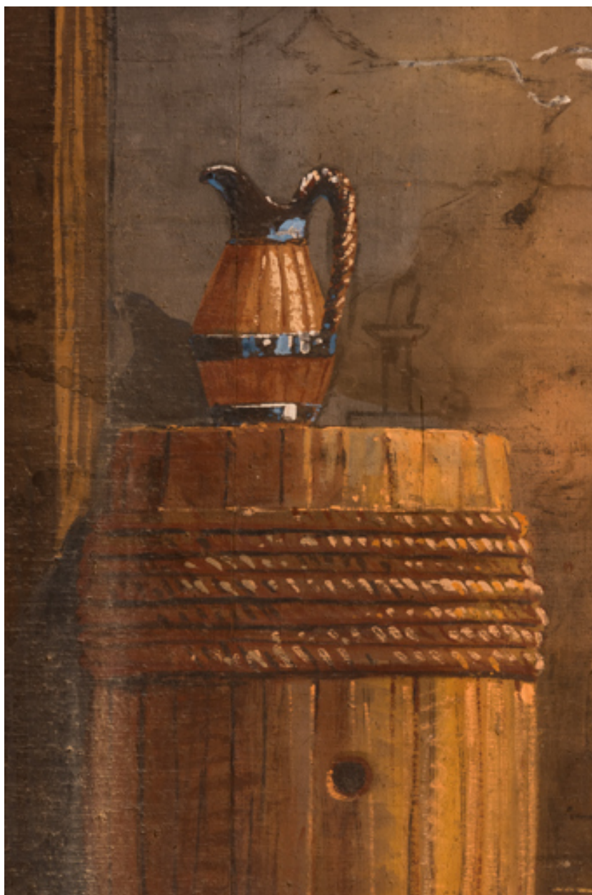
Intérieur rustique : pichet sur un tonneau (au lointain).