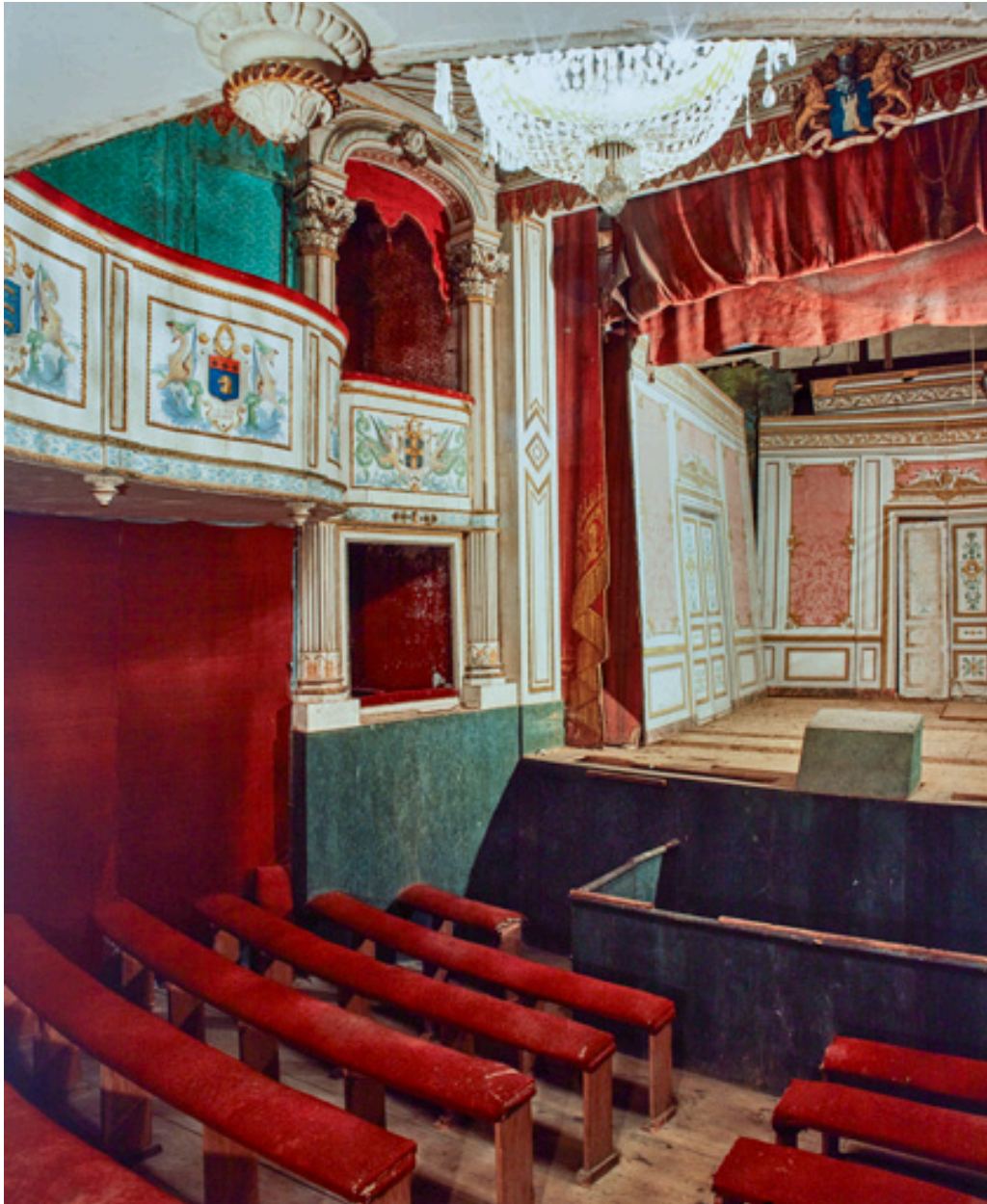
Salon riche disposé sur la scène en 1996, avant restauration.