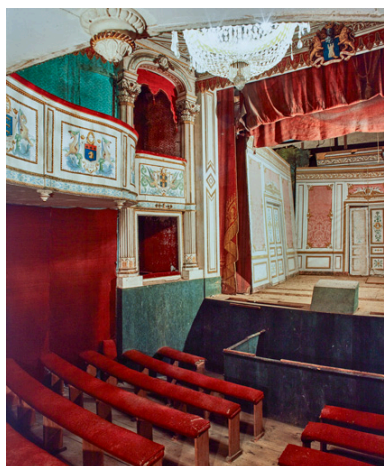
Salon riche disposé sur la scène en 1996, avant restauration.