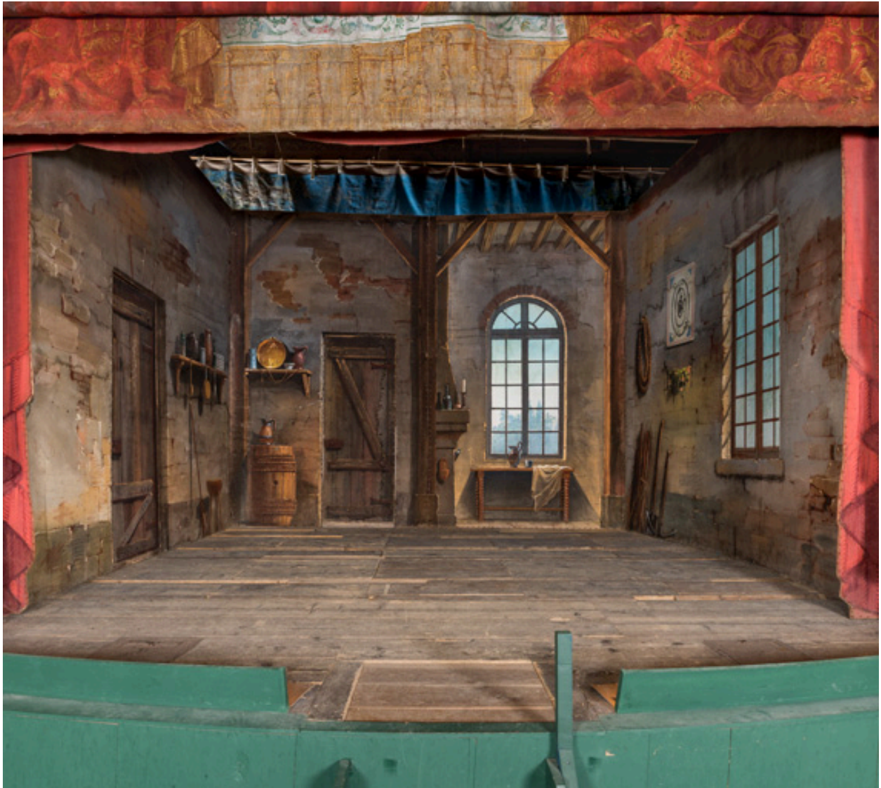
Intérieur rustique en place sur la scène.