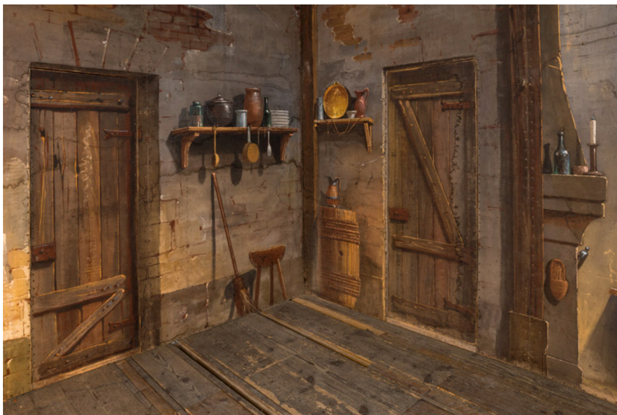
Intérieur rustique : portes dans l'angle côté jardin.