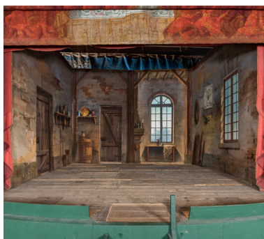
Intérieur rustique en place sur la scène. IVR26_20257101076NUC4A