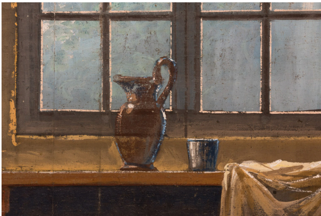
Intérieur rustique : pichet et timbale (au lointain).