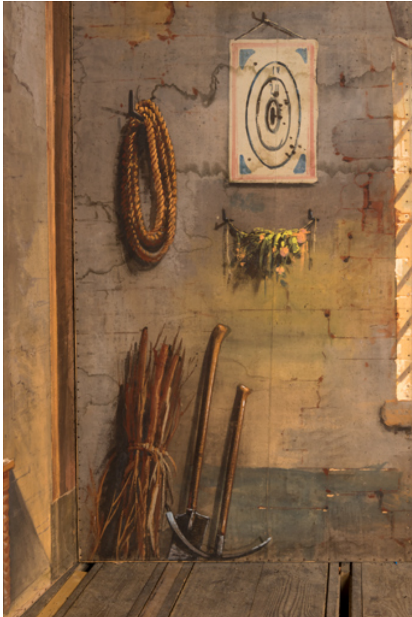
Intérieur rustique : fagot, pelle et pioche, rouleau de corde, cible et bouquet (côté cour).