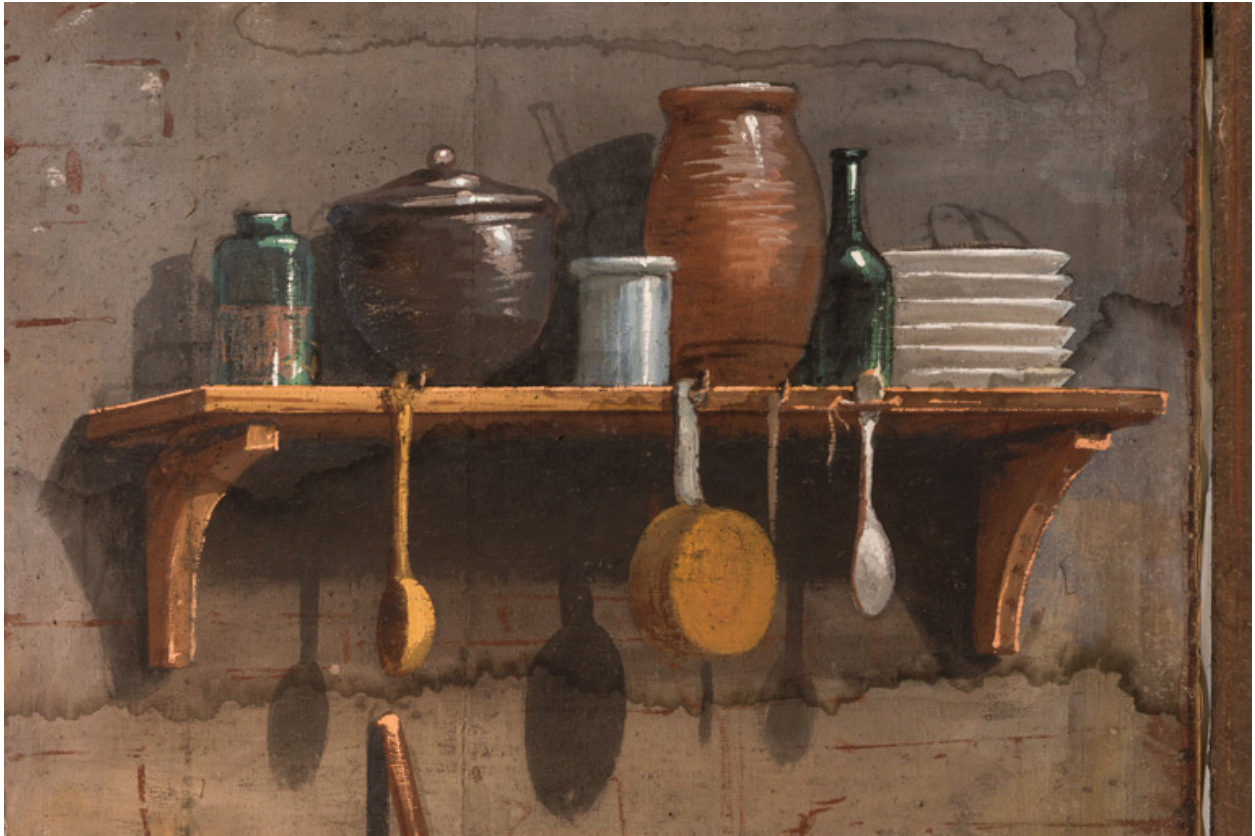
Intérieur rustique : instruments de cuisine et récipients (côté jardin).