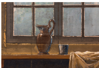
Intérieur rustique : pichet et timbale (au lointain). IVR26_20257101085NUC4A

Intérieur rustique : pichets et bassine (au lointain). IVR26_20257101082NUC4A