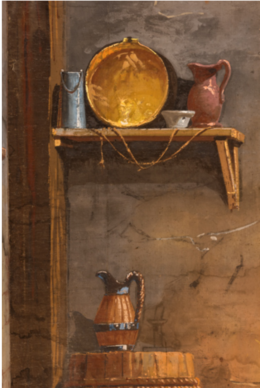
Intérieur rustique : pichets et bassine (au lointain).