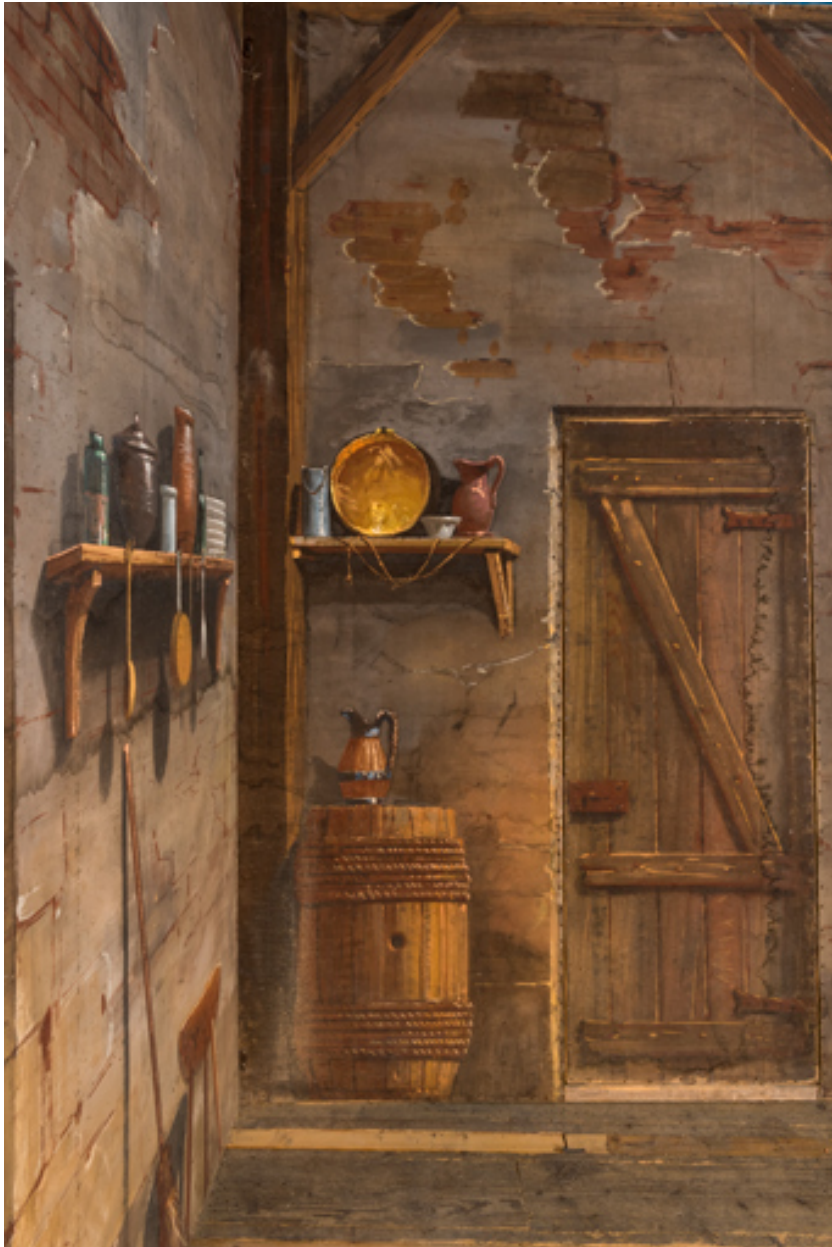
Intérieur rustique : angle côté jardin.