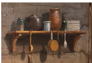
Intérieur rustique : instruments de cuisine et récipients (côté jardin). IVR26_20257101081NUC4A