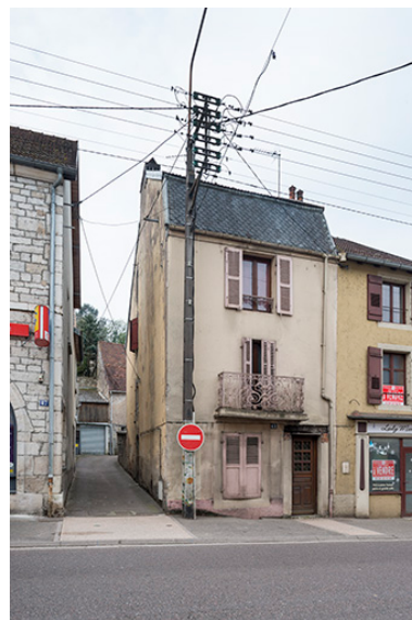
Ruelle allant vers la rue Saint-Antoine.