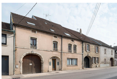
Anciennes fermes ayant conservées la travée d'accès (porte cochère). IVR43_20177000468NUC4A