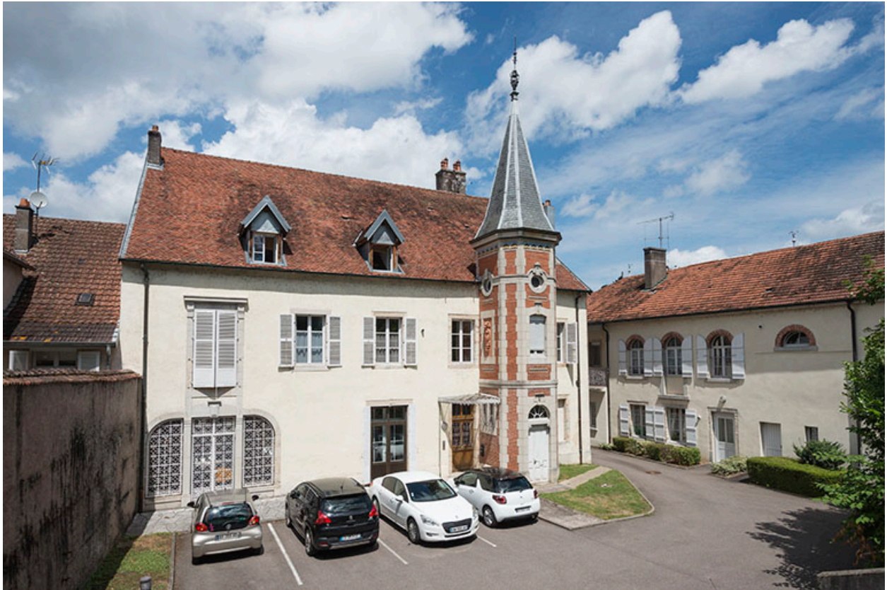
Façade postérieure de la demeure.