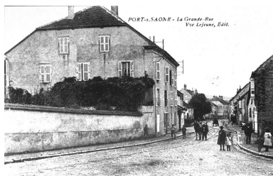
La Grande rue, carte postale. IVR43_20177000916NUC1A