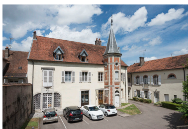
Façade postérieure de la demeure. IVR43_20177001031NUC4A