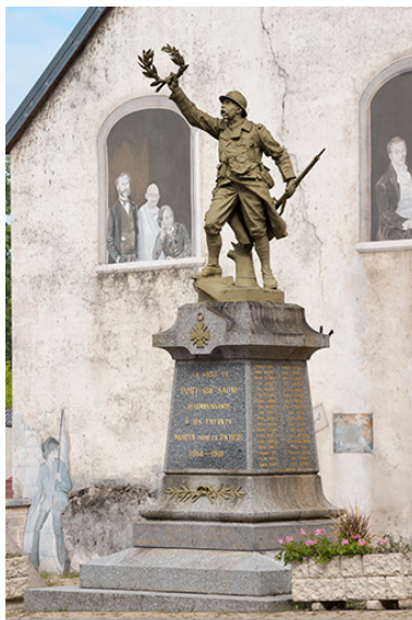
Monuments aux Morts. IVR43_20177001041NUC4A

IVR43_20177000490NUC4A