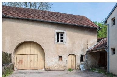
Grange située dans une cour. IVR43_20177000487NUC4A