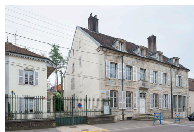
La demeure "Petit". IVR43_20177000465NUC4A