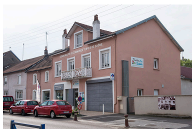
Ancienne station essence, actuellement bureaux de la communauté de communes. IVR43_20177000467NUC4A