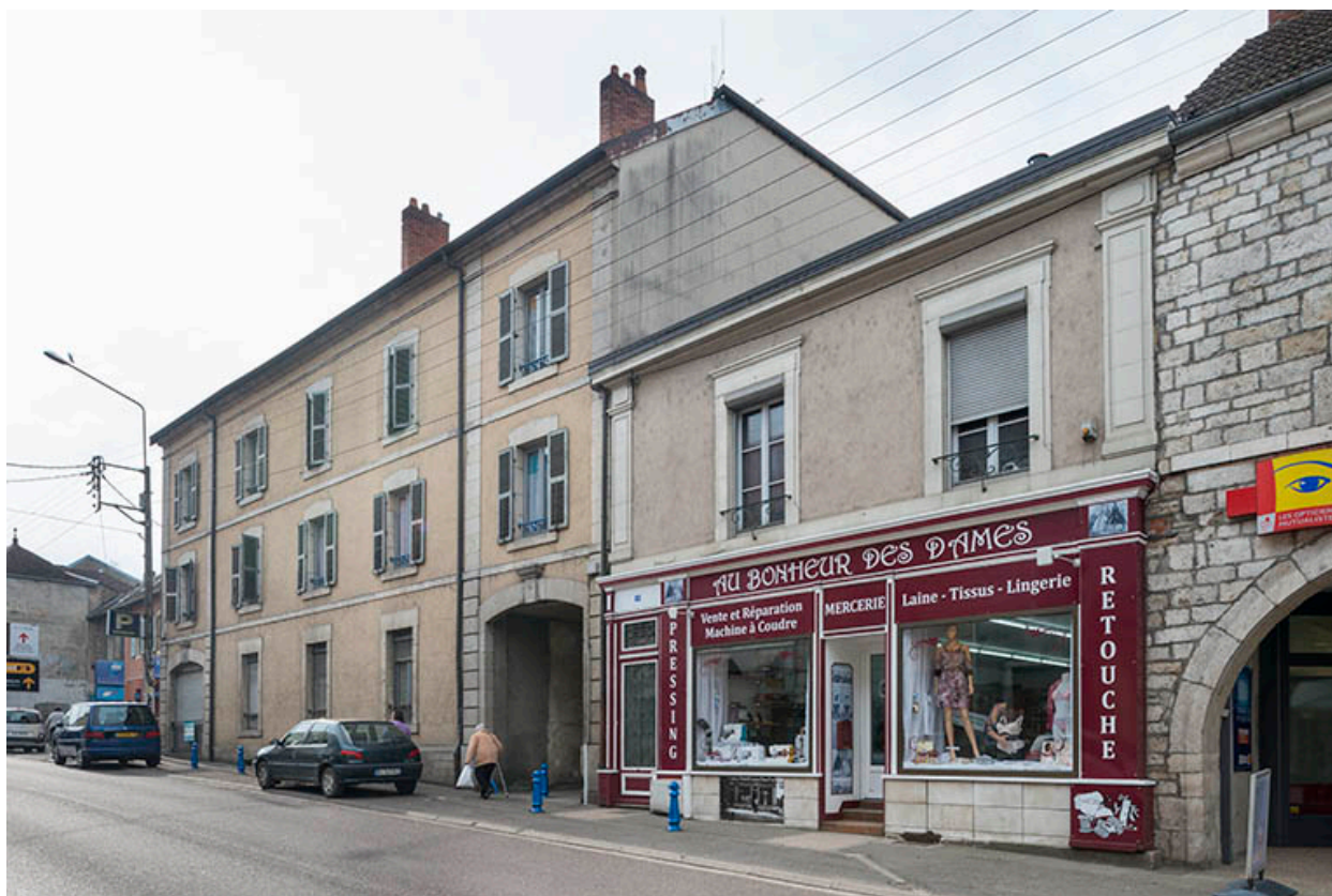
Commerces et anciens entrepôts "Madiot".