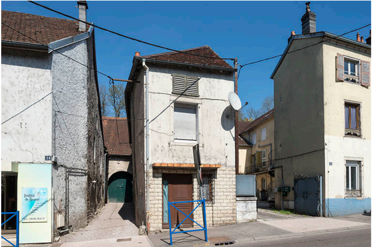
Grange en retrait de la rue.