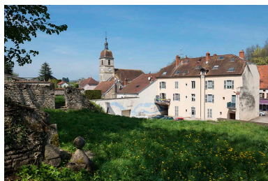
L'immeuble Madiot, façade postérieure. IVR43_20177000491NUC4A