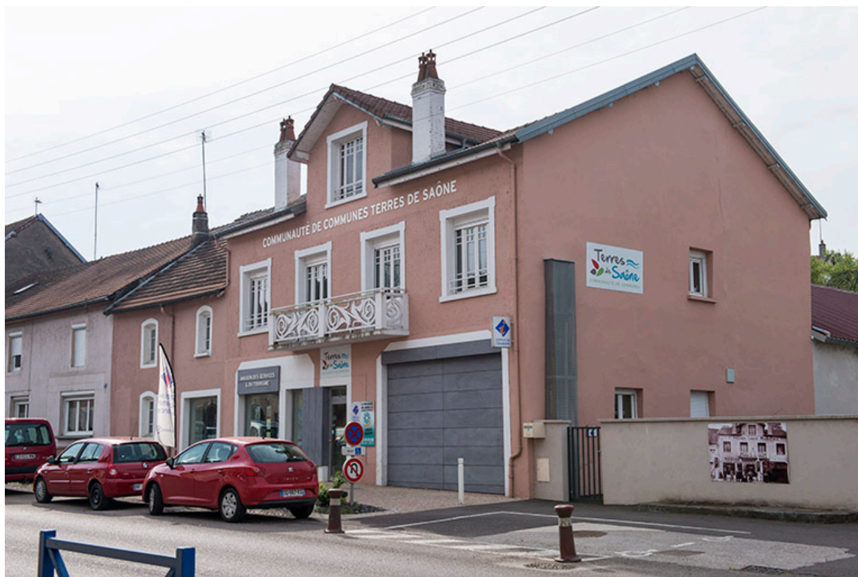
Ancienne station essence, actuellement bureaux de la communauté de communes.