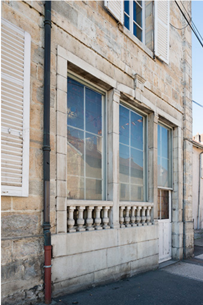
La façade réaménagée de la maison "Petit".