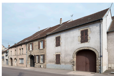
Alignement d'anciennes fermes.