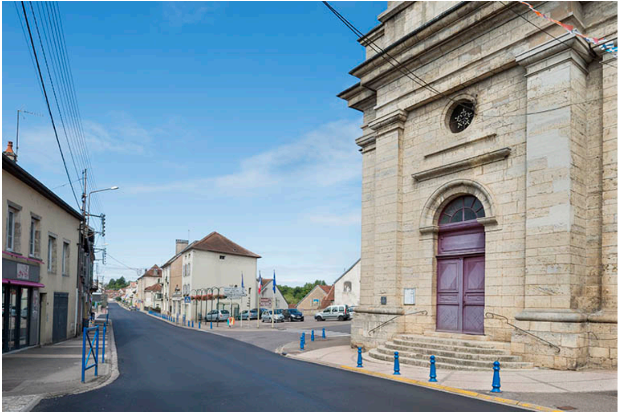
Le bas de la rue avec le portail de l'église Saint-Etienne.