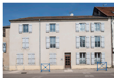
Immeuble à logements. IVR43_20177000485NUC4A