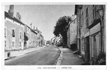
Vue de la rue, carte postale. IVR43_20177000917NUC1A