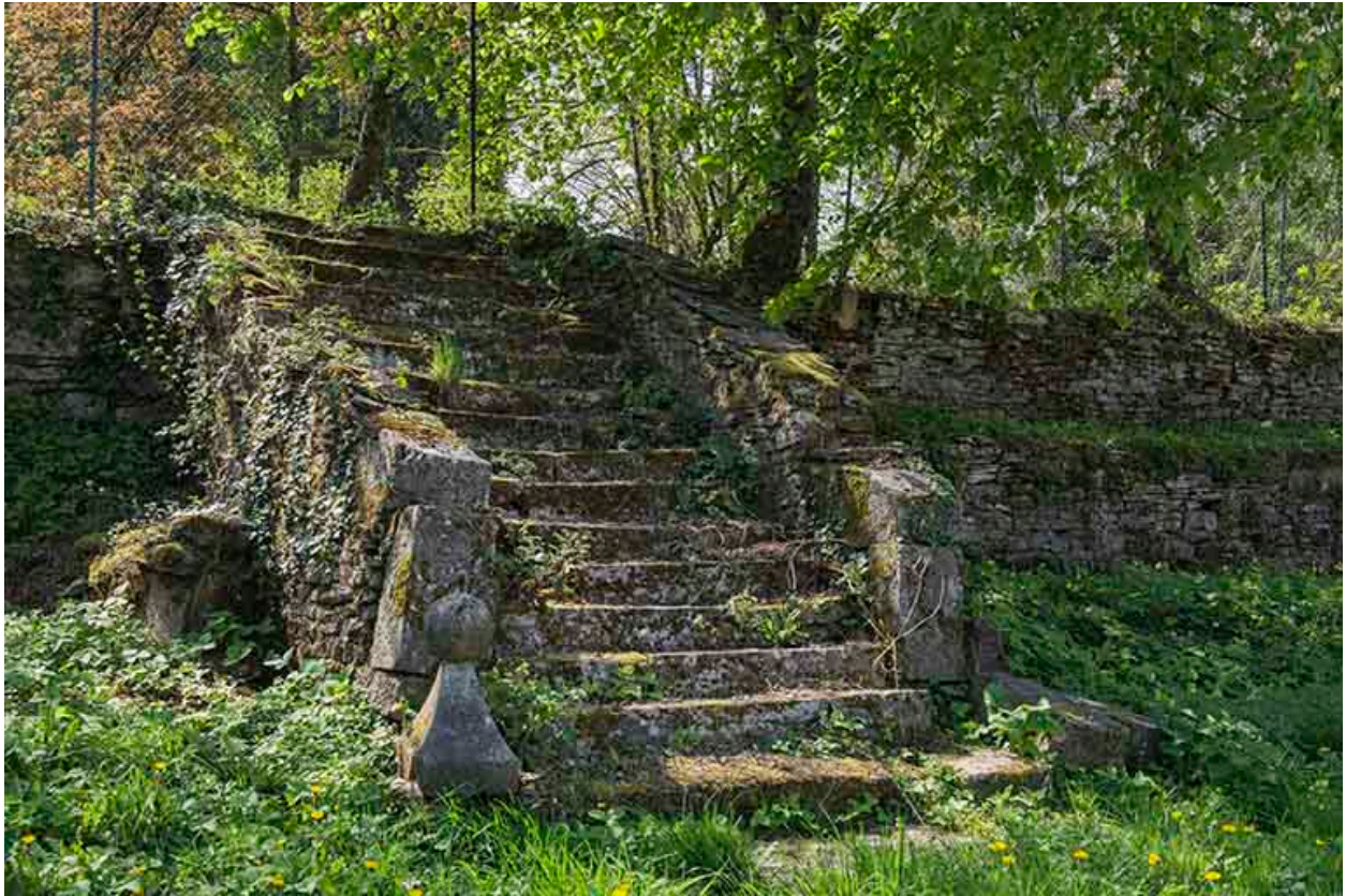
Escalier qui permettait de descendre du Tertre vers la rue principale.