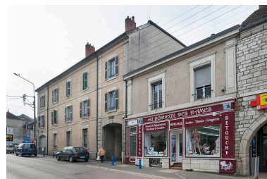
Commerces et anciens entrepôts "Madiot". IVR43_20177000460NUC4A