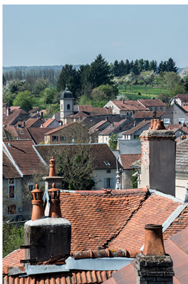
La rue depuis les toits.