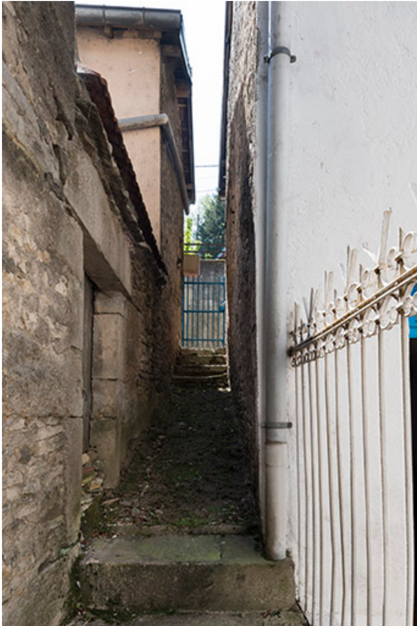
Passage piéton entre la rue Mitterrand et la rue Saint-Antoine.