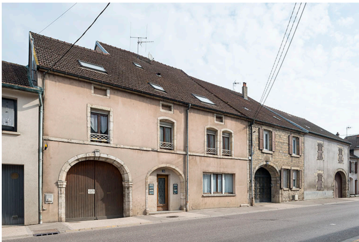
Anciennes fermes ayant conservées la travée d'accès (porte cochère).