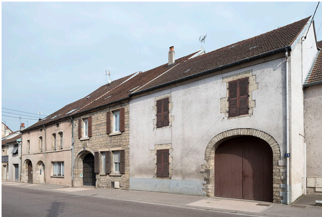
Alignement d'anciennes fermes.