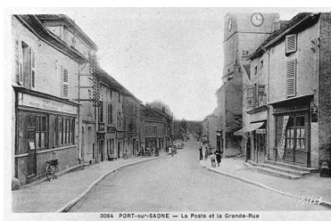
La Grande rue avec ses boutiques, carte postale. IVR43_20177000920NUC1A