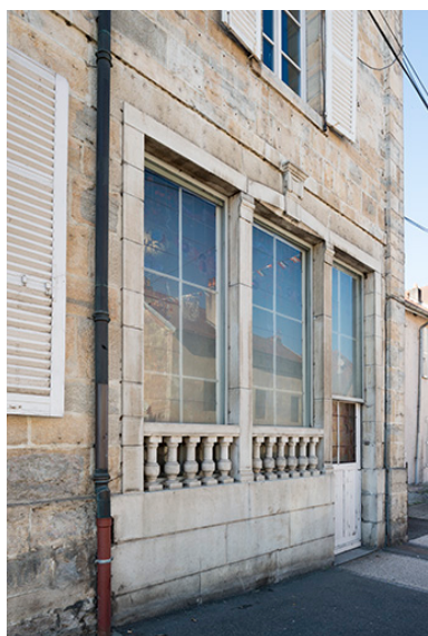
La façade réaménagée de la maison "Petit".