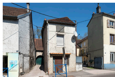
Grange en retrait de la rue. IVR43_20177000496NUC4A