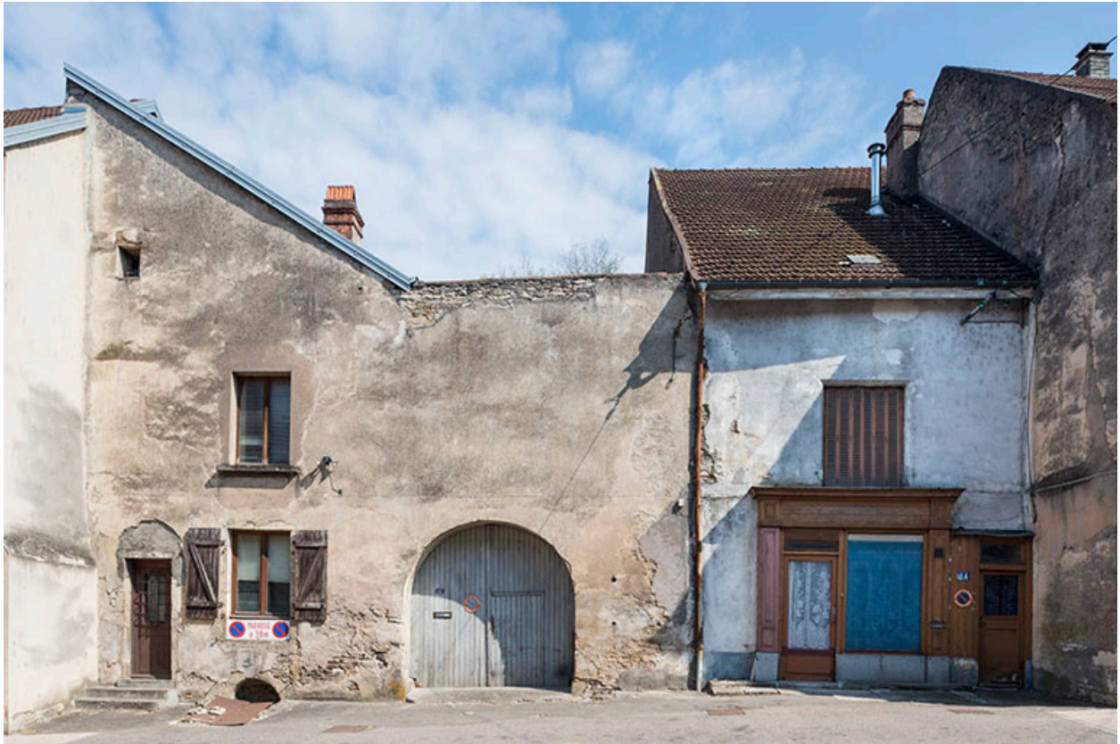
Cohabitation d'une ferme et d'une boutique, bas de la rue.