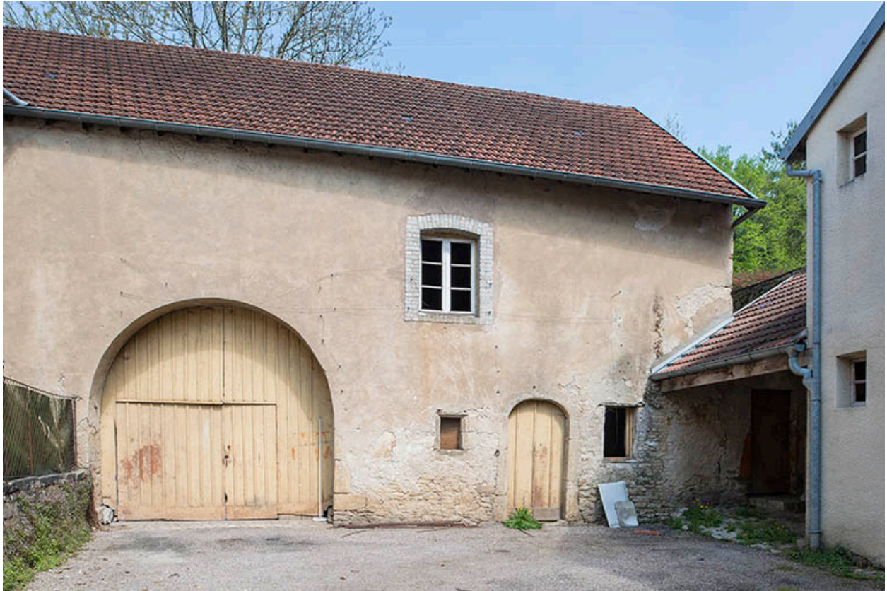
Grange située dans une cour.