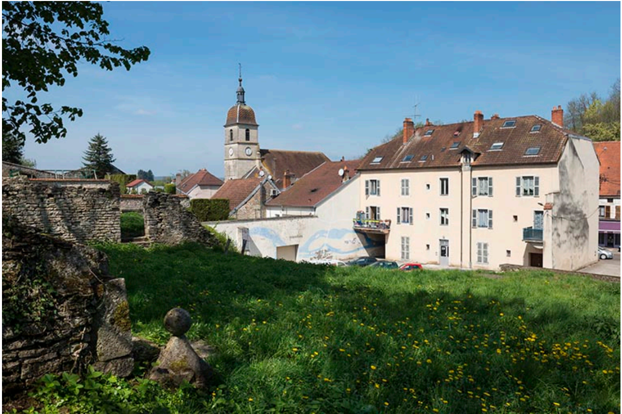
L'mmeuble Madiot, façade postérieure.