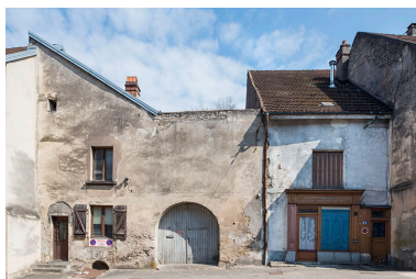
Cohabitation d'une ferme et d'une boutique, bas de la rue.