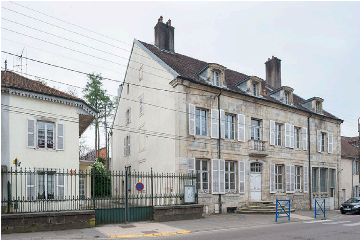
La demeure "Petit".