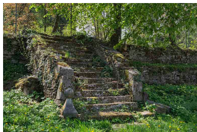
Escalier qui permettait de descendre du Tertre vers la rue principale.

Phot. Jérôme Mongreville IVR43_20177000490NUC4A