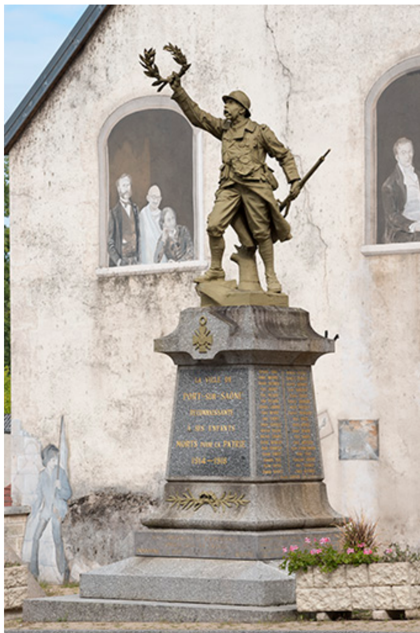
Monuments aux Morts.