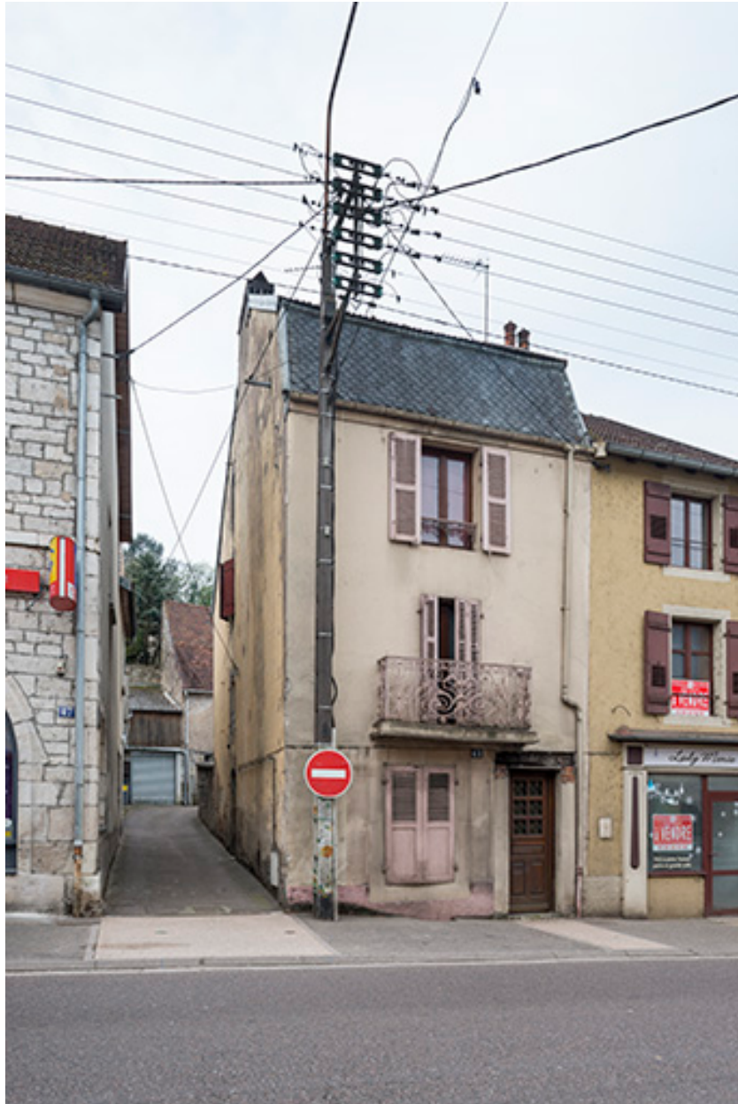
Ruelle allant vers la rue Saint-Antoine.