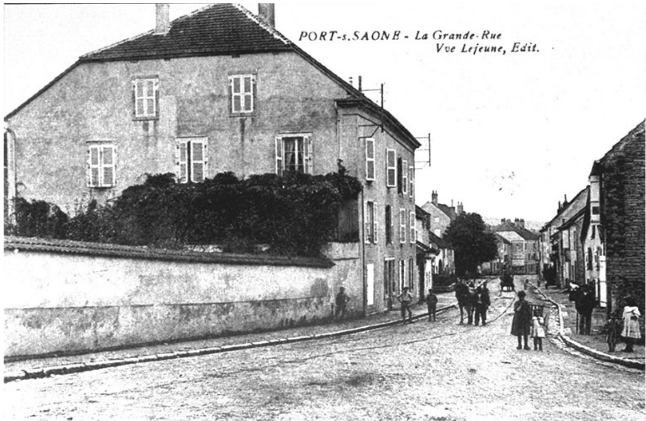
La Grande rue, carte postale.