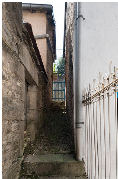
Passage piéton entre la rue Mitterrand et la rue Saint-Antoine. IVR43_20177000495NUC4A