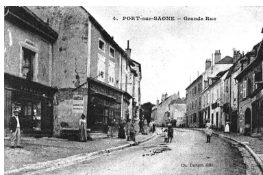
Devantures de commerces de la Grande Rue, carte postale. IVR43_20177000915NUC1A