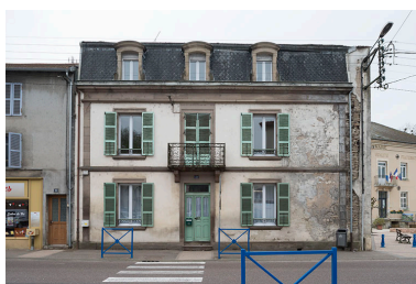
Maison "19e".