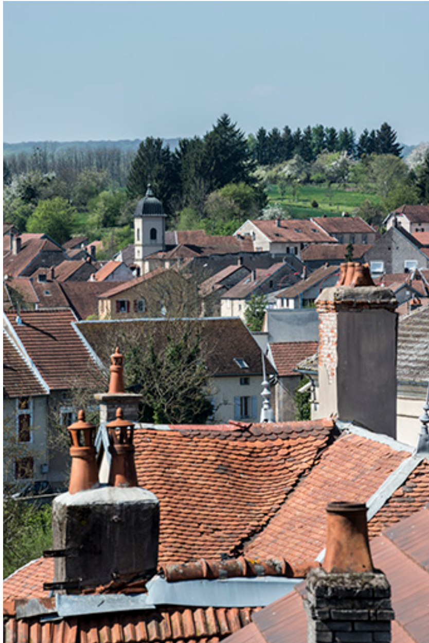
La rue depuis les toits.