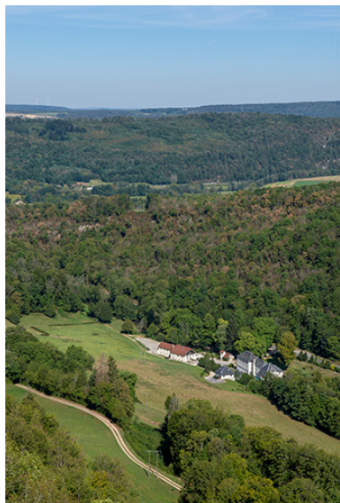
Vue du site depuis le belvédère au sud-est (lieu-dit : Chez Moine).

Phot. Jérôme Mongreville IVR43_20222500269NUC4A