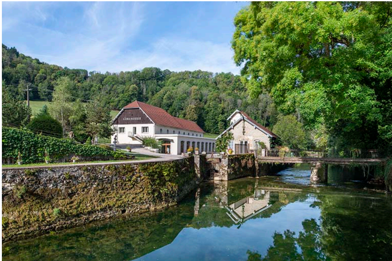
Rives du Cusancin, vue en direction de l'écurie-remise.