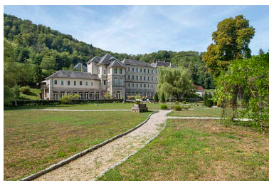
Parc, vue du nord-est en direction de l'ancien établissement thermal.

IVR43_20222500261NUC4A