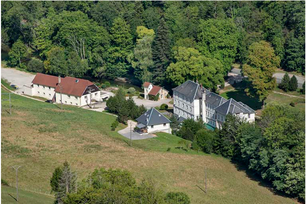
Vue d'ensemble, avec l'ancien établissement thermal (à droite) et l'actuelle salle des fêtes (à gauche).