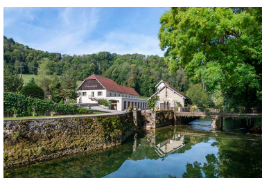
Rives du Cusancin, vue en direction de l'écurie-remise.

IVR43_20222500249NUC4A