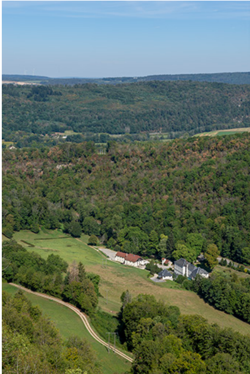
Vue du site depuis le belvédère au sud-est (lieu-dit : Chez Moine).