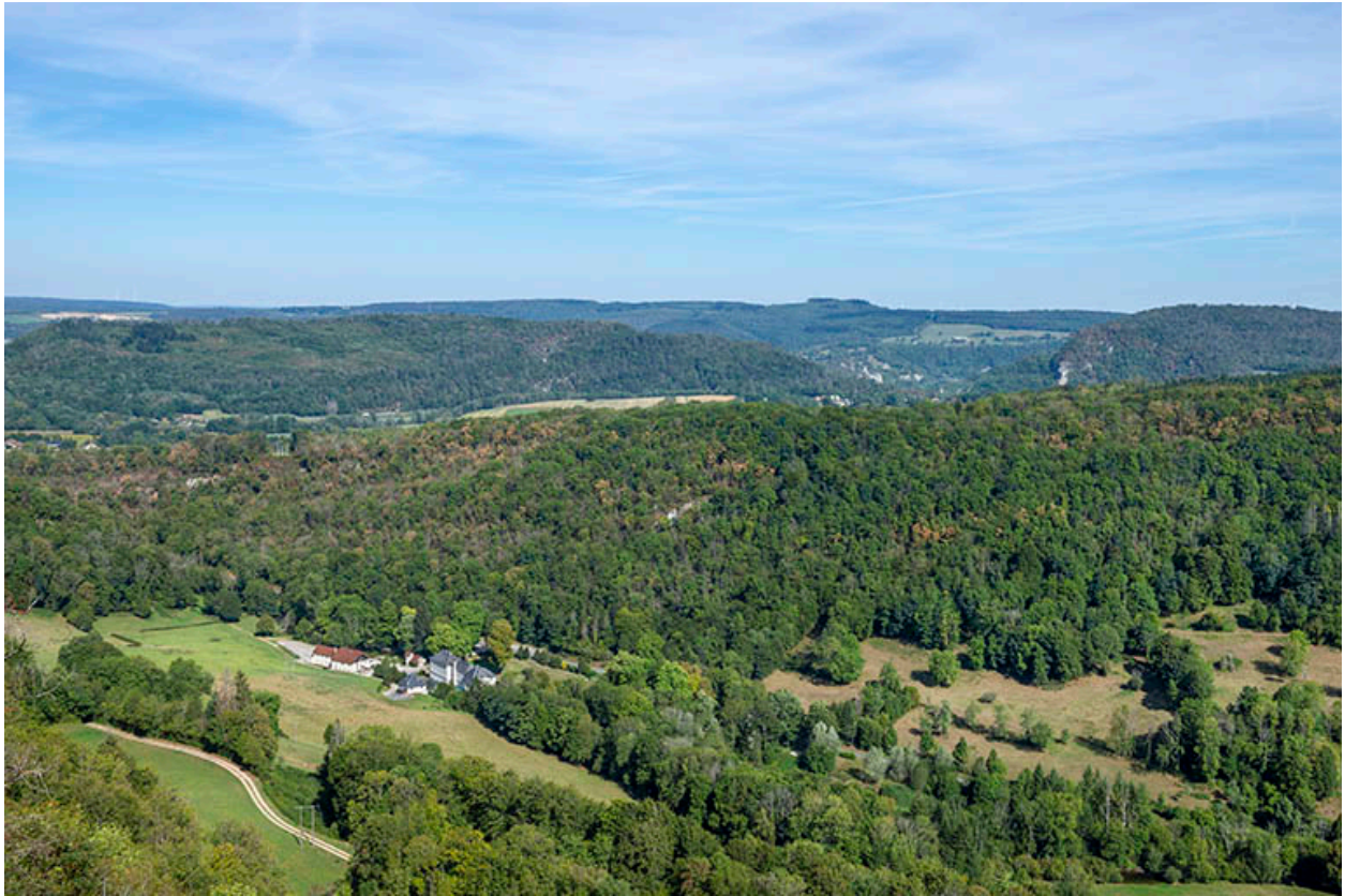
Vue du site depuis le belvédère au sud-est (lieu-dit : Chez Moine).