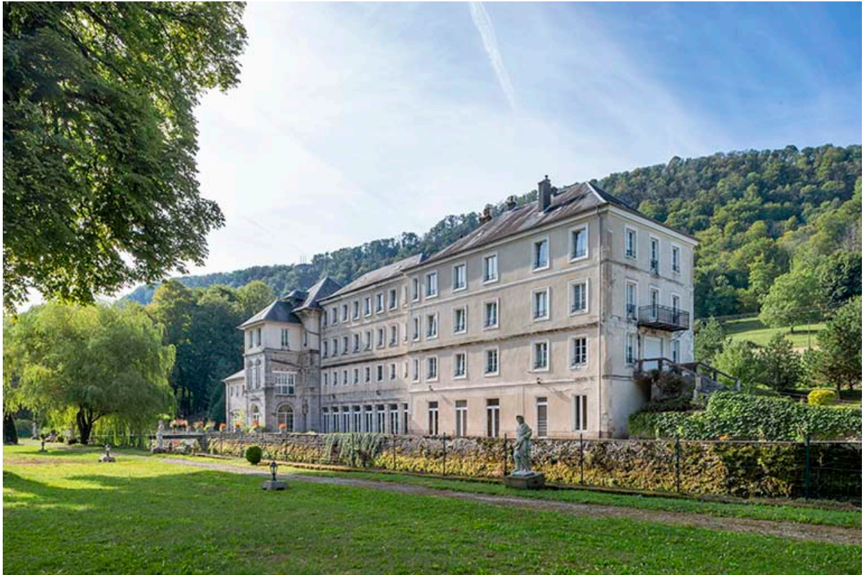
Parc, vue du nord-ouest en direction de l'ancien établissement thermal.