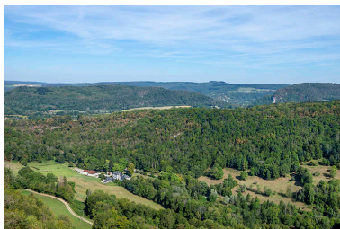
Vue du site depuis le belvédère au sud-est (lieu-dit : Chez Moine).

IVR43_20222500269NUC4A