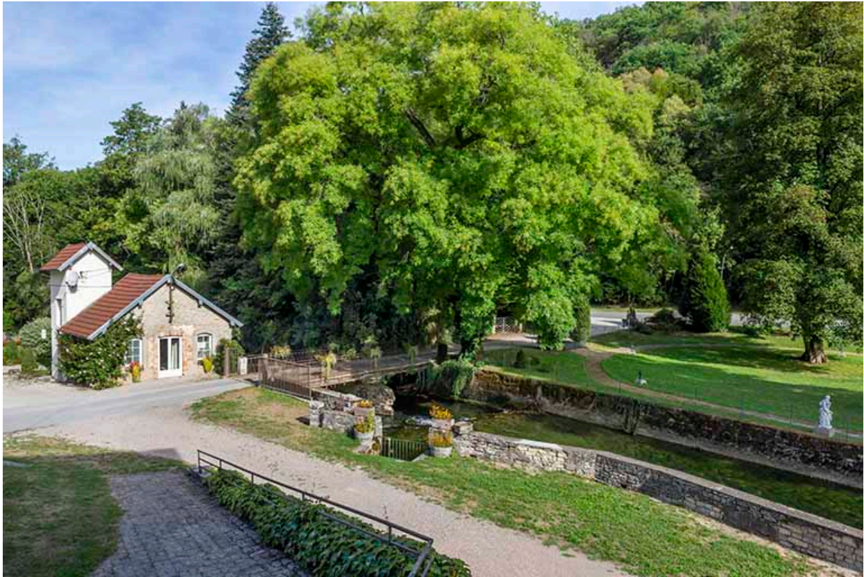
Pont franchissant le Cusancin permettant d'accéder au site, vue depuis l'ancien établissement thermal.