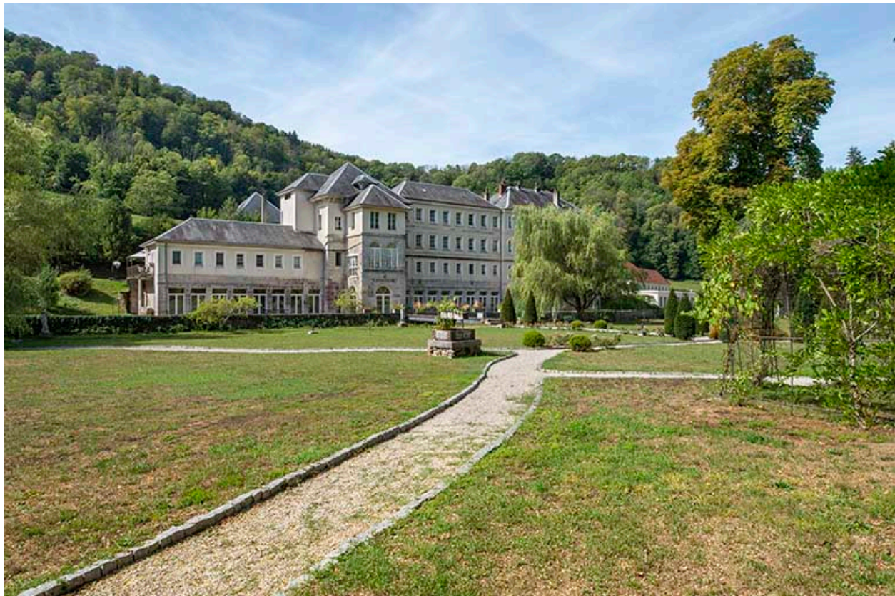
Parc, vue du nord-est en direction de l'ancien établissement thermal.