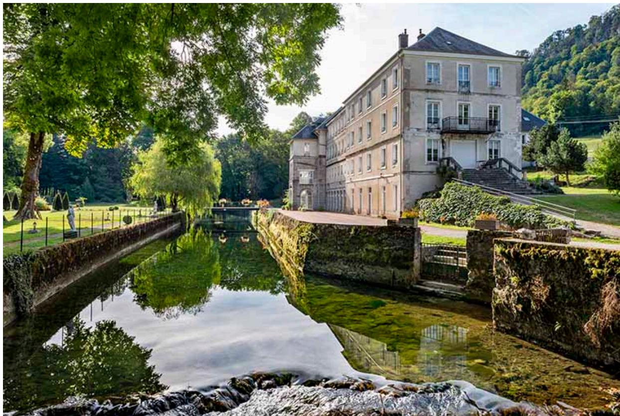
Rives du Cusancin, vue en direction de l'établissement thermal.