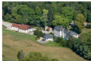
Vue d'ensemble, avec l'ancien établissement thermal (à droite) et l'actuelle salle des fêtes (à gauche).

IVR43_20222500270NUC4A