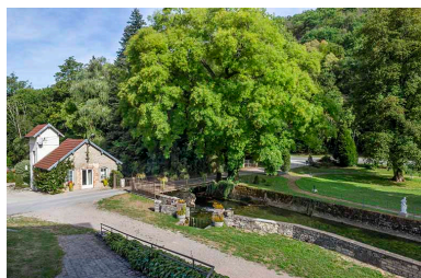
Pont franchissant le Cusancin permettant d'accéder au site, vue depuis l'ancien établissement thermal.

Phot. Jérôme Mongreville IVR43_20222500271NUC4A