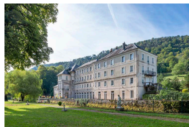
Parc, vue du nord-ouest en direction de l'ancien établissement thermal.

IVR43_20222500274NUC4A