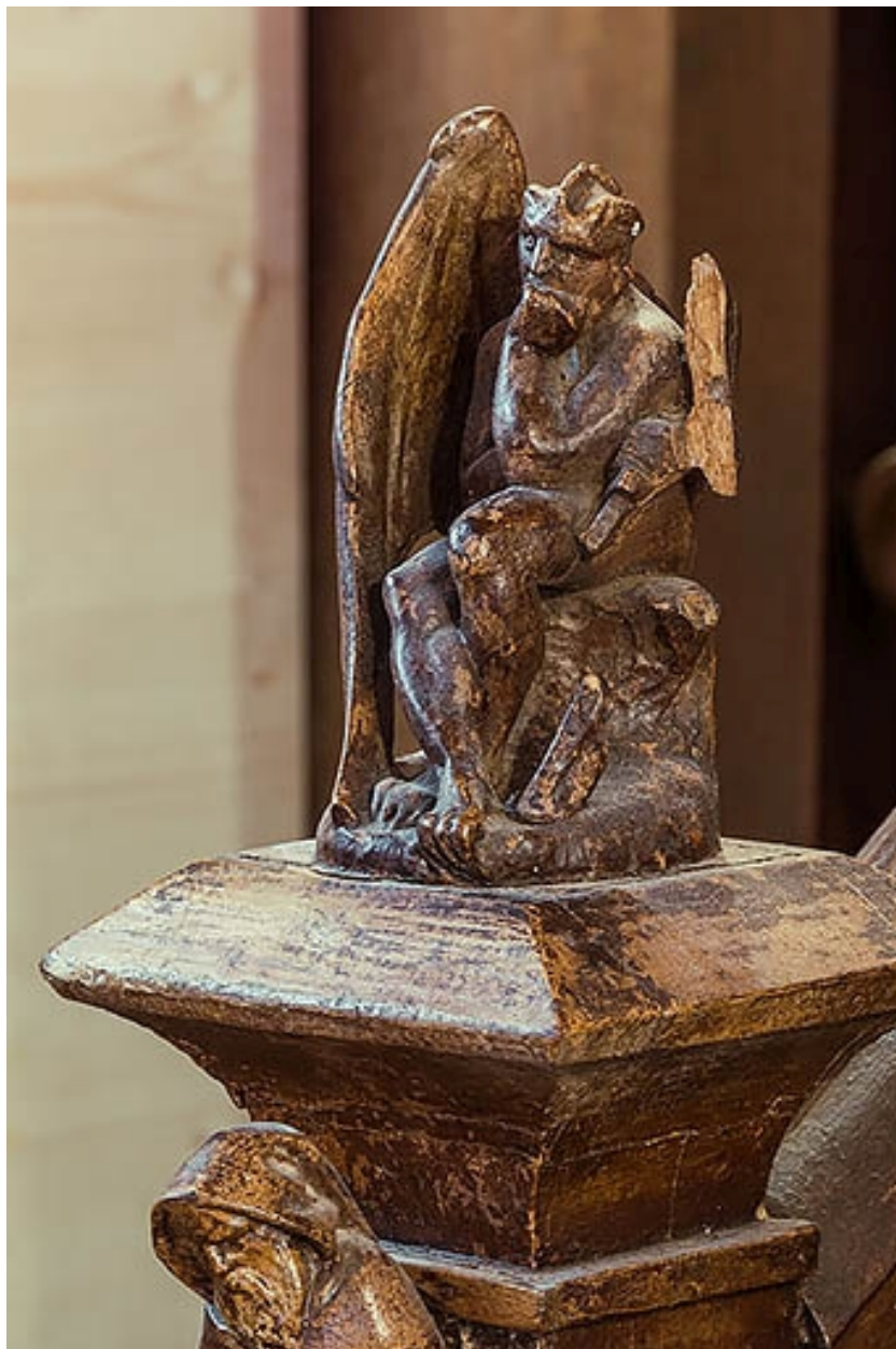
Escalier, rez-de-chaussée : départ de rampe avec statuette de diable.