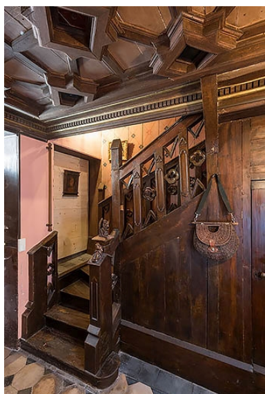
Vue d'ensemble au rez-de-chaussée. IVR26_20222100126NUC4A