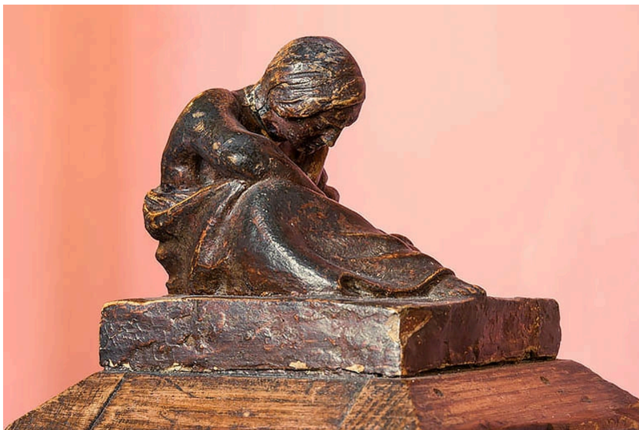
Escalier, 1er étage : statuette de femme, à l'extrémité de la rampe d'appui (vue rapprochée).