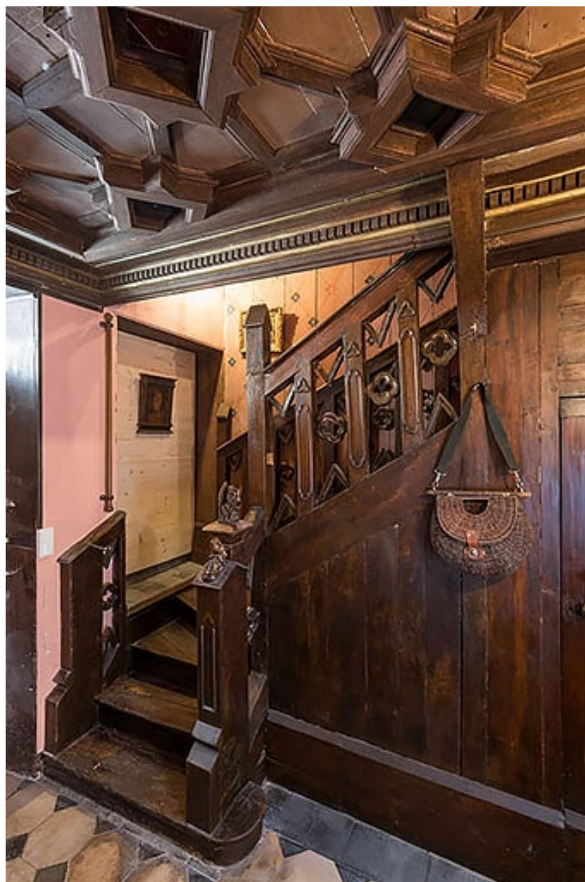
Vue d'ensemble au rez-de-chaussée.