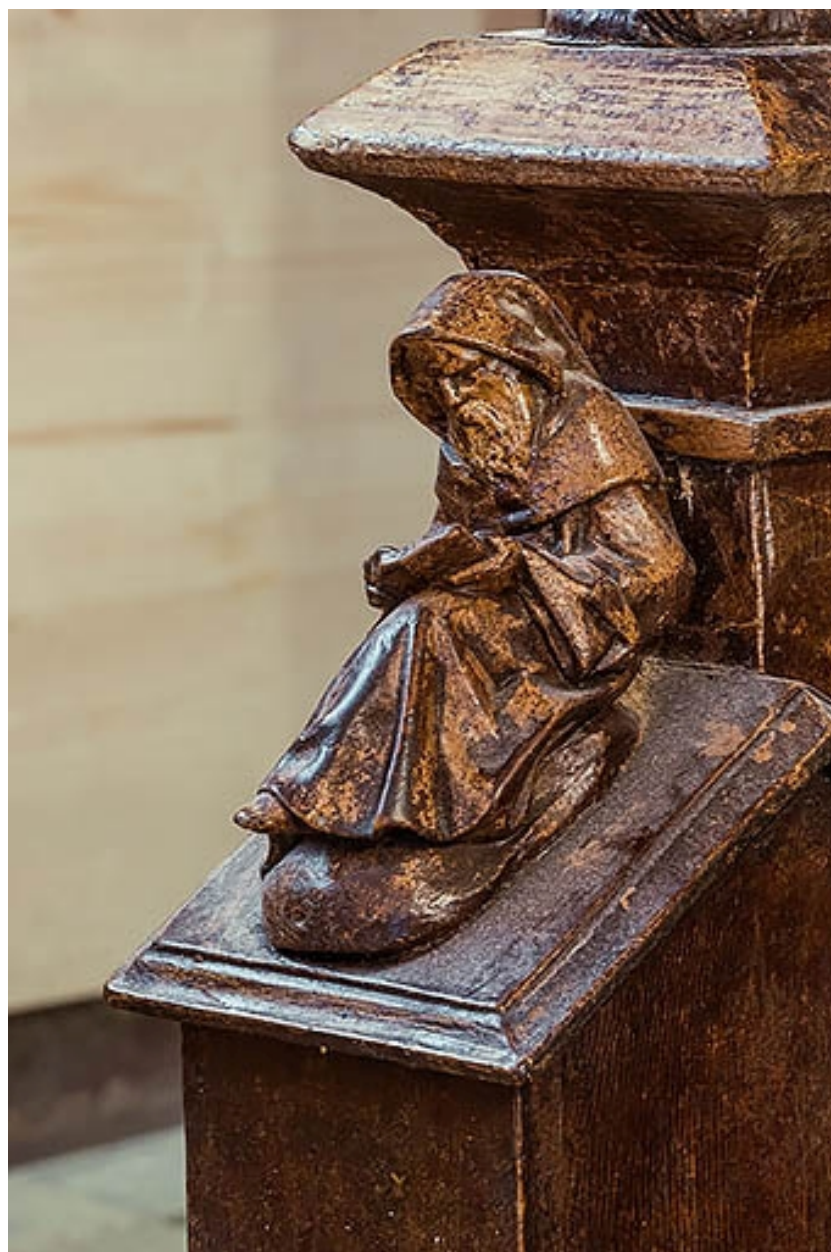
Escalier, rez-de-chaussée : départ de rampe avec statuette de moine lisant.