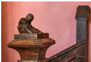
Escalier, 1er étage : statuette de femme, à l'extrémité de la rampe d'appui. IVR26_20222100130NUC4A

IVR26_20222100128NUC4A