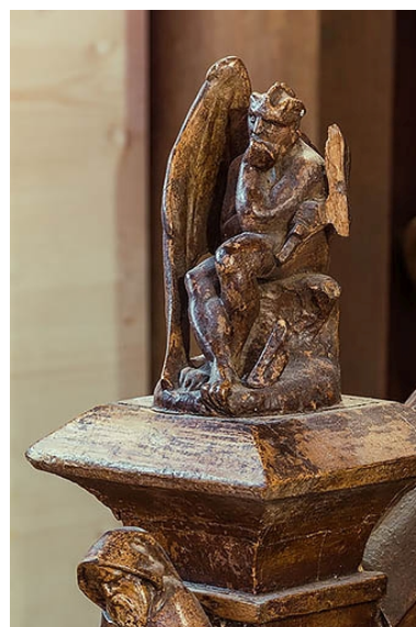
Escalier, rez-de-chaussée : départ de rampe avec statuette de diable.