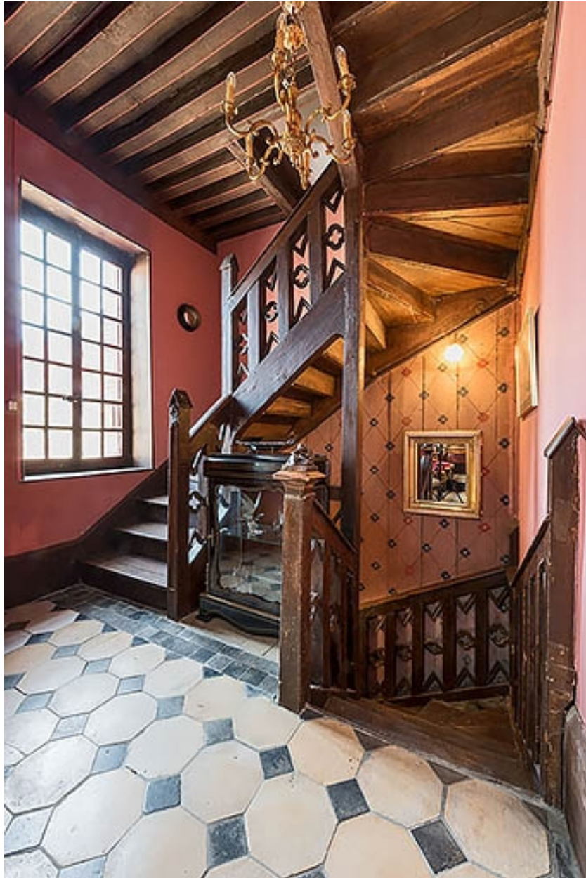
Vue d'ensemble, à l'étage.