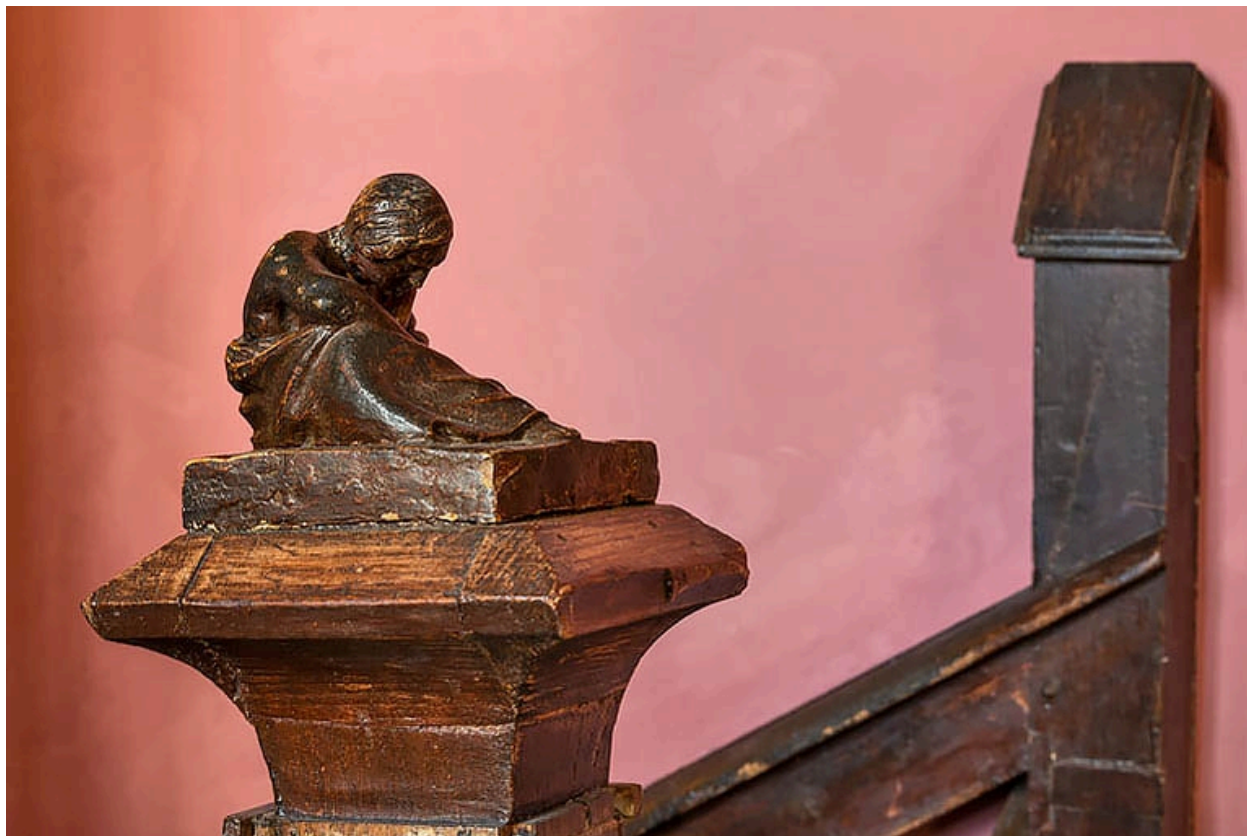
Escalier, 1er étage : statuette de femme, à l'extrémité de la rampe d'appui.