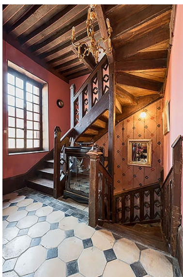
Vue d'ensemble, à l'étage. IVR26_20222100131NUC4A